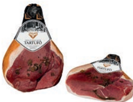
PRO900 PROSCIUTTO S/O AL TARTUFO