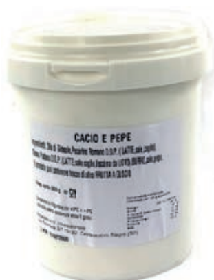
SLS400 SALSА CACIO E PEPE X 900 GR