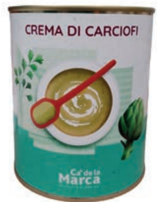
CRE300 CREMA DI CARCIOFI LATTA 4/4