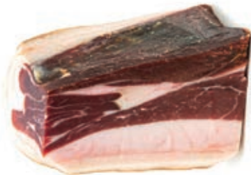
CIS100 PROSC."CINTA SENESE DOP" TRANCI 1,5KG CA