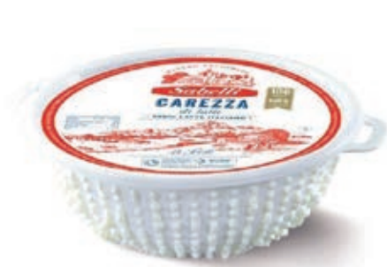
RIC100 RICOTTA CAREZZA DI LATTE IN COLAPASTA OI