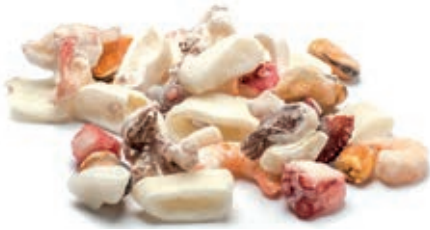
CPE700 INSALATA DI MARE SENZA SURIMI 12X800