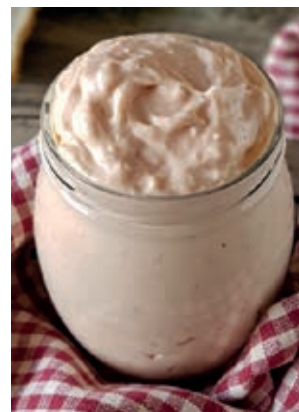
GAS210 SUGO AL SALMONE VASSOIO