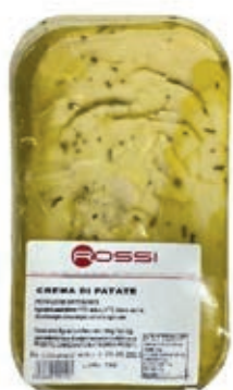
GAP155 CREMA DI PATATE VASSOIO