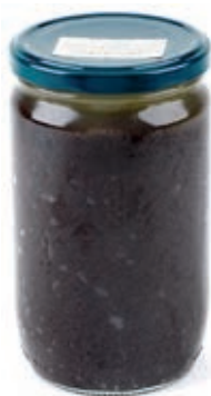
SAT200 SALSA AL TARTUFO GR 580