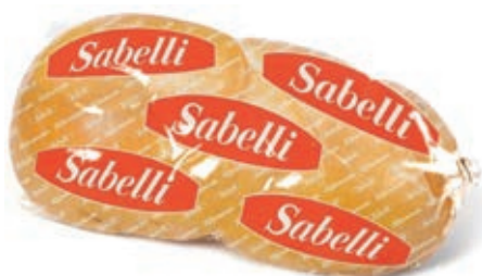
FOR310 TRECCIA AFFUMICATA