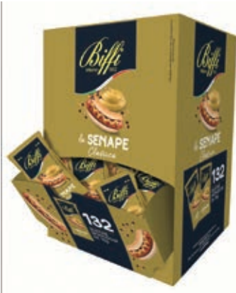
MND500 SENAPE GR 10 X 132