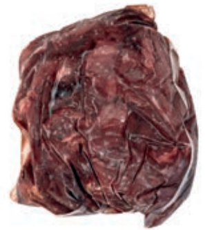
CAC102 POLPA EXTRA CAPRIOLO CONG. KG.2,5