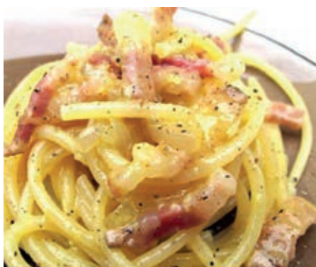
GAM630 PASTA ALLA CARBONARA MONOP.