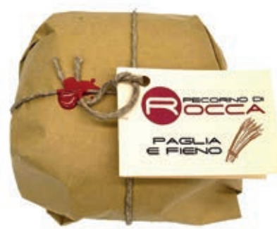
PEP420 PECORINO ROCCA SOTTO FIENO PALLOT.