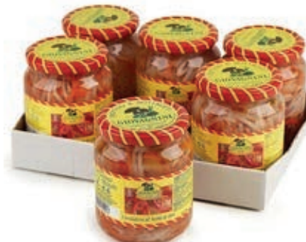
SOT910 INSALATINA CAPRICCIOSA 370 ML