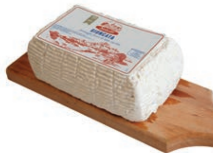
FOR450 GIUNCATA SABELLI KG 1.5