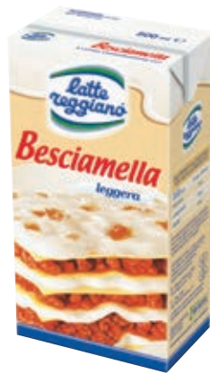
BES100 BESCIAPELLA ML 500