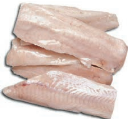
CPE140 MERLUZZO NORDICO 1000/UP KG 5 CONG