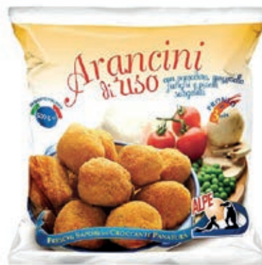
PAT990 ARANCINI 10X500 GR ALPE