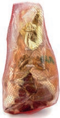
PAR300 PROSCIUTTO PARMA S/O ADDOBBO ROSSI