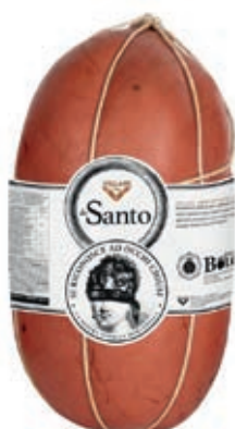
MOS700 MORTADELLA SANTO VN X 10/12 SV