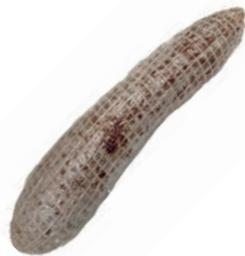
CIN205 SALAME DI CINGHIALE AL 51% 2KG CA SV