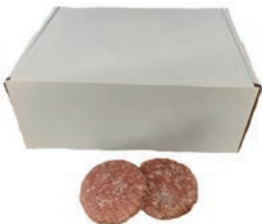
HAM620 HAMBURGER RISTOR. B.A. GELO 100 GR 12 PZ