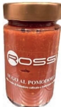
GIA400 SUGO AL POMODORO BOTTIGLIA GR.260 X 6