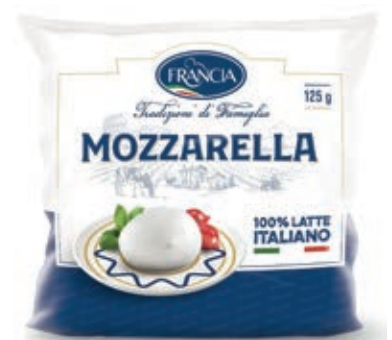
FDL210 MOZZ. FDL FRANCIA GR 125 O.I.