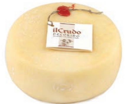
PEF410 PECORINO LATTE CRUDO FRESCO ST 20