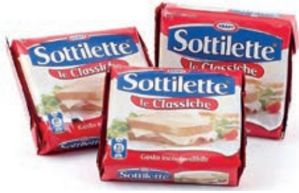
KRA200 SOTTILETTE GR 200