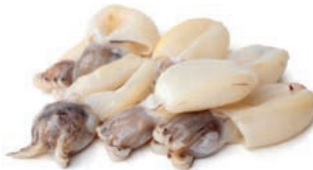
CPE475 SEPIA IND 8/12 IQF GR 750