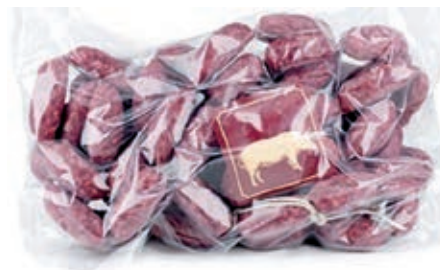
NAP710 SALSICCIA STAGIONATA ATM KG 1 O.I.