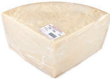
GRP400 GRANA PADANO CONF. 1/8 S.V.