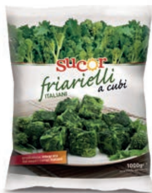
VER820 FRIARELLI CUBI CONG.