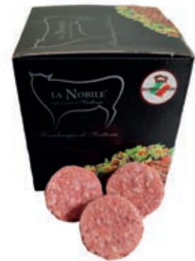
HAM610 MINIBURGER CONG.SCOTT."LA NOBILE" 20PZ