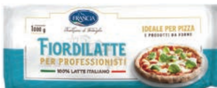
MOZ400 FIORDIL. FRANCIA ITALIA FILONE