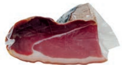
SGE500 SGAMBATO A 1/4 SV PEPE