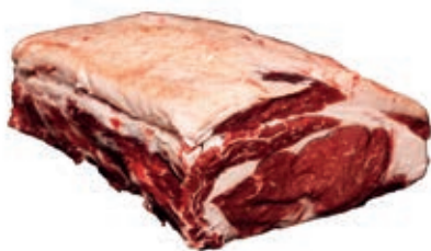
VIT420 ENTRECOTE B.A. SCOTTONA LA NOBILE CON OSSO (4COSTE) SV