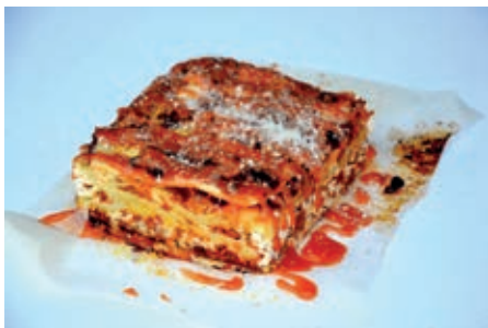
GAM310 LASAGNE AL RAGU' MONOP.