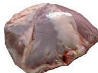
VIT820 SCAMONE DI VITELLA DA LATTE OLANDA