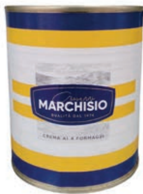
CRE200 CREMA AI 4 FORMAGGI LATTA 4/4