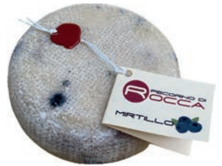
PEA600 PECORINO ROCCA MIRTILLO ST 16