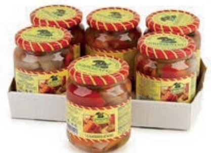
SOT900 GIARDINIERA 370 ML