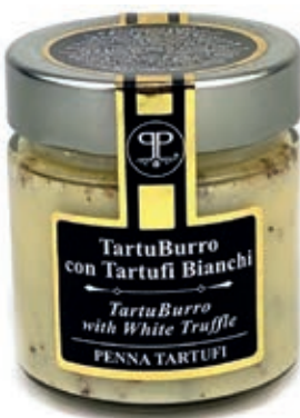
TAR600 BURRO E TARTUFO BIANCO 5% SPEC. GAST. GR 200