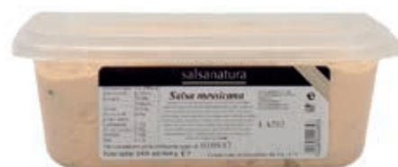
SLS380 SALSА MESSICANA 3G KG 1