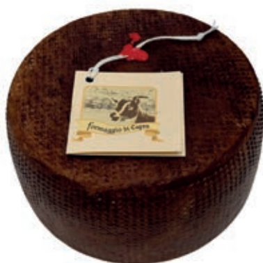
PEC100 FORMAGGIO STAG. LATTE CAPRA (60 GG) O.I.