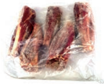
CEC400 CERVO STINCO C/OSSO CONG.