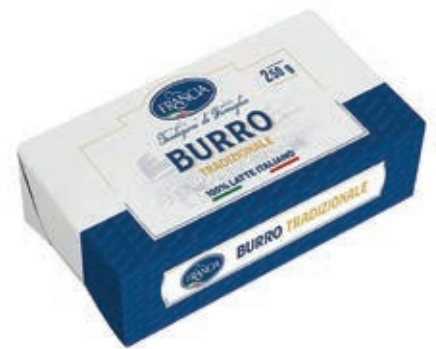
BUR110 BURRO FRANCIA 250 GR O.I.