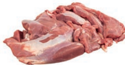
CAC100 CAPRIOLO POLPA 5 KG CONG.