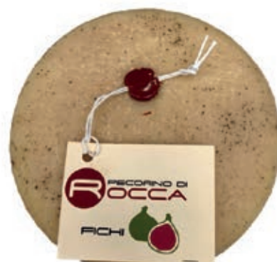
PEA350 PECORINO ROCCA CON FICHI