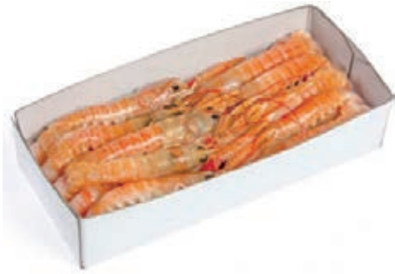
CPE280 SCAMPI 17/20 DANIMARCA GR 750