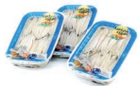
MAR630 FIL. ALICI MARINATE VASCA 200 GR.