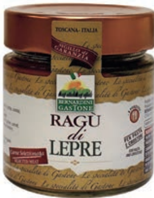
RAG220 RAGÙ DI LEPRE 220 GR O.I.