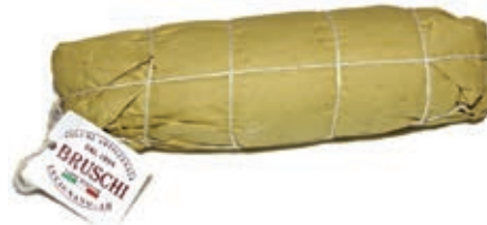
CAP220 CAPOCOLLO FINOCCHIO BRUSCHI