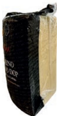
ROM300 ROMANO DOP 1/8 BIANCO