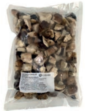
POR407 PORCINO CUBO MK KG 1 ROSSI CONG.