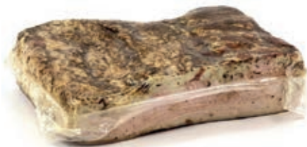
LAR200 LARDO A METÀ KG 5/6 SV