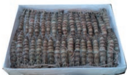
CPE237 MAZZANCOLLA INT. 40/50 GR 800