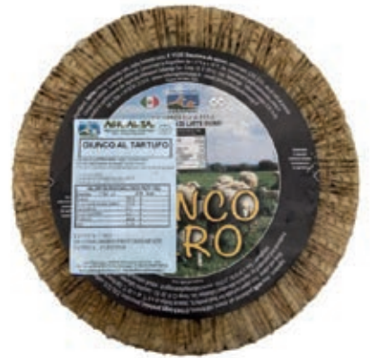
PES410 PECORINO CANESTRATO X 5 AL TARTUFO O.I.