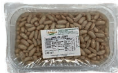
GAV505 FAGIOLI GR 1200