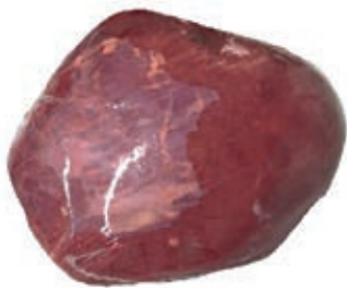
VIT115 FESA SENZA COPERTINA SV SCOTTONA