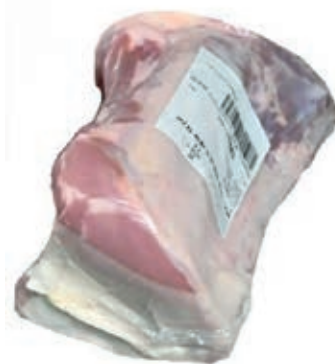
VIT805 CARRE DI VITELLA DA LATTE OLANDA 8 COST