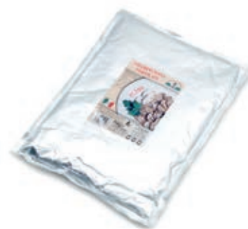
FUG410 FUNGHI CHAMPIGNON TRIF. BUSTA 1700 GR