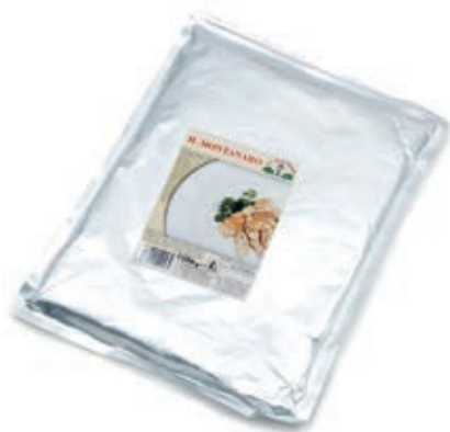
FUG320 FUNGHI IL MONTANARO BUSTA GR 1500