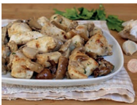
GAB130 PETTO POLLO PORCINI VASSOIO