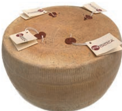
PER100 PECORINO ROCCA GRAN RISER. GIG.20 KG C.A