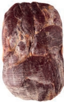
SGE300 SGAMBATO MATTONELLA ROSSI