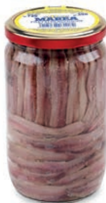
ACC210 FILETTI ACCIUGA O/S GR 700