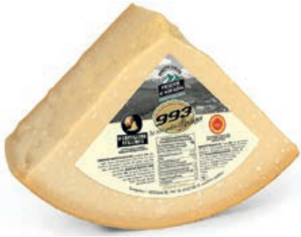
GPR410 PARM. REGG. 24 M. CAS. 993 1/8