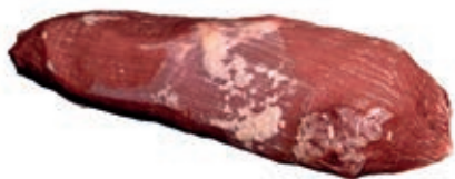
VIT470 MAGATELLO SCOTTONA "LA NOBILE"