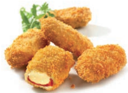
PAT940 RED HOT JALAPENOS KG 1