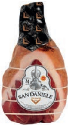
SAN200 PROSCIUTTO S.DANIELE S/ O24 MESI ADD.8,5+