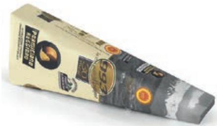
GPR620 PARM. REGG. 30 M. CAS. 993 GR 250 INCART