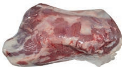
VIT120 SOTTOFESA SQUADRATA SV SCOTTONA