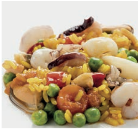
CPE705 PAELLA KG 1