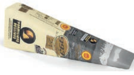
GPR630 PARM. REGG. 24 M. CAS. 993 GR 250 INCART