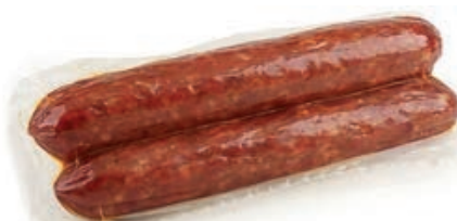
NAP310 SALSICCIA PICCANTE PELATA SV X 3 PZ