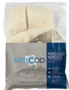
CPE150 MERLUZZO NORDICO 180/220 KG 1 CONG