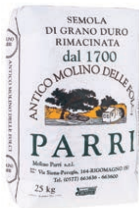
FAR220 SEMOLA RIMACINATA KG 25