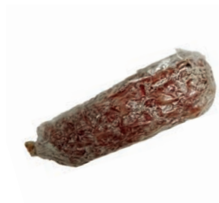
FIN100 SBRICIOLONA DI MAIALE RUSTICO 250 GR SV