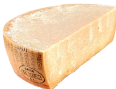
GPR300 PARM. REGG. 24 M. CAS. 993 1/4