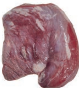
VIT940 SPINACINO SV VITELLONE