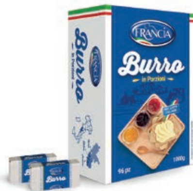
BUR125 BURRINI FRANCIA GR 8