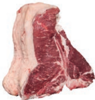
VIT220 FIORENTINE B.A. SCOTTONA "LA NOBILE" SV