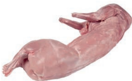
CON100 CONIGLIO INTERO CONG.