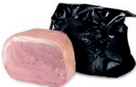
COT730 COTTO NERO