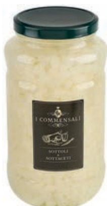
SOT210 CIPOLLINE BIANCHE PERLINE ML 3100 COMMENSALI