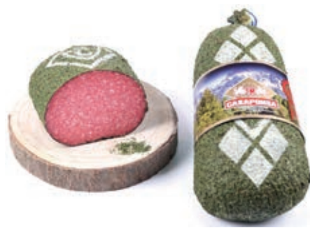
MIL910 SALAME ALLE ERBE A METÀ