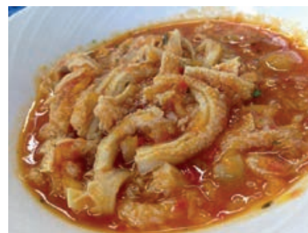
GAC200 TRIPPA CONTADINA VASSOIO