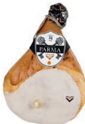
PAR100 PROSCIUTTO PARMA C/O 24 MESI 11+