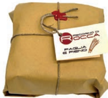
PEA420 PECORINO ROCCA PAGLIA E FIENO