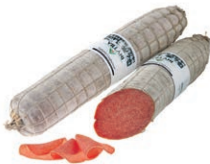
MIL800 SALAME UNGHERESE PS A 1/2 VILLANI