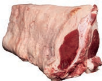
VIT400 T-BONE SCOTTONA "LA NOBILE"