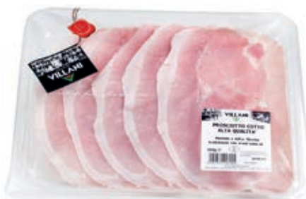
AFF200 AFF.COTTO ALTA QUAL. X 110 GR CT 8 PZ