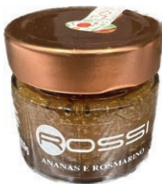
COM250 CONFETTURA DI ANANAS E ROSMARINO GR110X6