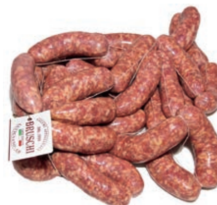
SAL905 SALSICCIA FRESCA BRUSCHI