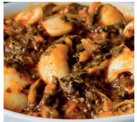
GAM900 SEPPIE INZIMINO MONOP.