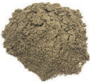
SPZ410 NOCI MOSCATE IN POLVERE INDONESIA KG 1