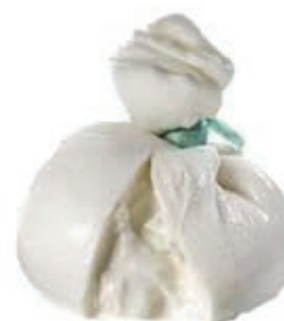
BUF600 BURRATA DI BUFALA GR 125