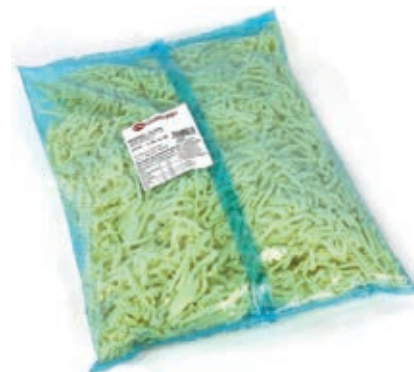
MOZ530 FIORDIL. ROSSI BUSTA JUL.