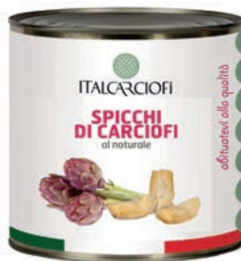
CAR210 CARCIOFI SPICCHI NATUR. X 2.5