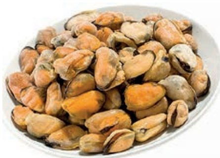
CPE870 COZZA SGUSCIATA CILE IQF KG 1