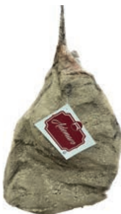
SPA150 SPALLA S/O "ADEMARO" O.I.