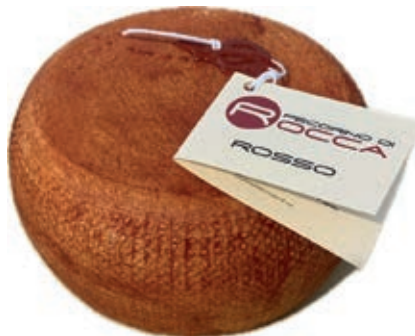
PES205 PECORINO ROCCA ROSSO