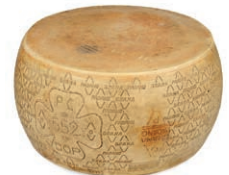
GPR110 GRANA PADANO FORME