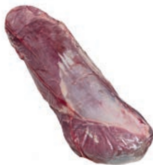
VIT280 FILETTO B.A. S/V PLT