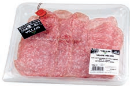
AFF500 AFF. MILANO X 110 GR CT 8 PZ O.I.