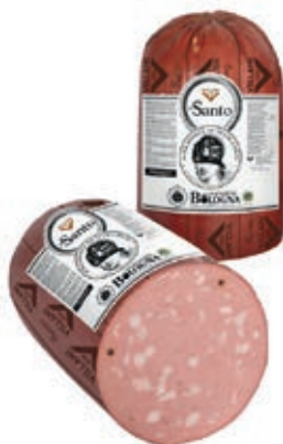
MOS500 MORTADELLA SANTO X 30 A 1/2