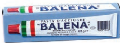
ACC800 PASTA ACCIUGHE BALENA