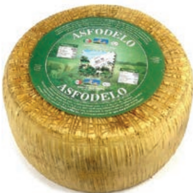
PES530 PECORINO CAN.X5 GIUNCO NERO (150 GG)O.I.