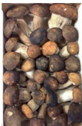
POR700 PORCINI FRESCHI EXTRA