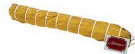
LOM300 LOMBO ADEMARO PEPE CARTA