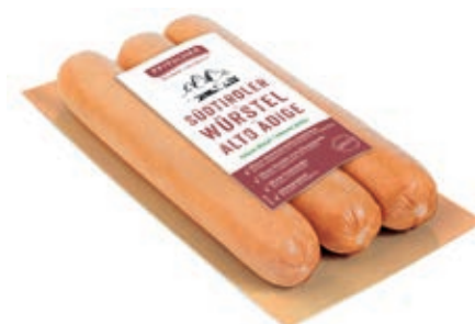
WUR301 WURSTEL S.P. ALTO ADIGE GR 250