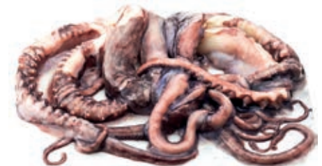
CPE370 TENTACOLI TOT. GIG. PAC. 35/40 IQF KG 5