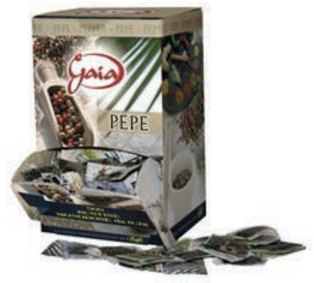
MND700 PEPE MONODOSE GAIA 0.2 X 500