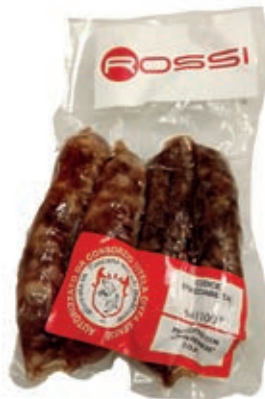
CIS210 SALSICCIA STAG."CINTA SENESE DOP" 120*4SV