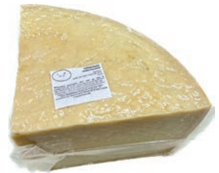
GRP810 GRANA SBIANCATO CONF. 1/8 S.V.