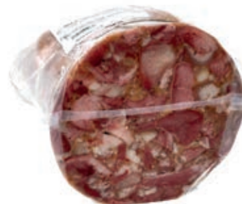
CIN500 CINGHIALE SOPRASSATA