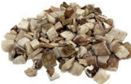
POR415 PORCINO CUBO KG 1 COMMERCIALE CONG