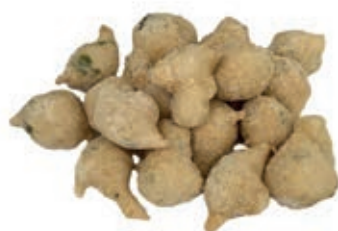
VER980 SALATI FRITTELLE/ALGHE KG.5