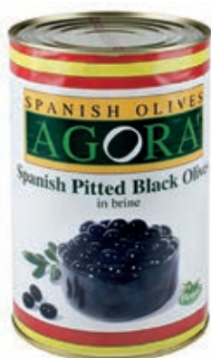
OLI510 OLIVE NERE DEN. LATTI X 4