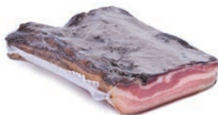
PAN300 PANCETTA AMBURGO SV A 1/2