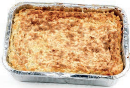
SFO100 SFORMATO DI CAVOLO VASSOIO