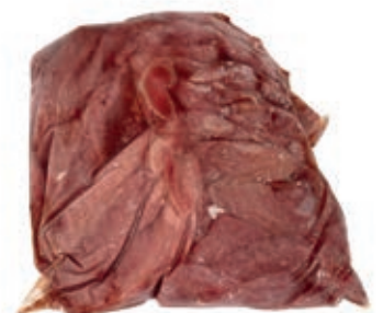
PIU220 ANATRA CARNETTA (FILETTINI PETTO) CONG.