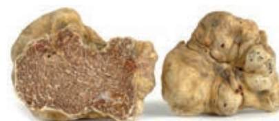
TAR090 TARTUFO BIANCO PREGIATO (proven. Umbria)