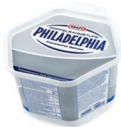
KRA100 PHILADELPHIA GR 1650