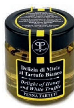
TAR620 MIELE ACACIA AL TARTUFO BIANCO PREG. GR 140