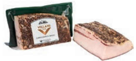
LAR100 LARDO DI PATANEGRA KG 2 C.A