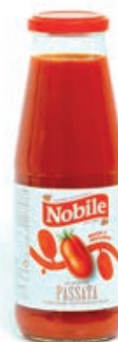
POM800 POMODORI PASSATA 12X680 GR. O.I.