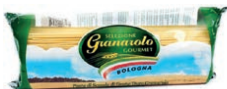
PAS920 SPAGHETTI X 1