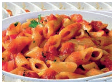
GAP190 PASTA MATRICIANA VASSOIO