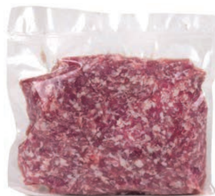
SAL920 SALSICCIA IMPASTO R. O.I.