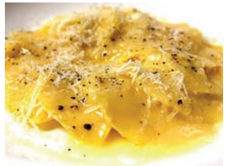
GAM250 RAVIOLI CACIO E PERE MONOP.