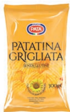
FRS680 PATATINA GRIGLIATA GR 300