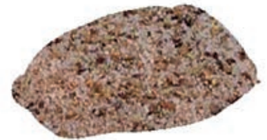
SPZ430 CONCIA PER PORCHETTA KG1