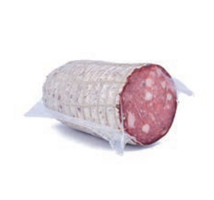
SAL420 SALAME TOSCANO GR. 500 C.A SV O.I.