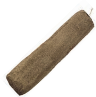
LAR300 LONZARDO INTERO