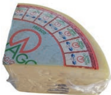
ASI100 ASIAGO A 1/4