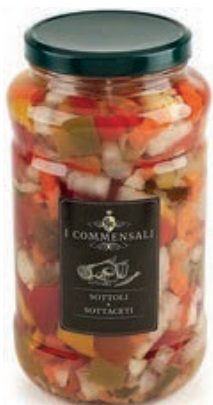
SOT350 GIARDINIERA ML 3100 COMMENSALI