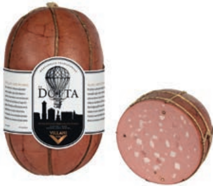
MOD100 MORTADELLA LA DOTTA VN 10/12 O.I.