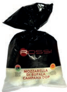
BUF430 MOZZ. BUFALA DOP 15 GR BS 250