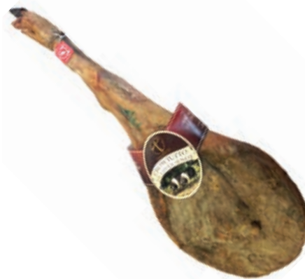
CIS110 PROSCIUTTO "CINTA SENESE DOP" C/O 8KG CA