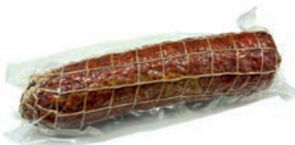
VEN200 VENTRICINA PICCANTE