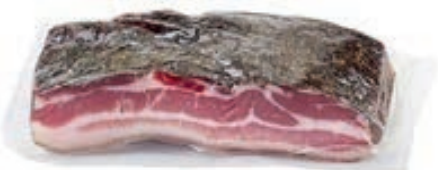
PAN310 PANCETTA AMBURGO TRANCETTI SV