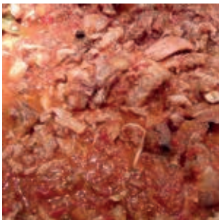
GAS140 SUGO ALLA CHIANTIGIANA VASSOIO