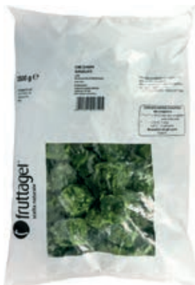
VER700 CIME DI RAPA CUBI CONG.