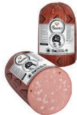
MOS410 MORTADELLA SANTO PIST VN X 30 1/2