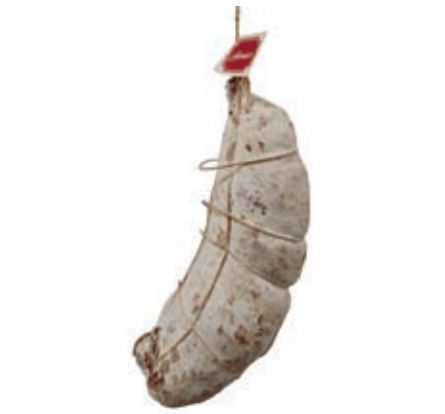
SAL605 SALAME SPAGATO "ADEMARO" KG 5/6