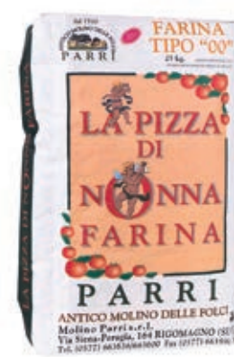
FAR140 FARINA 'LA PIZZA NONNA FARINA' VERDE K 25