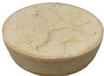
GRP820 FORMAGGIO SBIANCATO 1/2 TAGLIO CERIMONIA