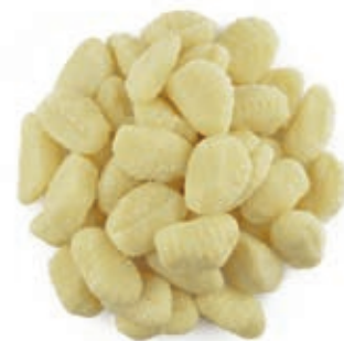
PAS850 GNOCCHI ROSSI ATM GR 500