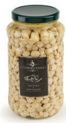
SOT430 CHAMPIGNONS PICCOLI ML 3100