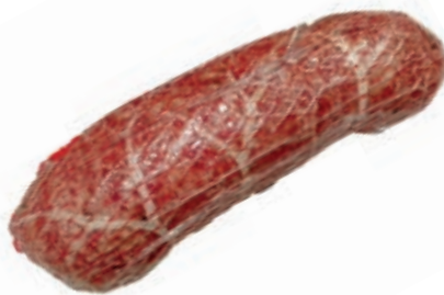
FIN110 SBRICOLONA SPALMABILE DI MAIALE RUSTICO