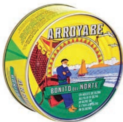
TON220 TONNO BONITO DEL NORTE O.O. GR 260 LATTA