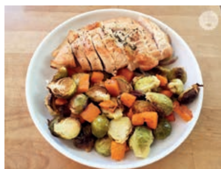
GAB140 FESA DI TACCHINO CON VERDURE VASSOIO