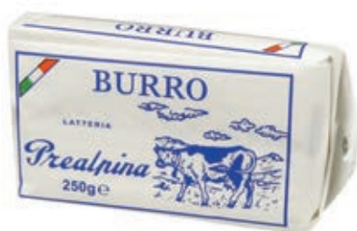
BUR210 BURRO GR 250