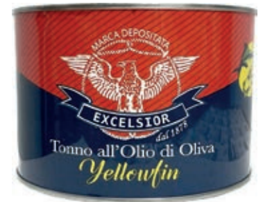
TON710 TONNO GR 1350 OLIO OLIVA