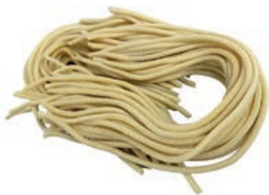
PAS835 PICCI SENZA UOVO ROSSI ATM GR 500