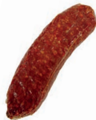
VEN100 SPIANATA PICCANTE