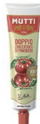
POM920 DOPPIO CONCENTRATO MUTTI TUBO GR 130 O.I.