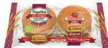
LIE300 PANINI PER HAMBURGER 7 X 300 GR