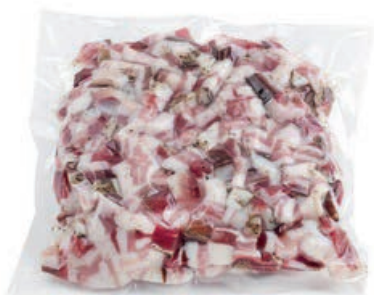
PAN220 PANCETTA CUBETTATA KG 1 SV