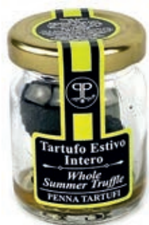
TAR210 TARTUFO ESTIVO INTERO SALAMOIA GR 25/18