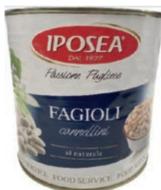
LEG100 FAGIOLI CANNELLINI 6 X 3