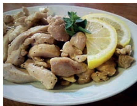
GAB110 POLLO AL LIMONE VASSOIO