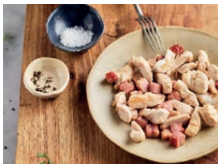
GAB200 STRACCETTI POLLO SPECK_ CAROTINE VASSOIO