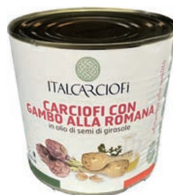
CAR200 CARC.GAMB.ROMAN.ITALIA OSG ML 2650 LATTA