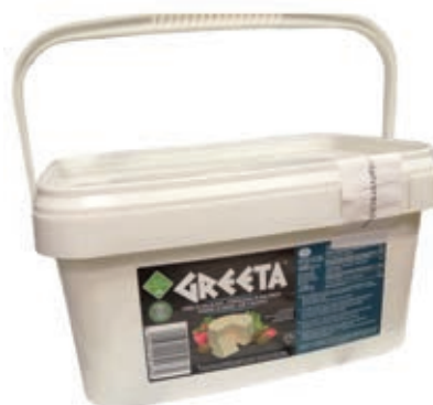
FET100 FORM. A PASTA MOLLE IN SALAMOIA KG 2