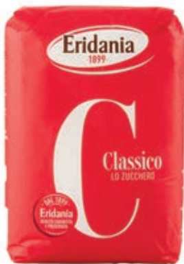
SPZ500 ZUCCHERO KG 1