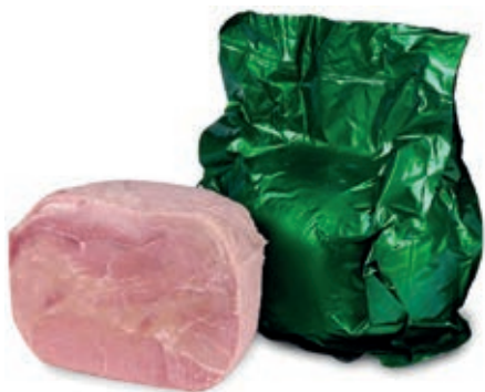
COT725 COTTO SCELTO VERDE A 1/2