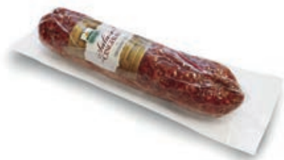
CIN220 CINGHIALE SALAME G. 500 B