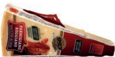
GPR800 PARM. REGG. 24 M. VACCHE ROSSE GR 250