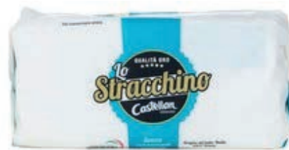
STR100 STRACCHINO DA 1 KG