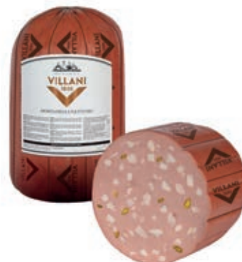
MON200 MORTADELLA NETTUNO KG 6 A 1/2