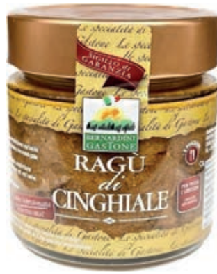
RAG210 RAGÙ DI CINGHIALE 220 GR