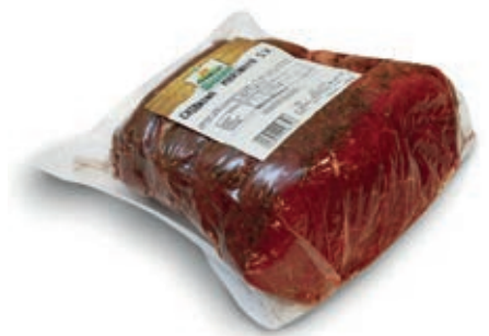
BRE800 CARPACCIO CHIANINA O.I.