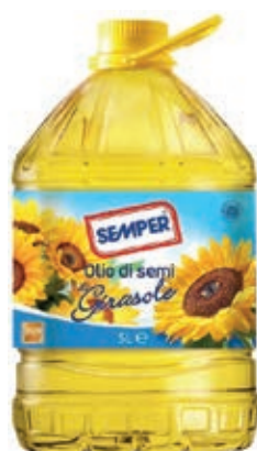
EVO600 OLIO SEMI GIRASOLE LT 5 PET