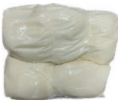
MOZ120 FIORLIL. ROSSI BOCCE FONDO R.