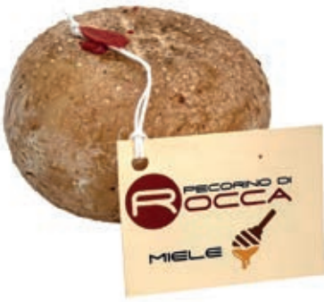
PEP300 PECORINO ROCCA PALLOT. CON MIELE