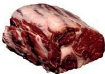
VIT510 CUBE ROLL SCOTTONA "LA NOBILE"