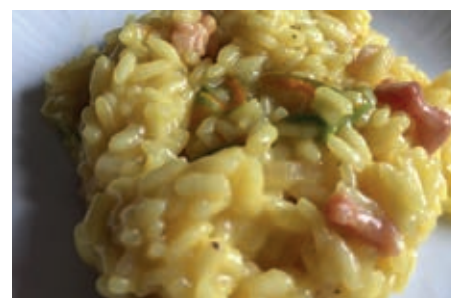
GAM530 RISO ZUCCHINE PANCETTA ZAFFERANO MONOP.