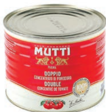
POM900 DOPPIO CONCENTRATO MUTTI X 2.5 O.I.