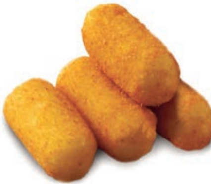
PAT920 CROCCHETTE DI PATATE KG 1