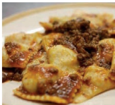
GAM200 TORTELLI DI PATATE AL RAGU' MONOP.