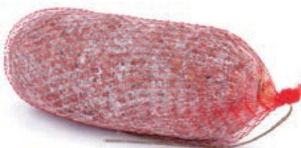
FIN310 SBRICOLONA KG 1 O.I.