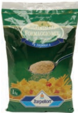
GRA500 FORM. GRATTUGIATO FRESCO MIX KG 1