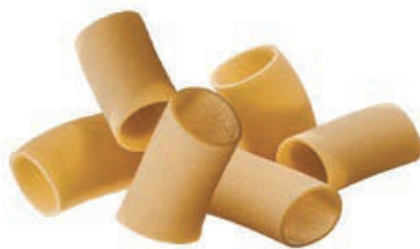
PAS840 PACCHERI ROSSI ATM 1 KG