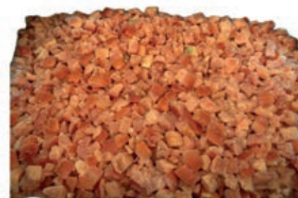
VER725 POMODORI A CUBETTI SURG1X10 KG FRUTTAGER