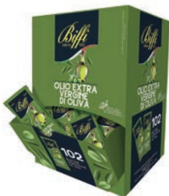
MND200 OLIO EXTRAV. GAIA ML 10 X 100