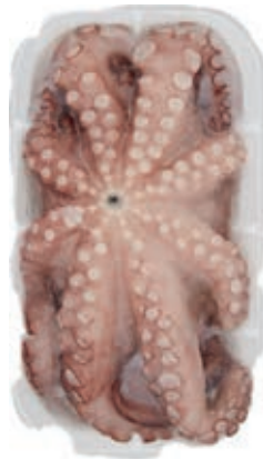
CPE420 POLPI M. 1 KG VASCH. (KG 8) PP