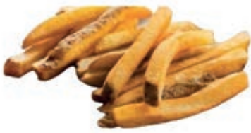
PAT090 PATATE 11X11 KG 2,5X4