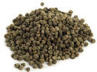
SPZ150 PEPE VERDE NATURALE GR 500