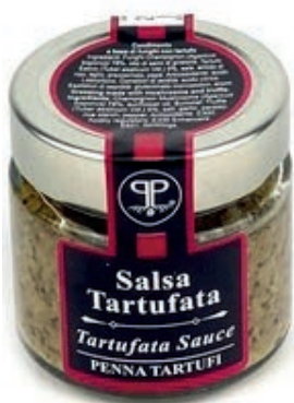
TAR360 SALSА TARTUFO GR 90 5%