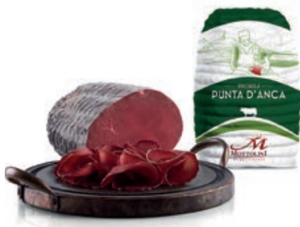
BRE300 BRESAOLA PUNTA ANCA A 1/2 SV