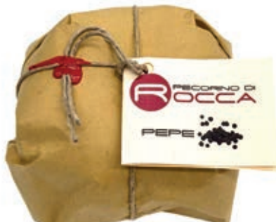
PEP440 PECORINO ROCCA SOTTO PEPE NERO PALLOT.