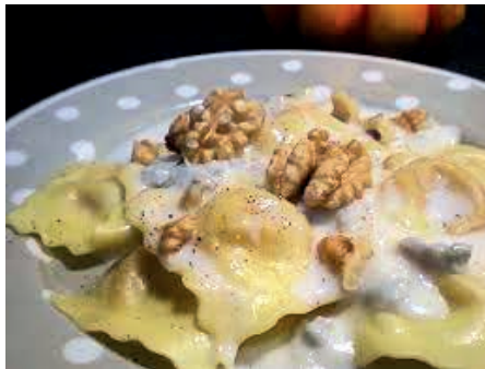
GAM240 RAVIOLI PORRI NOCI E GORGONZOLA MONOP.