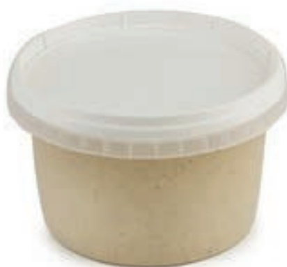
SLS410 SALSА DI NOCI X 1.5 KG