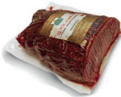
BRE600 FESA MARINATA DI BLACK ANGUS