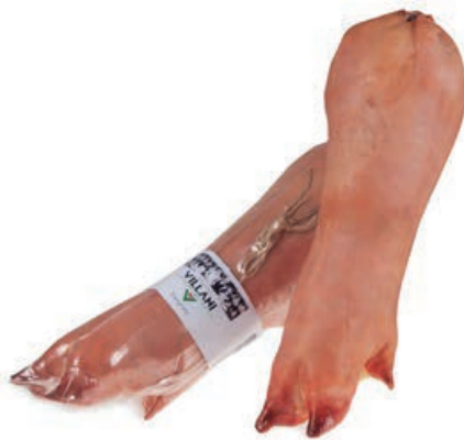
PRE700 ZAMPONE CRUDO S.V.