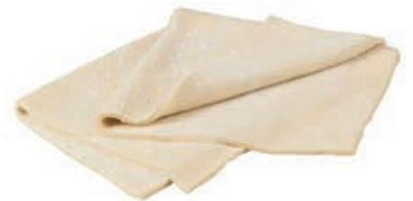
PAS997 PASTA SFOGLIA STESA KG 1 CONG.