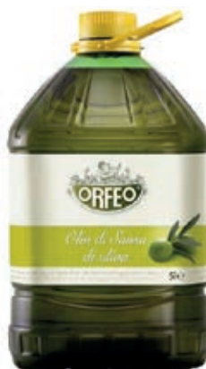
EVO400 OLIO SANSA E OLIVA LT 5 PET