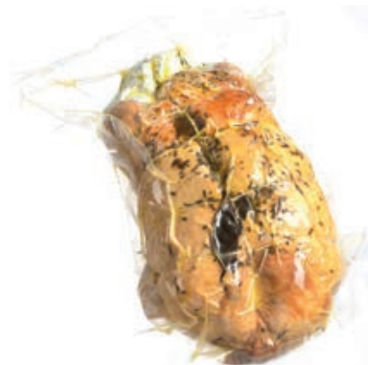
GAB300 GRAN POLLO RIPIENO KG 2 C.A