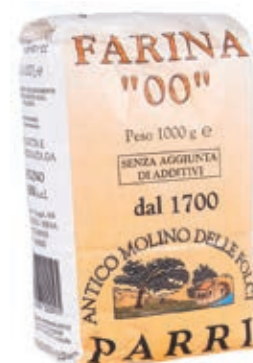
FAR920 FARINA GRANO 00 KG 1