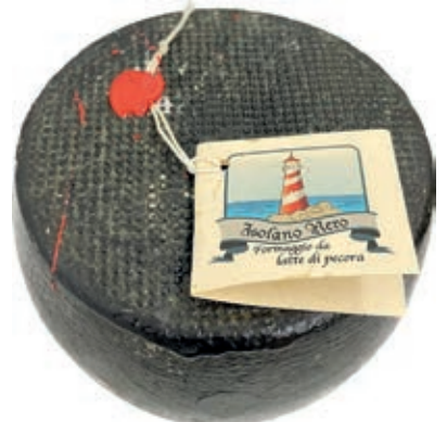
PES610 PECORINO QUERCUS (120 GG)