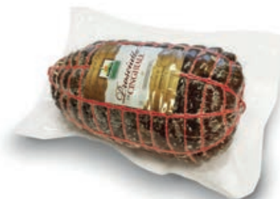
CIN100 CINGHIALE PROSCIUTTO