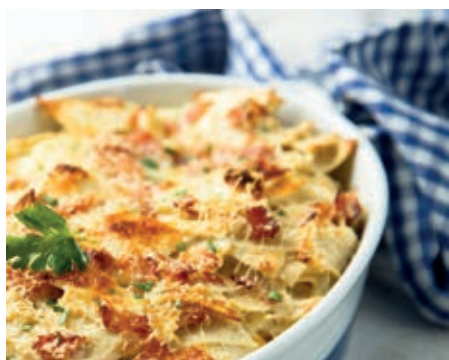
GAP120 PASTA GRATINATA VASSOIO