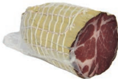
CAP300 CAPOCOLLO A METÀ