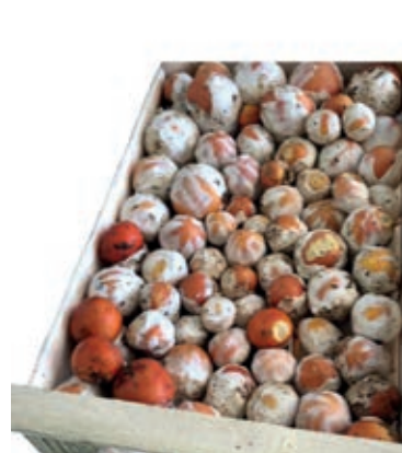
POR800 OVOLI FRESCHI