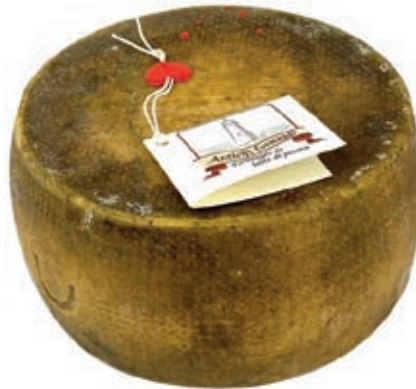
PES600 PECORINO ISOLANO SAVORITO O.I.