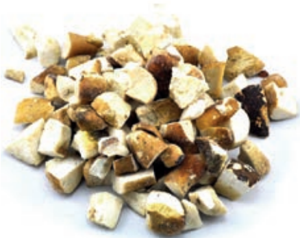
POR410 PORCINO CUBO B CONG. CT