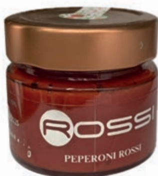
COM245 COMPOSTA DI PEPERONI ROSSI GR. 310