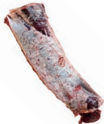
VIT210 LOMBATA VITELLONE 8 COSTE FR