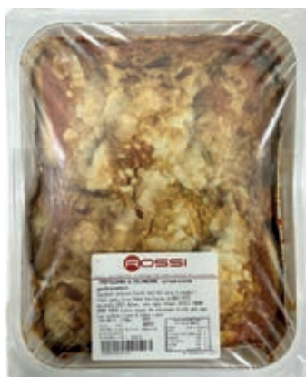
GAP200 MELANZANE ALLA PARMIGIANA VASSOIO