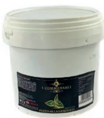
PST200 PESTO ALLA GENOVESE X 2.5 KG