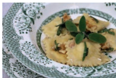
GAP165 RAVIOLI SALVIA, NOCI E PECORINO VASSOIO