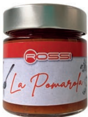
RAG295 POMAROLA ROSSI GR 210