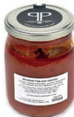
TAR500 SALSА POMODORO E TARTUFO GR 500 5%