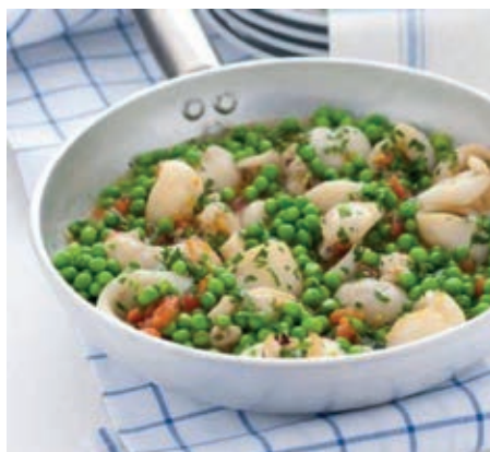
GAD300 SEPIA CON PISELLI VASSOIO