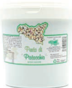
PIS120 PESTO DI PISTACCHIO KG 1