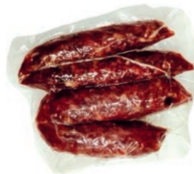
CIN325 SALSICCIA STAGIONATA DI CINGHIALE AL 51%