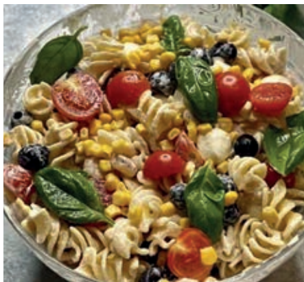
GAP320 INSALATA DI PASTA FREDDA VASSOIO