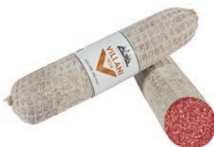
MIL110 SALAME MILANO PS A 1/2 VILLANI O.I.