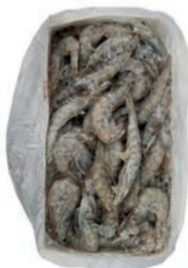
CPE236 MAZZANCOLLA ECUAD. 40/50 KG 1.8