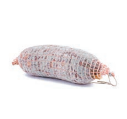
SAL410 SALAME TOSCANO KG 1 C.A O.I.