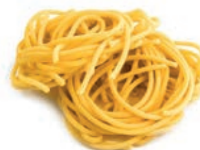
PAS830 PICI ALL'UOVO ROSSI ATM GR 500