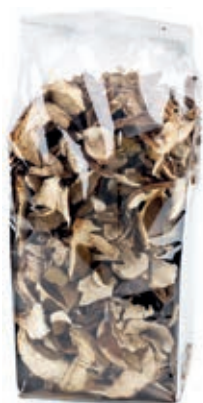
FUN900 FUNGHI PORCINI SECCHI GR 500