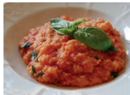
GAP405 PAPPA AL POMODORO VASSOIO