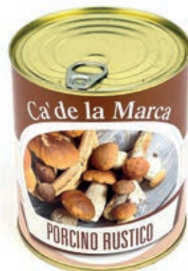
FUG110 FUNGHI PORCINI RUSTICO TRIFOLATO 4/4