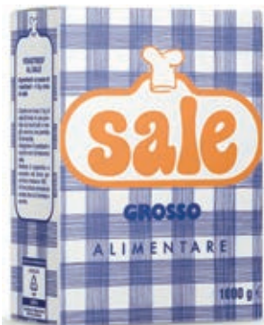
SPZ900 SALE MARINO GROSSO KG. 1