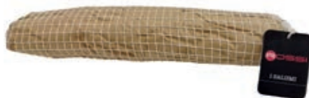
LOM200 LOMBO FINOCCHIO O.I.