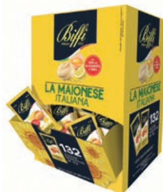
MND300 MAIONESE GR 10 X 132