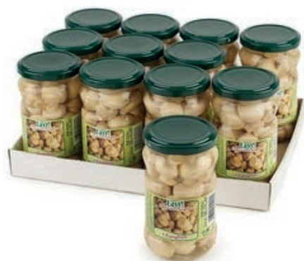
SOT950 FUNGHI CHAMPIGNON INTERI 314 ML