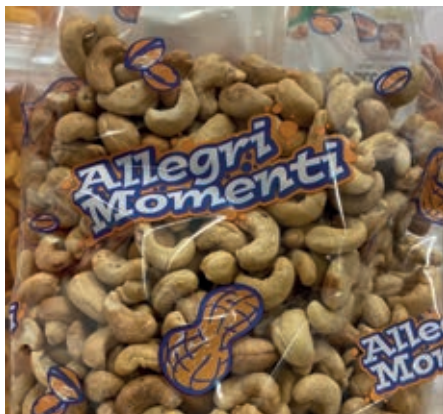
FRS600 ANACARDI TOSTATI KG 1