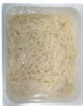
MOZ525 FIORDIL. ROSSI JUL. FONDO R.