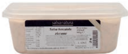
SLS370 SALSА BOSCAIOLA PICCANTE 3G KG 1