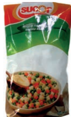
VER910 INSALATA RUSSA CONG.