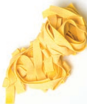
PAS800 PAPPARDELLE ALL'UOVO ROSSI ATM GR 500