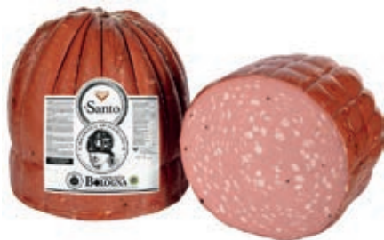
MOS200 MORTADELLA SANTO X 60 TOZZA