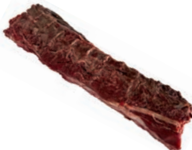
CIC410 LOMBATA C/O CINGHIALE CONG. KG 3