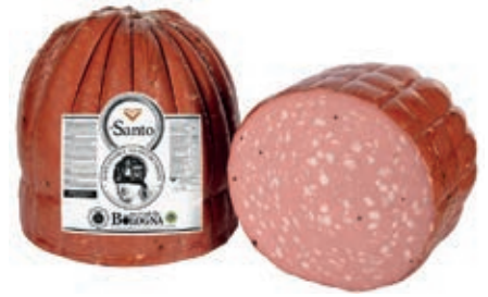
MOS100 MORTADELLA SANTO X 120 TOZZA INTERA