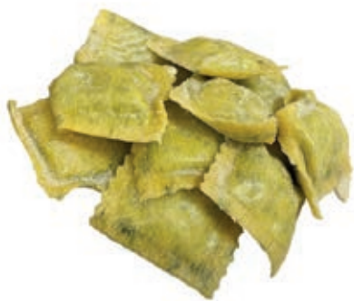
PAS720 RAVIOLI RIC/SPIN ROSSI ATM GR 500