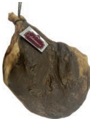
SGN150 SGAMBATO "ADEMARO"