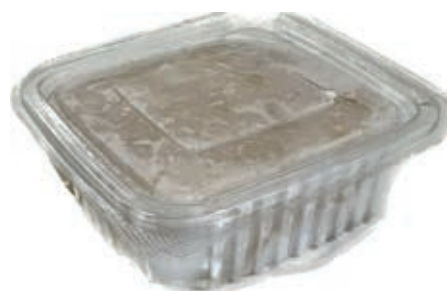
CPE250 POLPA DI GRANCHIO VERA 4 PZX250 GR CRUDA