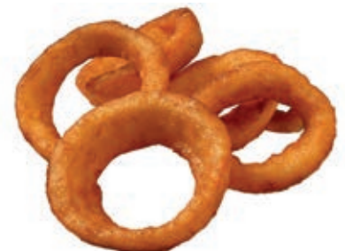
PAT900 CRISPY ONION RINGS KG 1