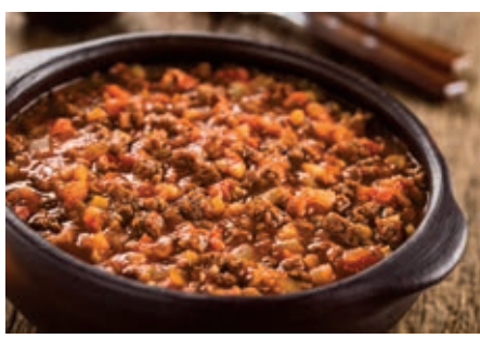
GAS150 SUGO DI CINGHIALE VASSOIO