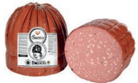
MOS300 MORTADELLA SANTO X 60 TOZZA PISTACCHIO