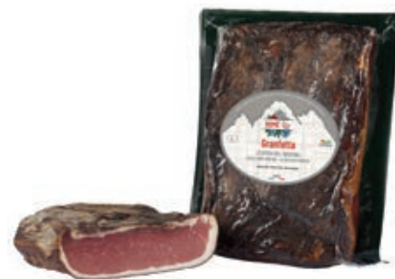
SPE110 SPECK 5 S. GRAN FETTA A 1/2 SV