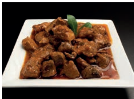
GAM740 SPEZZATINO DI CINGHIALE MONOP.