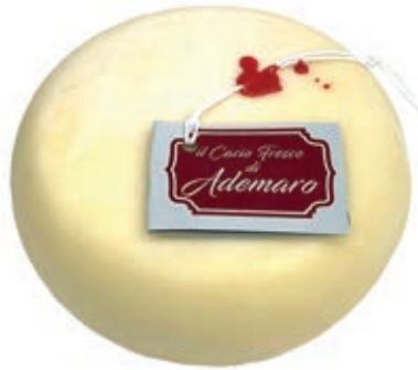
PEF205 PECORINO "IL CACIO DI FRESCO DI ADEMARO"