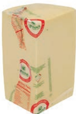
ROM200 ROMANO DOP 1/4 BIANCO SV