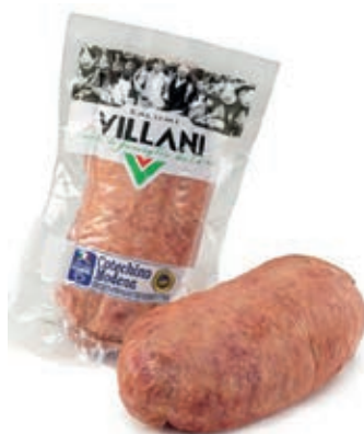
PRE300 COTECHINO MODENA CRUDO SV O.I.