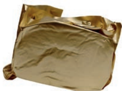
COT707 COTTO GRANCOTTO ROSSI A METÀ