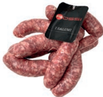
SAL900 SALSICCIA R. O.I.