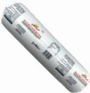
FOR120 MARGHERITA PROD. GASTRON. FILANTE