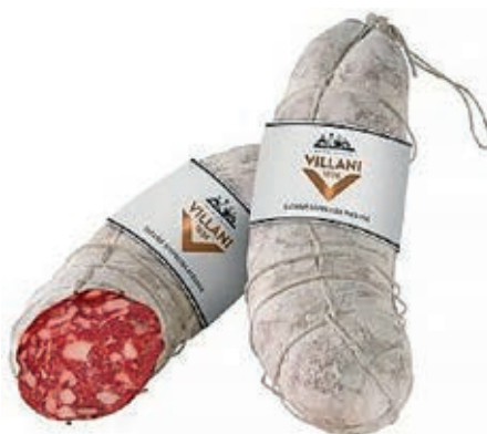
MIL600 SOPPRESSA PAESANA VILLANI