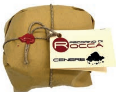
PEP430 PECORINO ROCCA SOTTO CENERE PALLOT.