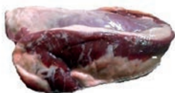
VIT775 GIRELLO DI SPALLA