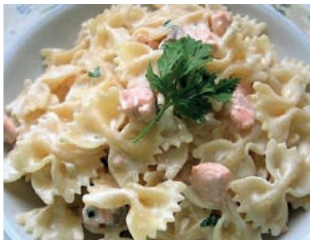
GAM600 FARFALLE AL SALMONE MONOP.