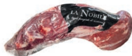
VIT465 FILETTO B.A. SCOTTONA LA NOBILE INTERO SV