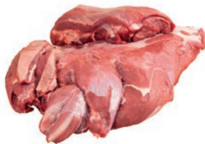
CEC200 CERVO POLPA SCELTA CONG.