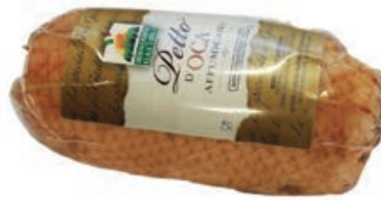
SEL110 OCA PETTO AFFUMICATO SV