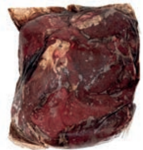
CEC205 POLPA EXTRA CERVO CONG. KG 2,5