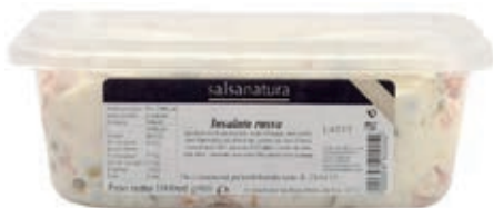
SLS300 INSALATA RUSSA 3G KG 1