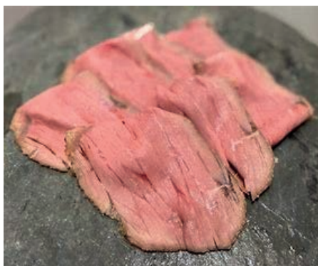
GAC400 ROAST-BEEF VASSOIO