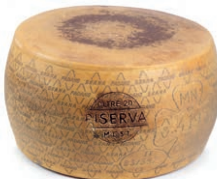
GPR100 GRANA PADANO RISERVA FORME