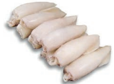
CPE335 CALAMARO U/10 GR 700