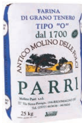
FAR100 FARINA 0 KG 25