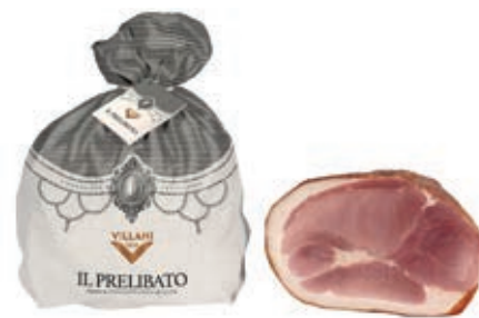
COT100 COTTO PRELIBATO O.I.