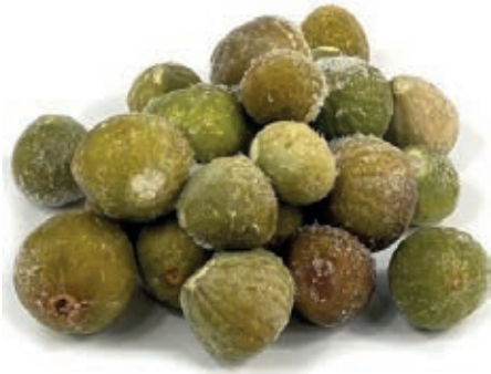
FRU200 FICHI BIANCHI CONG.