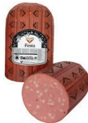
MOF220 MORTADELLA FESTA CIL X 6 1/2 PISTACCHIO