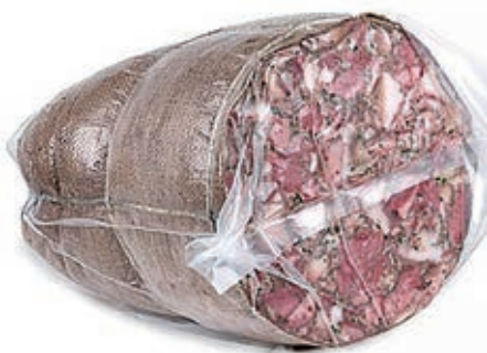
SOP100 SOPRASSATA IN BALLA 1/2 PREZZ.O.I.