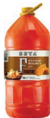
EVO500 OLIO PALMA BIFRAZIONATO X 10 PET