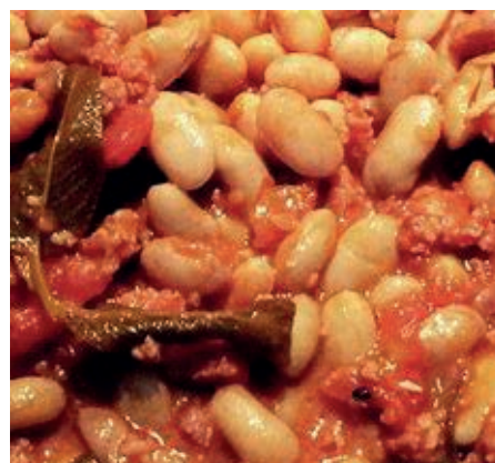
GAC500 SALSICCIA E FAGIOLI VASSOIO