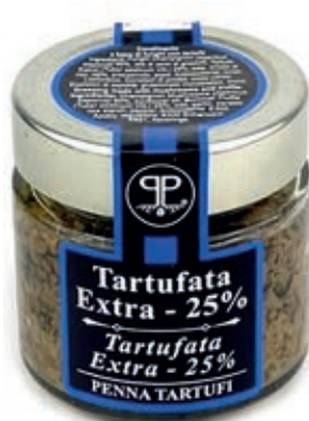
TAR340 SALSA TARTUFO GR 90 25%