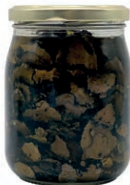
TAR220 CARPACCIO TARTUFO ESTIVO GR. 500