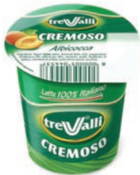
YOG400 YOGURT ALBICOCCA ML 125 O.I.