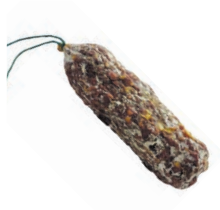
DAI205 SALAME DI CAPRIOLO AL 51% 250 GR SV