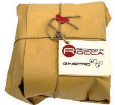
PEA400 PECORINO ROCCA SOTTO GINEPRO