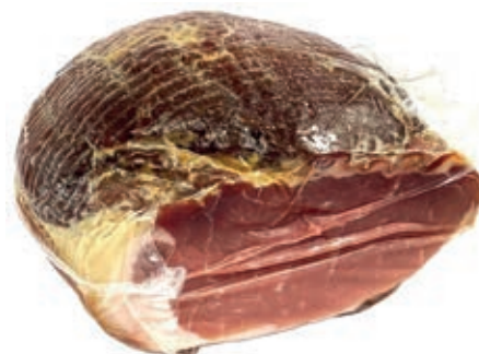
SGE210 SGAMBATO MATTONELLA LAVATO 1/2 SV