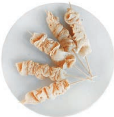
CPE340 SPIEDINO CALAMARI/GAMBERI SGUSC. KG6