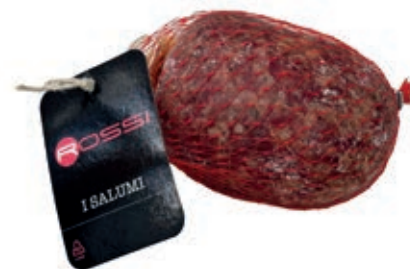
FIN210 SBRICOLONA DI FATTORIA GR 700-800 O.I.