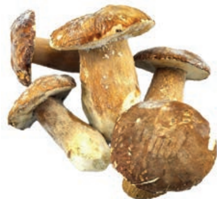
POR110 PORCINO INT. M EXTRA CONG. CT