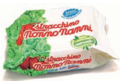
STR220 STRACCHINO NONNO NANNI GR 100 x 10