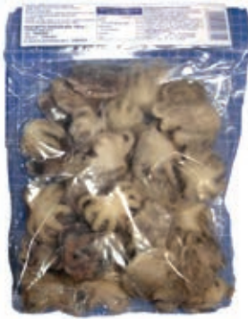
CPE408 POLIPETTI 40/60 GR 750