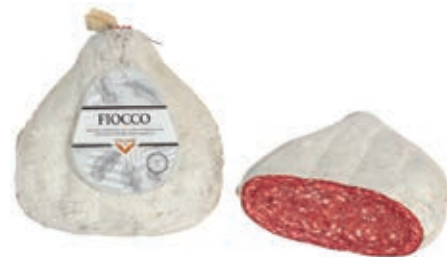
MIL090 FIOCCO SALAME VILLANI O.I.