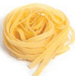
PAS810 TAGLIATELLE ALL'UOVO ROSSI ATM GR 500