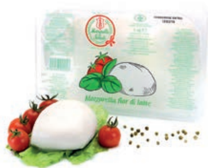
MOZ800 FIORDIL. PREZIOSA JUL. ITALIA KG 2,5