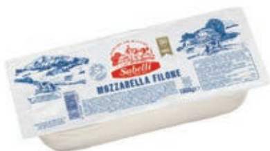
MOZ410 FIORDIL. SABELLI FILONE