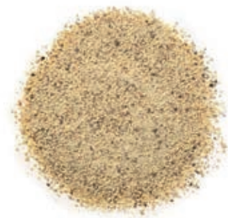
SPZ120 PEPE BIANCO MACINATO VIETNAM KG 1