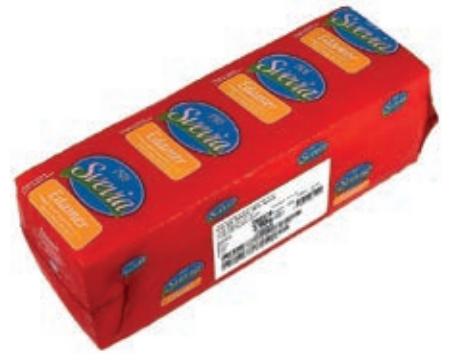
FON120 EDAMER SVEVIA