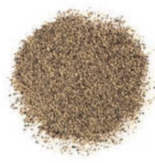
SPZ140 PEPE NERO MACINATO INDIA GR 300