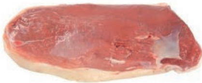
PIU410 OCA PETTO GIOVANE CONG.