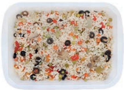
GAP310 INSALATA DI RISO VASSOIO