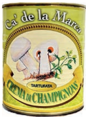
CRE100 CREMA CHAMPIGNON AL TARTUFO 4/4