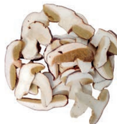
POR300 PORCINO LAMINA CT ROSSI CONG.