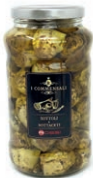
CAR205 CARCIOFI ALLA BRACE INTERI PUGLIA ML3100