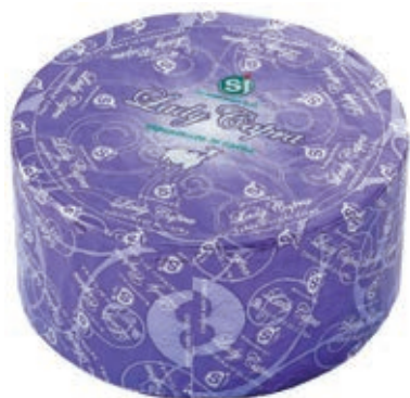
ERB300 BLU DI CAPRA DA KG 4 C.A.