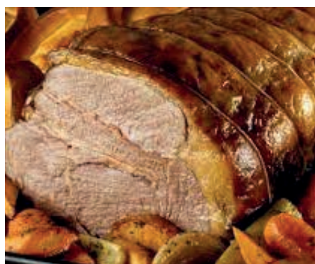
GAM710 ARISTA ARROSTO CON VERDURE MONOP.