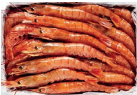
CPE210 GAMBERI ARGENT. L1 C/B KG 2 10/20