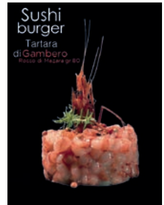
TRT700 TARTARA DI GAMBERO ROSSO DI MAZARA 80GR