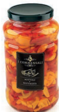
SOT410 PEPERONI R&G FILETTI ML 3100 COMMENSALI