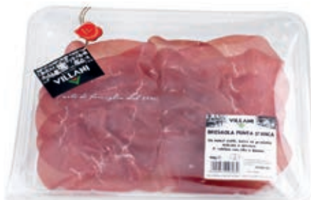
AFF300 AFF.BRESAOLA X 90 GR CT 8 PZ