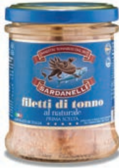
TON420 TONNO VETRO NATURALE GR 200 SARDANELLI