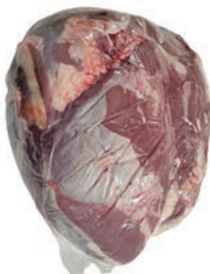
VIT910 NOCE A PALLA SV VITELLONE