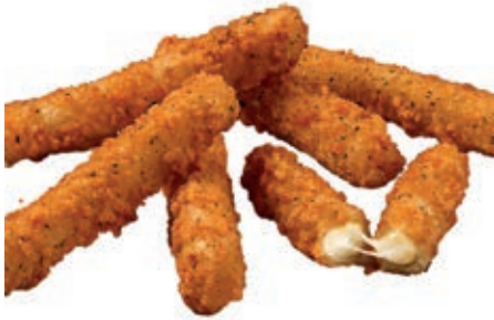
PAT910 BASTONCINI DI MOZZARELLA KG 1