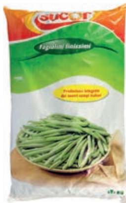
VER610 FAGIOLINI FINISSIMI CONG.