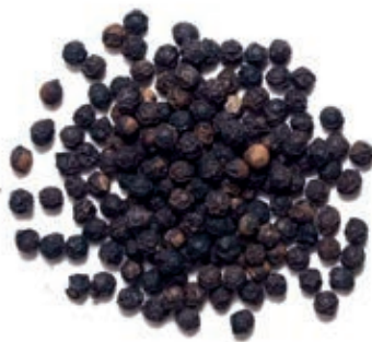
SPZ110 PEPE NERO GRANI KG 1