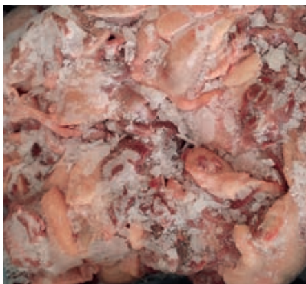
PIU205 ANATRA COSCE BLOCCO CONG