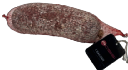
FIN205 SBRICOLONA DI FATTORIA KG 2