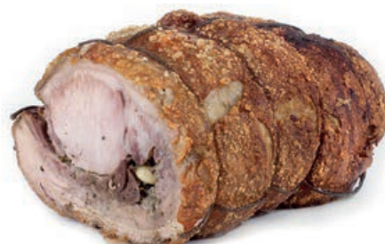
GAC110 TRONCONE DI SUINO IN PORCHETTA METÀ O.I.