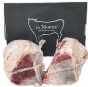
VIT300 LOMBATA SCOTTONA "LA NOBILE" A META S/V