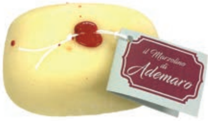
PEF100 MARZOLINO MORBIDO ADEMARO