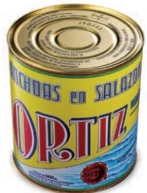
ACC600 ACC. SPAGNA KG 10 ORTIZ (9 P)