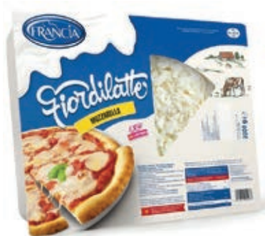
MOZ515 FIORDIL. FRANCIA JUL.