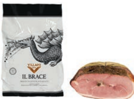
COT020 COTTO BRACE INTERO