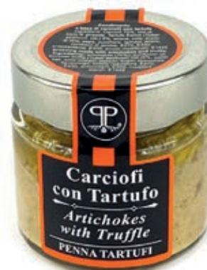
TAR530 CREMA CARCIOFI E TARTUFO GR 90 5%