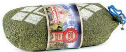
MIL900 SALAME ALLE ERBE