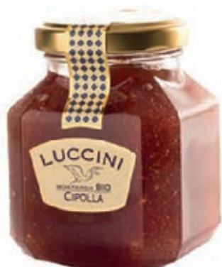
COM110 MOSTARDA CIPOLLA GR 440