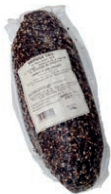
CAP355 CAPOCOLLO ADEMARO PEPE SV