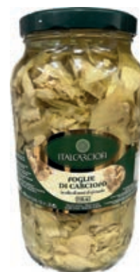
CAR220 CARCIOFI FOGLIE E FOND.OSG ITALIA ML3100