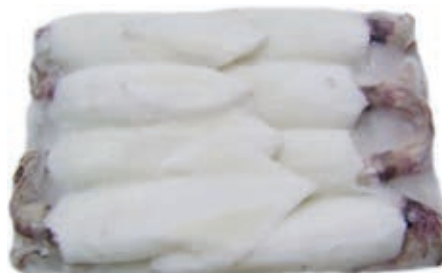
CPE320 CALAMARO PAC THAIL PUL U/5 KG 1.4