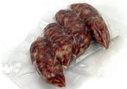
NAP600 SALSICCIA TARTUFATA GR 150 O.I.