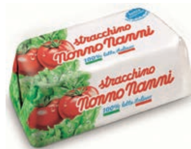
STR210 STRACCHINO NONNO NANNI GR. 200 O.I.