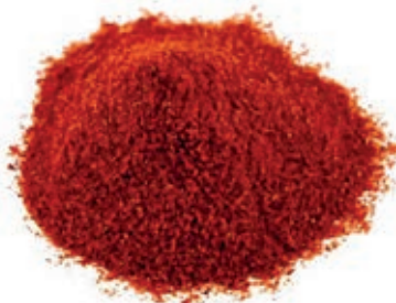
SPZ210 PEPERONCINI ROSSI MACINATI INDIA KG 1