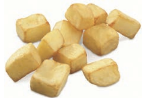
PAT200 PATATE CHEF TRAD.CUBES-CUBETTI KG 2.5