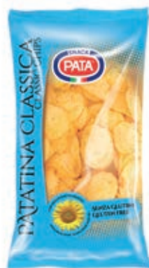
FRS685 PATATINA CLASSICA GR 300