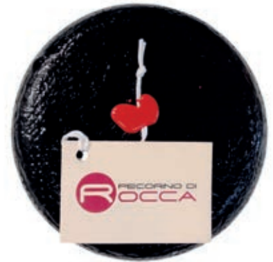
PER310 PECORINO ROCCA SCODELLATO NERO