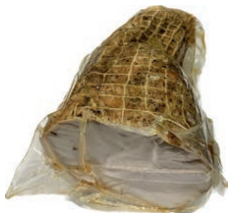
GAC410 ARISTA ARROSTO VASSOIO