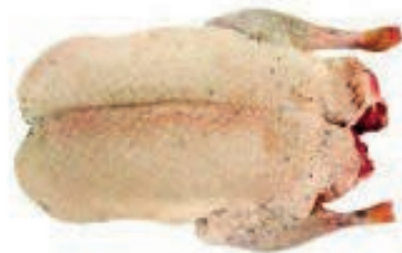
PIU800 GERMANO SPIUMATO 700/800 CONG.