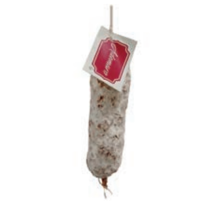
SAL640 SALAMINO T/MILANO "ADEMARO"