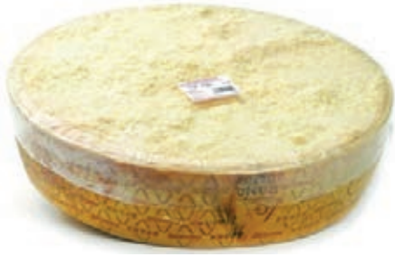
GRP200 GRANA PADANO 1/2 TAGLIO CERIMONIA