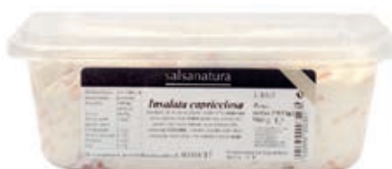
SLS310 SALSA CAPRICCIOSA 3G KG 1