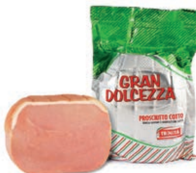
COT710 COTTO GRAN DOLCEZZA