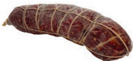
SAL110 SALAME DI MAIALE RUSTICO KG 1 SV