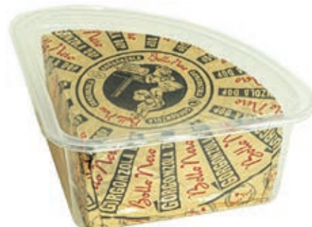
ERB120 GORGONZOLA DOP BOLLO NERO A 1/8