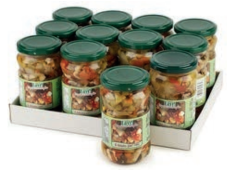
SOT915 MISTORISO 314 ML