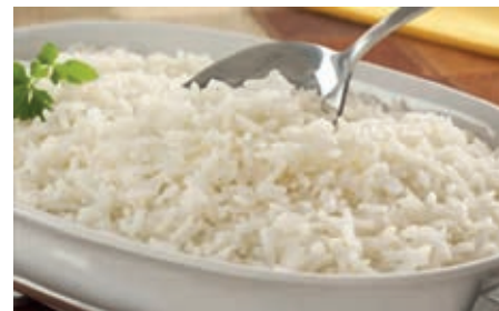
GAP325 RISO BIANCO VASSOIO