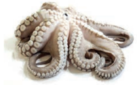
CPE410 POLPO M. 1000/2000 VASCH. (KG 14 CA) PP