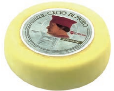
PEF210 PECORINO MORBIDO DOLCE 20