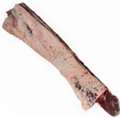
VIT272 LOMBATA SCOTTONA SLAVA FEMMINA 17/18 KG