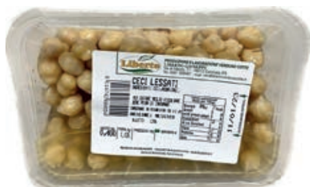
GAV600 CECI GR 400