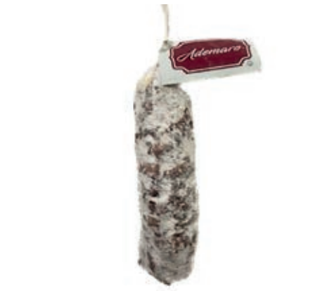
SAL635 SALAMINO BUD. GENTILE "ADEMARO"