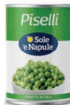
LEG300 PISELLI 24 X 0.4