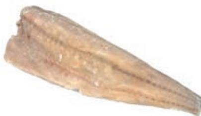
CPE145 MERLUZZO CARBONARO 1000 UP KG10