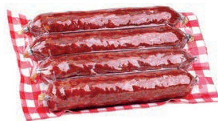
NAP400 SALSICCIA PICCANTE TRINITÀ DRITTA