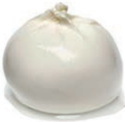
FDL560 BURRATA AL TARTUFO S/ TESTA GR 125