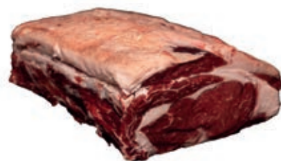
VIT520 ENTRECOTE SCOTTONA "LA NOBILE"