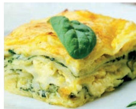
GAP110 LASAGNE VEGETARIANE VASSOIO