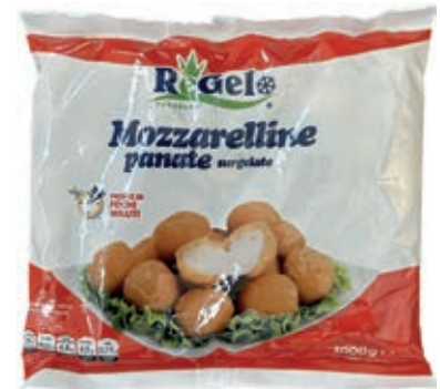
VER000 MOZZARELLE PANATE CONG.