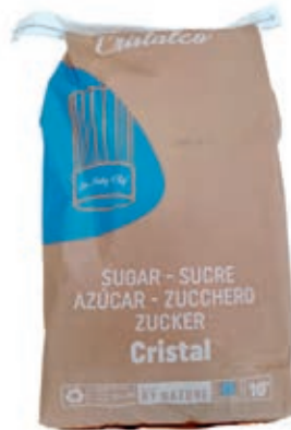
SPZ510 ZUCCHERO KG 10