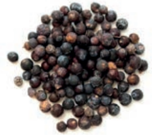
SPZ400 GINEPRO BACCHE KG. 1