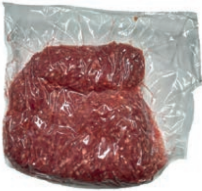
HAM650 PREPAR.CARNE MACINATA B.A. GELO PACCHI 1-10 KG