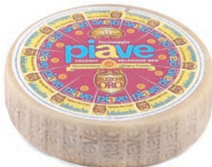
PIA100 PIAVE DOP SELEZIONE ORO