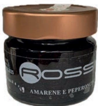
COM265 CONFETTURA DI AMARENE E PEPERONC. GR350