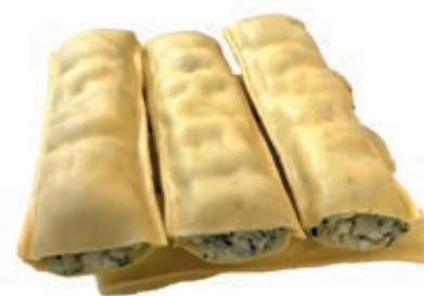
PAS730 CANNELLONI ROSSI ATM GR 500