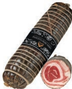
PAN515 PANCETTA ARR. PEPE NERO A METÀ