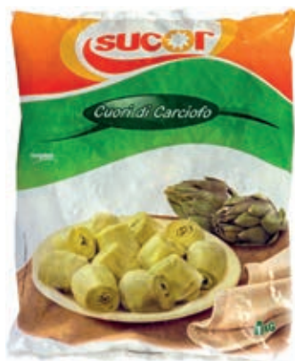
VER510 CARCIOFI A SPICCHI CONG.