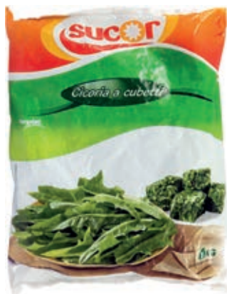
VER730 CICORIA CONG.