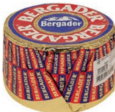
ERB500 BERGADER TONDO SV