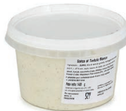
SAT100 SALSA AL TARTUFO BIANCO X 1.4 KG