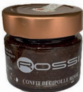
COM205 CONFIT DI CIPOLLE ROSSE GR. 350