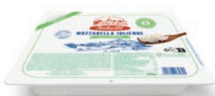
MOZ600 FIORDIL. S/LATTOSIO JUL.