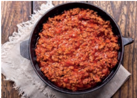
GAS120 RAGU' DI CINTA SENESE VASSOIO