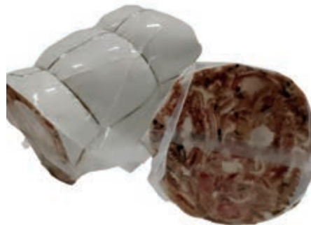
SOP255 SOPRASSATA C/PREZZEMOLO BRUSCHI