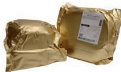
COT702 COTTO GRANCOTTO ROSSI