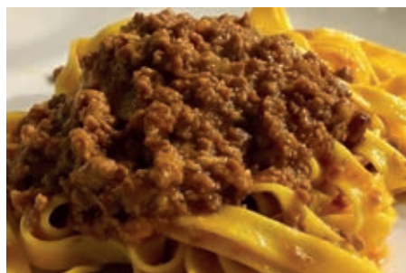
GAP170 TAGLIATELLE AL RAGU' VASSOIO