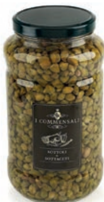
SOT120 CAPPERI P.C. ML 3100 CAL 10/12