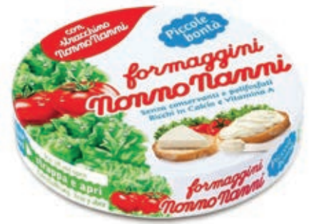
KRA500 FORMAGGINI NONNO NANNI GR 140 X 12