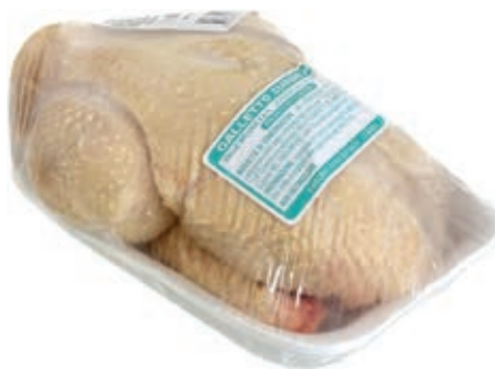
PIU510 GALLETTO GR 350/400 CONG.