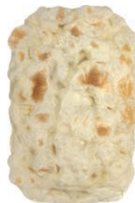
LIE500 BASE DI PINSA ITALIANA GR 250