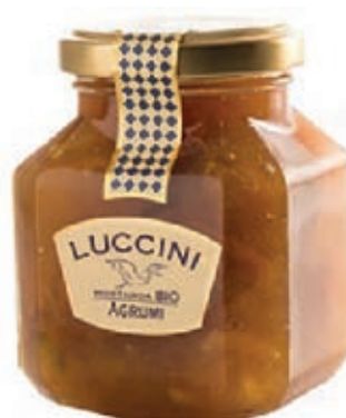
COM120 MOSTARDA AGRUMI GR 440