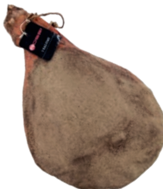
PRO600 PROSCIUTTO C/O DI PIERO