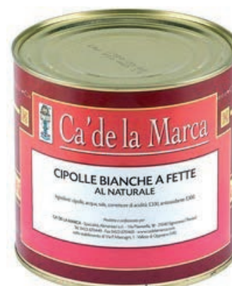
SOT230 CIPOLLE FETTE NAT. 3/1