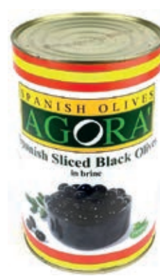
OLI530 OLIVE NERE RONDELLE LATTI