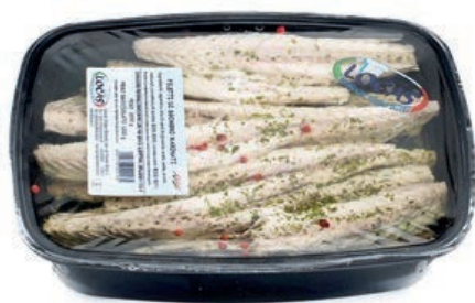
MAR800 LOCAS FIL. SGOMBRIO MARINATO X 2 KG.