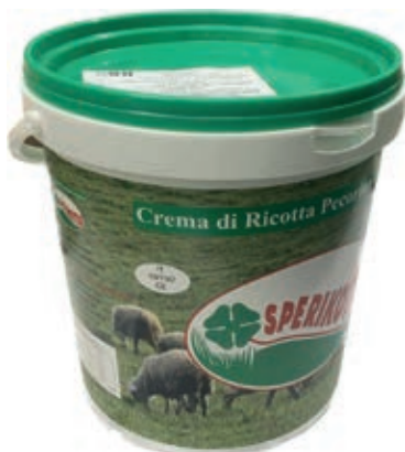
RIC500 CREMA DI RICOTTA ZUCCHERATA CONG.DA KG 6