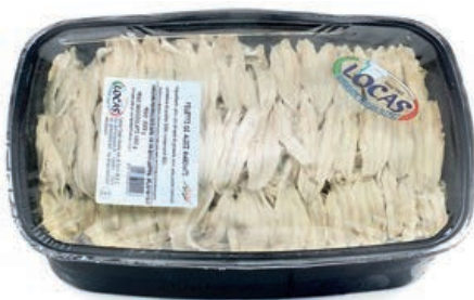
MAR610 LOCAS ALICI MARINATE X 2