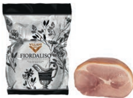
COT310 COTTO FIORDALISO XL A METÀ