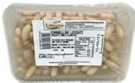
GAV500 FAGIOLI GR 400