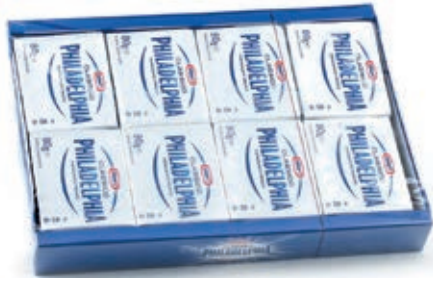
KRA120 PHILADELPHIA GR. 80