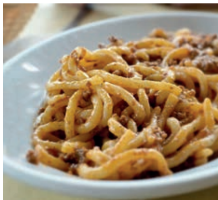
GAM490 PICI AL RAGU' ROSSO DI CINTA MONOP.