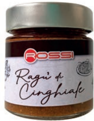
RAG215 RAGÙ DI CINGHIALE ROSSI GR 210