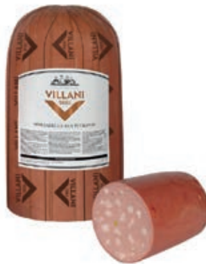
MOP200 MORTADELLA S. PETRONIO X 6 1/2 2PZ