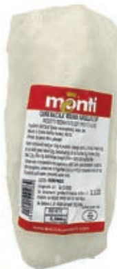
CPE100 BACCALA CUORE AMMOLL. 400/600 KG 2,5 CONG.