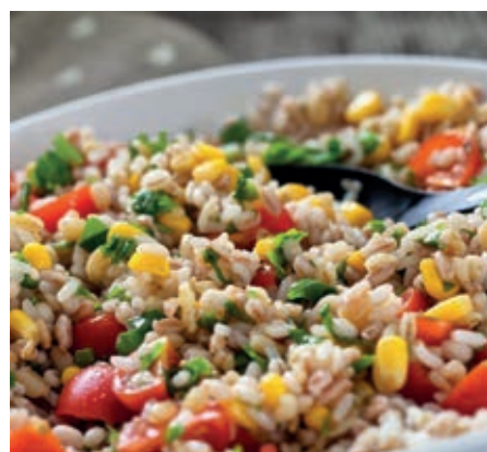
GAP300 INSALATA DI FARRO VASSOIO