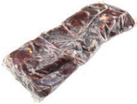
LEP200 LEPRE CARNETTA KG 1 ARG. CONG.