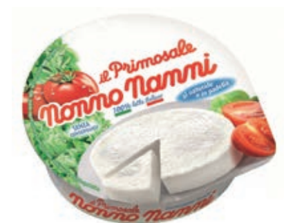
PRI100 PRIMOSALE GR 150 x 8