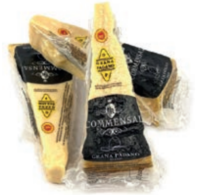
GRP600 GRANA PADANO GR. 250 PF