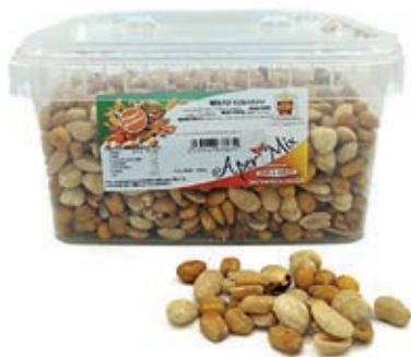
FRS650 MISTO TOSTATO SALATO