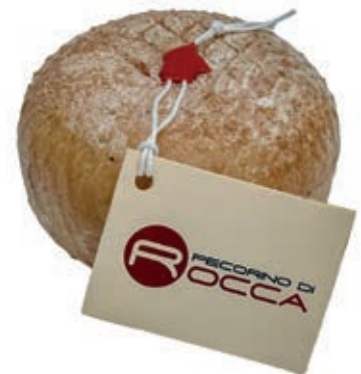
PEP100 PECORINO ROCCA PALLOT.