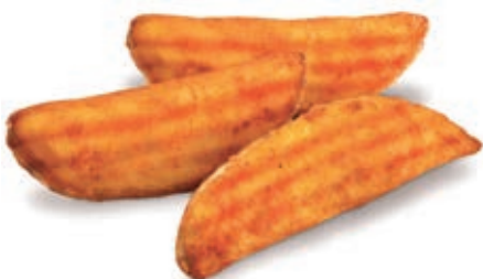
PAT510 SPICCHI ONDULATI ALLA PAPRIKA KG 2.5