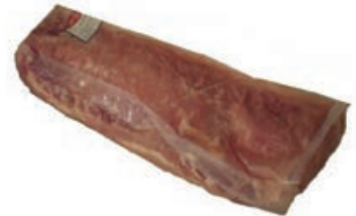
MAI400 SUINO LONZA SPAGNA CONG.