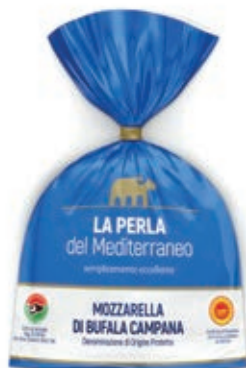
BUF315 MOZZ. BUFALA DOP 5 X 100 GR