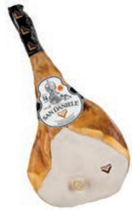
SAN100 PROSCIUTTO SAN DANIELE C/O 24 MESI 11,5+