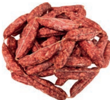
NAP700 SALSICCIA STAGIONATA