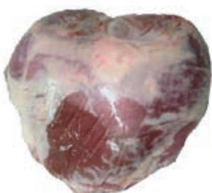
VIT810 FESA DI VITELLA DA LATTE OLANDA