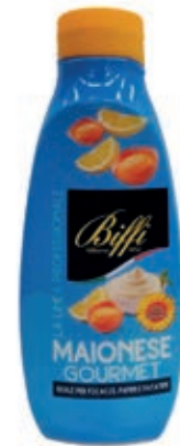
SLS210 MAIONESE GOURMET 820