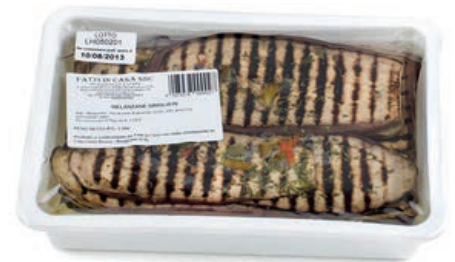
SOT810 MELANZANE ARROSTITE KG 1.350