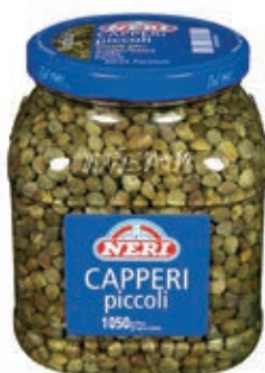
SOT155 CAPPERI ACETO PICCOLI 7/8 ML 1500