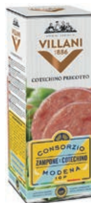
PRE100 COTECHINO PRECOTTO GR 500 O.I.