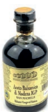
ACE400 ACETO BALSAMICO ML 250