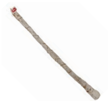
SAL645 SALAME GENTILE MT 1/1,2 "ADEMARO"