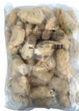
VER970 FIORI DI ZUCCA ALLE ALICI PAST 2X2,5 KG