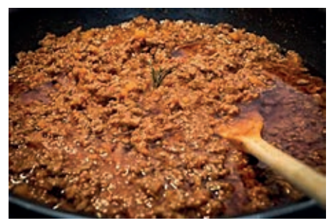
GAS160 SUGO DI LEPRE VASSOIO