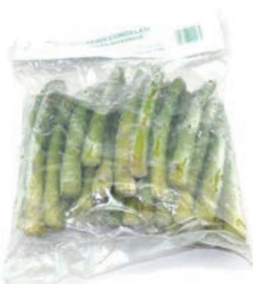
VER400 ASPARAGI 17/22 KG 1 CONG.