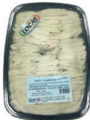
MAR620 FIL. ALICI MARINATE VASCA X 1 KG.