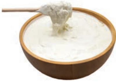
FDL450 STRACCIATELLA GR 200