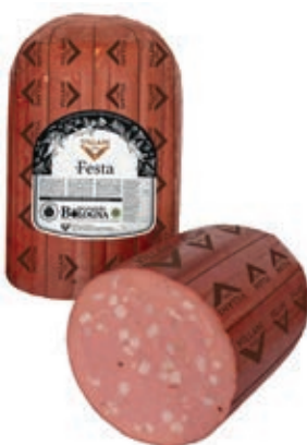
MOF210 MORTADELLA FESTA CIL X 14 1/2 PISTACCHIO