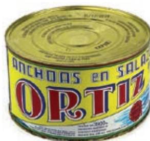
ACC715 ACC. SPAGNA KG 5 ORTIZ (9 P)