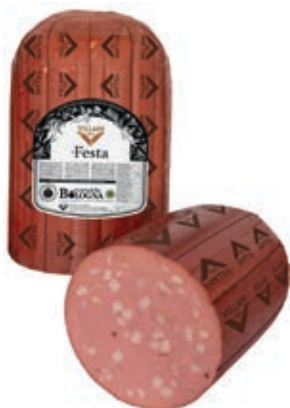
MOF200 MORTADELLA FESTA CIL X 14 A 1/2