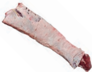
VIT250 LOMBATA DK