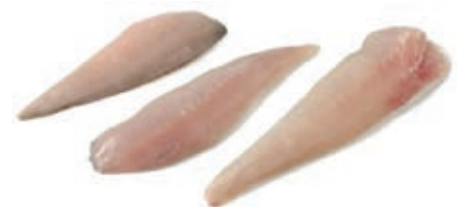
CPE610 GALLINELLA FILETTO 150/200 10x800