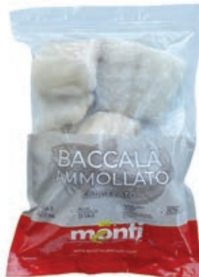
CPE110 BACCALA PORZ.180/220 KG 1 CONG.