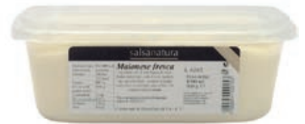
SLS100 MAIONESE FRESCA 5 KG 3G