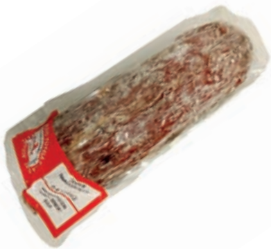
CIS205 SALAME DA "CINTA SENESE DOP" GR 250 SV