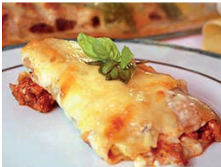
GAM260 CREPELLE POMODORO/ FUNGHI MONOP.