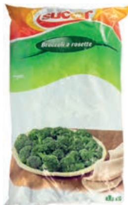
VER800 BROCCOLI CONG.