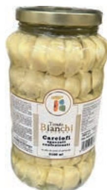
CAR110 CARCIOFI SPACC.ACCOM. ITALIA OSG ML 3100