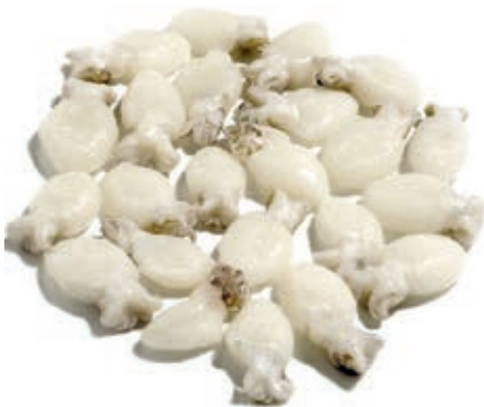
CPE470 SEPIA IND PUL 60 UP IQF GR 800