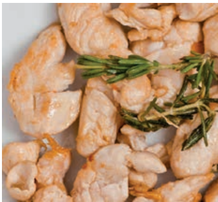
GAM820 POLLO AL ROSMARINO MONOP.