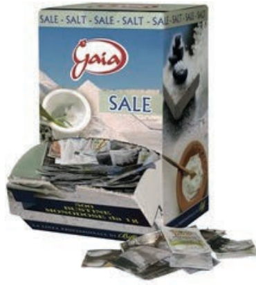
MND600 SALE MONODOSE GAIA 1 GR X 500