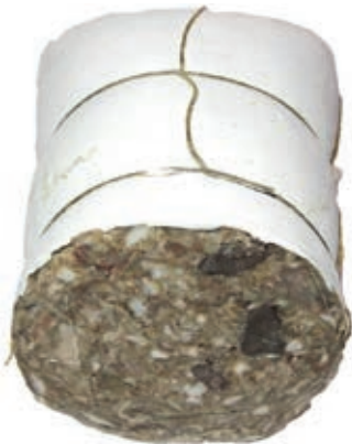
SOP250 SOPRASSATA S/PREZZEMOLO BRUSCHI