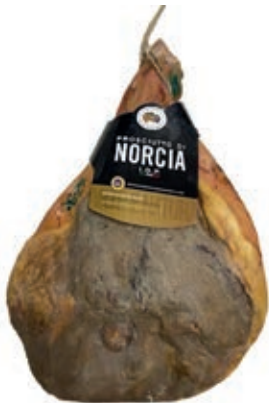
PRO300 PROSCIUTTO DI NORCIA C/O IGP 18 mesi