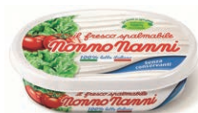
STR115 FRESCO SPALMABILE GR 150 x 12