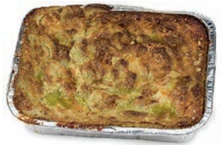
SFO300 SFORMATO DI BIETOLE VASSOIO