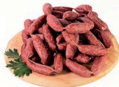
CIN310 SALSICCIA CON CINGHIALE ATM KG 1 O.I.