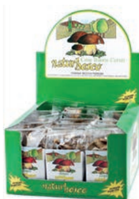
FUN910 FUNGHI PORCINI SECCHI GR 40