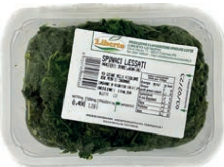
GAV300 SPINACI GR 400