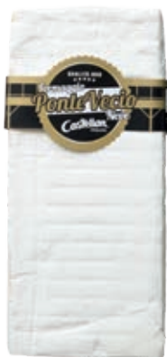
CAS610 TRANCIO PONTE VECIO NEVE KG 4 C.A.