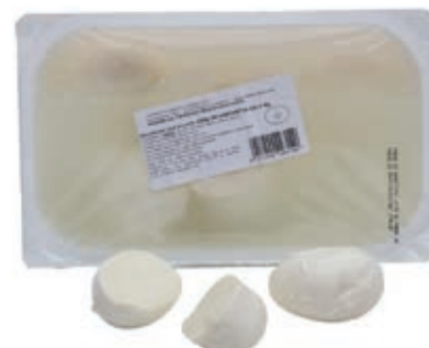
MOZ240 FIORLIL. BOCCONCINI ACQUA 10X100