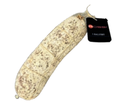
SAL210 SALAME DI FATTORIA KG 2