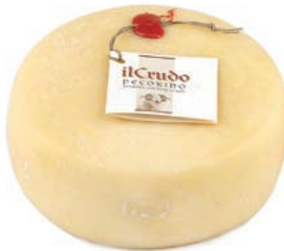
PEF400 PECORINO LATTE CRUDO FRESCO ST 16