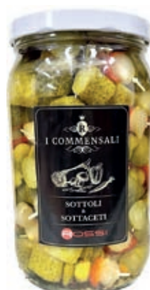
SOT340 SPIEDINI DI VERDURE ACETO ML 1850