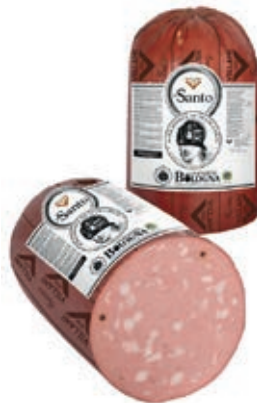
MOS400 MORTADELLA SANTO X 30 A 1/2 VN