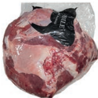
VIT430 MAGRO SCAMONE SCOTTONA "LA NOBILE"