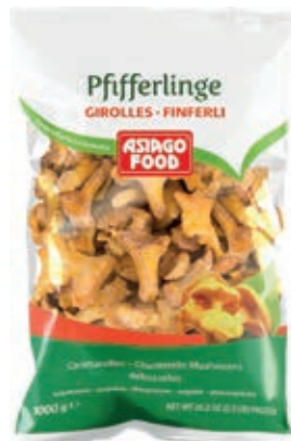
FUN300 FUNGHI GALLETTI/FINFERLI CONG.