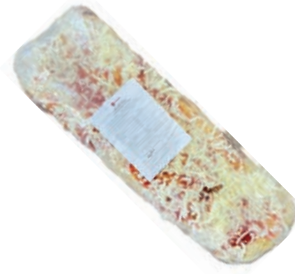
PIZ100 PIZZA MARGHERITA CONG.