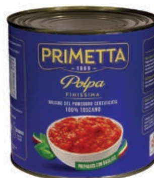
POM450 POLPA POMODORO PRIMETTA LATTA 2650