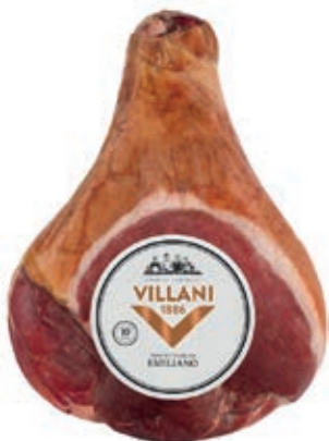
PRO710 PROSCIUTTO EMILIANO S/O PRESSATO VILLANI