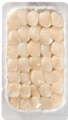
CPE031 CAPPESANTE ATLANTICHE SGUSC8/12UK10X600P