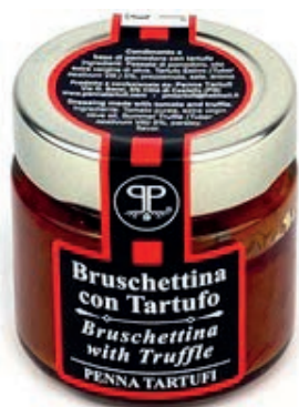
TAR510 SALSА POMODORO E TARTUFO GR 90 5%