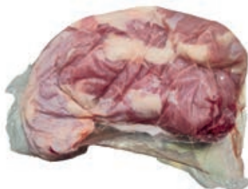
VIT860 SPINACINO DI VITELLA DA LATTE OLANDA