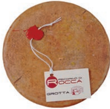
PER200 PECORINO ROCCA STAGION. IN GROTTA ST 22