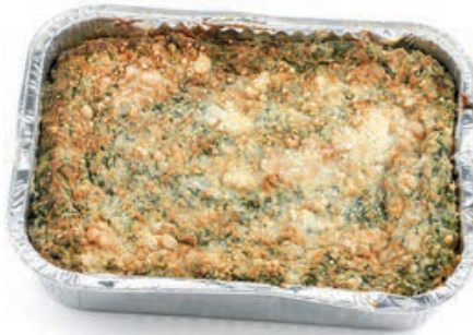
SFO200 SFORMATO DI SPINACI VASSOIO