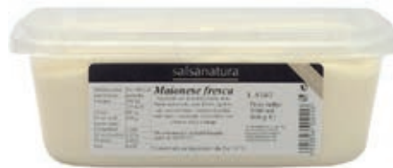
SLS200 MAIONESE CLASSICA ML 1000