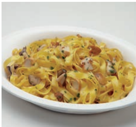
GAM440 TAGLIATELLE AI FUNGHI PORCINI MONOP.