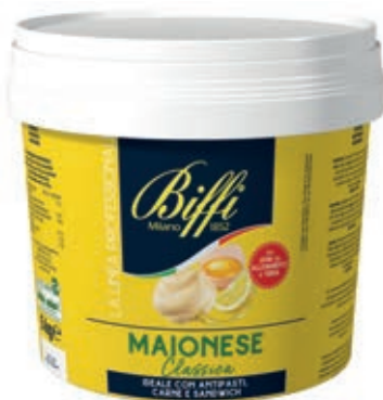
SLS110 MAIO GASTRONOMICA 1 X 5000