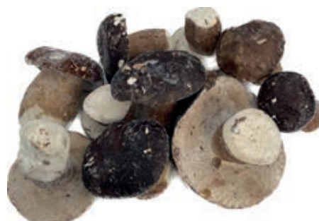
POR100 PORCINO INT. CT G. ROSSI CONG.