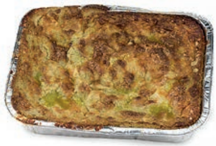
SFO400 SFORMATO DI CARCIOFI VASSOIO