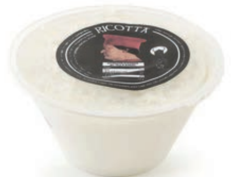
RIC210 RICOTTA DI PECORA