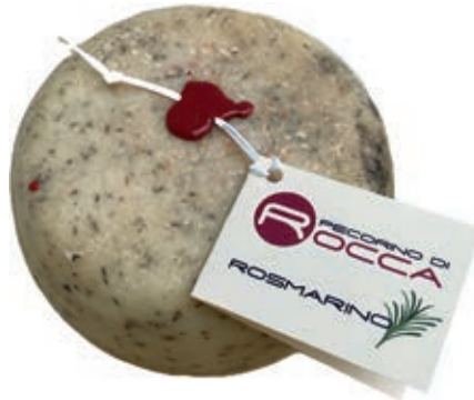
PEP700 PECORINO ROCCA ROSMARINO PALLOTTINO