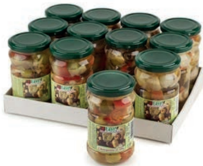
SOT905 ANTIPASTO VERDURE 314 ML