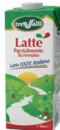
LAT100 LATTE PS