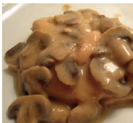
GAM810 PETTO POLLO CON FUNGHI PORCINI MONOP.