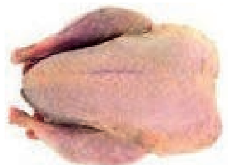
PIU900 PERNICE ROSSA CONG. NR