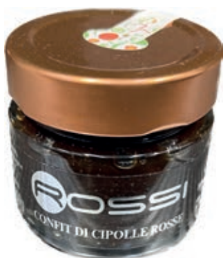
COM200 CONFIT DI CIPOLLE ROSSE GR. 110 X 6