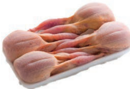
PIU600 QUAGLIE BUSTO CONG.