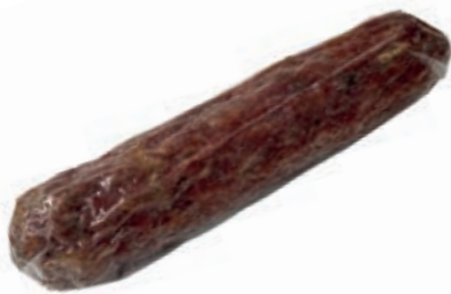
FIN105 SBRICOLONA DI MAIALE RUSTICO 500 GR SV