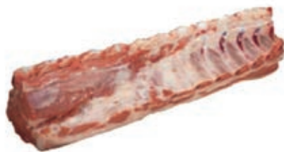
VIT260 LOMBATA ALTERNATIVA OLANDESE