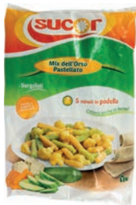
VER950 MIX PASTELLATO