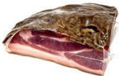
SGN160 SGAMBATO "ADEMARO" 1/4 SV