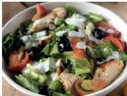
GAB210 INSALATA DI POLLO VASSOIO