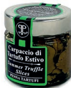
TAR230 CARPACCIO TARTUFO ESTIVO GR. 90