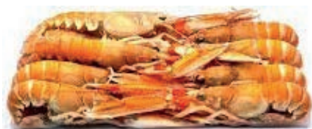
CPE260 SCAMPI 8/12 6X700