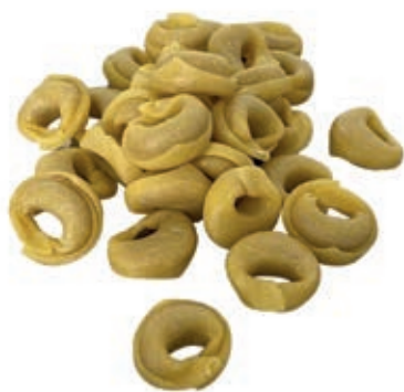
PAS600 TORTELLINI ATM GR 500