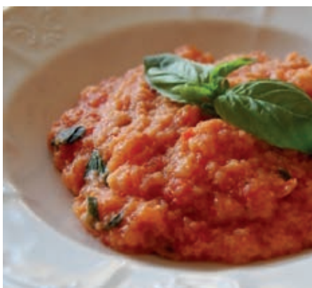
GAM340 PAPPAL AL POMODORO MONOP.