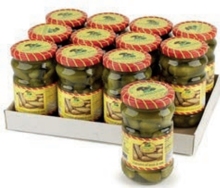
SOT960 CETRIOLINI 314 ML