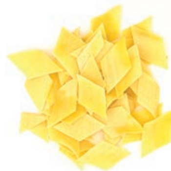
PAS802 MALTAGLIATI ALL'UOVO ROSSI ATM GR 500