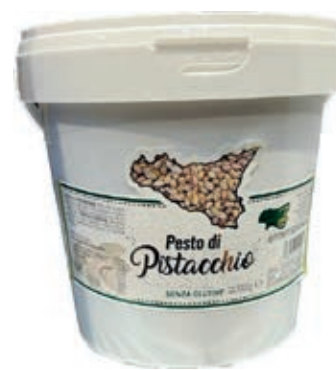
PIS130 PESTO DI PISTACCHIO GR 90