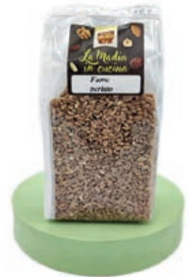
SPZ800 FARRO PERLATO TOSCANA KG 5