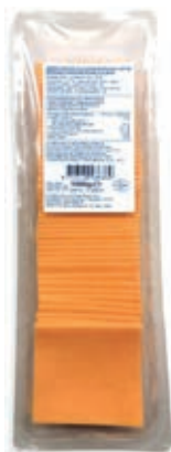
EMM410 CHEDDAR ROSSO 50% FETTINE 1000 GR