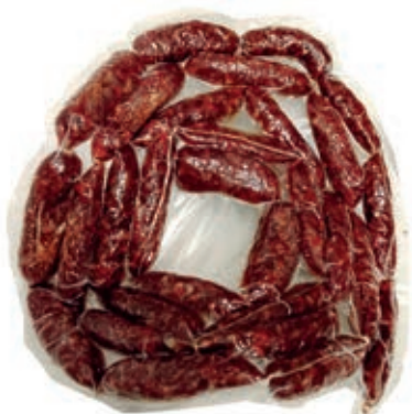
CIN315 SALSICCIA STAGIONATA DI CINGHIALE AL 51%