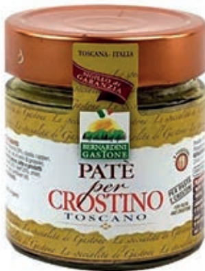
RAG100 PATE' PER CROSTINO TOSCANO 220 GR