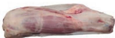
VIT850 MUSCOLO VITELLA DA LATTE OLANDA INTEGRAL