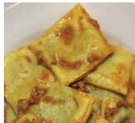
GAM220 RAVIOLI R/S AL RAGU' MONOP.