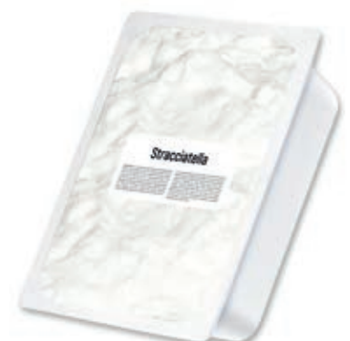
FDL410 STRACCIATELLA MUCCA ROSSI KG 1