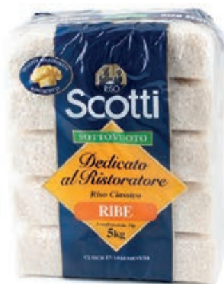
PAS900 RISO FINO PARBOILED KG 1 O.I.