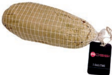
CAP200 CAPOCOLLO FINOCCHIO O.I.