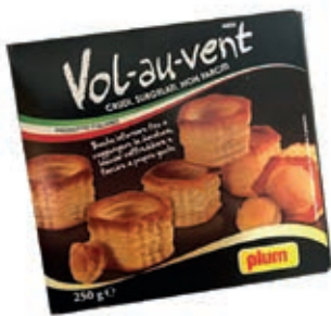
PIZ500 VOL AU VENT 250G 10X250GR PLUM