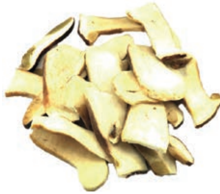
POR310 PORCINO LAMINA 2° CONG. CT