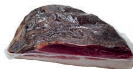
SPA155 SPALLA S/O "ADEMARO" O.I. A METÀ