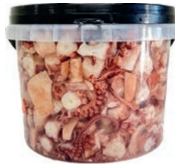
MAR400 POLPO IN SALAMOIA SEC. X 1,50 KG SGOCC.