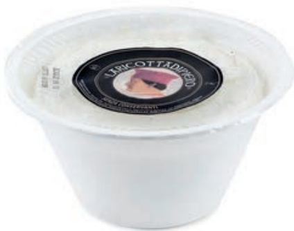
RIC300 RICOTTINA DI PECORA GR 400 C.A.