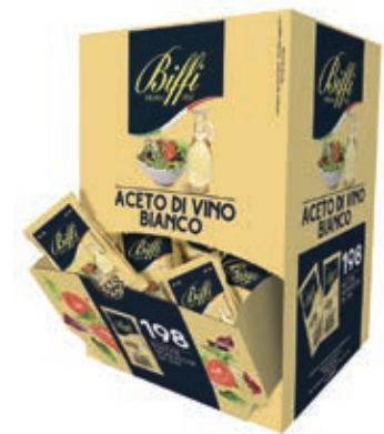
MND105 ACETO DI VINO BIANCO MONODOSE ML 5 X 198