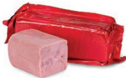
COT770 COTTO TOAST S/P