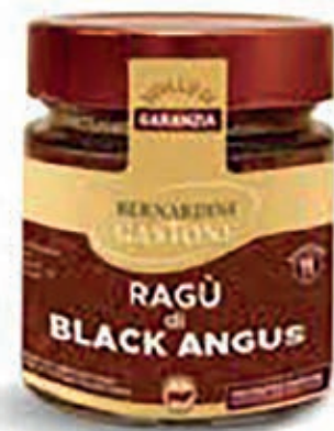
RAG230 RAGÙ DI BLACK ANGUS 220 GR