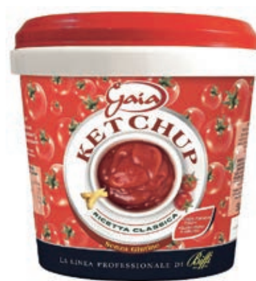
SLS500 KETCHUP GAIA KG 5