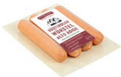
WUR311 WURSTEL S.P. ALTO ADIGE GR100