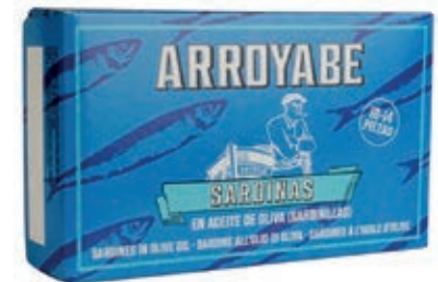
TON900 SARDINE O.O. GR 125