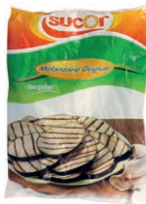
VER300 MELANZANE GRIGLIATE CONG.