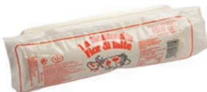
MOZ450 FIORDIL. FILONE KG 1 MORO