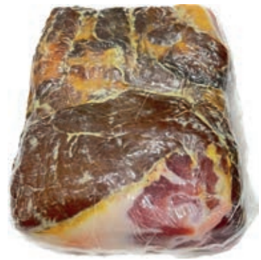
SGE320 SGAMBATO MATTONELLA SCOTENNATO SV ROSSI