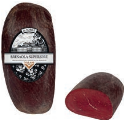
BRE100 BRESAOLA SUPERIORE SV VILLANI