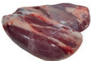
VIT960 MUSCOLO S/O VITELLONE