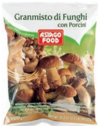
FUN200 FUNGHI GRANMISTO CONG. KG 1