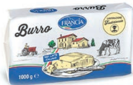
BUR100 BURRO FRANCIA KG 1 O.I.