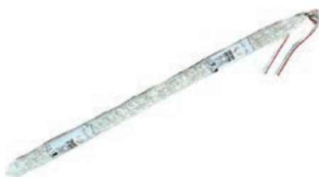
SAL500 SALAME GENTILE MT 1.20 VILLANI