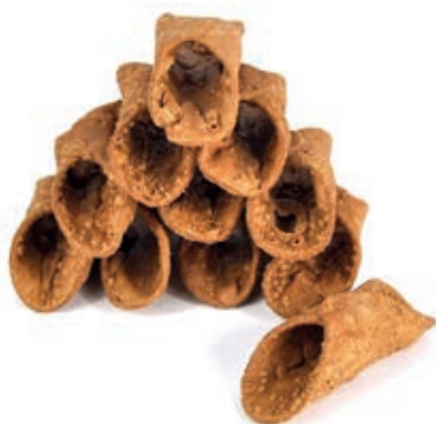
LIE200 CANNOLI MEDI SCURI 100 PZ.