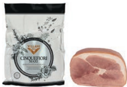
COT200 COTTO 5 F. MAXY PP