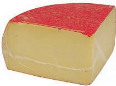
FON200 GOUDA 1/4