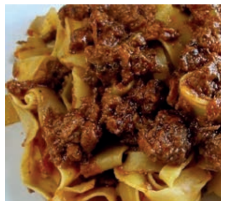
GAM420 PAPPARDELLE AL RAGU' DI CINGHIALE MONOP.