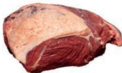
VIT230 LOMBATA SCOTTONA "LA NOBILE" 7/8COSTE SV