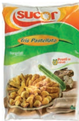
VER960 TRIS PASTELLATO