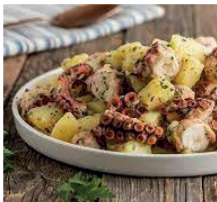
GAD200 POLPO CON PATATE VASSOIO