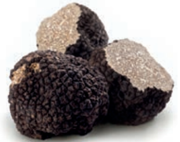
FUN100 TARTUFO ESTIVO CONG. Tuber Aestivum (Pr. UE)