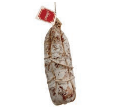
SAL625 SALAME SPAGATO "ADEMARO" KG 1/1,5