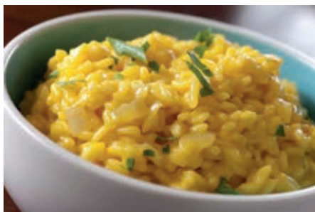
GAM520 RISOTTO ALLA MILANESE MONOP.