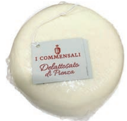
PEF600 PECORINO DELATTOSATO FRESCO