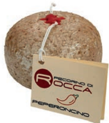
PEP220 PECORINO ROCCA PEPERONCINO PALLOTTINO