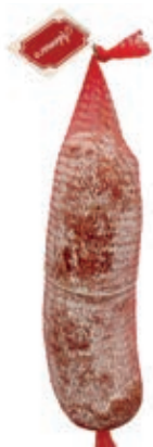
FIN515 SBRICOLONA "ADEMARO" KG 2/3