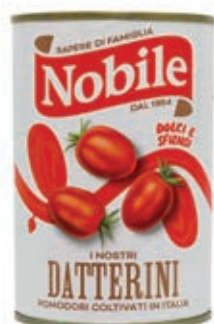
POM511 POMODORI DATTERINO 12X 400 GR