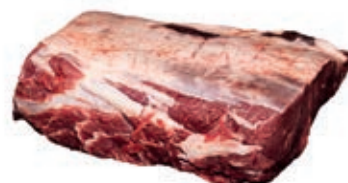
VIT240 CONTROFILETTO B.A.S/V