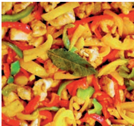
GAM830 POLLO CURRY E PEPERONI MONOP.