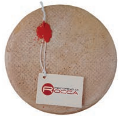
PER210 PECORINO ROCCA ST 22