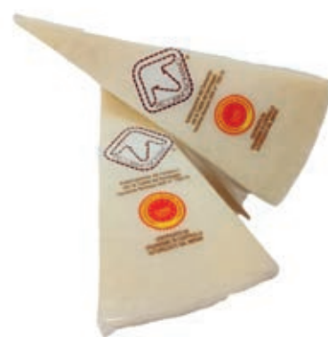
ROM405 PECORINO ROMANO DOP PORZ. GR 300