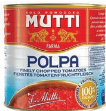
POM400 POMODORI POLPA MUTTI 2.5 KG