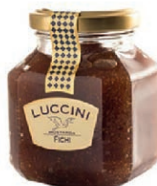
COM100 MOSTARDA FICHI GR 440