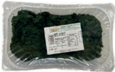
GAV105 RAPE GR 1200