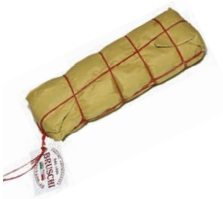
LOM220 LOMBO PEPE BRUSCHI