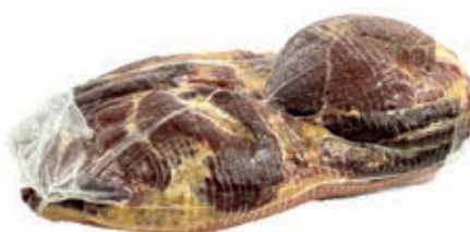
SGE200 SGAMBATO MATTONELLA LAVATO SV