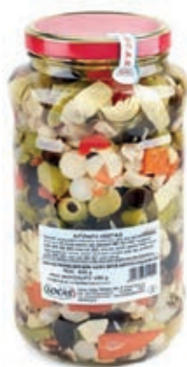
SOT300 ANTIPASTO VEGETALE LOCAS ML 3100