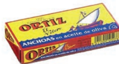
ACC140 FILETTI ACCIUGA SPAGNA O.O. GR 47,5