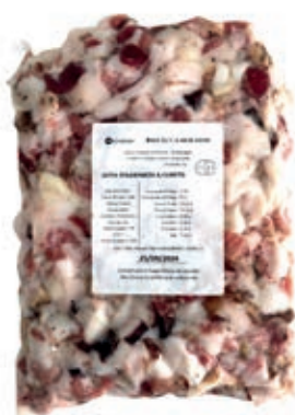
GOT115 GOTA A CUBETTI DA 1 KG