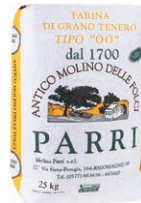
FAR110 FARINA 00 KG 25