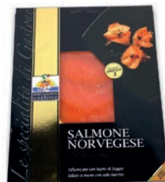
SLM540 SALMONE FETTE GR 100