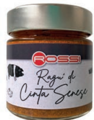
RAG270 RAGÙ DI SUINO RAZZA CINTA SENESE GR 210