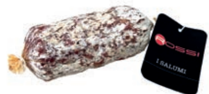
SAL190 SALAME DI FATTORIA KG 0,5