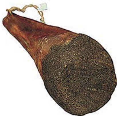
SPA200 SPALLA CON OSSO O.I.