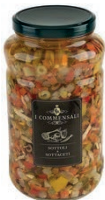
SOT320 MISTORISO SENZA MAIS E WURSTEL ML 3100