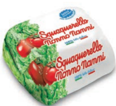
SQU200 SQUAQUERELLO GR. 250