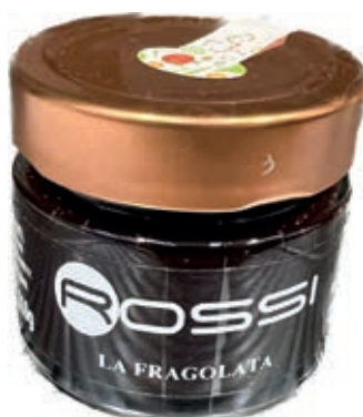
COM230 LA FRAGOLATA GR.110 X 6