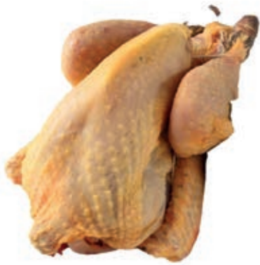
PIU300 FARAONA BUSTO CONG.