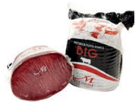
BRE200 BRESAOLA PUNTA ANCA BIG A 1/2 SV