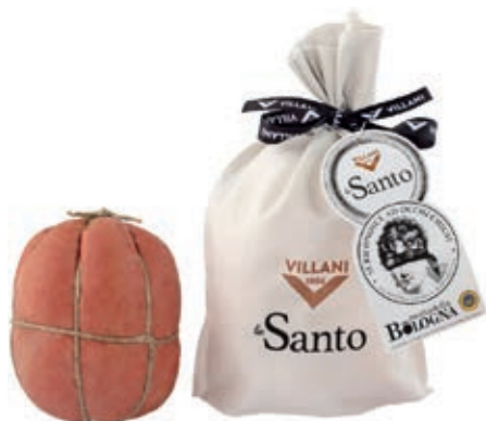
MOS900 MORTADELLA SANTO VESCICA SV X 1