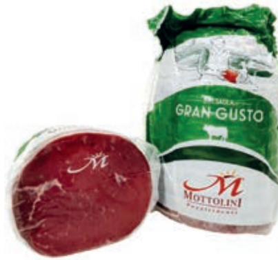
BRE400 BRESAOLA GRAN GUSTO A 1/2 SV