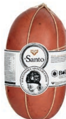
MOS710 MORTADELLA SANTO VN X 10/12 PIST