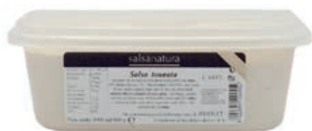
SLS360 SALSА TONNATA 3G KG 1