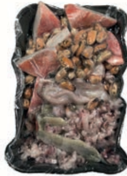
CPE715 ZUPPA DI PESCE PANA 9X800GR VASSOIO SV