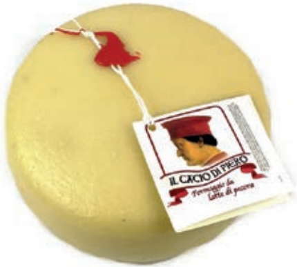
PEF300 PECORINO FRESCO ROSSI O.I.