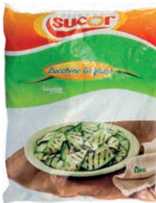
VER210 ZUCCHINE GRIGLIATE CONG.