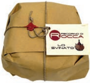
PEA490 PECORINO ROCCA "LO SVINATO"