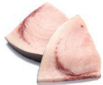
CPE660 PESCE SPADA TRANCI KG 6 MEZZA LUNA 250/400