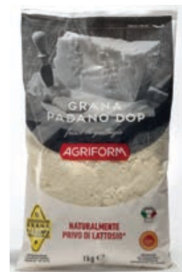
GRA100 GRANA PADANO GRATTUGIATO 1 KG