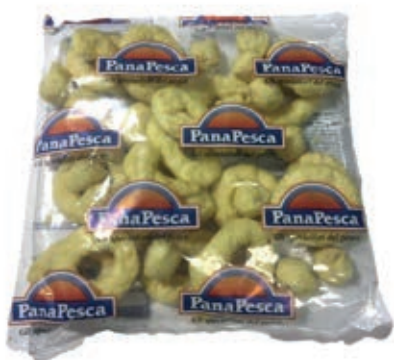
VER975 FRITTO MARE PAST. PANA10X500 GR *BUSTA