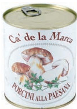
FUG210 FUNGHI ALLA PAESANA 4/4