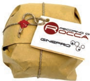
PEP400 PECORINO ROCCA SOTTO GINEPRO PALLOT.