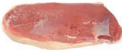
PIU420 OCA FILETTO S/O S/PELLE CONG.