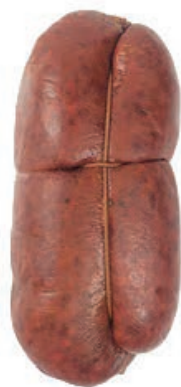
NDU100 NDUJA SPILINGA PICCANTE GR 400 SV