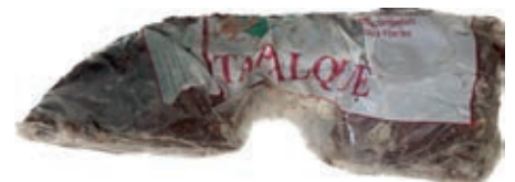
LEP100 LEPRE ARGENT. S/PELLE CONG.