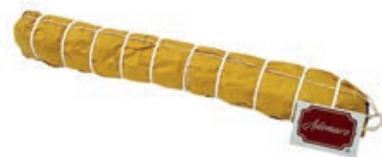
LOM305 LOMBO ADEMARO FINOCCHIO CARTA