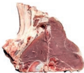
VIT284 LOMBATA SCOTTONA BA FEMM. CROAZIA/ITALIA 18/22 KG