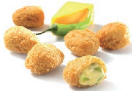
PAT930 CHILI CHEESE NUGGETS KG 1