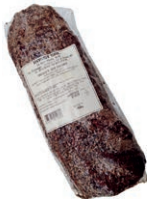
CAP365 CAPOCOLLO ADEMARO FINOCCHIO SV