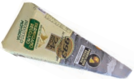
GPR650 PARM. REGG. 24 M. CAS. 993 KG 0,5 INCART