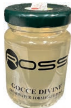
COM210 GOCCE DIVINE GR. 100 X 6