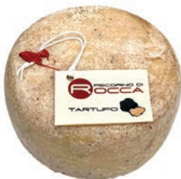
PEA200 PECORINO ROCCA CON TARTUFO