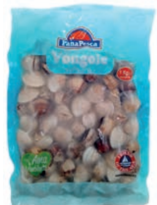
CPE800 VONGOLA PAC. VIET. C/G 60/80 KG 1