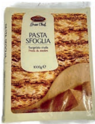
PAS995 PASTA SFOGLIA CONG.