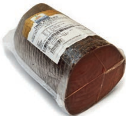
SLM100 TONNO 120