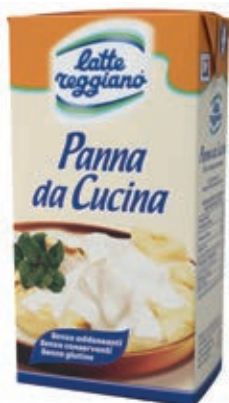
PAN110 PANNA ML 500