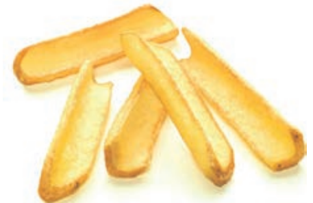
PAT500 PATATE RUSTIC FRIES SKIN-ON KG 2.5