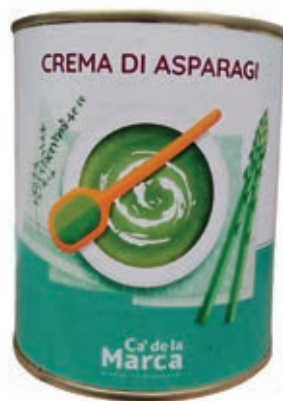
CRE400 CREMA DI ASPARAGI LATTA 4/4