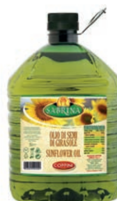
EVO650 OLIO SEMI GIRASOLE PET X 5 COPPINI