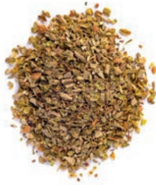
SPZ310 ORIGANO FOGLIE TURCHIA GR 150