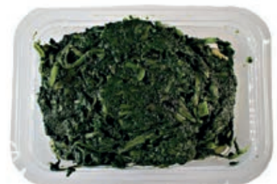
GAV400 ERBETTE GR 400