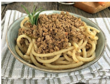
GAM495 PICI AL RAGU' BIANCO DI CINTA MONOP.