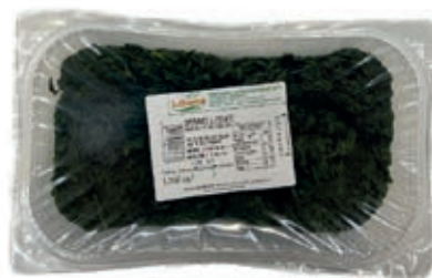
GAV305 SPINACI GR 1200