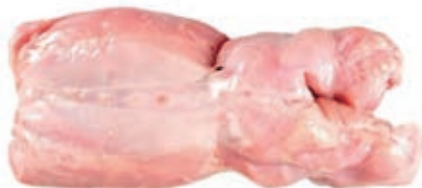
CON200 CONIGLIO DISSOSSATO CONG.