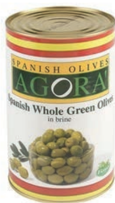
OLI520 OLIVE VERDI DEN. LATTI X 4