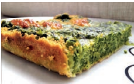
SFO500 SFORMATO DI RAPE VASSOIO