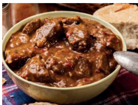
GAM730 STUFATO SANGIOVANNESE MONOP.