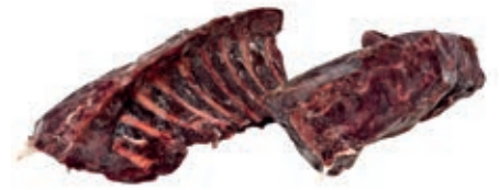
CEC115 LOMBATA C/O CERVO CONG. KG5 CON FILETTO