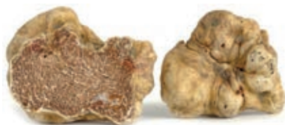
TAR100 TARTUFO BIANCHETTO "Tuber Borchii" (Pr. UE)