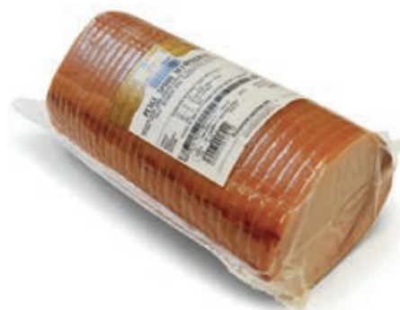
SLM300 PESCE SPADA 120