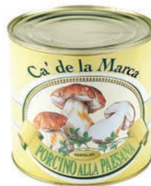
FUG200 FUNGHI ALLA PAESANA 3/1