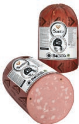
MOS610 MORTADELLA SANTO OV X 14 PIST. 1/2