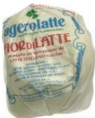
MOZ300 FIORLIL. AGEROLA 10 X 500 GR