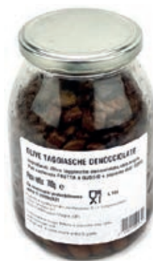
OLI300 OLIVE TAGGIASCHE DENOCC. GR 700 SGOC.