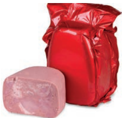
COT760 COTTO ROSSO S/C