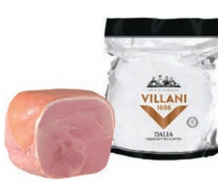
COT520 COTTO DALIA