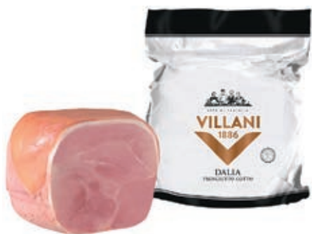
COT530 COTTO DALIA A 1/2