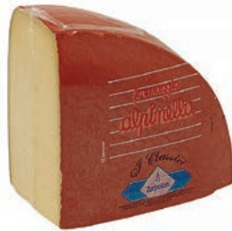
FON300 FONTAL 1/4