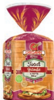
LIE310 TOAST GRANDE 15X500 GR