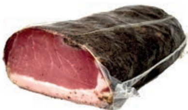
LAR310 LONZARDO A METÀ O.I.