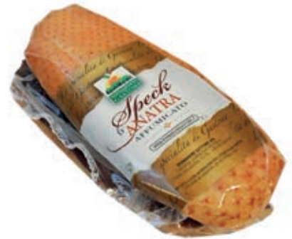
SEL200 ANATRA SPECK AFFUMICATO SV