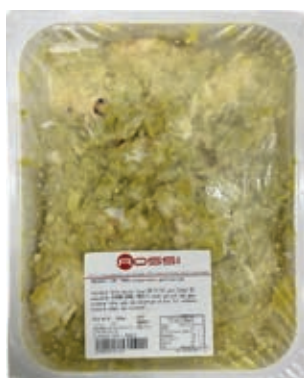
GAD410 BACCALÀ CON PORRI VASSOIO