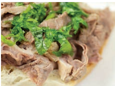
GAC210 LAMPREDOTTO VASSOIO