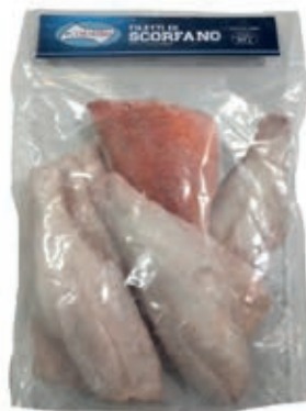
CPE040 SCORFANO ATLANTICO FILETTI C/P C80/250