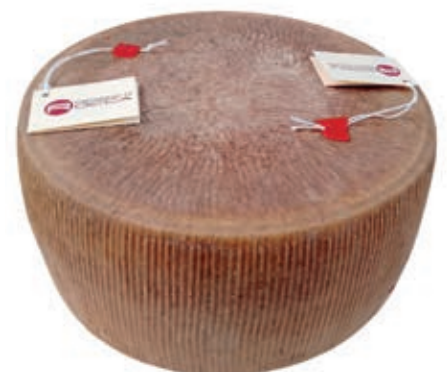
PER110 PECORINO ROCCA GIGANTE 9/11 KG C.A.