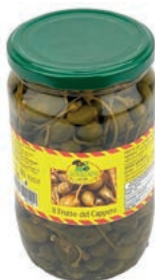
SOT130 CAPPERI CON GAMBO ML 720