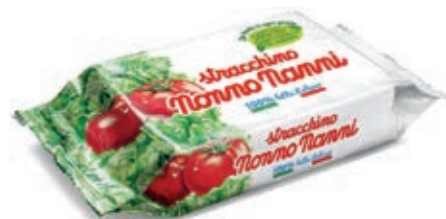
STR225 STRACCHINO NONNO NANNI GR 125 x 10