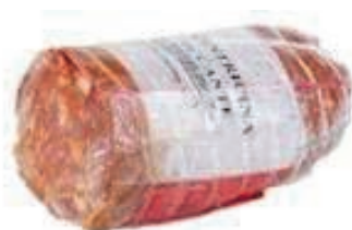
VEN300 VENTRICINA A METÀ TRINITÀ