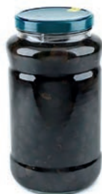
OLI400 OLIVE NERE DENOCC. ML 3100 COMMENSALI