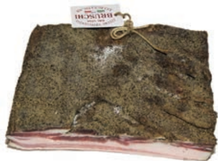
PAN218 RIGATINO SCOSTOLATO 1/2 BRUSCHI