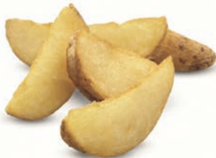
PAT300 PATATE WEDGES SKIN-ON BUCCIA KG 2.5