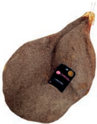
SGE400 SGAMBATO KG 7+ RISERVA