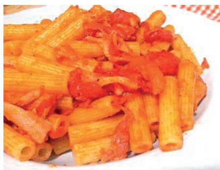
GAM620 PASTA AMATRICIANA MONOP.