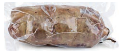
SOP300 BURISTO S.V.