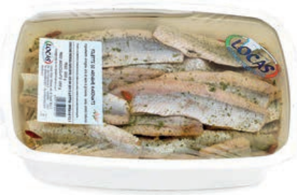
MAR900 LOCAS FIL. ARINGA MARINATA X 2