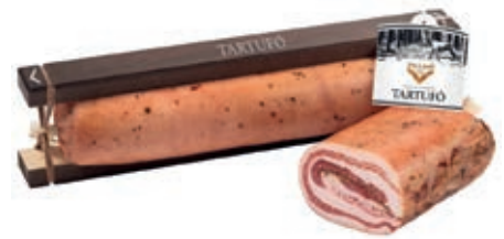
PAN500 PANCETTA STECCATA TARTUFO O.I.