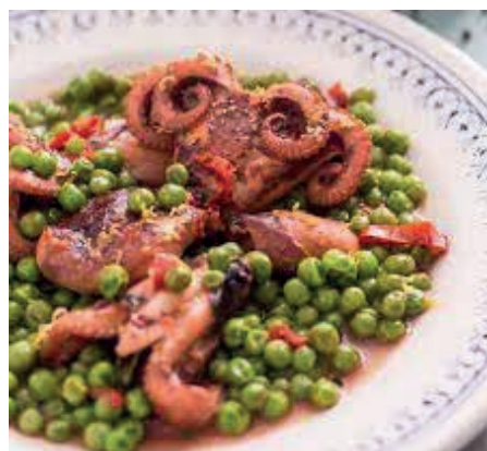
GAD320 MOSCARDINI CON PISELLI VASSOIO