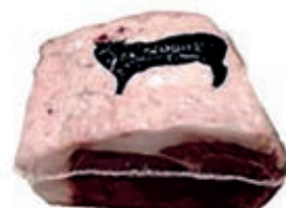
VIT440 RIB EYE SCOTTONA "LA NOBILE" SV