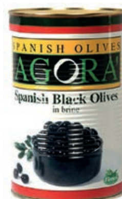
OLI500 OLIVE NERE INT. LATTA KG 4