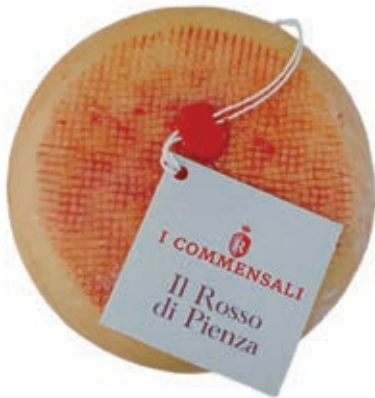
PES200 PECORINO ROSSO DI PIENZA