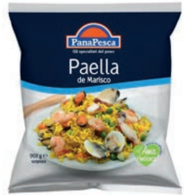
CPE706 PAELLA 6X900