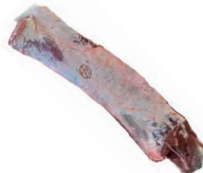
VIT200 LOMBATA VITELLONE 8 COSTE SPAGNA