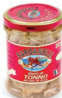
TON410 TONNO VETRO O.O. S.F. GR 190 SARDANELLI