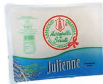
MOZ820 FIORDIL. PREZIOSA BAGNO ITALIA GR 200X5