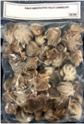
CPE407 POLIPETTI 30/60 IQF GR 800