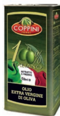
EVO100 OLIO E.V.O. ITALIA LAV. A FREDDO 5LT LATTA