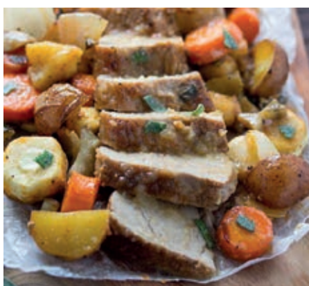
GAM800 FESA TACCHINO CON VERDURE MONOP.