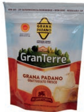
GRA300 GRANA PADANO GRATTUGIATO 100 GR