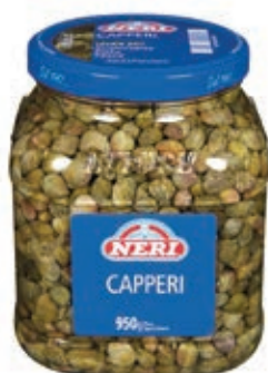
SOT150 CAPPERI ACETO 12/13 ML 1500