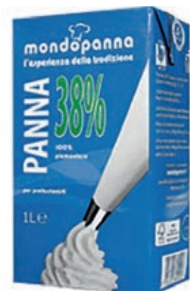
PAN130 PANNA MONDO UHT 38% 1 LT