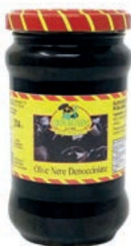
SOT985 OLIVE NERE DENOCCIATE 314 ML