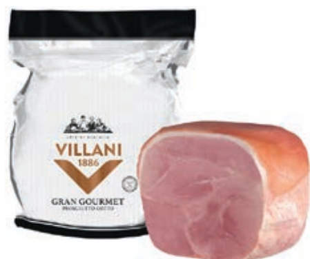
COT500 COTTO GRANGOURMET