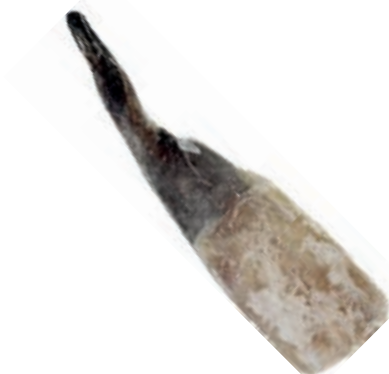
CPE640 CODA RANA PESCE 300/500 KG 8