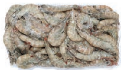
CPE235 MAZZANCOLLA INT. 40/50 GR 900