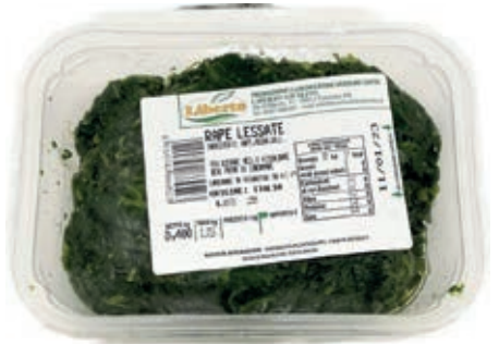
GAV100 RAPE GR 400