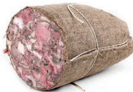
SOP110 SOPRASSATA IN BALLA 1/2 PREZZ.O.I.