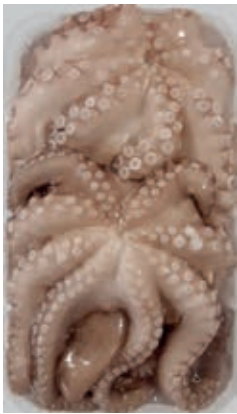
CPE415 POLPI M.500/1000 VASCH.(14 KG CA) PVN