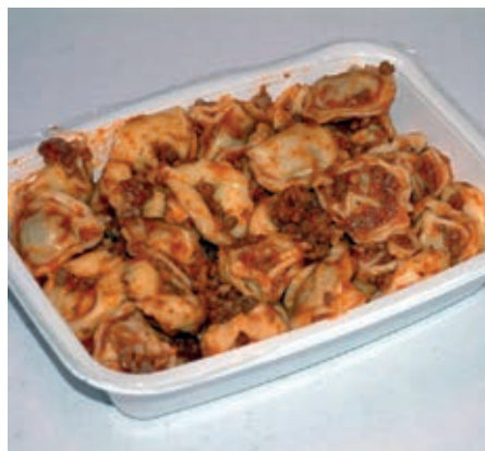
GAM100 TORTELLINI AL RAGU' MONOP.