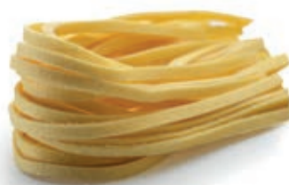
PAS820 TAGLIOLINI ALL'UOVO ROSSI ATM GR 500