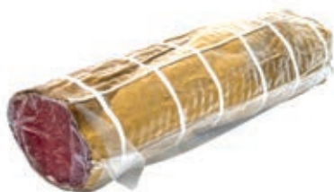
LOM310 LOMBO ADEMARO PEPE A METÀ SV