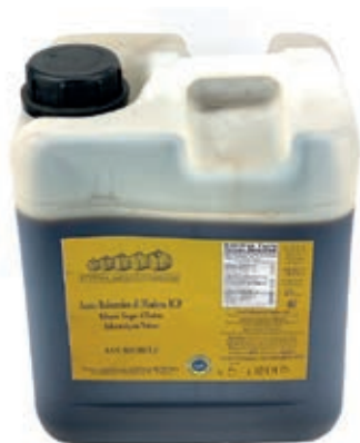
ACE100 ACETO BALSAMICO 5 LT