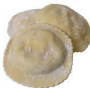
PAS750 GIRASOLE AL TARTUFO ROSSI ATM GR 500