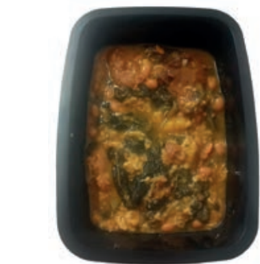
GAM330 RIBOLLITA MONOP.