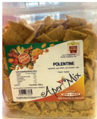
FRS660 POLENTINE CHIPS KG 1