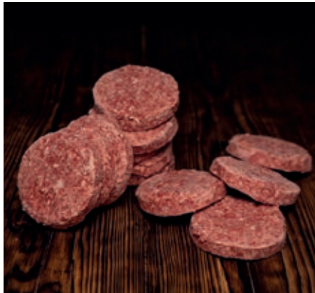
HAM600 HAMBURGER CONG. SCOTT."LA NOBILE" 12PZ