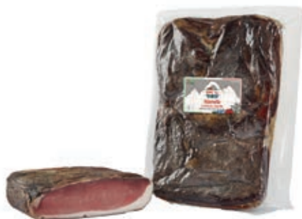
SPE200 SPECK 4 S. ADAMELLO A 1/2 SV