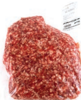
SAL915 SALSICCIA IMPASTO B.