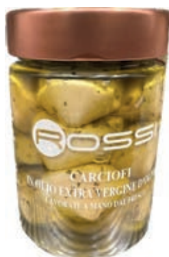
GIA300 CARCIOFI IN OLIO EVO GR 320 X 6