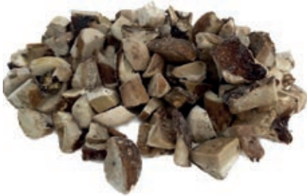
POR402 PORCINO CUBO MK CT ROSSI CONG.