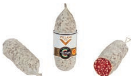
MIL500 CACCIATORE DOP X 170 GR SV X 10 PZ