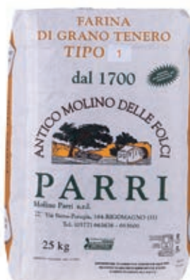
FAR130 FARINA TIPO 1 25 KG