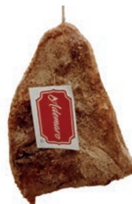
GOT120 GOTA "ADEMARO" O.I.