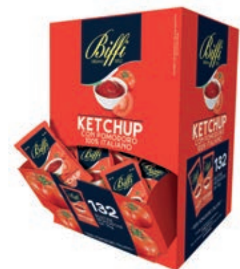
MND400 KETCHUP GR 10 X 132