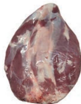
VIT950 CAMPANELLO S/V VITELLONE