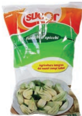
VER550 FINOCCHI CONG.