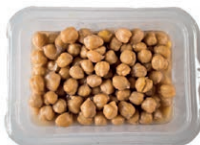
GAV605 CECI GR 1200