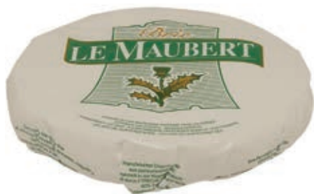
BRI100 BRIE' MAUBERT 60% 1 KG