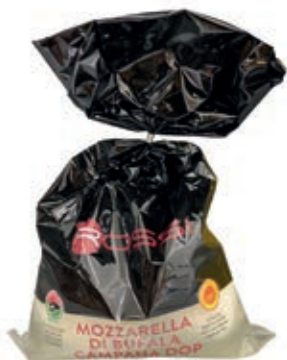
BUF400 MOZZ. BUFALA 1 X 250