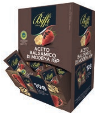
MND100 ACETO BALSAMICO MONODOSE GAIA ML 5 X 198