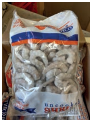
CPE246 MAZZANCOLLE TROPICALI SGUSC. 41/50 GR 1000