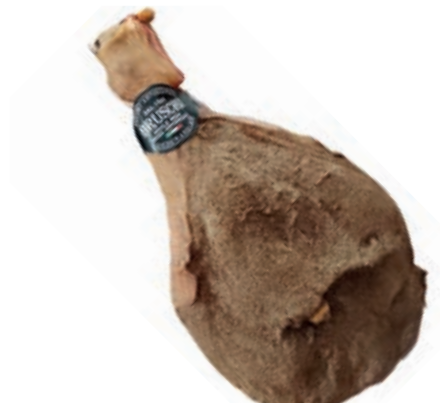
PRO452 PROSCIUTTO CON OSSO RISERVA BRUSCHI