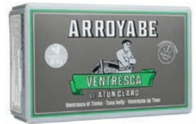
TON750 VENTRESCA YELLOWFIN GR 120 LATTA