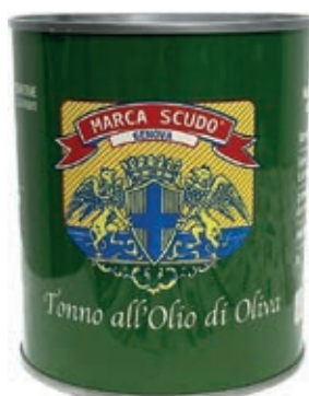
TON200 TONNO GR 800 LATTA