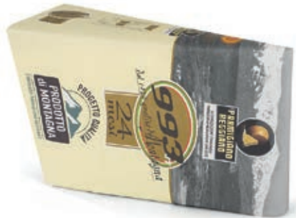
GPR500 PARM. REGG. 24 M. CAS. 993 KG 1 INCART