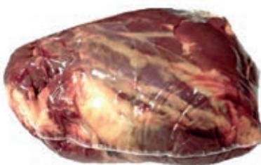
VIT780 ALETTE DI SPALLA