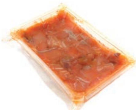
SLM520 SALMONE RITAGLI GOURMET GR 500