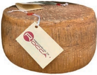
PER115 PECORINO ROCCA GIGANTE 5/6 KG C.A.