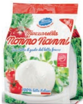
STR215 MOZZARELLA NONNO NANNI GR 125 x 8