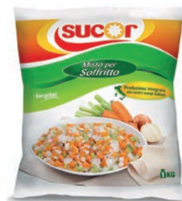
VER990 MISTO SOFFRITTO