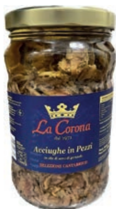
ACC150 FILETTI ACCIUGA PEZZI ML 1700