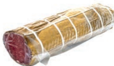
LOM315 LOMBO ADEMARO FINOCCHIO A METÀ SV