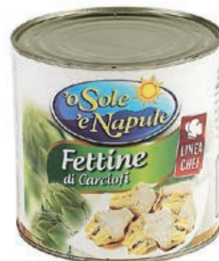
CAR320 CARCIOFI FETTE NATUR. X 2.5