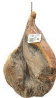
SGN200 SGAMBATO N. CASA NORCIA O.I.