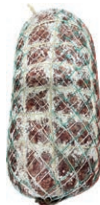
FIN200 SBRICOLONA DI FATTORIA KG 20 C.A O.I.