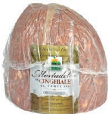
CIN400 MORTADELLA CON CINGHIALE TART.