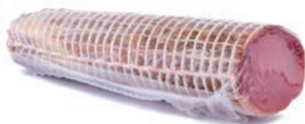
LOM110 LOMBO A METÀ O.I.