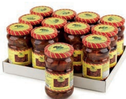
SOT920 POMODORI SECCHI 314 ML