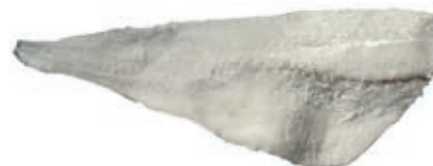
BAC200 FIL. BACCALÀ COD GADUS MORHUA 4/7 KG 5