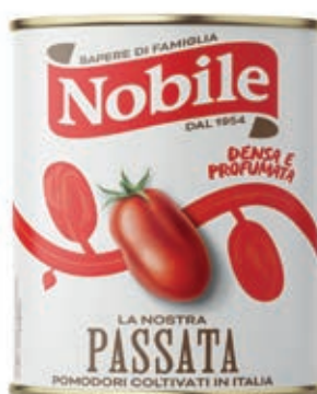
POM410 POMODORI PASSATA 6 X 3 O.I.