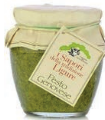
PST300 PESTO ALLA GENOVESE GR 130