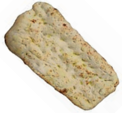
PIZ210 SCHIACCIATA TOSCANA GR.1000