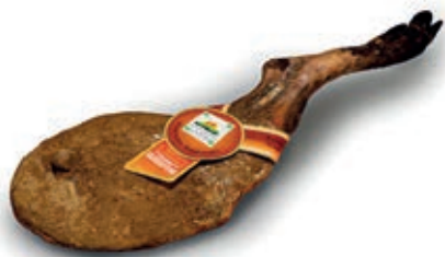
CIN110 CINGHIALE PROSCIUTTO C/OSSO