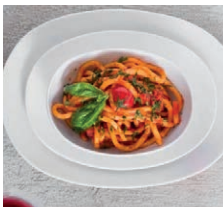
GAM470 PICI ALLA CARRETTIERA MONOP.