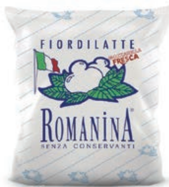
MOZ200 FIORLILATTE FRANCIA ROMANINA