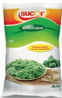
VER715 SPINACI FOGLIA CONG.