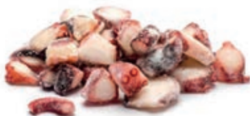
CPE375 TENTACOLI TOTANO COTTI GR 800