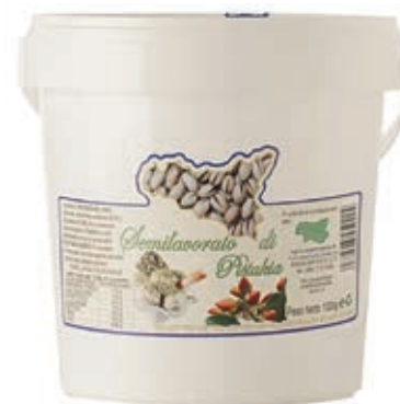
PIS100 PASTA PURA PISTACCHIO KG 1