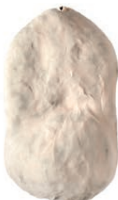
SGE110 SGAMBATO GRANFESA STUCCATO