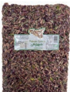
PIS200 PISTACCHI SGUSCIATI KG 1