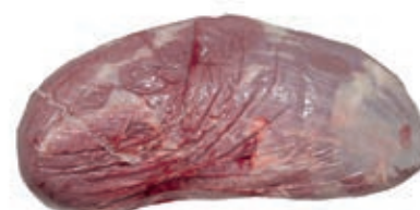
VIT920 MAGATELLO (GIRELLO) PAD SV VITELLONE