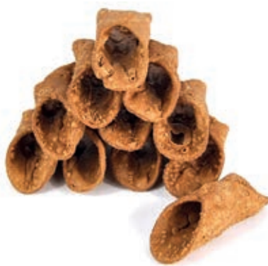
LIE210 CANNOLI MIGNON SCURI KG 3.5