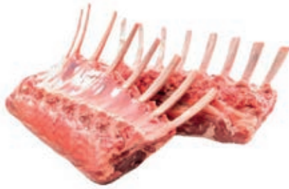
AGN100 AGNELLO CARRE SCALZATO CONG.