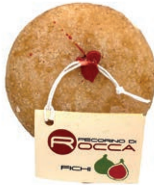
PEP350 PECORINO ROCCA FICHI PALLOTTINO