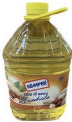
EVO700 OLIO ARACHIDE PET X 5