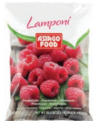
FRU600 LAMPONI CONG. KG.1