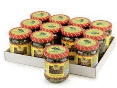
SOT940 CAPPERI OCCHIELLO 212 ML