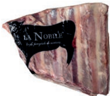
VIT750 ASADO B.A. SCOTTONA LA NOBILE