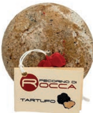
PEP200 PECORINO ROCCA PALLOT. CON TARTUFO