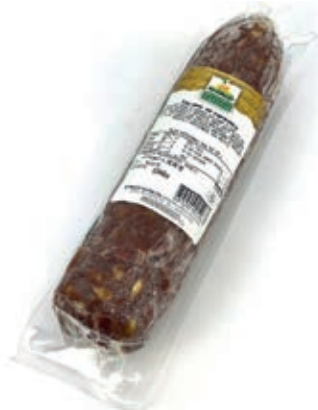
DAI200 CAPRIOLO SALAME SV B