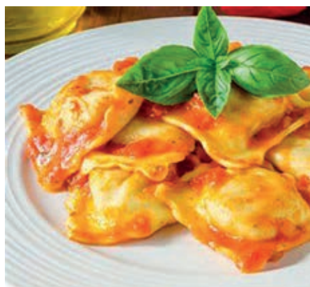
GAM210 RAVIOLI RICOTTA SPINACI AL POMOD. MONOP.