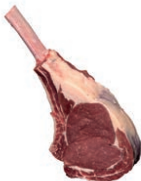
VIT450 TOMAHAWK SCOTTONA "LA NOBILE" SV