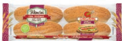
LIE305 HOT DOG SESAMO 8X300 GR