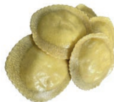
PAS755 GIRASOLE GIG. C/BURRATA ROSSI ATM GR 500