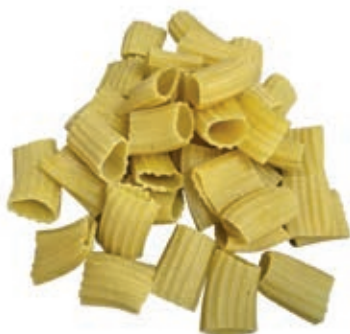
PAS860 RIGATONI ROSSI ATM GR 500