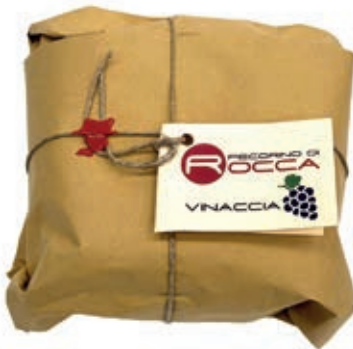
PEA410 PECORINO ROCCA SOTTO VINACCIA