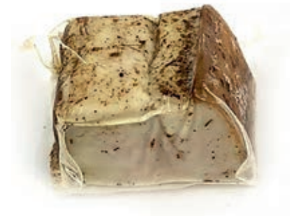
LAR220 LARDO TRANCETTI GR 300/500 SV