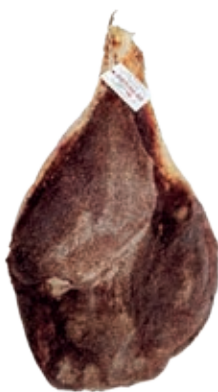
SGN450 SGAMBATO T/SPECK BRUSCHI