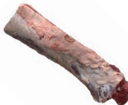
VIT274 LOMBATA SCOTTONA SPAGNA FEMMINA 18/21 KG