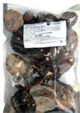
POR205 PORCINO CAPPE KG 1 ROSSI CONG.