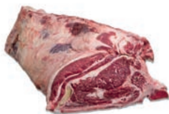
VIT297 LOMBATA VACCA DK GRASSO 3/4+MAREZZATA