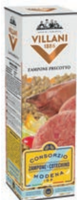
PRE500 ZAMPONE PRECOTTO RISERVA SCAT. O.I.