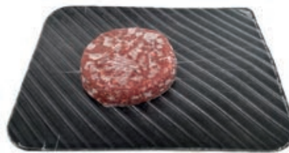
TRT300 TARTARE SCOTTONA POLACCA GR160X10PZ CONG