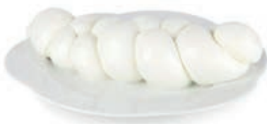
BUF220 MOZZ. BUFALA TRECCIA KG 1