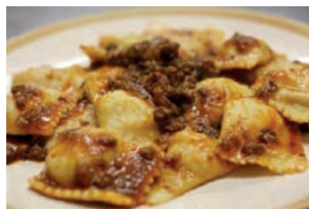
GAP150 TORTELLI DI PATATE AL RAGU' VASSOIO