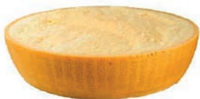
GPR210 PARM. REGG. 24 M. CAS. 993 A METÀ CERIM