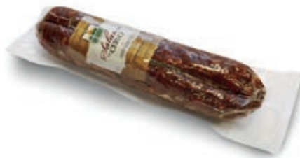
CER220 CERVO SALAME GR 500 S/V