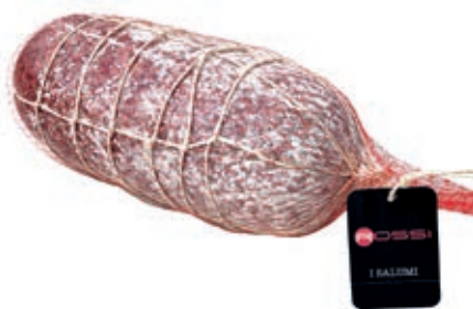
FIN202 SBRICOLONA DI FATTORIA KG 10 C.A.