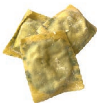
PAS700 RAVIOLI MAREMMANI ROSSI ATM GR 500