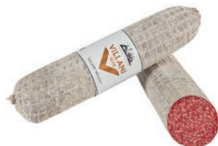
MIL200 SALAME MILANO EXPORT PS VILLANI