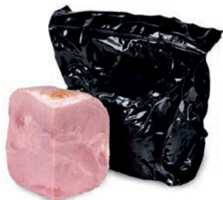
COT740 COTTO NERO A 1/4