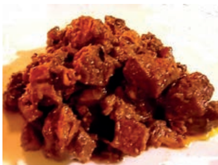
GAC300 STUFATO ALLA SANGIOVESANESE VASSOIO