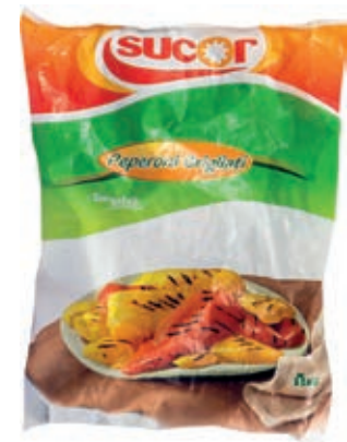
VER310 PEPERONI GRIGLIATI CONG.