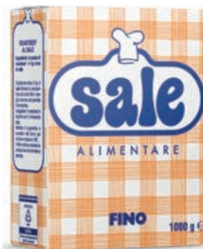
SPZ910 SALE MARINO FINO KG. 1