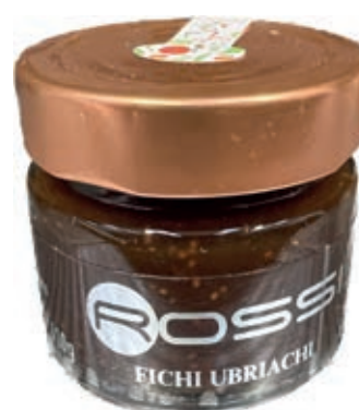
COM280 CONFETTURA DI FICHI UBRIACHI GR110 X 6