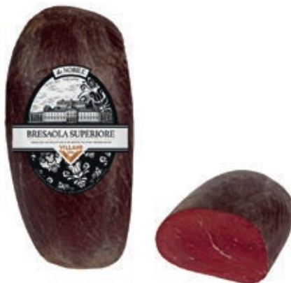
BRE150 BRESAOLA SUPERIORE SV A 1/2 VILLANI