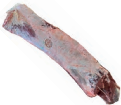
VIT203 LOMBATA SPAGNA ARRIVO 25/30 KG