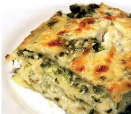
GAM320 LASAGNE VEGETARIANE MONOP.