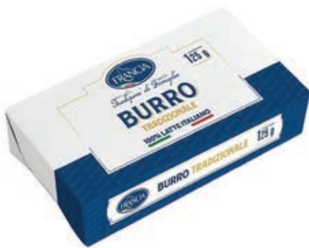
BUR120 BURRO FRANCIA GR 125 O.I.