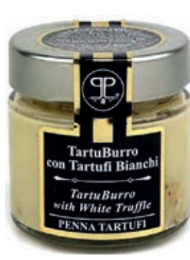
TAR610 BURRO TARTUFO BIANCO GR 90