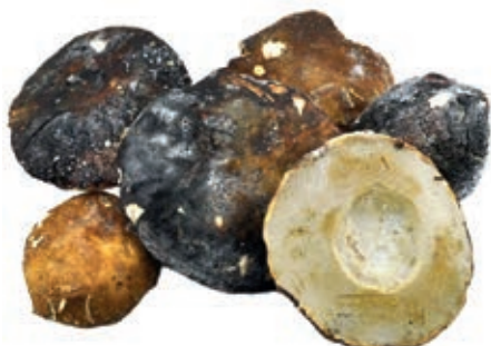
POR200 PORCINO CAPPE G EXTRA CONG. CT