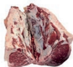
VIT410 T-BONE SCOTTONA "LA NOBILE" S/V MAREZZATO