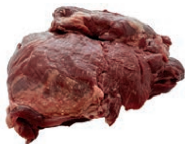
CIC305 POLPA EXTRA CINGHIALE CONG. KG 2,5