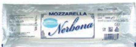
MOZ430 FIORDIL. NERBONA FILONE