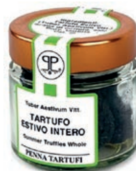
TAR200 TARTUFO ESTIVO GR. 40/50