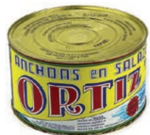
ACC720 ACC. SPAGNA KG 5 ORTIZ (11 P)