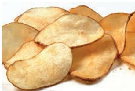
PAT600 SFOGLIE DI PATATE KG 2