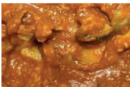
GAS310 SUGO AI FUNGHI PORCINI VASSOIO