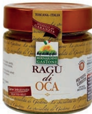
RAG260 RAGÙ DI OCA 220 GR