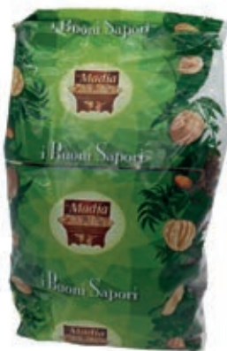
FRS400 UVETTA SULTANINA KG 1