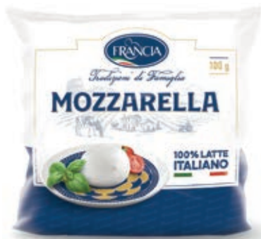
FDL200 MOZZ. FDL FRANCIA GR 100 O.I.