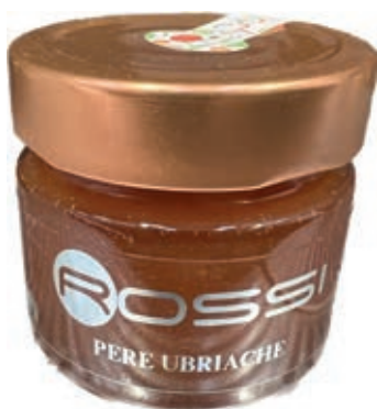
COM290 CONFETTURA DI PERE UBRIACHE GR110 X 6