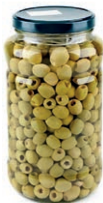
OLI410 OLIVE VERDI DENOCC. ML 3100 COMMENSALI