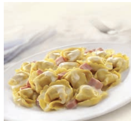
GAM110 TORTELLINI PANNA E PROSCIUTTO MONOP.