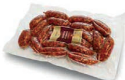
CIN300 SALSICCIA CINGHIALE GR 700 SV