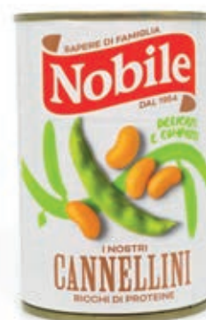
LEG111 CANNELLINI 12 X 0.4