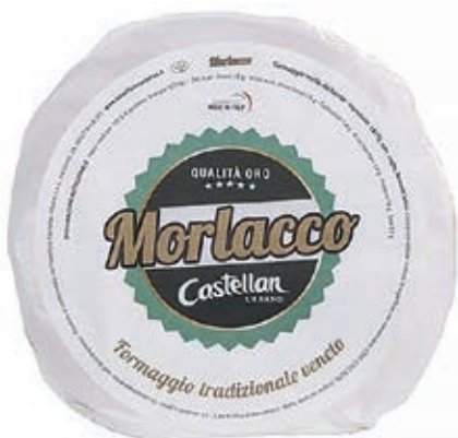
CAS500 MORLACCO BABY KG 2.5