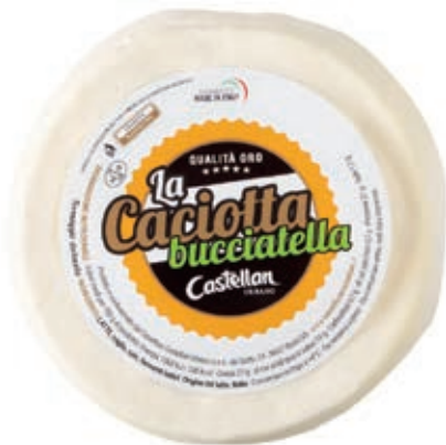
CAS110 CACIOTTA BUCCIATELLA KG 1.1