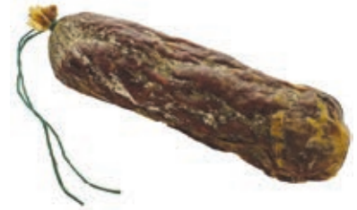
CER225 SALAME DI CERVO INTERO 250 GR SV