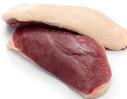
PIU210 ANATRA PETTO CONG.