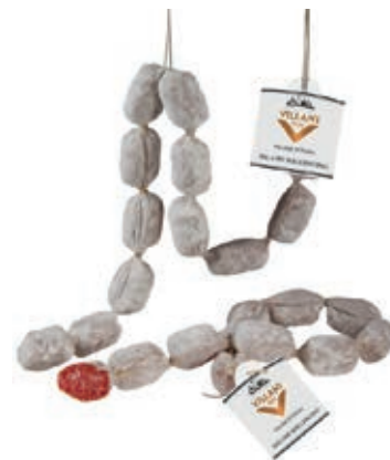
MIL510 SALAMINI BOCCONCINI VILLANI