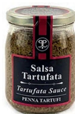
TAR350 SALSA TARTUFO GR 500 5%