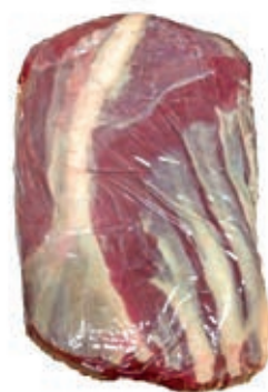
VIT265 CUBEROLL B.A. S/V