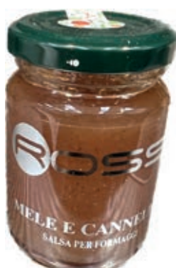
COM270 CONFETTURA DI MELE E CANNELLA GR110 X 6