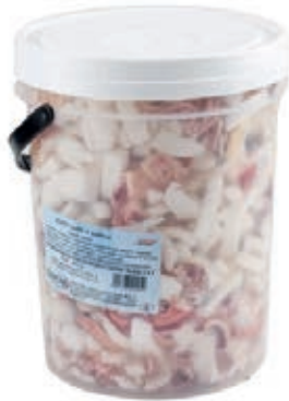
MAR110 LOCAS MISTO MARE S.C. NAT. X 3 KG SGOCC.