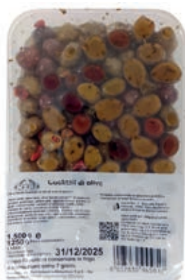
OLI600 OLIVE MISTE MARINATE KG 1,5