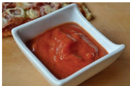
GAS340 SUGO ROSSO PICCANTE VASSOIO