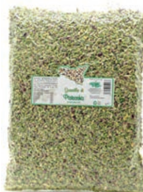
PIS210 GRANELLA DI PISTACCHIO KG 1