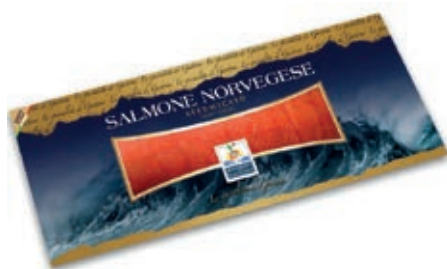
SLM500 SALMONE PREF. NORV. KG 1