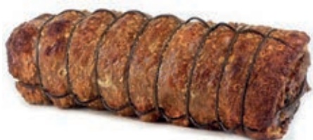
GAC100 TRONCONE DI SUINO IN PORCHETTA INT. O.I.