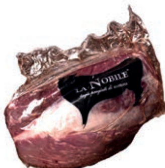
VIT460 FILETTO TESTA SCOTTONA "LA NOBILE"