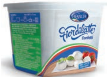
FDL120 MOZZ. FDL GR 10 O.I.