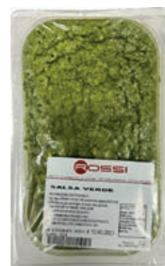
GAS330 SALSA VERDE VASSOIO