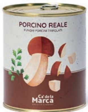
FUG100 FUNGHI PORCINI REALE TRIF. 4/4