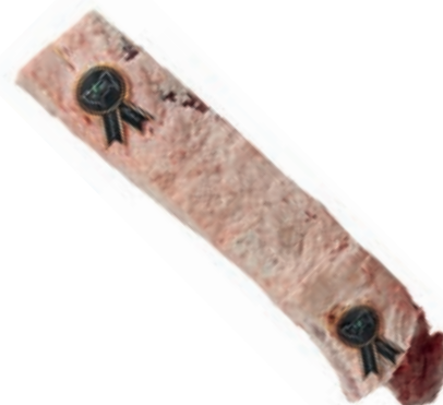
VIT281 LOMBATA SCOTTONA "LA NOBILE" APPESSA 18/22 KG