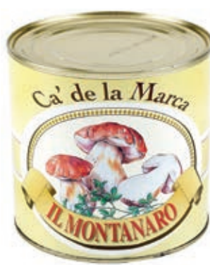
FUG300 FUNGHI MONTANARO TRIF. 3/1