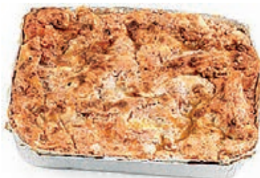
GAP100 LASAGNE AL RAGU' VASSOIO