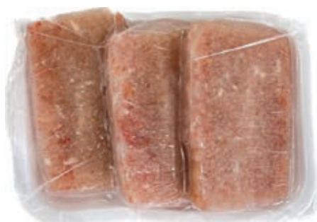
CPE255 POLPA DI GRANCHIO VERA GR 450 P.COTTA