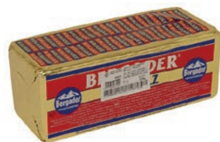
ERB510 BERGADER BLU QUADRATO INTERO