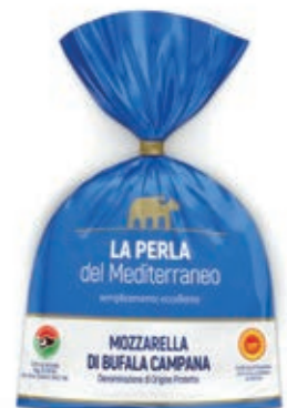
BUF390 MOZZ. BUFALA DOP 1 X 500 GR