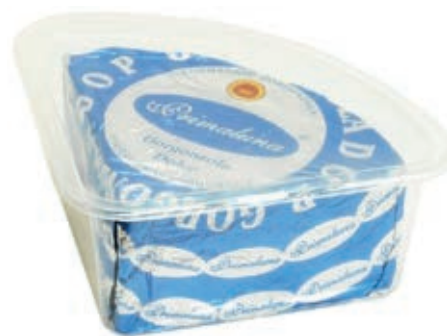
ERB200 GORGONZOLA DOP PRIMA LUNA A 1/8