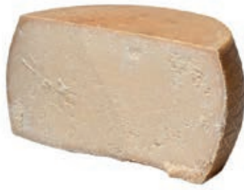
GRP210 GRANA PADANO CONF. 1/2