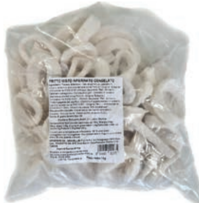
CPE740 FRITTO MISTO INFAR. KG 1