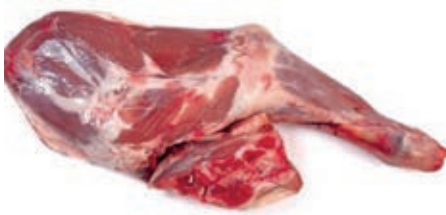
AGN200 AGNELLO COSCIA NZ CONG.