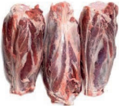
MAI600 SUINO STINCO PZ. 2 A 1/2 SV CONG.