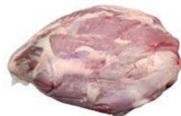
VIT870 CAMPANELLO DI VITELLA DA LATTE OLANDA