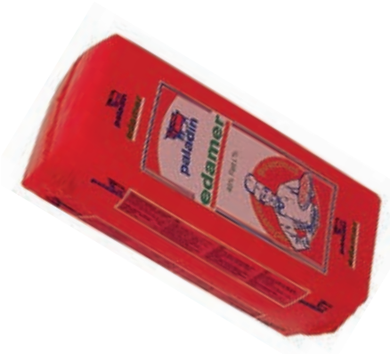
FON100 EDAMER PALADIN