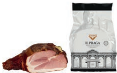
COT040 COTTO PRAGA C/O O.I.