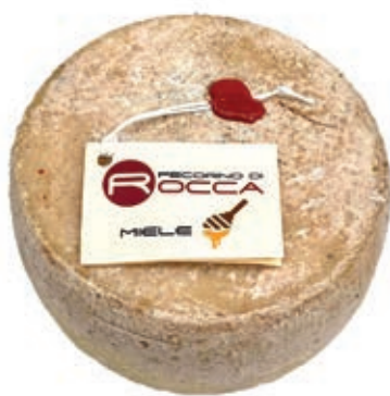
PEA300 PECORINO ROCCA CON MIELE