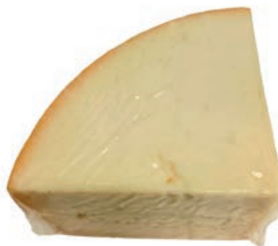
PER105 PECORINO ROCCA GIGANTE 1/8