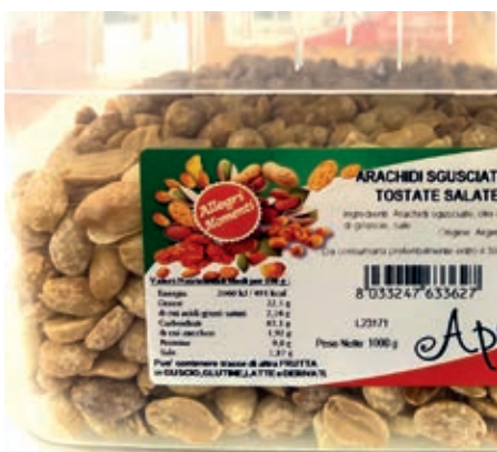
FRS620 ARACHIDI SGUSCIATE TOSTATE KG 1