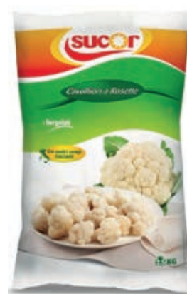
VER810 CAVOLFIORE CONG.