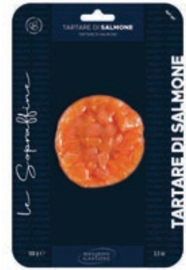
TRT840 TARTARE DI SALMONE GR 100