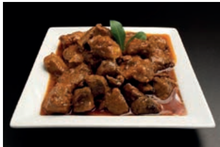
GAC320 SPEZZATINO DI CINGHIALE VASSOIO