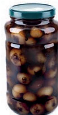
SOT200 CIPOLLE ACETO BALSAMICO ML 3100 COMMENSALI