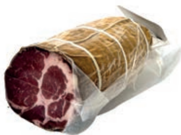
CAP367 CAPOCOLLO ADEMARO FINOCCHIO 1/2 SV