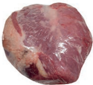
VIT930 SCAMONE A CUORE SV VITELLONE