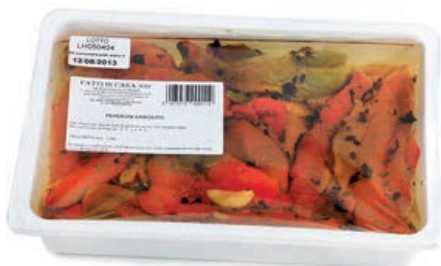
SOT820 PEPERONI ARROSTITI KG 1.350