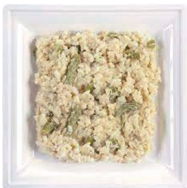
GAP330 RISO AGLI ASPARAGI VASSOIO