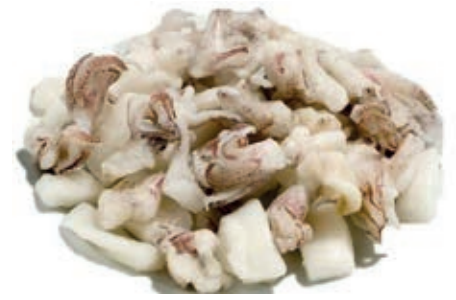
CPE300 ANELLI E CIUFFI CALAM. GR 850