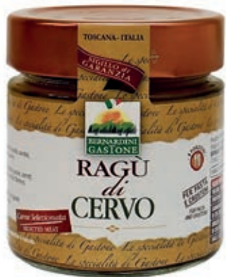
RAG240 RAGÙ DI CERVO 220 GR