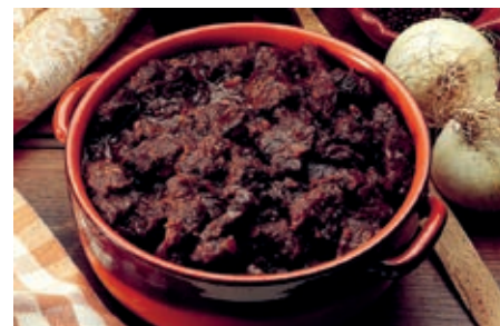
GAC310 PEPOSO VASSOIO