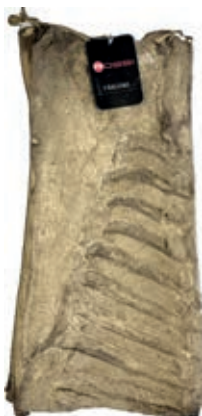
PAN200 RIGATINO N. ROSSI O.I.