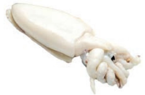
CPE465 SEPIA INDIA U/1 IFQ 20% KG 8