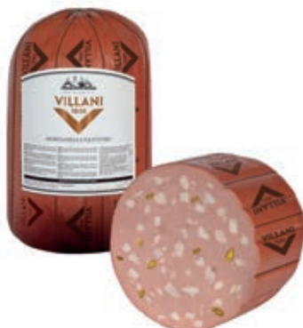
MON110 MORTADELLA NETTUNO PIST X 14 A 1/2