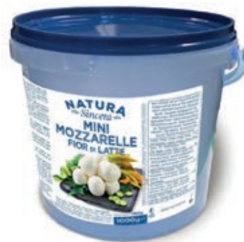
FDL100 MOZZ. FDL SABELLI GR. 8