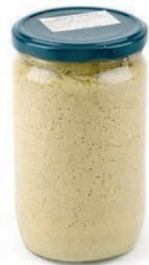
CRE410 CREMA DI ASPARAGI GR 580