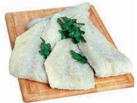
CPE120 BACCALÀ FIL.TRANCIO 400 GR PESO F. CONG