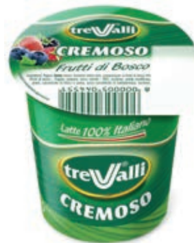
YOG200 YOGURT FRUTTI DI BOSCO ML 125 O.I.