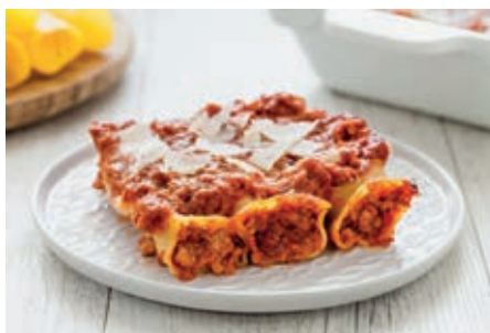
GAM270 CANNOLI POMODOR/RAGU' MONOP.