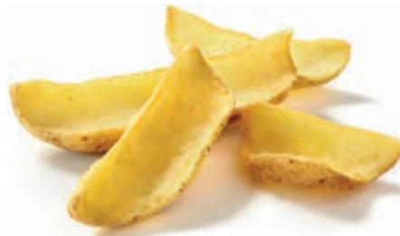
PAT400 PATATE DIPPERS - SKIN-ON KG 2.5