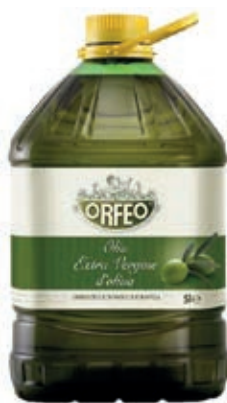
EVO200 OLIO E.V.O. LT 5 ORFEO UE PET