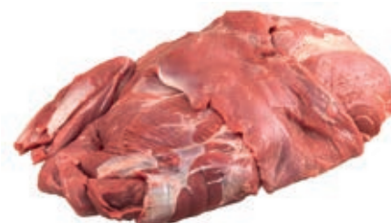
CIC300 CINGHIALE POLPA EXTRA CONG.