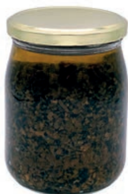
TAR410 PATE' TARTUFO NERO ESTIVO GR.500