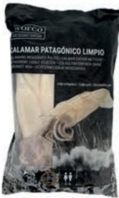
CPE310 CALAMARO PATAG. PUL. GR 900