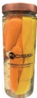
GIA110 GIARDINIERA IN AGRODOLCE GR. 1000 X 6