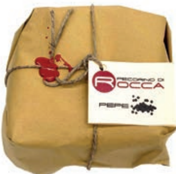
PEA440 PECORINO ROCCA SOTTO PEPE NERO