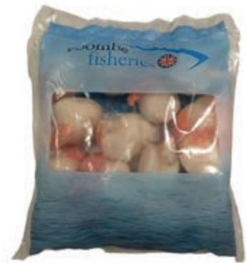
CPE030 CAPPESANTE ATLANTIC. SGUSC 8/12UK10X600PP