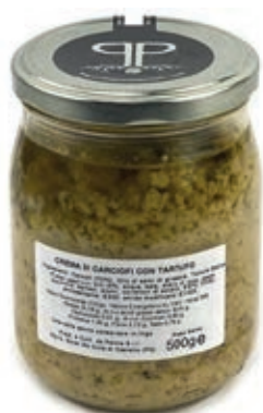
TAR520 CREMA CARCIOFI E TARTUFO GR 500 5%