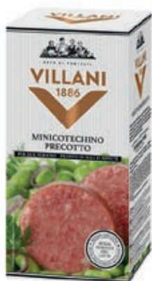
PRE110 COTECHINO MINI GR 300 O.I.