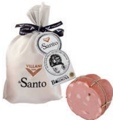
MOS910 MORTADELLA SANTO VESCICA SV X 1 A 1/2