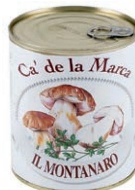
FUG310 FUNGHI MONTANARO 4/4