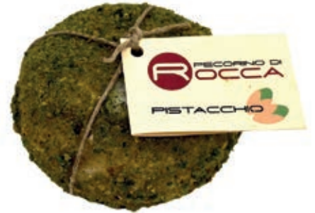
PEP500 PECORINO ROCCA PALLOT. CON PISTACCHIO