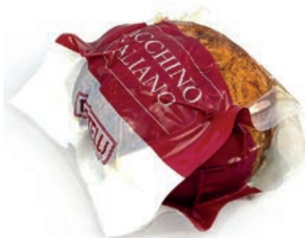
ARR110 FESA DI TACCHINO