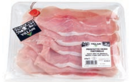
AFF100 AFF.PASTORELLO X 110 GR CT 8 PZ