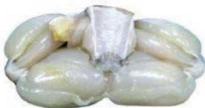
CPE900 RANE COSCE 46/60 KG 1 CONG.