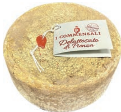
PES300 PECORINO DELATTOSATO RISERVA