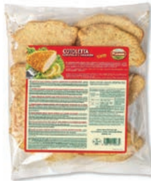
PIU130 PREP.POLLO COTOL.AIA GR.100 4 X1 KG G.P.