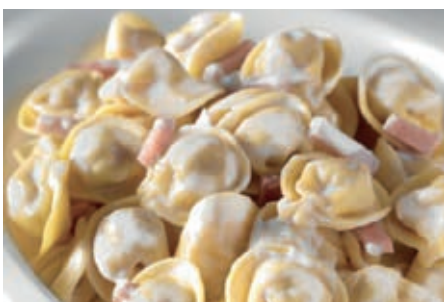
GAP145 TORTELLINI PANNA E PROSCIUTTO VASSOIO