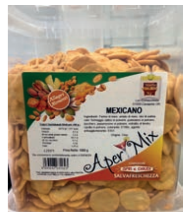
FRS640 CRACKER MEXICO KG 1