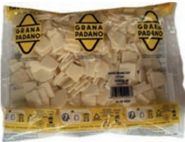
GRP750 GRANA PADANO SCAGLIE GR. 500