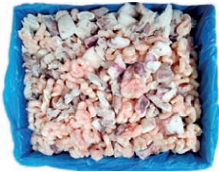
CPE735 FRITTO MISTO PESCE KG 5 AL NATURALE