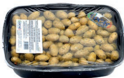
OLI220 OLIVE VERDI MAR. VASCA 2 KG