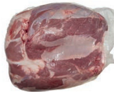
VIT130 NOCE A PALLA SV SCOTTONA