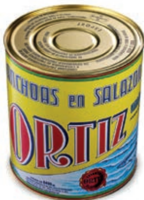
ACC605 ACC. SPAGNA KG 10 ORTIZ (10/11 P)