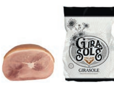
COT400 COTTO GIRASOLE