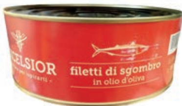
TON800 FIL. SGOMBRO OLIO OLIVA KG 2.450