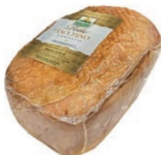
ARR100 PETTO TACCHINO ARROSTO KG 2.50 C.A