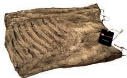
PAN100 RIGATINO CON LOMBO (TIPO TARESE)