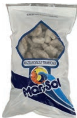
CPE245 MAZZANCOLLE TROPICALI SGUSC. 41/50 GR 750