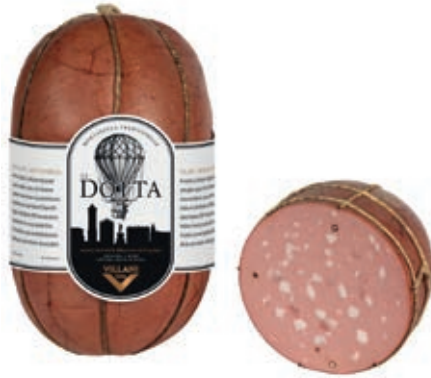
MOD200 MORTADELLA LA DOTTA VN 10/12 PIST. O.I.