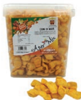
FRS630 CONI MAIS GR 750