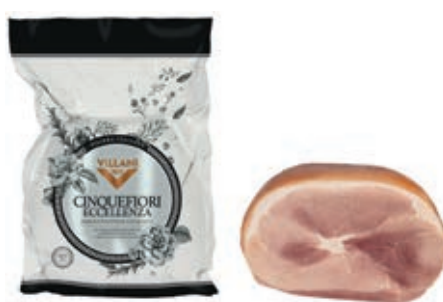
COT210 COTTO 5 FIORI ECCELLENZA PP