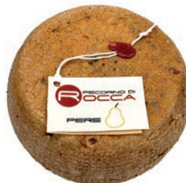
PEA210 PECORINO ROCCA CON PERE