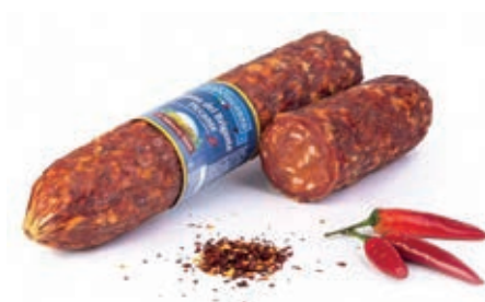
NAP100 SALAME PICCANTE DEL BRIGANTE GR800 CA SV