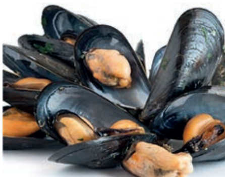
CPE860 COZZA CILENA C/G 40/60 KG 1