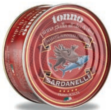
TON230 TONNO O.O. GR 160 SARDANELLI