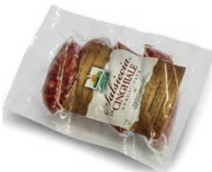
CIN320 CINGHIALE SALSICCIA G. 150