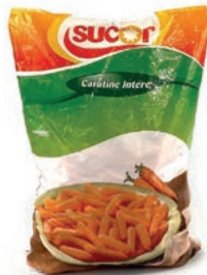
VER100 CAROTINE BABY CONG.