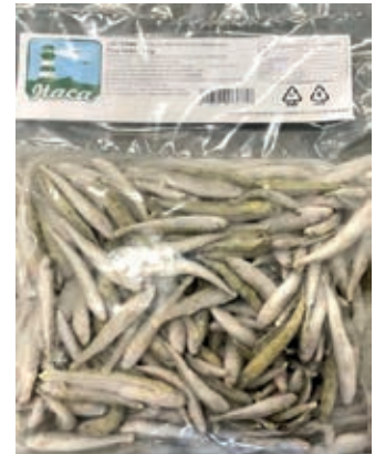
CPE745 LATTERINI IQF 10 X 1000