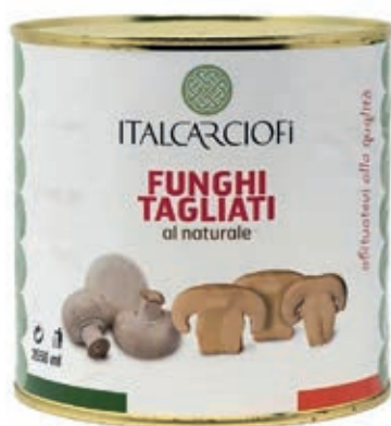
FUG400 FUNGHI CHAMPIGNONS NATUR. X 2.5