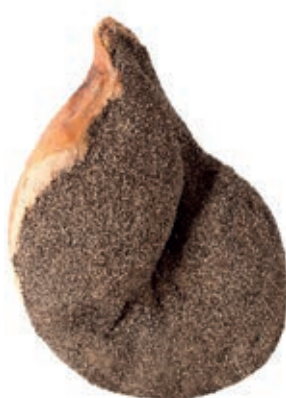
SGN500 SGAMBATO N. S/ANCHETTA ROSSI O.I.