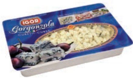
ERB130 GORGONZOLA DOP CUBETTI GR 500