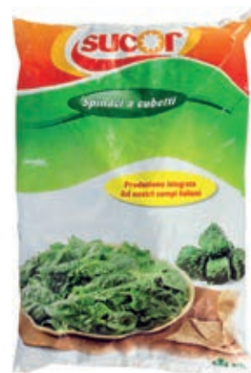
VER710 SPINACI CUBO CONG.