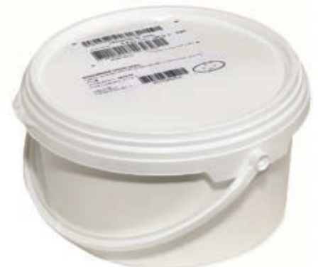
MAS200 MASCARPONE GR 2000