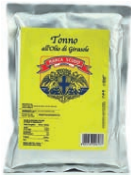
TON720 TONNO BUSTA KG 1