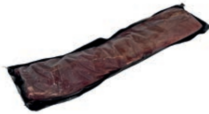
CEC110 LOMBO DI CERVO S/O CONG