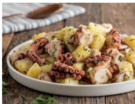
GAM545 POLPO CON PATATE