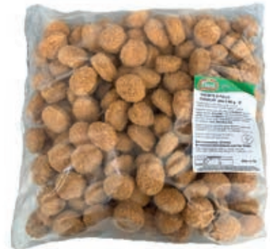
PIU135 PREP.POLLO CROCCHETTE/ NUGGETS FILENI KG3