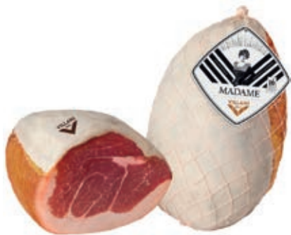
CUL100 CULATTA RISERVA CON COTENNA VILLANI