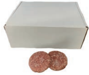
HAM640 HAMBURGER CATERING B.A. GELO 110GR-10