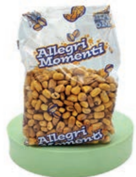
FRS610 MAIS TOSTATO KG 1