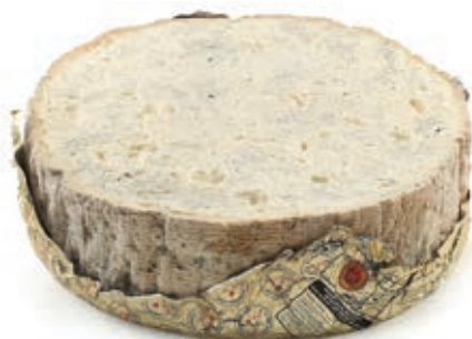
ERB100 GORGONZOLA DOP BOLLO NERO A 1/2