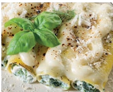
GAP130 CANNOLI E CREPES FARCITURE VARIE VASSOIO