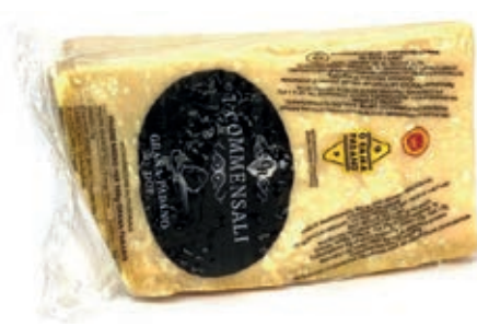
GRP500 GRANA PADANO GR. 800 S.V.