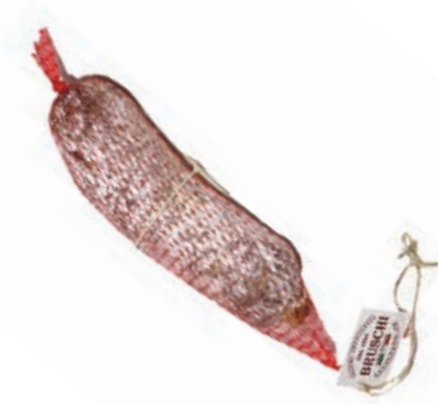
FIN500 SBRICOLONA 6 KG BRUSCHI