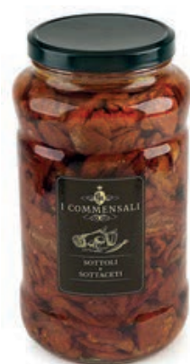
SOT400 POMODORI SECCHI ML 3100 COMMENSALI