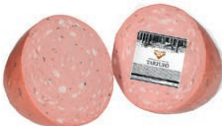
MOT200 MORTADELLA AL TARTUFO 1/2