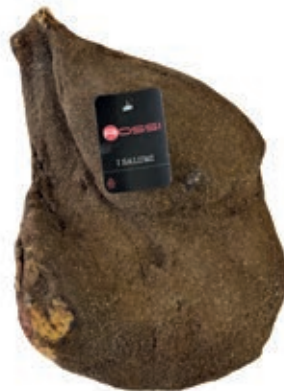
SGE420 SGAMBATO S/ANCHETTA KG 6.5