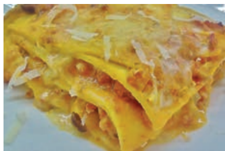
GAP140 CREPPELE POMODORO/ FUNGHI VASSOIO