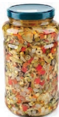
SOT330 MISTORISO TOP ML 3100