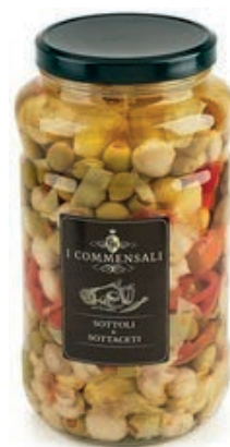
SOT310 TRE GUSTI ML 3100