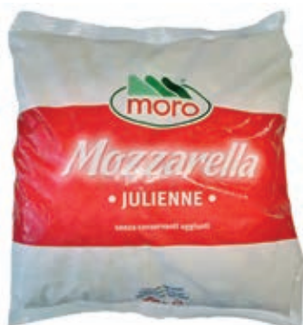
MOZ550 FIORDIL. JULIENNE BUSTA KG. 2 MORO