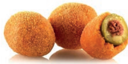
VER010 OLIVA ASCOLANA CONG.