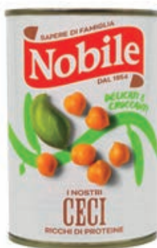
LEG211 CECI 12 X 0.4