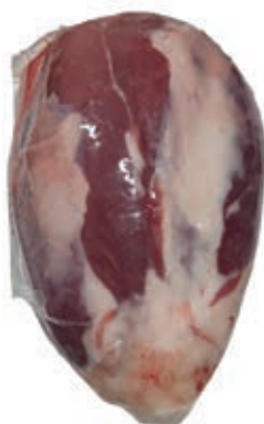
VIT150 CAMPANELLO S/V SCOTTONA