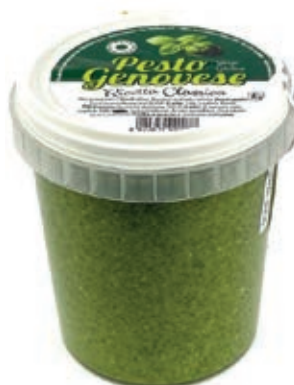
PST100 PESTO KG 1 SENZA AGLIO