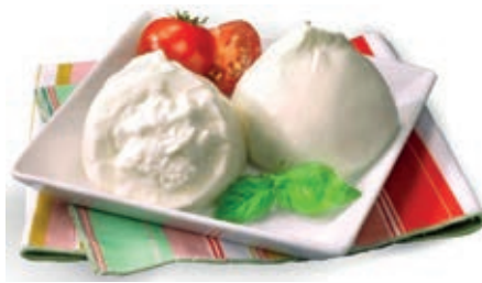
FDL510 BURRATINE SABELLI 8 X 100 GR C.A.O.I.