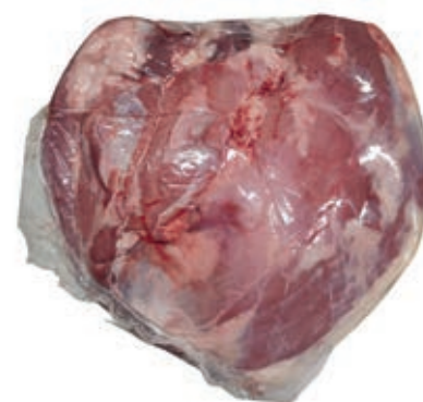
VIT110 FESA SV SCOTTONA KG 1