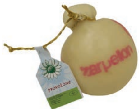
FOR400 PROVOLONE FIASCHETTO KG 1.5