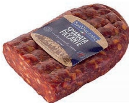
VEN110 SPIANATA PICCANTE A METÀ