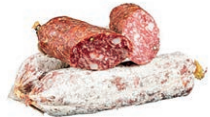
CIS200 SALAME DA "CINTA SENESE DOP" KG 2,5 SV