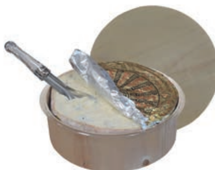
ERB110 GORGONZOLA DOP A 1/2 A CUCCHIAIO