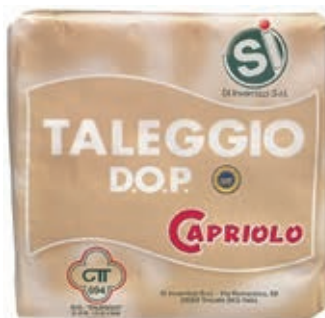
TAL100 TALEGGIO DOP INTERO