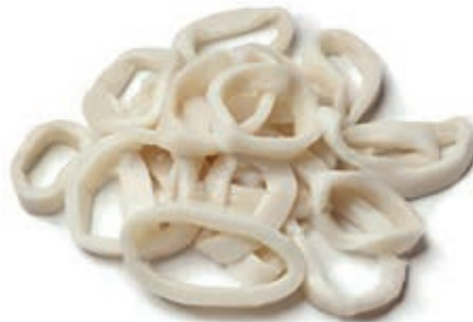
CPE365 ANELLI TOTANO ATL IQF GR 800 MAR FRIO