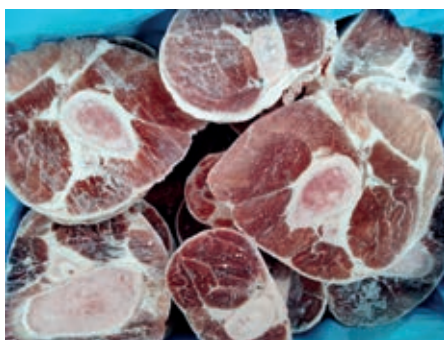
VIT100 VITELLO OSSOBUCO CONG.