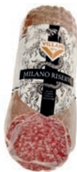
MIL400 SALAME T/MILANO A METÀ