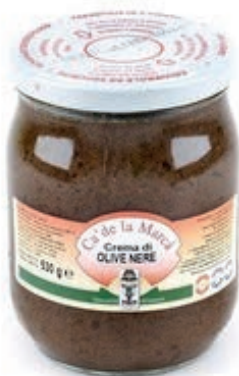
CRE500 CREMA OLIVE NERE VASO GR 530