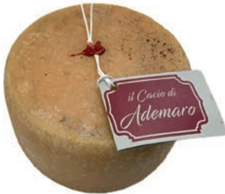
PER240 PECORINO "IL CACIO DI ADEMARO"