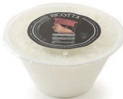
RIC200 RICOTTA CON PANNA