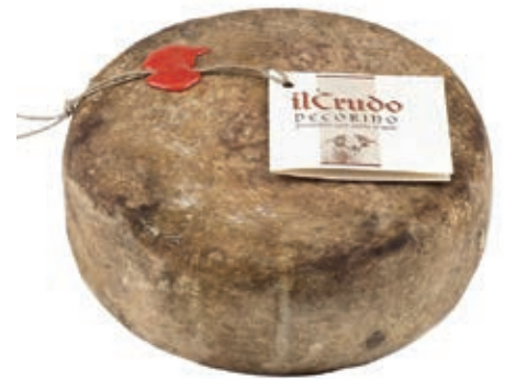
PES100 PECORINO LATTE CRUDO STAG. ST 20