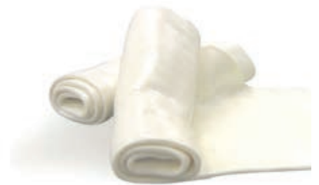
FDL700 SFOGLIA DI MOZZARELLA KG 2 X 1 PZ