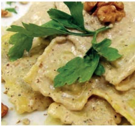
GAM230 RAVIOLI SALVIA NOCI E PECORINO MONOP.