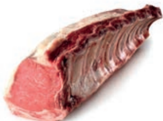
VIT278 LOMBATA SCOTTONA SERBIA FEMMINA 16/19 KG