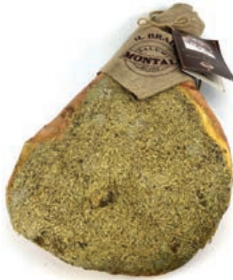
PRO100 PROSCIUTTO C/O IL BRADO