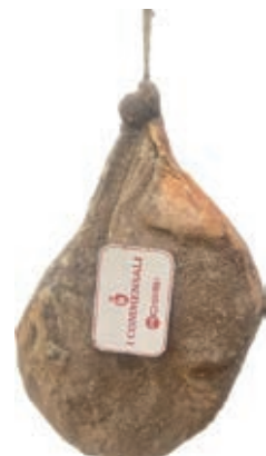
SGN100 SGAMBATO FILIERA ITALIA 12 MESI