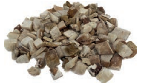
POR400 PORCINO CUBO CT ROSSI CONG.