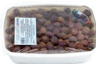
OLI210 OLIVE NERE MAR.VASCA 2KG