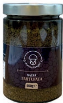
TAR240 TAPENADE AL TARTUFO GR 500