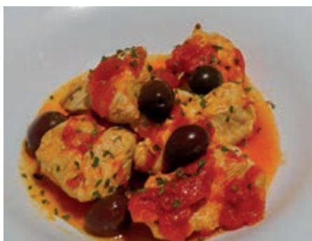
GAB100 POLLO ALLA CACCIATORA VASSOIO