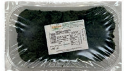
GAV205 BIETOLE GR 1200