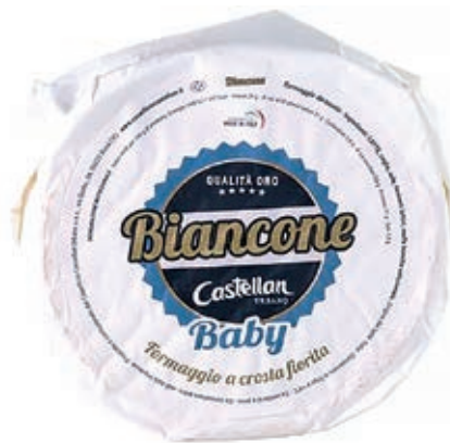
CAS200 BIANCONE BABY KG 2.5