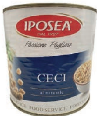
LEG200 CECI 6 X 3