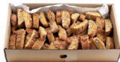
LIE600 CANTUCCI ALLE MANDORLE VASSOIO