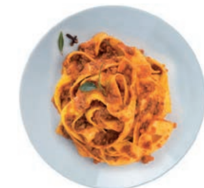
GAM410 PAPPARDELLE AL RAGU' MONOP.