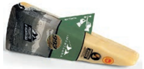
GPR640 PARM. REGG. 13 M. CAS. 993 GR 250