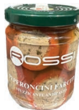
GIA200 PEPERONCINI FARCITI CON TONNO GR. 180 X 6