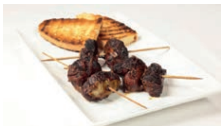
GAC600 FEGATELLI DI SUINO VASSOIO