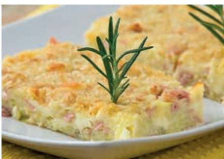
GAP210 TORTA PATATE COTTO FORMAGGIO VASSOIO