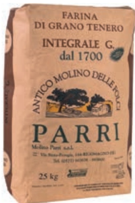
FAR160 FARINA INTEGRALE