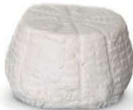
RIC400 RICOTTA DI BUFALA