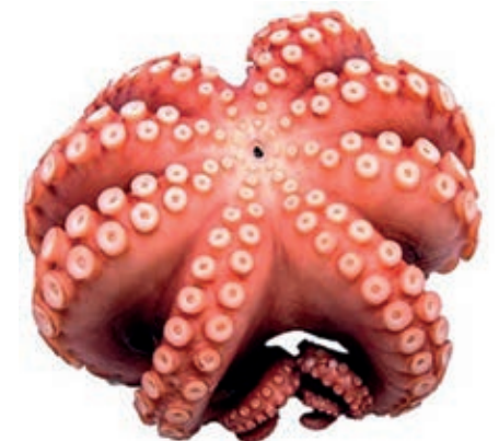
CPE400 POLPO IQF T6 KG 12 MAROCCO 800/1200