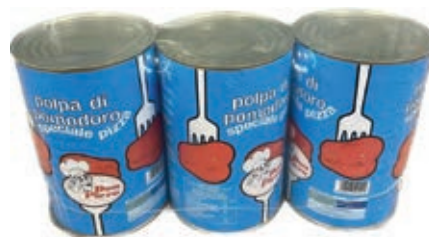
POM200 POLPA LATTA 3 X 4.05