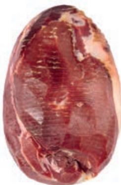
CUL200 CULATTA S.V. PULITA