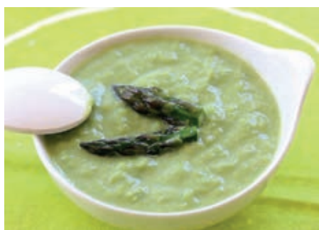
GAS300 SUGO AGLI ASPARAGI VASSOIO