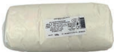
STR120 CRECENZA DA LAVORAZIONE 1000 O.I.