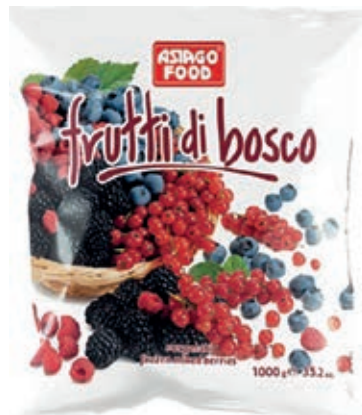
FRU300 FRUTTI BOSCO CONG. KG 1