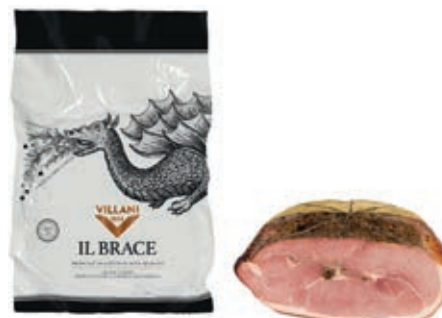
COT030 COTTO BRACE A 1/2