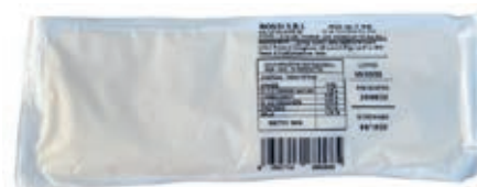
MOZ420 FIORDIL. ROSSI FILONE FONDO R.