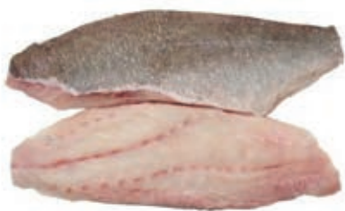
CPE620 CERNIA FILETTI 4/6 (110/170) 10X800