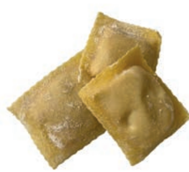
PAS710 TORTELLI DI PATATE ROSSI ATM GR 500