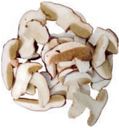
POR305 PORCINO LAMINA EXTRA CONG. KG 1