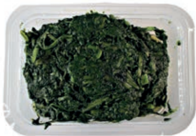
GAV405 ERBETTE GR 1200