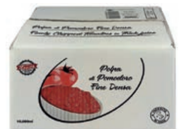
POM300 POMODORI POLPA FINE BAG IN BOX 2 X 5