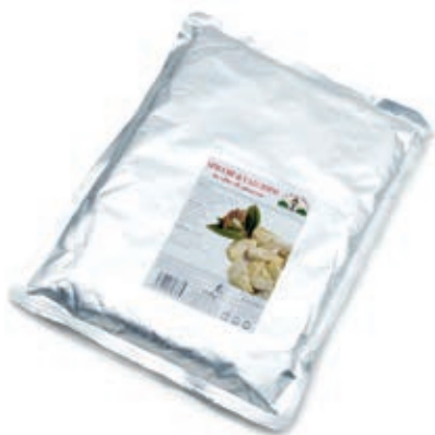
CAR300 CARCIOFI SPICCHI BUSTA GR 1700