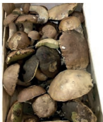
POR710 PORCINI FRESCHI COMMERCIALI