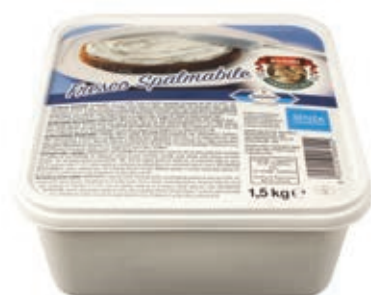
STR105 FORMAGGIO FRESCO SPALMABILE KG 1,5