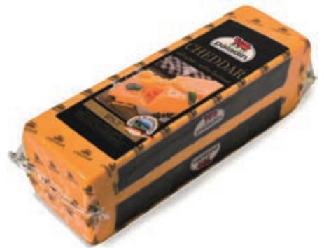
EMM400 CHEDDAR BLOCCO KG. 3.500