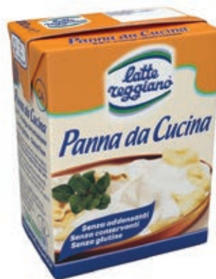
PAN120 PANNA ML 200