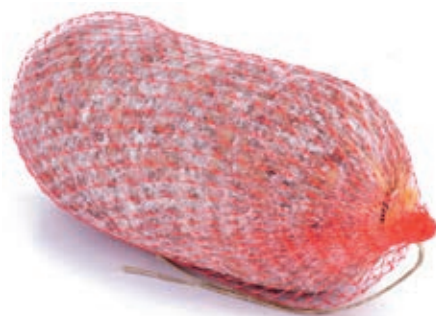
FIN300 SBRICOLONA KG 2 O.I.