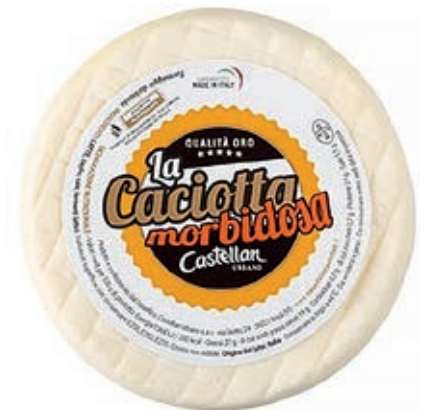
CAS100 CACIOTTA MORBIDOSA KG 1,5