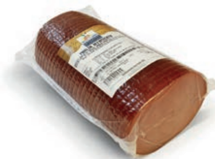
SLM200 MARLIN 120