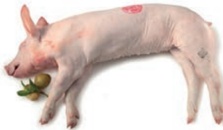
MAI100 MAIALINO DA LATTE INTERO 10- CONG.