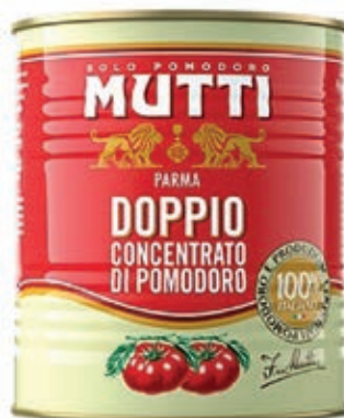
POM910 DOPPIO CONCENTRATO MUTTI X 1 O.I.