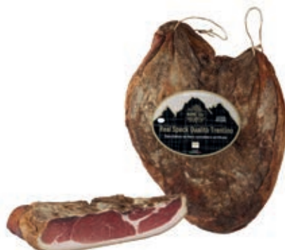
SPE100 SPECK REAL NAZIONALE INTERO SV