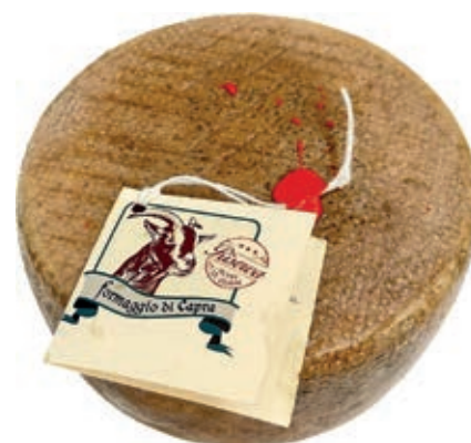
PEC200 FORMAGGIO VECCHIO CAPRARO (120 GG) O.I.