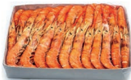
CPE220 GAMBERI ARGENT. L2 C/B KG 2 20/30