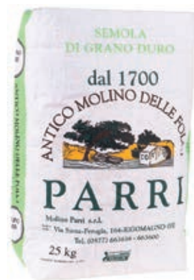
FAR210 SEMOLA DELUX KG 25