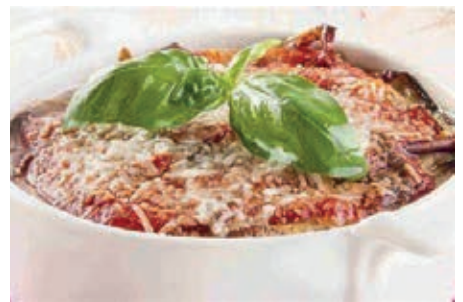
GAM300 MELANZANE ALLA PARMIGIANA MONOP.