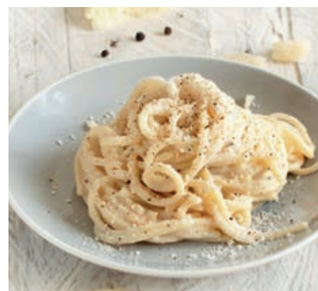
GAM480 PICI CACIO E PEPE MONOP.