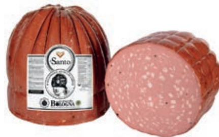
MOS210 MORTADELLA SANTO X 60 TOZZA A METÀ