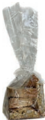
LIE610 CANTUCCI ALLE MANDORLE GR 250