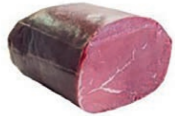
BRE500 CARPACCIO SCOTTONA "LA NOBILE"