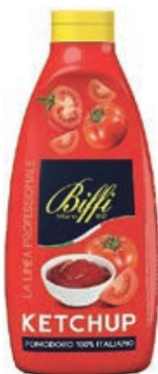
SLS510 KETCHUP 950 TW