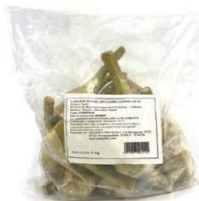
VER500 CARCIOFI INTERI C/G CONG.