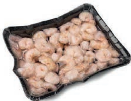
CPE205 GAMBERO SGUSCIATO 50/70 GR 750