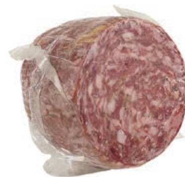
FIN320 SBRICOLONA 500 GR. CA SV O.I.