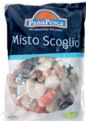
CPE710 MISTO SCOGLIO DEL PESCATORE GR 800