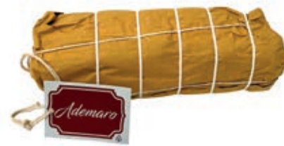
CAP350 CAPOCOLLO ADEMARO PEPE CARTA