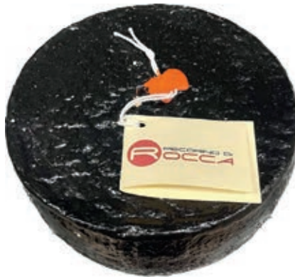
PER300 PECORINO "IL NERO DI ROCCA"