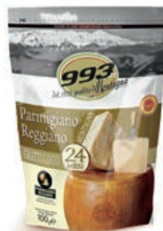
GRA010 PARM. REGG. 24 M. CAS. 993 GRATT. GR 100