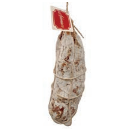
SAL615 SALAME SPAGATO "ADEMARO" KG 2/3