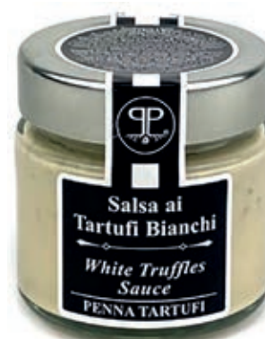
TAR320 SALSA TARTUFO BIANCO 5% GR. 90