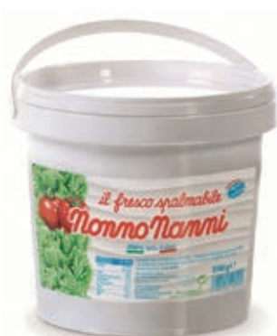
STR110 FRESCO SPALMABILE GR 1000 O.I.