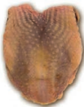
PIU310 FARAONA PETTO SUPREM CONG.