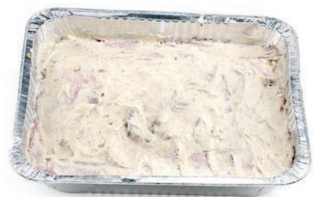
GAC420 VITELLO TONNATO VASSOIO