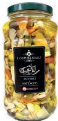
SOT290 ANTIPASTO NONNO GUALTIERO ML 3100 LIGHT