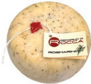
PEA700 PECORINO ROCCA ROSMARINO ST 16