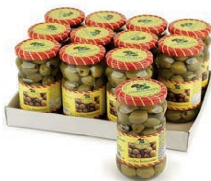
SOT980 OLIVE VERDI DENOCCIATE 314 ML