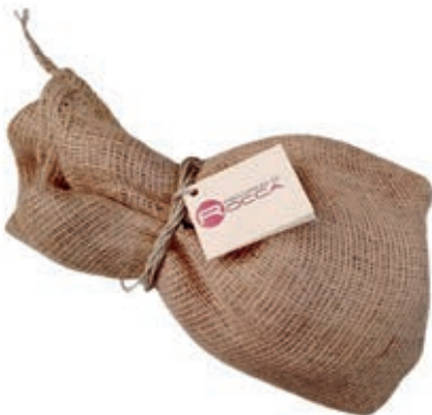
PER400 PECORINO ROCCA FOSSATELLO