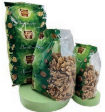
FRS300 NOCI SGUSCIATE USA KG 1