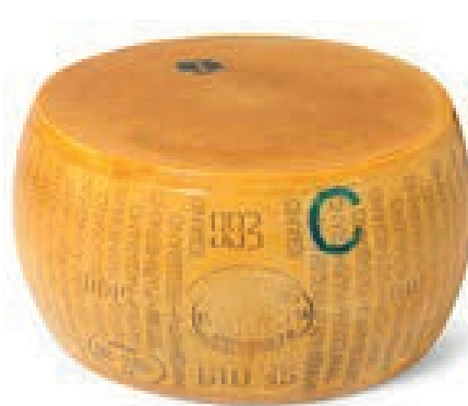
GPR100 PARM. REGG. 24 M. CAS. 993 FORME C