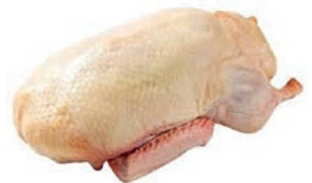
PIU200 ANATRA BUSTO KG 2 CONG.