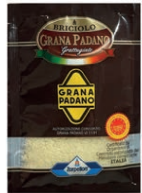
GRA400 GRANA PADANO GRATTUGIATO GR 5 X 200