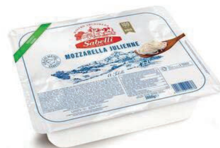
MOZ510 FIORDIL. SABELLI JUL.