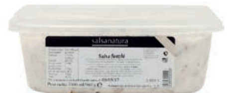
SLS320 SALSA AI FUNGHI 3G KG 1