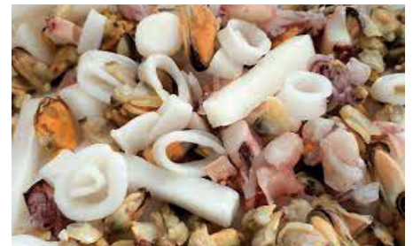
CPE720 PREPARATO RISOTTI/ SPAGHETTI GR 800