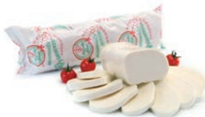
MOZ810 FIORDIL. PREZIOSA FILONE ITALIA 2 KG