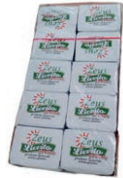
LIE120 LIEVITO A CUBETTI