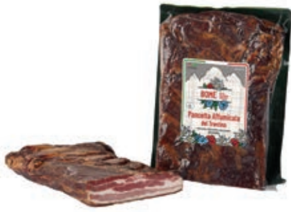
PAN400 PANCETTA AFFUMICATA CRUDA S.V.