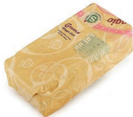
TAL110 TALEGGIO DOP A 1/2