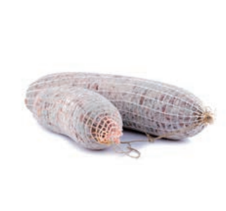
SAL400 SALAME TOSCANO KG 2 C.A O.I.