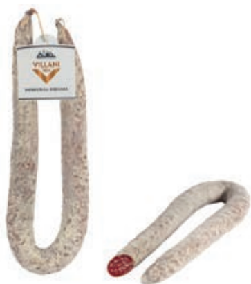
MIL520 SALAMINO DOLCE CURVO VILLANI