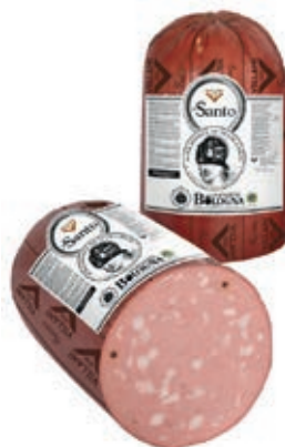
MOS510 MORTADELLA SANTO PIST. X 30 A 1/2