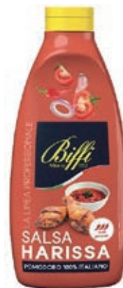
SLS530 SALSА HARISSA TWISTER GAIA 900 GR