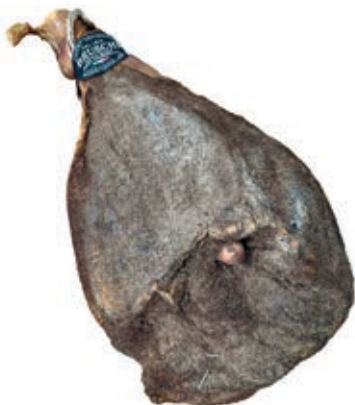
PRO500 PROSCIUTTO C/OSSO RISERVA