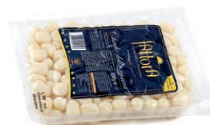
PAS410 CHICCHE DELLA NONNA X 500