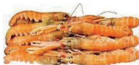
CPE270 SCAMPI 13/16 DANIMARCA GR 700