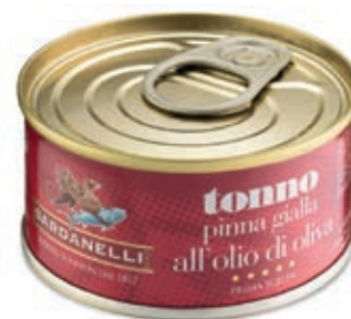
TON240 TONNO O.O. GR 80 SARDANELLI