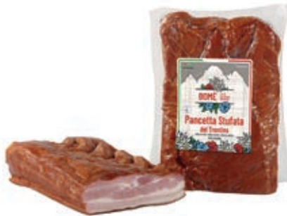
PAN410 PANCETTA AFFUMICATA COTTA A SV