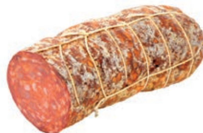
VEN210 VENTRICINA PICCANTE A METÀ