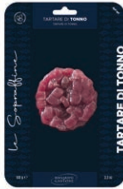
TRT820 TARTARE DI TONNO GR 100