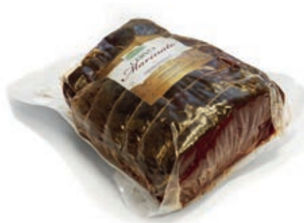
BRE810 CARPACCIO CERVO MARINATO