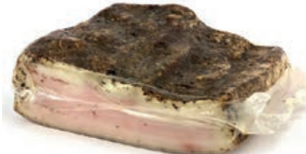
LAR210 LARDO TRANCI KG 1.5/2