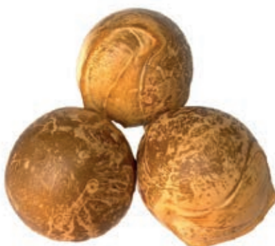
BUF500 MOZZ. BUFALA DOP 5 X 50 GR AFFUM.