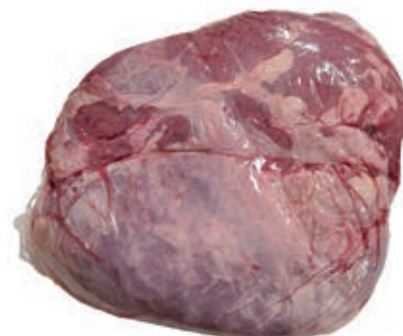
VIT980 FASCIA DI FESA (COPERTINA) VITELLONE