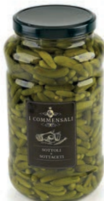
SOT420 CETRIOLINI PICCOLI ML 3100 COMMENSALI