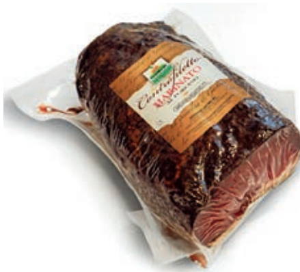
BRE900 CONTROFILETTO MARINATO AI FUNGHI PORCINI