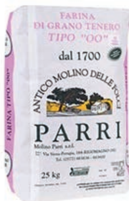
FAR120 FARINA 00 LINEA PASTA FRESCA KG 25