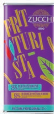
EVO800 OLIO FRITTURISTA LATTA X 5