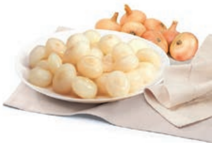
VER320 CIPOLLE BORRETTANE CONG.