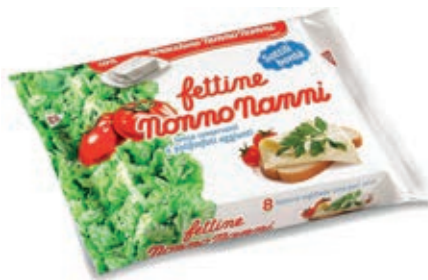
KRA510 FETTINE NONNO NANNI GR 200 X 14