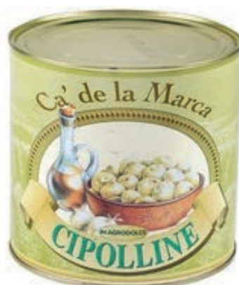
SOT220 CIPOLLE BORRET. LATTA 3/1