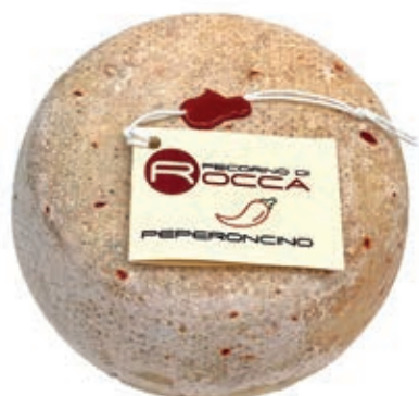
PEA220 PECORINO ROCCA CON PEPERONCINO