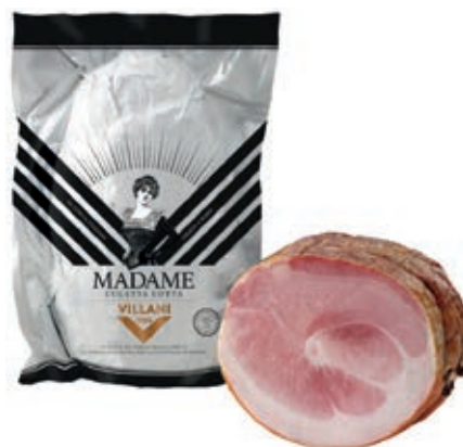
COT220 CULATTA COTTA O.I.