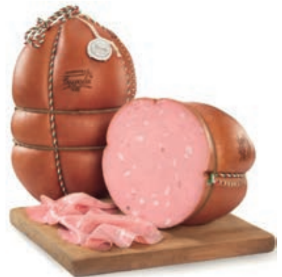
FAV100 MORTADELLA FAVOLA GRAN RISERVA O.I. SV