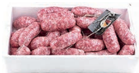
SAL910 SALSICCIA VASSOIO KG 2