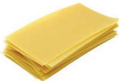
PAS790 LASAGNE ROSSI ATM GR 500