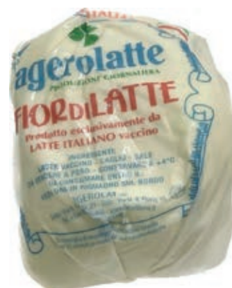
MOZ310 PROVOLA DI AGEROLA AFF. 10X500 GR