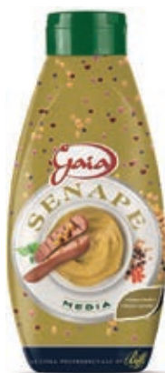
SLS520 SENAPE TWISTER GAIA 820 GR