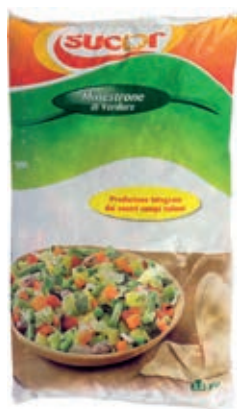
VER900 MINISTRONE 14 VERDURE CONG.