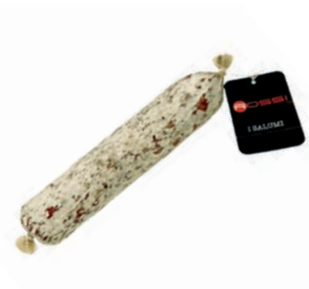
SAL200 SALAME DI FATTORIA KG 1