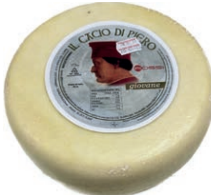
PEF520 PECORINO FRESCO ST 22 TERMOFILO