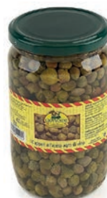
SOT140 CAPPERI LACRIMELLA ML 720