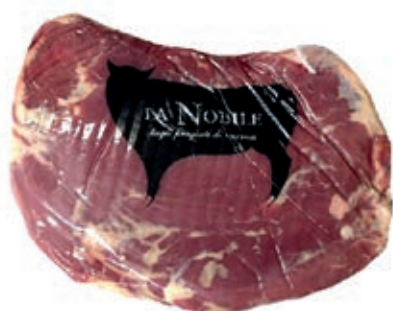
VIT700 BAVETTA B.A. SCOTTONA LA NOBILE