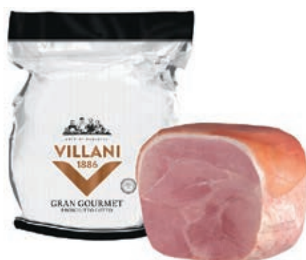
COT510 COTTO GRANGOURMET A METÀ