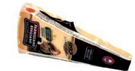
GPR700 PARM. REGG. 24 M. VACCHE BRUNE GR 250