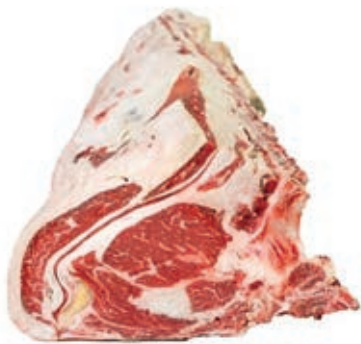
VIT296 LOMBATA VACCA DK GRASSO 3