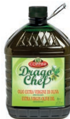
EVO210 OLIO E.V.O. COPPINI 5 LT PET