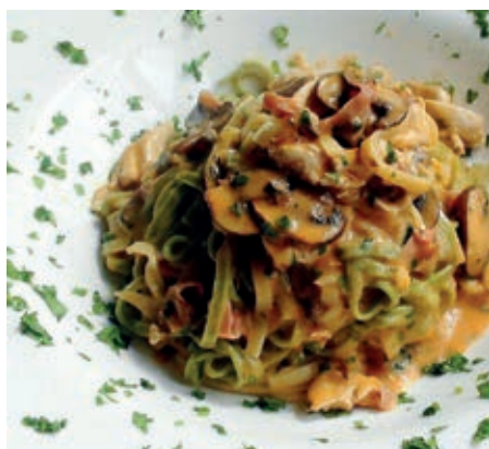
GAM460 TAGLIOLINI PAGLIA E FIEÑO MEDICI MONOP.