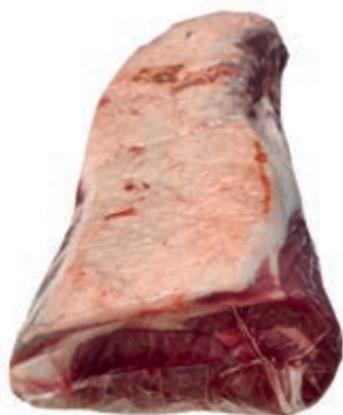
VIT270 STRIPLOIN DANIMARCA