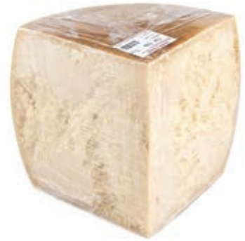
GRP300 GRANA PADANO CONF. 1/4