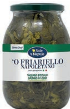
LEG500 FRIARIELLI NAPOLETANI VETRO X 0.96 O.L.