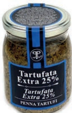
TAR330 SALSA TARTUFO GR 500 25%