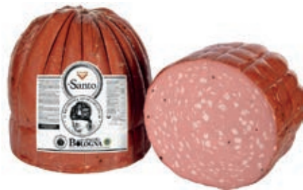
MOS310 MORTADELLA SANTO X 60 TOZZA PIST. METÀ