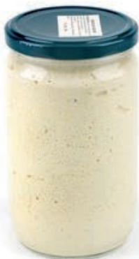
CRE310 CREMA DI CARCIOFI GR 580