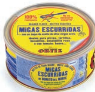
TON730 TONNO BRICIOLE BONITO NORTHE GR 670