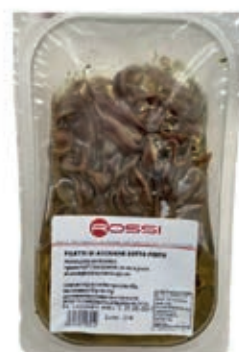
GAD500 ACCIUG.FILETTI SPAGNA SOTTO PESTO GR 700