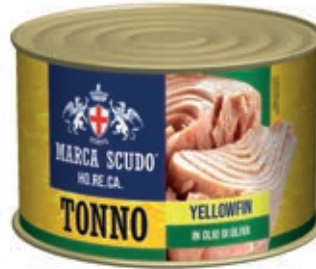
TON700 TONNO O.S. GR 1730