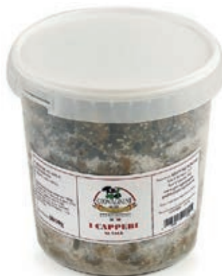
SOT100 CAPPERI AL SALE KG 6