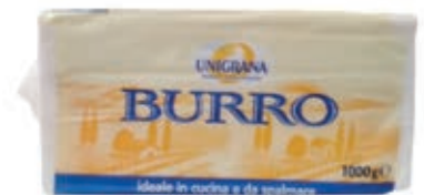
BUR200 BURRO KG 1