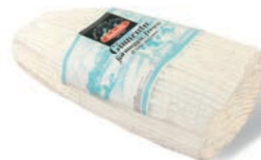
FOR455 GIUNCATA SPIGATA KG 1,5 X 1 PZ