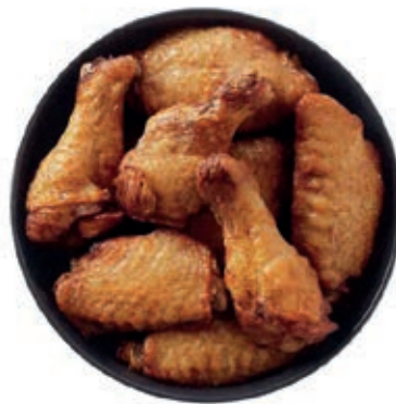
PIU125 POLLO ALETTE BBQ KG1 MC