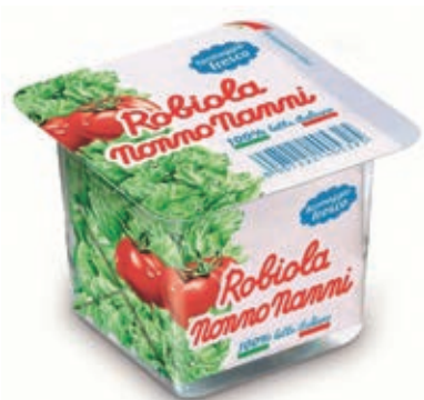
ROB100 ROBIOLA NONNO NANNI GR 100