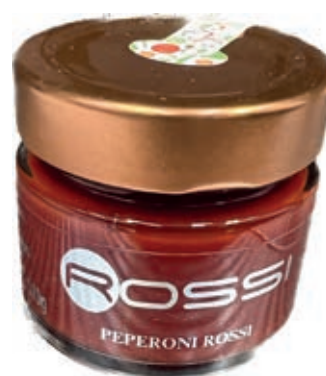
COM240 COMPOSTA DI PEPERONI ROSSI GR. 110 X 6