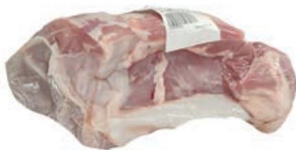
VIT800 CARRE VITELLA DA LATTE OLANDA FILETTO