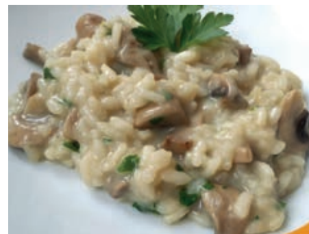
GAM500 RISO AI FUNGHI PORCINI MONOP.