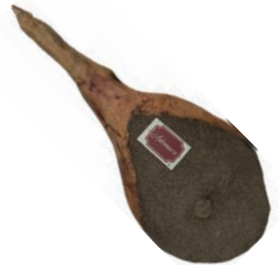
PRO200 PROSCIUTTO C/ZAMPUCCIO ADEMARO