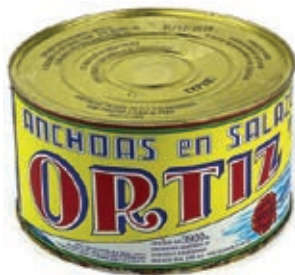
ACC730 ACC. SPAGNA KG 5 ORTIZ (14 P)