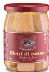
TON210 TONNO O.O. GR 620 SARDANELLI