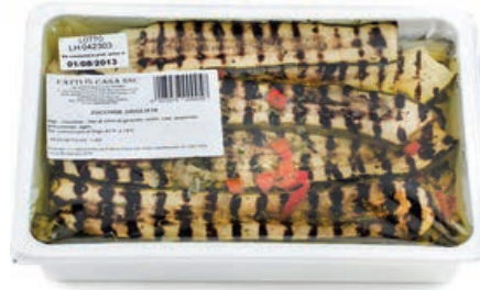
SOT800 ZUCCHINE ARROSTITE KG 1.350