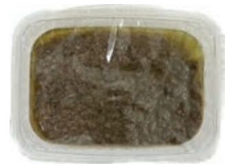
GAS110 SALSA CON FEGATO 250 GR.