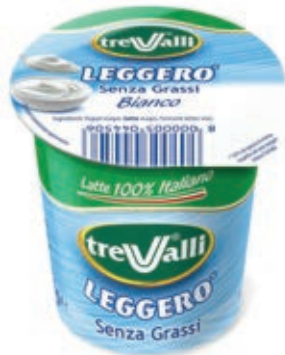
YOG100 YOGURT BIANCO MAGRO ML 125 O.I.