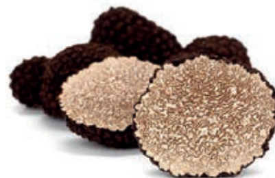
TAR110 TARTUFO NERO UNCINATO "Tuber Unc" prov. UE