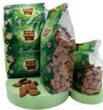
FRS200 MANDORLE SGUSCIATE SPAGNA