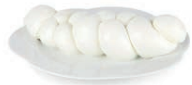
BUF210 MOZZ. BUFALA TRECCIA KG 2