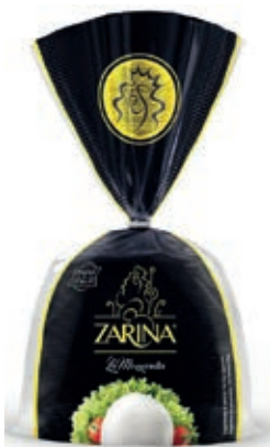
FDL300 MOZZ. ZARINA GR 200 O.I.