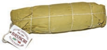
CAP230 CAPOCOLLO PEPE BRUSCHI