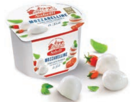
FDL110 MOZZ. FDL CILIEGINE SABELLI GR 250 O.I.