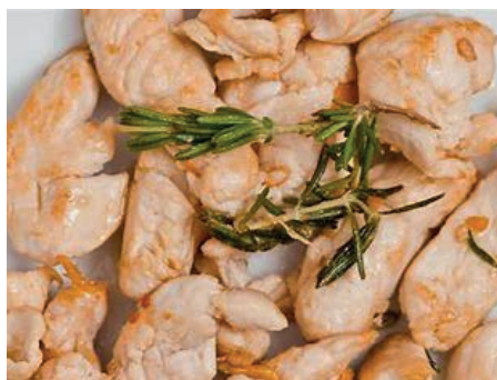
GAB120 POLLO AL ROSMARINO VASSOIO