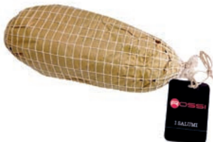
CAP100 CAPOCOLLO PEPE O.I.