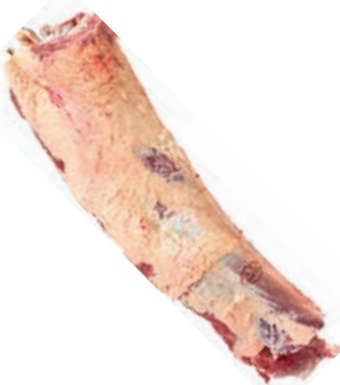
VIT282 LOMBATA SCOTTONA SLOVENIA FEMMINA 18/22 KG