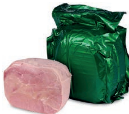
COT720 COTTO SCELTO VERDE