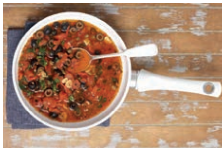
GAS170 SUGO PUTTANESCA VASSOIO