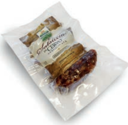
CER300 CERVO SALSICCIA G. 150