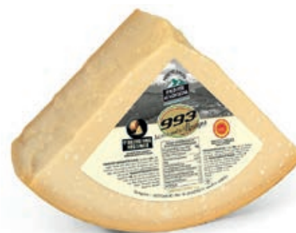
GPR400 PARM. REGG. 30 M. CAS. 993 1/8