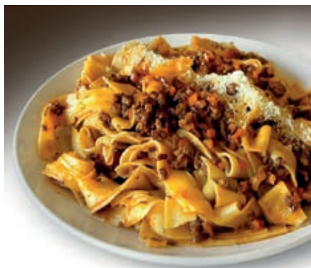
GAM430 PAPPARDELLE AL RAGU' DI LEPRE MONOP.