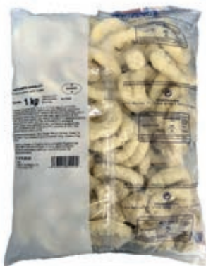
VER977 FRITTO MARE PASTELLATO PANA 6X1 KG BUSTA