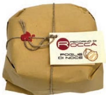
PEP460 PECORINO ROCCA SOTTO FOGLIE NOCE PALLOT.