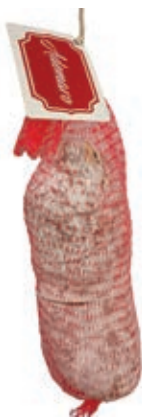
FIN525 SBRICOLONA "ADEMARO" KG 1/1,5