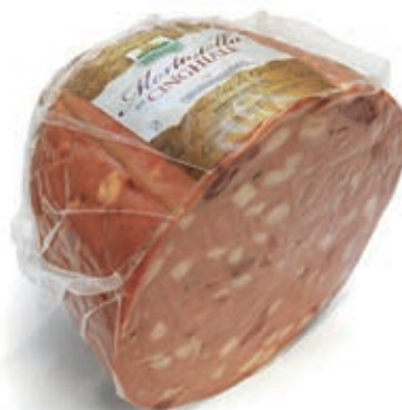
CIN410 MORTADELLA CON CINGHIALE