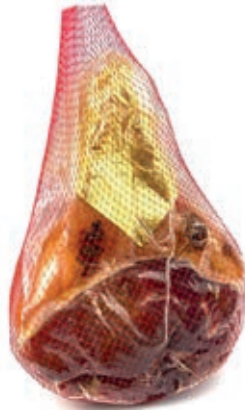
PAR310 PROSCIUTTO PARMA S/O PRESSATO ROSSI