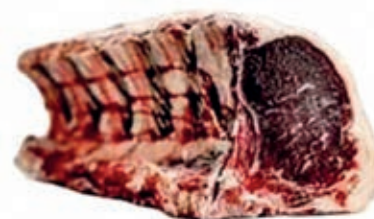
VIT288 LOMBATA SCOTTONA AUSTRIA FEMMINA 20/24 KG