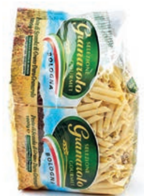
PAS910 PENNE X 1