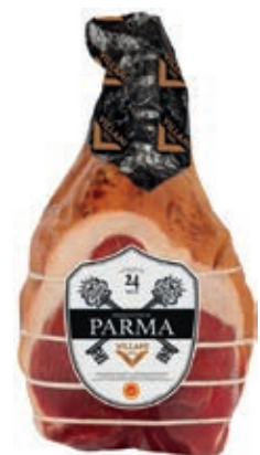
PAR200 PROSCIUTTO PARMA S/O 24MESI ADDOBBO 8,5+