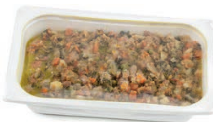
GAP400 MINESTRA DI PANE CONTADINA VASSOIO