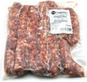
CIC600 CINGHIALE SALSICCIA CONG. KG 1 C.A