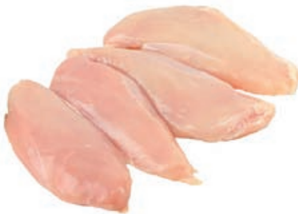
PIU120 POLLO PETTO CONG. 4 x 2.5 150/170