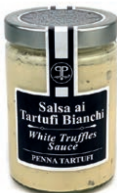
TAR300 SALSA TARTUFO BIANCO 5% GR 500