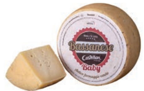
CAS410 BASSANESE BABY FRESCO