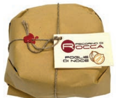
PEA460 PECORINO ROCCA BARRICATO NOCI