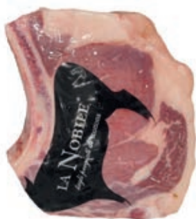
VIT310 COSTATE B.A. SCOTTONA LA NOBILE SV