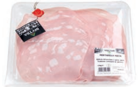
AFF400 AFF.MORTADELLA X 130 GR CT 8 PZ