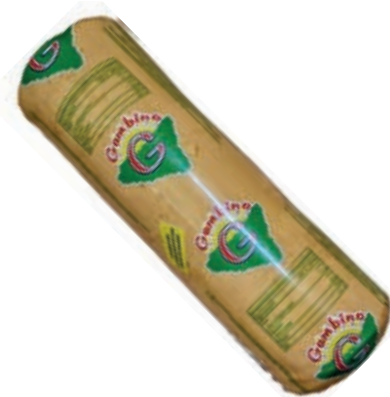
FOR300 SCAMORZA AFFUMICATA KG. 2