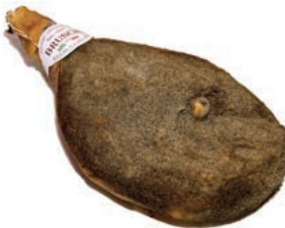
PRO450 PROSCIUTTO CON OSSO BRUSCHI