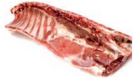
AGN110 AGNELLO CARRE NZ CONG.