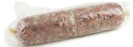
SOP130 SOPRASSATA INTERA KG 2 PREZZEMOLO O.I.