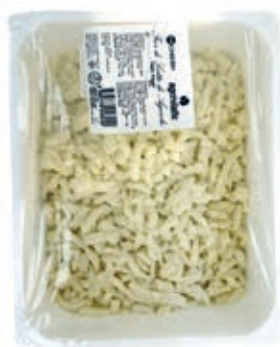
MOZ305 FIORLIL.AGEROLA JUL.ITALIA TAGLIO NAPOLI