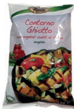
VER985 CONTORNO GHIOTTO SURVEL 6X1