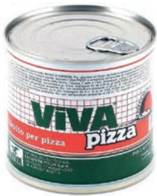
LIE100 LIEVITO SECCO VIVA PIZZA