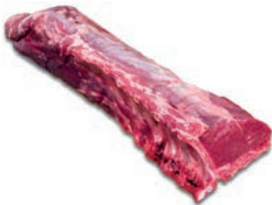
CEC120 CERVO CARRE CONG.