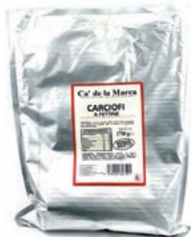
CAR310 CARCIOFI FETTE S/ACETO BUSTA 1700 GR