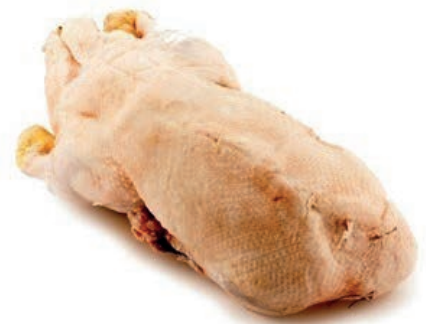
PIU400 OCA BUSTO KG. 4/5 CONG.