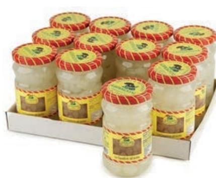
SOT970 CIPOLLINE BIANCHE 314 ML