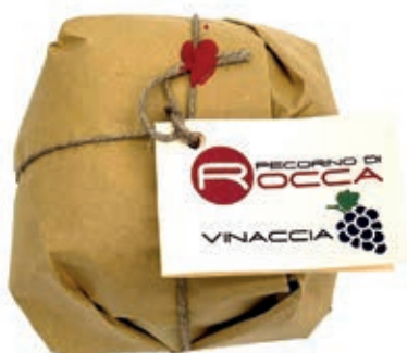
PEP410 PECORINO ROCCA SOTTO VINACCIA PALLOT.