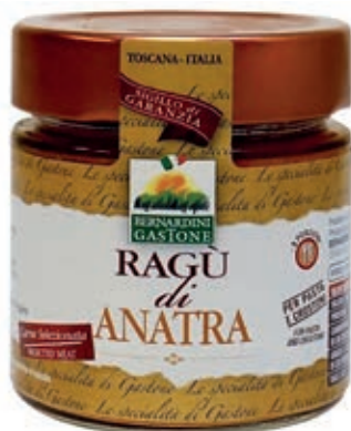
RAG250 RAGÙ DI ANATRA 220 GR