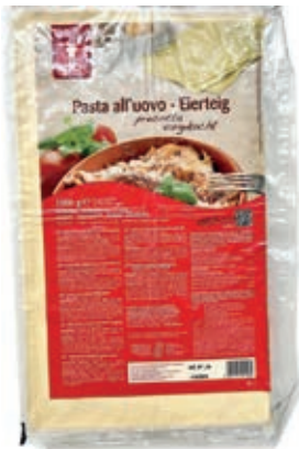
PAS985 PASTA SFOGLIA ALL'UOVO PER LASAGNE CONG.