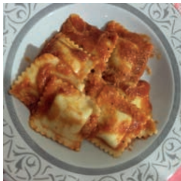
GAP160 RAVIOLI R/S AL RAGU' VASSOIO