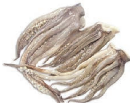
CPE380 CIUFFI TOTANO ATLANTICO IQF KG 4,250