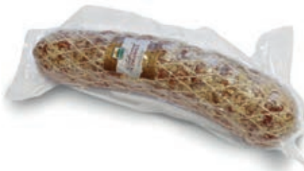
CIN200 CINGHIALE SALAME KG 3 S.V.