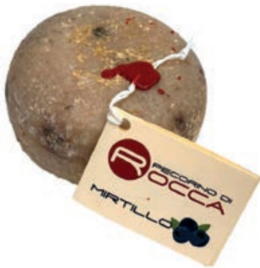
PEP600 PECORINO ROCCA MIRTILLO PALLOTTINO