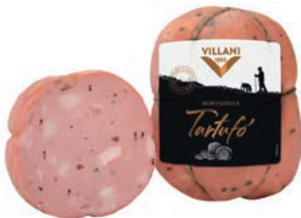
MOT100 MORTADELLA AL TARTUFO VESC. SV X 0.600