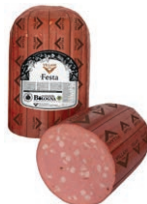
MOF100 MORTADELLA FESTA CIL X 30 A 1/2