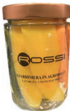
GIA120 GIARDINIERA IN AGRODOLCE GR. 540 X 6