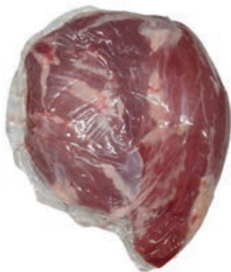
VIT140 SPINACINO SV SCOTTONA