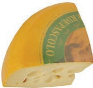
EMM300 MAASDAMMER 1/4