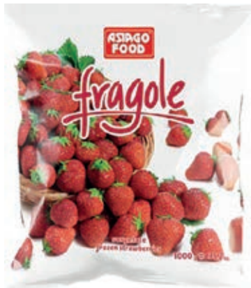
FRU700 FRAGOLE cong. KG.1