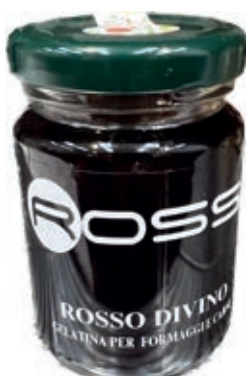
COM220 ROSSO DIVINO GR. 100 X 6