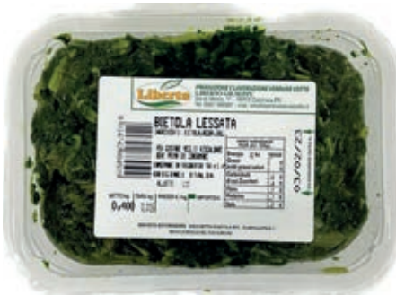
GAV200 BIETOLE GR 400