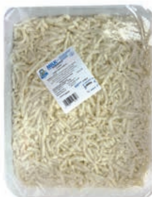
MOZ900 FIORDIL. AMALFI JULIENNE KG 3