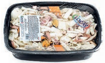
MAR200 LOCAS ANTIP.MARE VASCA X 2 KG EX