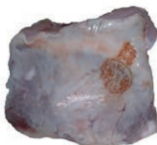
VIT815 SOTTOFESA DI VITELLA DA LATTE OLANDA