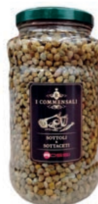
SOT110 CAPPERI LACRIMELLA ML 3100 COMMENSALI