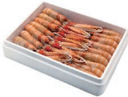
CPE285 SCAMPI 31/40 DANIMARCA GR 750