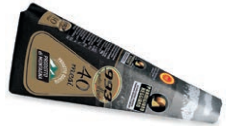
GPR610 PARM. REGG. 40 M. CAS. 993 GR 250 INCART