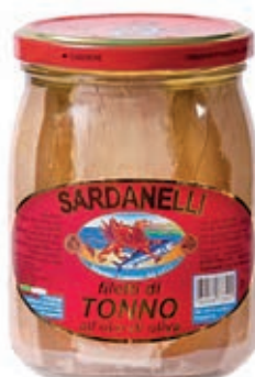
TON400 TONNO O.O GR 540 SARDANELLI VETRO