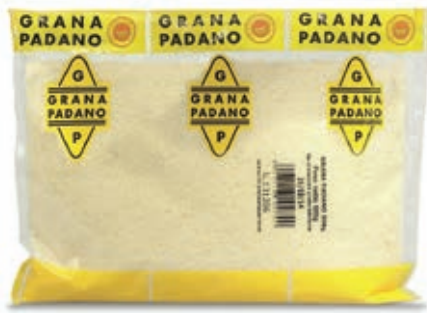
GRA200 GRANA PADANO GRATTUGIATO KG 0.5