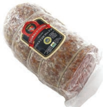
FIN400 FINOCCHIONA IGP A METÀ O.I.