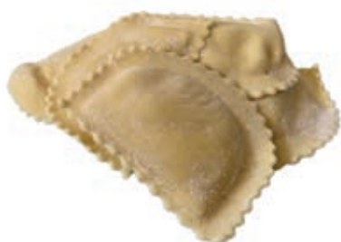
PAS740 MEZZALUNA AI PORCINI ROSSI ATM GR 500