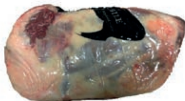
VIT765 PALETTA DI SPALLA B.A. SCOTTONA LA NOBILE