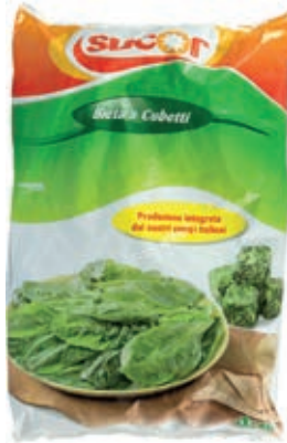
VER720 BIETOLA CUBO CONG.