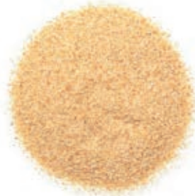
SPZ420 AGLIO GRANULARE DISIDRATATO CINA KG 1