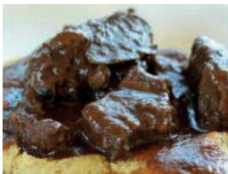
GAM720 PEPOSO MONOP.