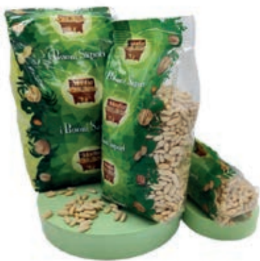
FRS100 PINOLI SGUSCIATI EUROPA KG 1