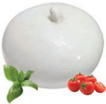
BUF100 MOZZ. BUFALA PERLONA