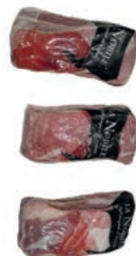
VIT740 RIBS B.A. SCOTTONA LA NOBILE