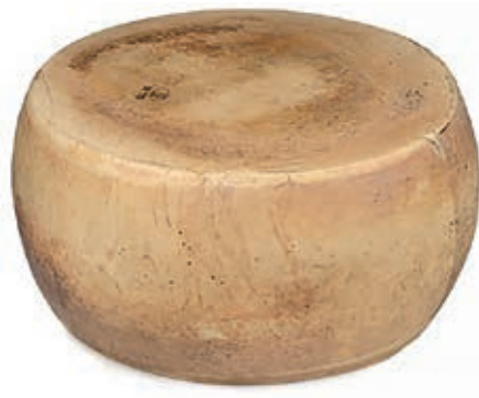
GRP800 GRANA SBIANCATO FORME