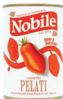
POM521 POMODORI PELATI 12 X 400 GR