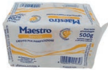
LIE110 LIEVITO PER PANIFICAZIONE