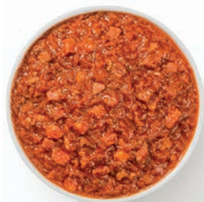
GAS180 SUGO AMATRICIANA VASSOIO