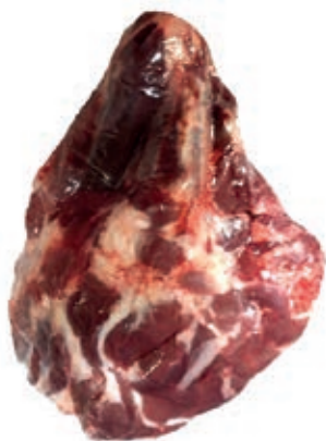
VIT790 MUSCOLO DI SPALLA