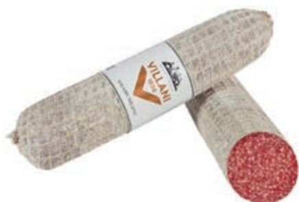
MIL100 SALAME MILANO PS VILLANI O.I.