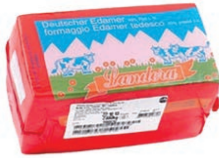
FON110 EDAMER L.