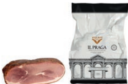
COT050 COTTO PRAGA S/O A 1/2 O.I.