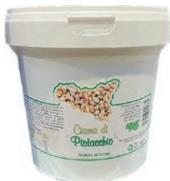
PIS110 CREMA DI PISTACCHIO KG 1