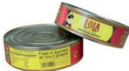
TON807 FIL. SGOMBRO OLIO DI SEMI KG 1,750