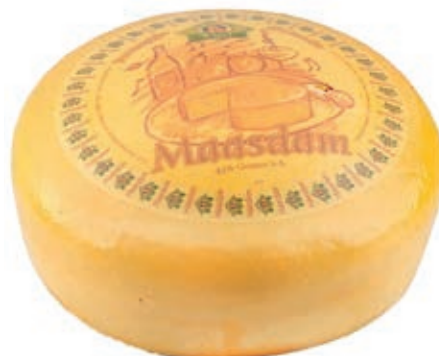
EMM310 MAASDAMMER FORME