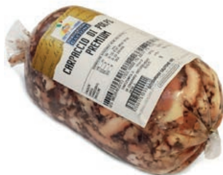
GAD210 SALAME DI POLPO