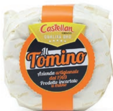
CAS900 TOMINO ORO CT X 10 PZ