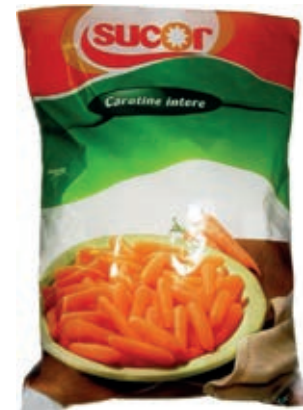
VER110 CAROTE DISCO CONG.