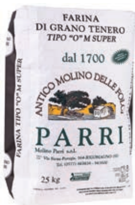
FAR200 MANITOBA SUPER X 25 KG