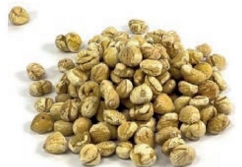
FRU100 CASTAGNE DEPIL. CONG.