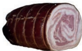
COT940 PANCETTA COTTA LA GIOVANNA O.I.