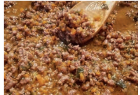
GAS135 RAGU' BIANCO DI CHIANINA VASSOIO