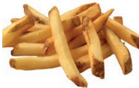
PAT115 PATATE PRIVATE R. 9 X 9 BUCCIA KG 2.5