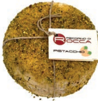
PEA500 PECORINO ROCCA CON PISTACCHIO ST 16