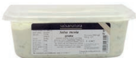
SLS330 SALSA RUCOLA E GRANA 3G KG 1