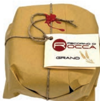
PEA450 PECORINO ROCCA SOTTO GRANO