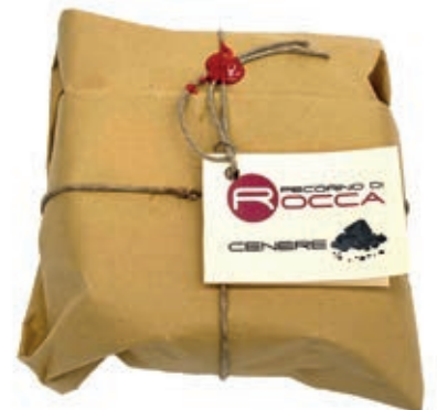
PEA430 PECORINO ROCCA SOTTO CENERE