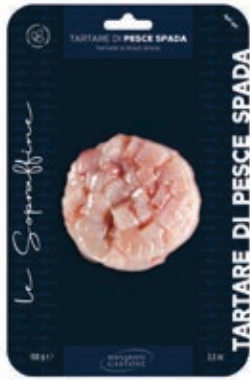
TRT805 TARTARE DI PESCE SPADA GR 100