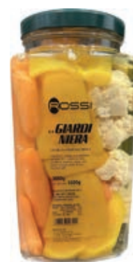
GIA100 GIARDINIERA AGRODOLCE GR 3050 VASO QUADRO