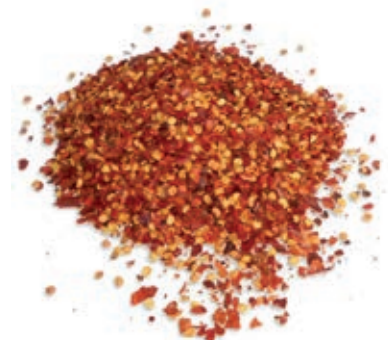
SPZ220 PEPERONCINI ROSSI FRANTUMATI INDIA KG 1