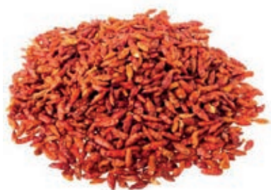
SPZ200 PEPERONCINI ROSSI INTERI AFRICA KG 1