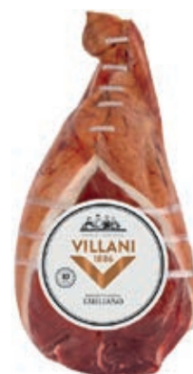
PRO700 PROSCIUTTO EMILIANO S/O ADDOBBO VILLANI