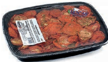
SOT830 POMODORI SECCHI CONDITI VASCA X 1 KG.