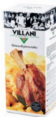
PRE400 STINCO GR 650