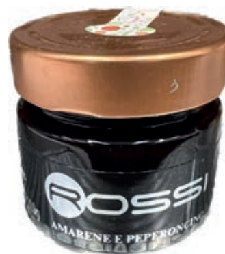
COM260 CONFETTURA DI AMARENE E PEPERONC. GR110X6