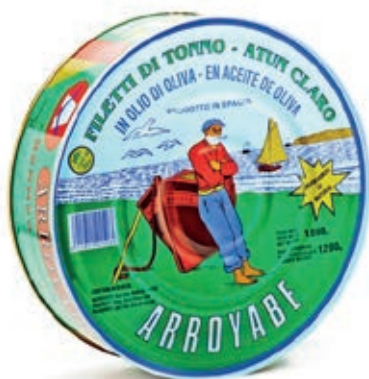
TON110 TONNO FILETTO PINNA GIALLA GR 1800