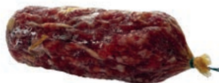
SAL120 SALAME DI MAIALE RUSTICO "TARTUFO" 250 G