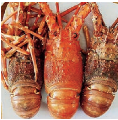
CPE010 ARAGOSTE TROPICALI CUBA 400/460 KG10 PP