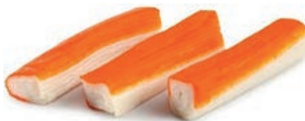
CPE751 BASTONCINI SURIMI GRANCHIO 20X500