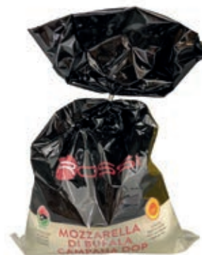
BUF420 MOZZ. BUFALA 5 X 50