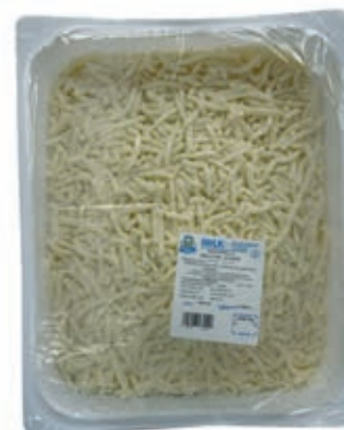
MOZ700 PREPARATO JULIENNE KG 3