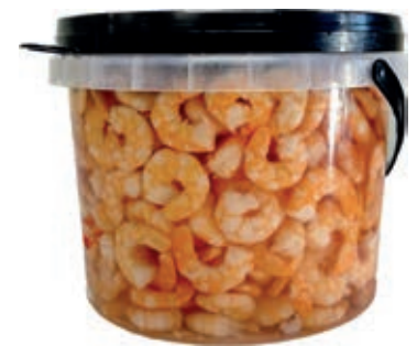
MAR500 MAZZANCOLLE SECCHI X 1,5 KG SGOCC.