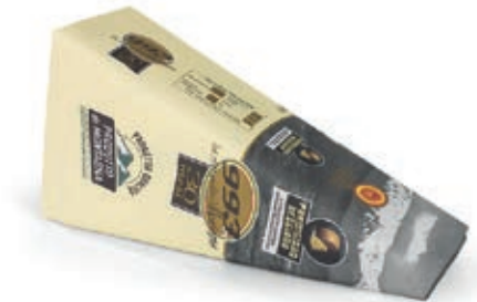
GPR655 PARM. REGG. 30 M. CAS. 993 KG 0,5 INCARTATO