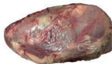
VIT770 SODO DI SPALLA