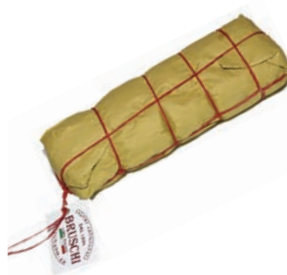
LOM210 LOMBO FINOCCHIO BRUSCHI