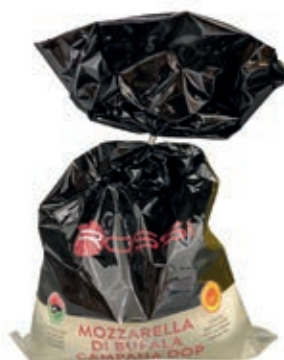
BUF410 MOZZ. BUFALA 2 X 125