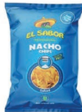
FRS670 NACHOS NATURALI GR 425