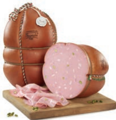
FAV200 MORTADELLA FAVOLA GRAN RISER. PIST. SV O.I.