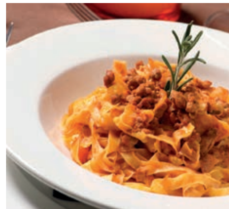
GAM450 TAGLIATELLE AL RAGU' MONOP.