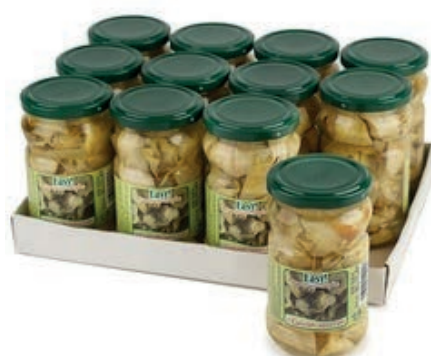
SOT930 CARCIOFI TAGLIATI 314 ML