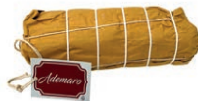
CAP360 CAPOCOLLO ADEMARO FINOCCHIO CARTA