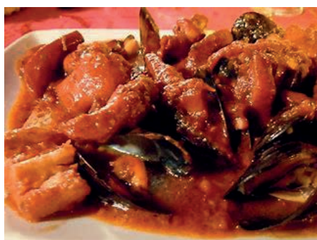
GAD100 CACCIUCCO VASSOIO