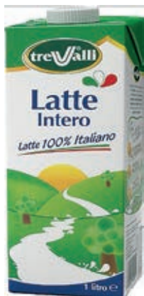
LAT200 LATTE INTERO