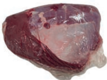
VIT970 PUNTE DI SOTTOFESE SV VITELLONE