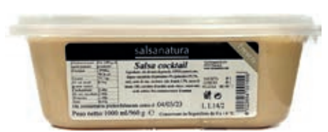
SLS350 SALSA COCKTAIL 3G KG 1