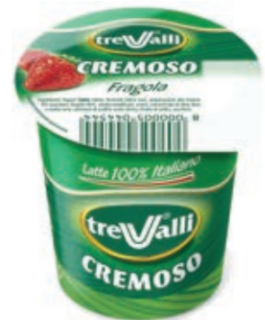
YOG300 YOGURT FRAGOLA ML 125 O.I.