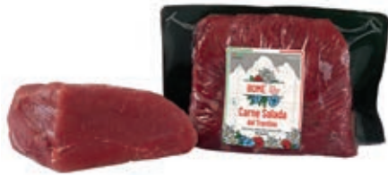
BRE510 CARNE SALADA A 1/2