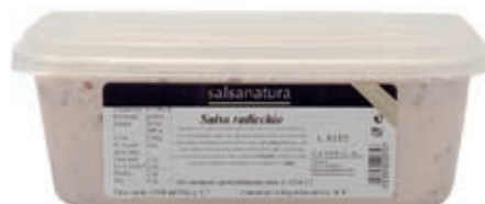
SLS340 SALSA RADICCHIO 3G KG 1