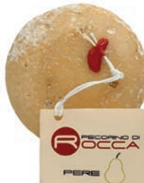
PEP210 PECORINO ROCCA PALLOT. CON PERE