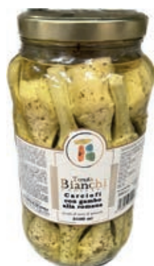
CAR100 CARCIOFI C/G ROMANA ITALIA OSG ML 3100