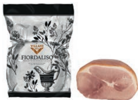
COT300 COTTO FIORDALISO