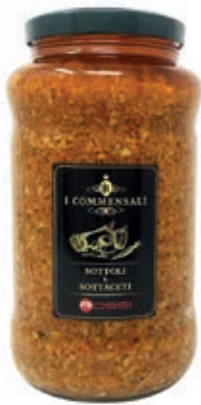
SOT500 FAST FOOD SALSA ML 3100 COMMENSALI