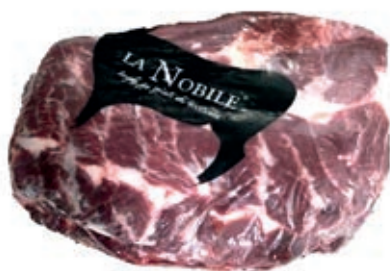
VIT730 CHUCK ROLL B.A. SCOTTONA LA NOBILE