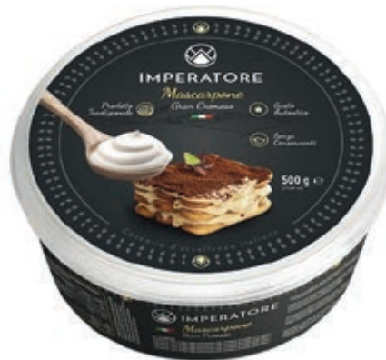
MAS150 MASCARPONE FRANCIA GR 500