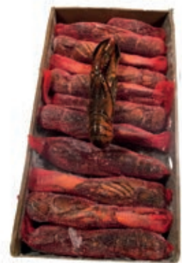
CPE050 ASTICE 350/400