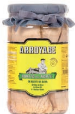
TON300 TONNO BONITO DEL NORTE O.O. KG 2 VETRO