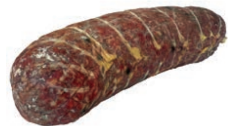
CIS400 SBRICOLONA "CINTA SENESE DOP" KG 2,5 SV