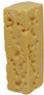
EMM100 EMMENTAL BAVARESE KG 2