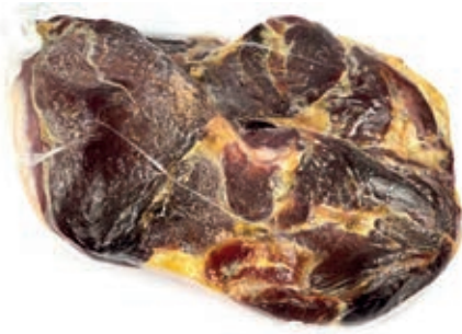
SGE220 SGAMBATO SCOTENNATO SV