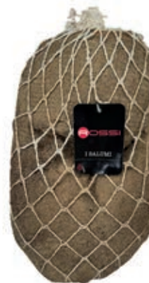
SGE100 SGAMBATO GRANFESA CON PEPE