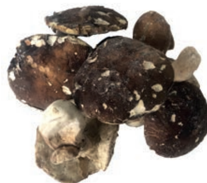
POR120 PORCINO INT. COMMERCIALE CONG. CT