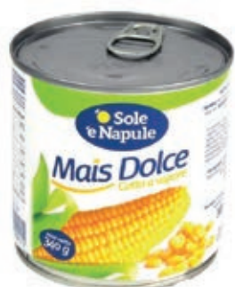
LEG405 MAIS DOLCE 12X0,34