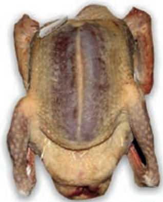
PIU500 PICCIONE INTERO CONG.