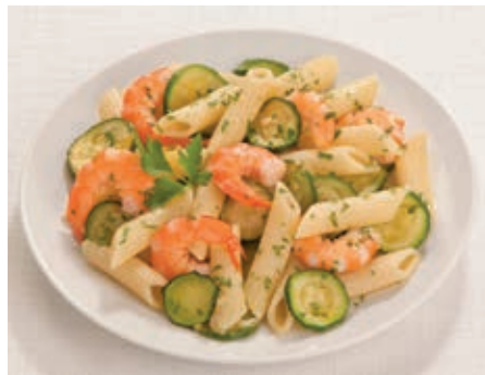
GAM610 PASTA ZUCCHINE E GAMBERETTI MONOP.