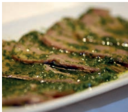
GAM700 GIRELLO ARR. CON SALSA PEPE VERDE MONOP.