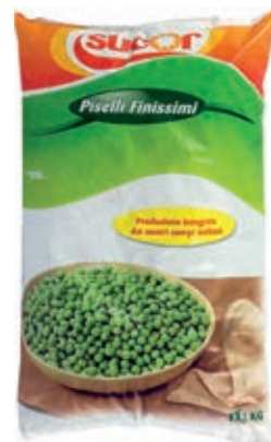
VER600 PISELLI FINISSIMI CONG.