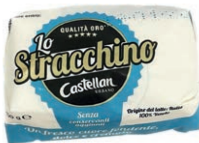
STR200 STRACCHINO GR 250