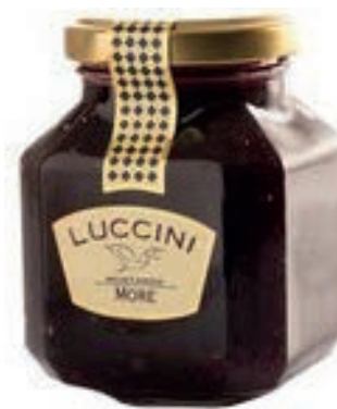
COM130 MOSTARDA MORE GR 440