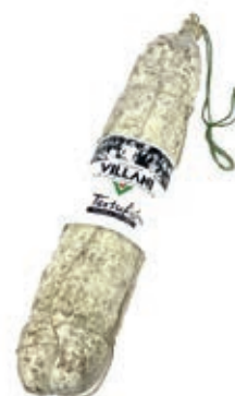
MIL710 SALAME TARTUFO KG 1