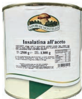
SOT370 INSALATINA ALL'ACETO LATTA 3/1