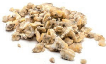
CPE810 VONGOLA PAC. VIET. S/G 700/1000 GR 800