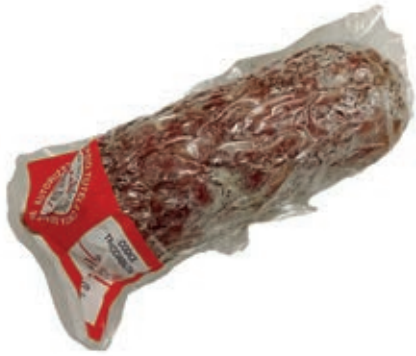
CIS410 SBRIOLONA "CINTA SENESE DOP" 250 GR SV