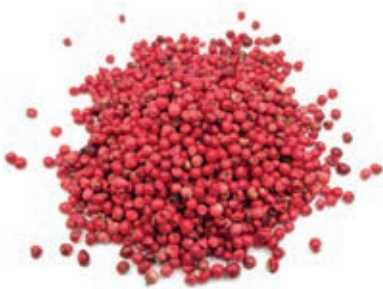
SPZ100 PEPE ROSA GRANI BRASILE KG 1