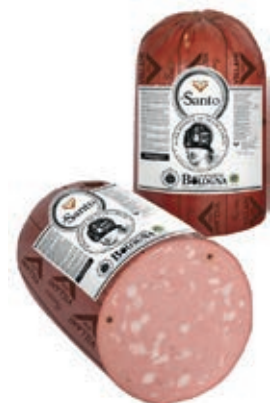
MOS600 MORTADELLA SANTO OV. X 14 A 1/2