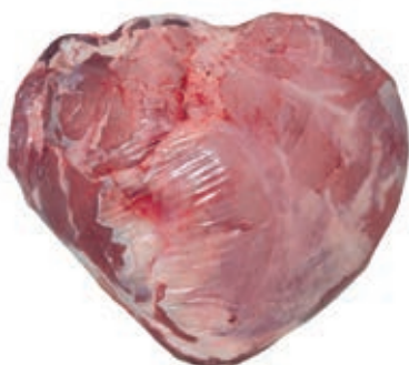
VIT900 FESA SV VITELLONE