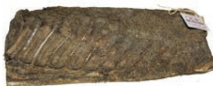
PAN215 RIGATINO SCOSTOLATO BRUSCHI