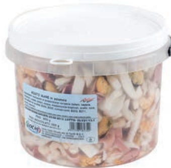
MAR120 LOCAS MISTO MARE SALAM. X 1.5 KG SGOCC.