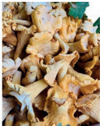
POR900 GALLETTI FRESCHI