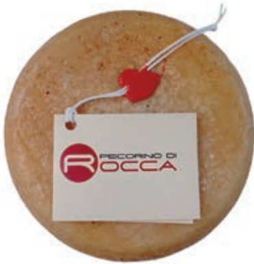
PER230 PECORINO ROCCA SCODELLATO