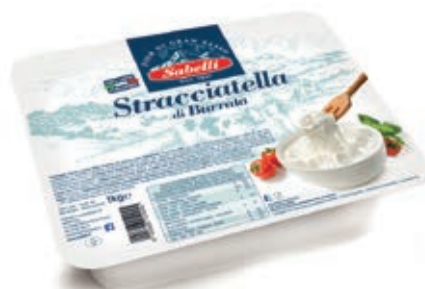
FDL400 STRACCIATELLA SABELLI KG 1 O.I.