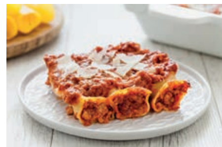
GAP135 CANNOLI POMODORO/RAGU' VASSOIO