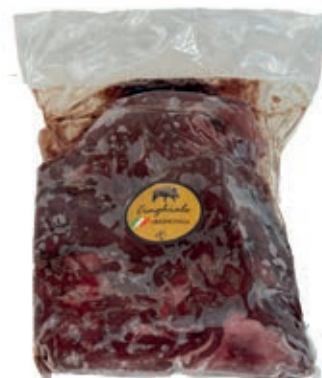
CIC505 POLPA SCELTA CINGHIALE CONG. KG 2,5