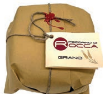
PEP450 PECORINO ROCCA SOTTO GRANO PALLOT.