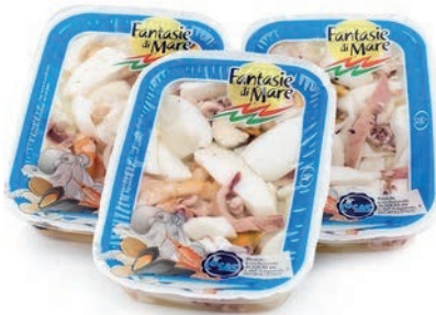
MAR300 ANTIP. MARE SENZA VERDURE VASCA 200 GR.