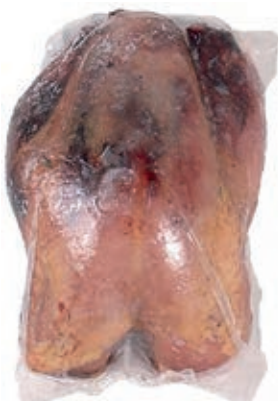
PIU710 FAGIANO PETTO CONG.