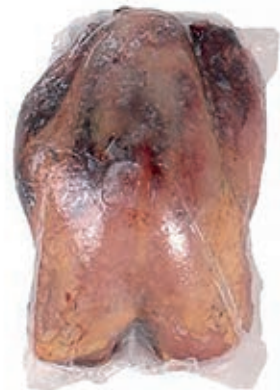
PIU700 FAGIANO BUSTO SPIUMATO CONG.