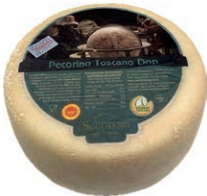
PEF510 PECORINO TOSCANO DOP FRESCO ST 22