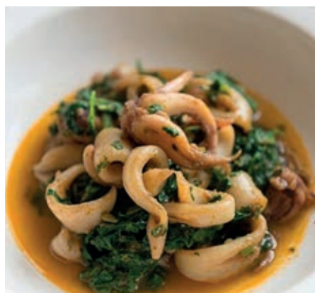
GAD310 SEPIE INZIMINO VASSOIO