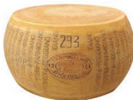
GPR110 PARM. REGG. 30 M. CAS. 993 FORME