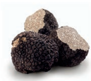
TAR150 TARTUFO ESTIVO prov. Iran