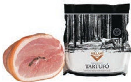
COT010 COTTO AL TARTUFO A 1/2