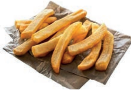
PAT095 PATATE 9X18 STEAKHOUSE KG 2,5X4