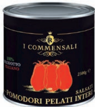
POM100 POMODORI PELATI 6X2,5 'I COMMENSALI' O.I