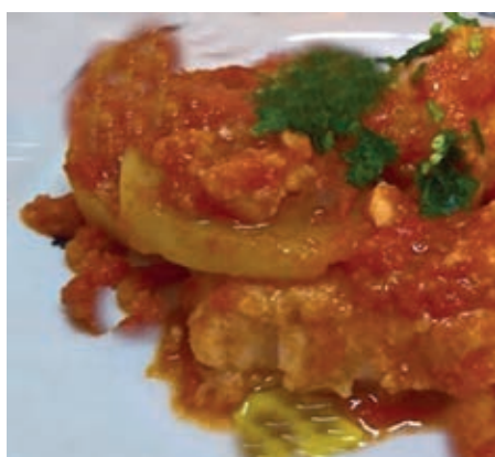
GAD400 BACCALÀ ALLA LIVORNESE VASSOIO