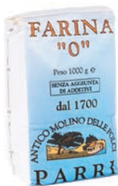
FAR910 FARINA GRANO 0 KG 1