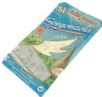
ERB140 GORGONZOLA DOP GR 200 P.F.