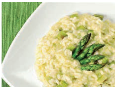
GAM510 RISO AGLI ASPARAGI MONOP.