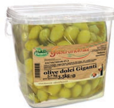
OLI100 OLIVE DOLCI GIGANTI X 3.5 SECCHIO