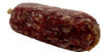
SAL100 SALAME DI MAIALE RUSTICO GR 250 SV