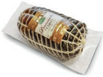
CER100 CERVO PROSCIUTTO S/O