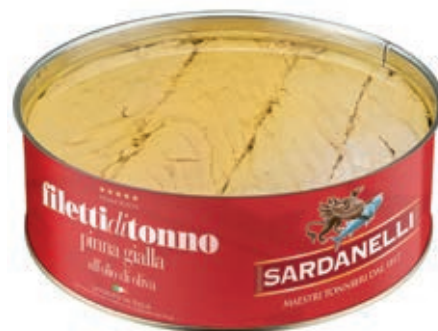
TON100 TONNO O.O. GR 2400 SARDANELLI