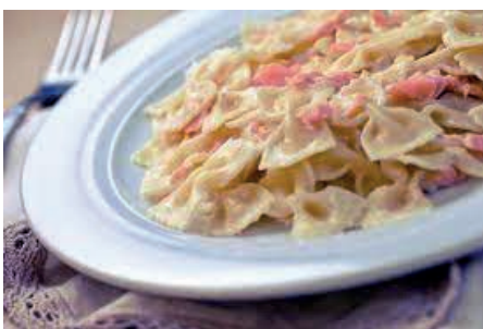
GAP180 FARFALLE AL SALMONE VASSOIO