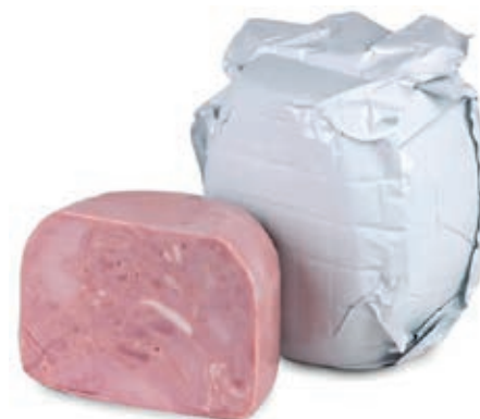
COT755 COTTO BIANCO A 1/2 S/P