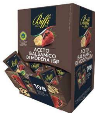
MND100 ACETO BALSAMICO MONODOSE GAIA ML 5 X 198