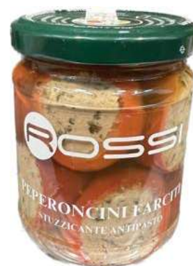
GIA200 PEPERONCINI FARCITI CON TONNO GR. 180 X 6