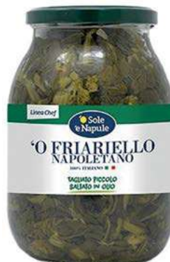
LEG500 FRIARIELLI NAPOLETANI VETRO X 0.96 O.I.