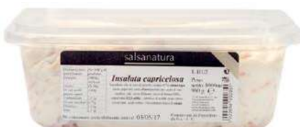
SLS310 SALSA CAPRICCIOSA 3G KG 1