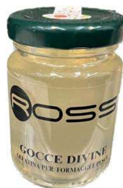
COM210 GOCCE DIVINE GR. 100 X 6