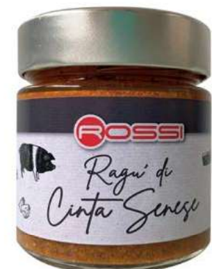
RAG270 RAGU DI SUINO RAZZA CINTA SENESE GR 210