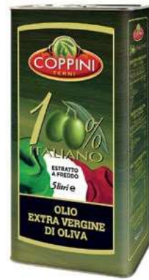
EVO100 OLIO E.V.O. ITALIA LAV. A FREDDO 5LT LATTA