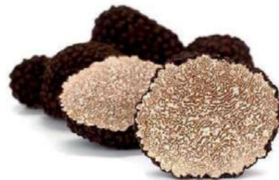
TAR110 TARTUFO NERO UNCINATO "Tuber Unc" prov. UE