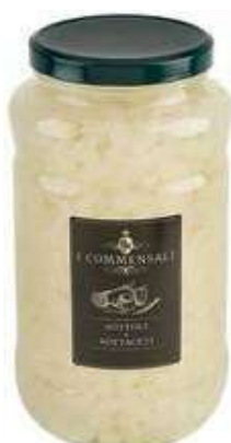
SOT210 CIPOLLINE BIANCHE PERLINE ML 3100 COMMENSALI