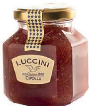
COM110 MOSTARDA CIPOLLA GR 440