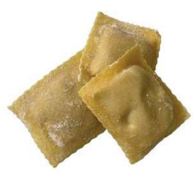
PAS710 TORTELLI DI PATATE ROSSI ATM GR 500