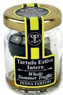
TAR210 TARTUFO ESTIVO INTERO SALAMOIA GR 25/18