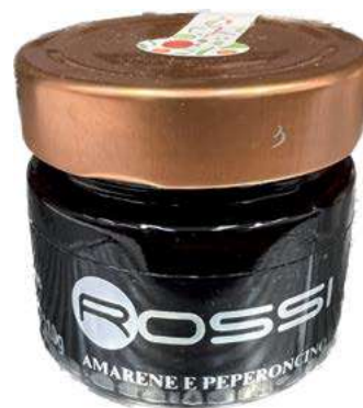
COM260 CONFETTURA DI AMARENE E PEPERONC.GR110X6