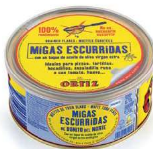
TON730 TONNO BRICIOLE BONITO NORTHE GR 670