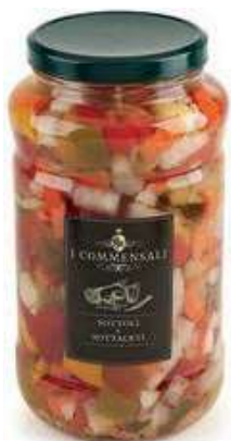
SOT350 GIARDINIERA ML 3100 COMMENSALI