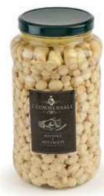
SOT430 CHAMPIGNONS PICCOLI ML 3100