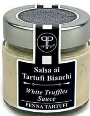
TAR320 SALSA TARTUFO BIANCO 5% GR. 90