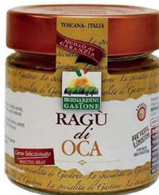
RAG260 RAGU' DI OCA 220 GR