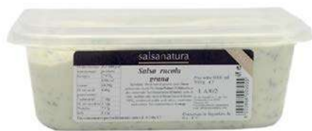
SLS330 SALSA RUCOLA E GRANA 3G KG 1