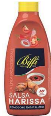
SLS530 SALSALSA HARISSA TWISTER GAIA 900 GR