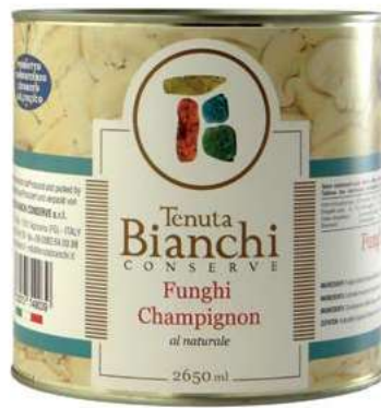
FUG400 FUNGHI CHAMPIGNONS NATUR. X 2.5