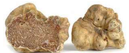
TAR090 TARTUFO BIANCO PREGIATO (proven. Umbria)