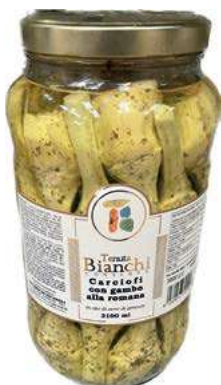
CAR100 CARCIOFI C/G ROMANA ITALIA OSG ML 3100