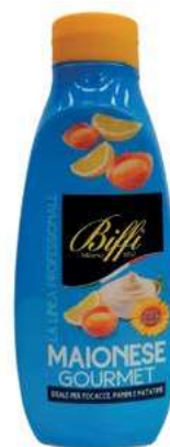
SLS210 MAIONESE GOURMET 820