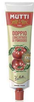
POM920 DOPPIO CONCENTRATO MUTTI TUBO GR 130 O.I.