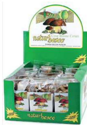
FUN910 FUNGHI PORCINI SECCHI GR 40