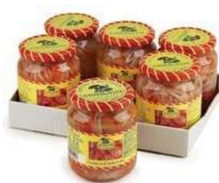
SOT910 INSALATINA CAPRICCIOSA 370 ML