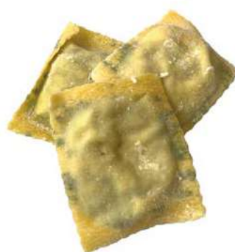
PAS700 RAVIOLI MAREMMANI ROSSI ATM GR 500