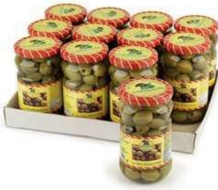
SOT980 OLIVE VERDI DENOCCIOLATE 314 ML