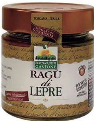
RAG220 RAGU' DI LEPRE 220 GR O.I.