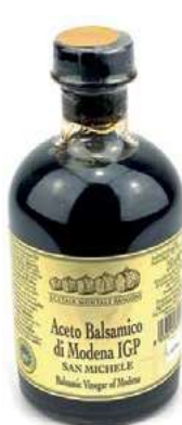
ACE400 ACETO BALSAMICO ML 250