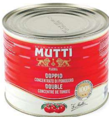
POM900 DOPPIO CONCENTRATO MUTTI X 2.5 O.I.