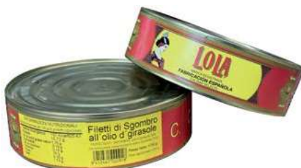
TON807 FIL. SGOMBRO OLIO DI SEMI KG 1,750