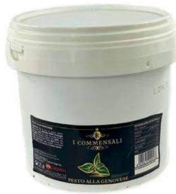
PST200 PESTO ALLA GENOVESE X 2.5 KG