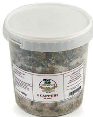
SOT100 CAPPERI AL SALE KG 6