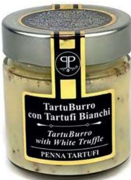
TAR600 BURRO E TARTUFO BIANCO 5% SPEC. GAST. GR 200