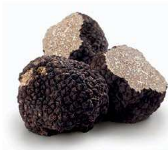
TAR150 TARTUFO ESTIVO prov. Iran