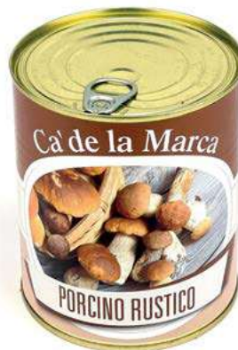
FUG110 FUNGHI PORCINI RUSTICO TRIFOLATO 4/4