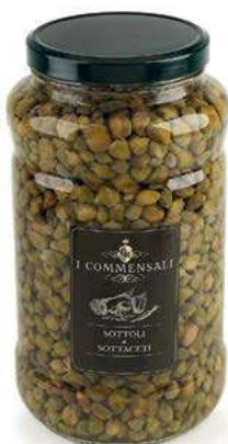
SOT120 CAPPERI P.C. ML 3100 CAL 10/12