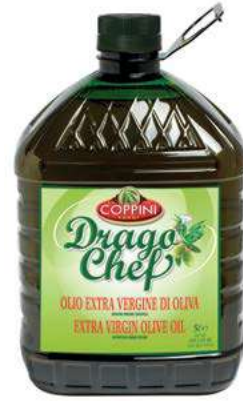
EVO210 OLIO E.V.O. COPPINI 5 LT PET