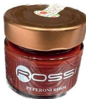
COM240 COMPOSTA DI PEPERONI ROSSI GR. 110 X 6