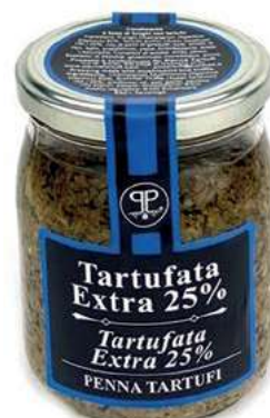
TAR330 SALSA TARTUFO GR 500 25%