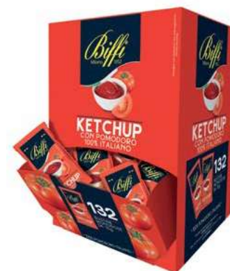
MND400 KETCHUP GR 10 X 132