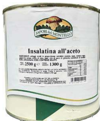
SOT370 INSALATINA ALL'ACETO LATTA 3/1