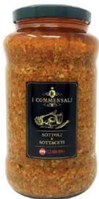
SOT500 FAST FOOD SALSA ML 3100 COMMENSALI