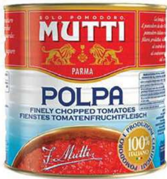
POM400 POMODORI POLPA MUTTI 2.5 KG