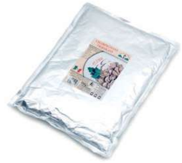
FUG410 FUNGHI CHAMPIGNON TRIF. BUSTA 1700 GR