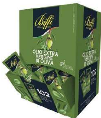
MND200 OLIO EXTRAV. GAIA ML 10 X 100