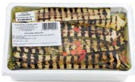
SOT800 ZUCCHINE ARROSTITE KG 1.350