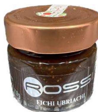
COM280 CONFETTURA DI FICHI UBRIACHI GR110 X 6