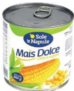
LEG405 MAIS DOLCE 12X0,34