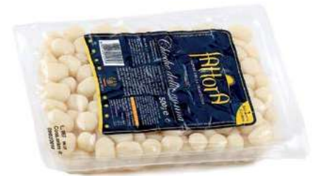
PAS410 CHICCHE DELLA NONNA X 500