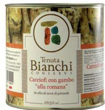
CAR200 CARC.GAMB.ROMAN.ITALIA OSG ML 2650 LATTA