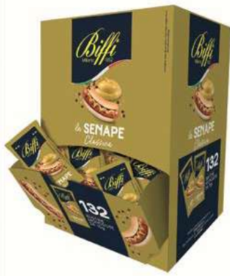
MND500 SENAPE GR 10 X 132