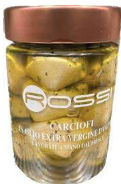
GIA300 CARCIOFI IN OLIO EVO GR 320 X 6