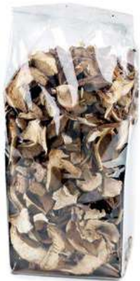
FUN900 FUNGHI PORCINI SECCHI GR 500