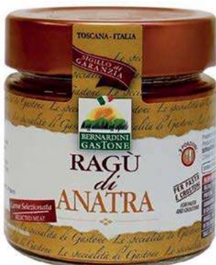
RAG250 RAGU' DI ANATRA 220 GR