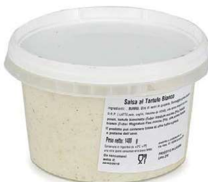
SAT100 SALSA AL TARTUFO BIANCO X 1.4 KG