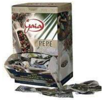
MND700 PEPE MONODOSE GAIA 0.2 X 500