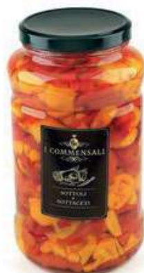
SOT410 PEPERONI R&G FILETTI ML 3100 COMMENSALI