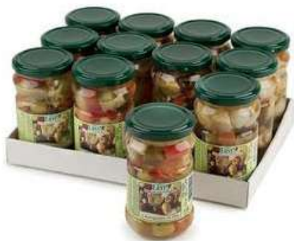
SOT905 ANTIPASTO VERDURE 314 ML