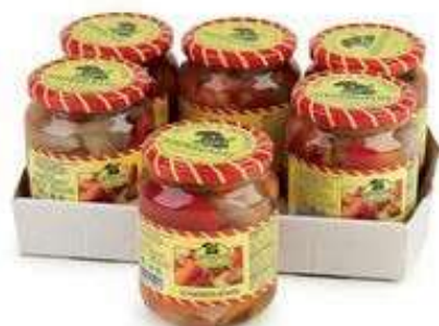
SOT900 GIARDINIERA 370 ML