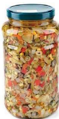
SOT330 MISTORISO TOP ML 3100