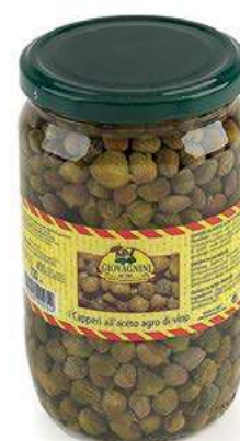
SOT140 CAPPERI LACRIMELLA ML 720