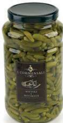
SOT420 CETRIOLINI PICCOLI ML 3100 COMMENSALI