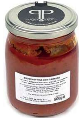
TAR500 SALSА POMODORO E TARTUFO GR 500 5%