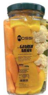
GIA100 GIARDINIERA AGRODOLCE GR 3050 VASO QUADRO