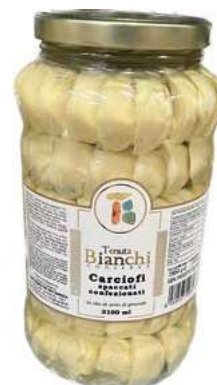
CAR110 CARCIOFI SPACC.ACCOM. ITALIA OSG ML 3100