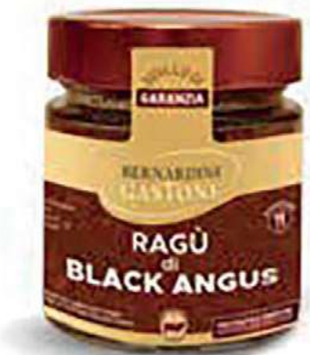
RAG230 RAGU' DI BLACK ANGUS 220 GR