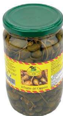
SOT130 CAPPERI CON GAMBO ML 720