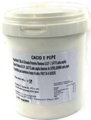
SLS400 SALSALSA CACIO E PEPE X 900 GR