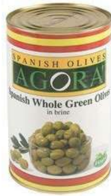
OLI520 OLIVE VERDI DEN. LATTA X 4