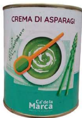
CRE400 CREMA DI ASPARAGI LATTA 4/4