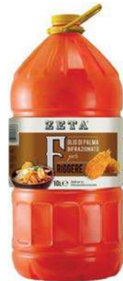
EVO500 OLIO PALMA BIFRAZIONATO X 10 PET