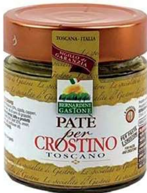
RAG100 PATE' PER CROSTINO TOSCANO 220 GR