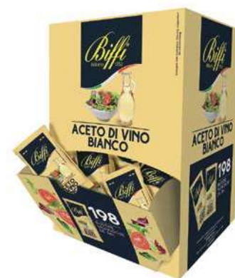
MND105 ACETO DI VINO BIANCO MONODOSE ML 5 X 198