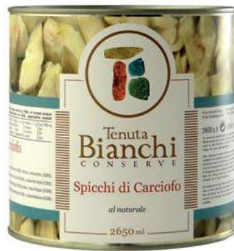
CAR210 CARCIOFI SPICCHI NATUR. X 2.5