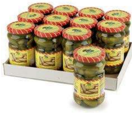
SOT960 CETRIOLINI 314 ML