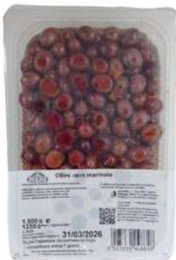
OLI210 OLIVE NERE MAR.VASCA 2KG