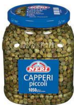
SOT155 CAPPERI ACETO PICCOLI 7/8 ML 1500