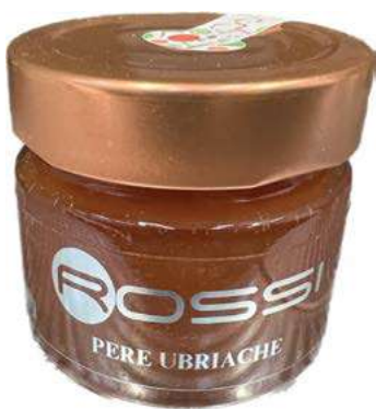
COM290 CONFETTURA DI PERE UBRIACHE GR110 X 6