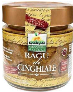
RAG210 RAGU' DI CINGHIALE 220 GR