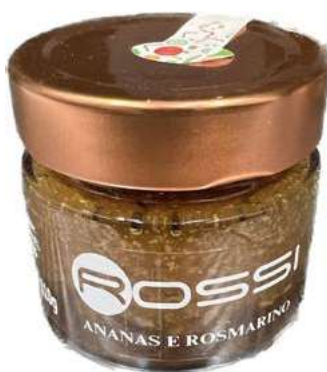
COM250 CONFETTURA DI ANANAS E ROSMARINO GR110X6