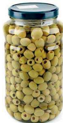
OLI410 OLIVE VERDI DENOCC. ML 3100 COMMENSALI