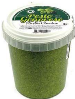
PST100 PESTO KG 1 SENZA AGLIO