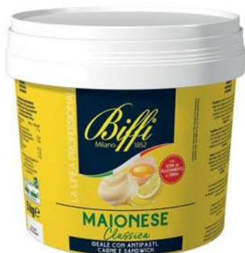
SLS110 MAIO GASTRONOMICA 1 X 5000