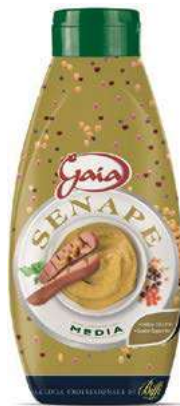
SLS520 SENAPE TWISTER GAIA 820 GR