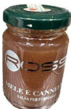
COM270 CONFETTURA DI MELE E CANNELLA GR110 X 6