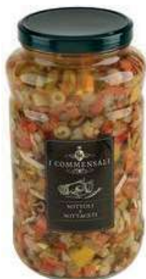
SOT320 MISTORISO SENZA MAIS E WURSTEL ML 3100