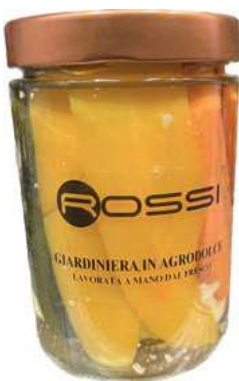
GIA120 GIARDINIERA IN AGRODOLCE GR. 540 X 6