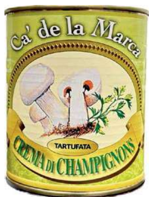
CRE100 CREMA CHAMPIGNON AL TARTUFO 4/4