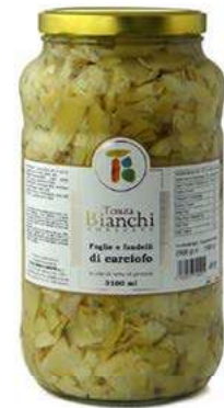
CAR220 CARCIOFI FOGLIE E FOND.OSG ITALIA ML3100