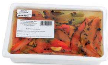
SOT820 PEPERONI ARROSTITI KG 1.350