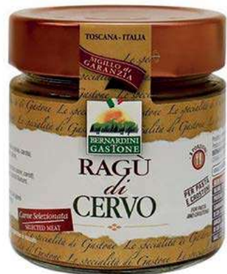
RAG240 RAGU' DI CERVO 220 GR