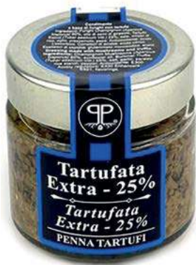
TAR340 SALSA TARTUFO GR 90 25%