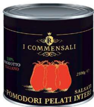
POM100 POMODORI PELATI 6X2,5 'I COMMENSALI' O.I