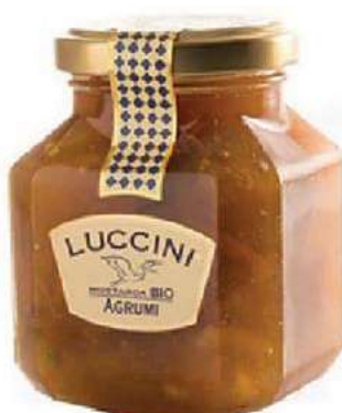
COM120 MOSTARDA AGRUMI GR 440