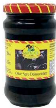
SOT985 OLIVE NERE DENOCCIOLATE 314 ML