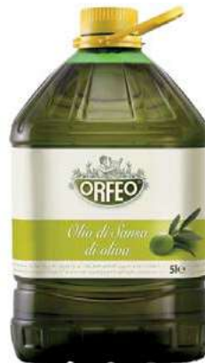
EVO400 OLIO SANS E OLIVA LT 5 PET