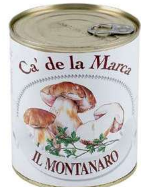
FUG310 FUNGHI MONTANARO 4/4