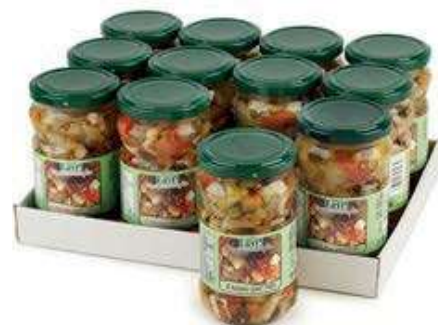
SOT915 MISTORISO 314 ML