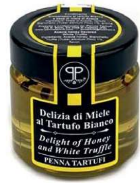
TAR620 MIELE ACACIA AL TARTUFO BIANCO PREG. GR 140