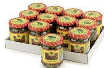
SOT940 CAPPERI OCCHIELLO 212 ML