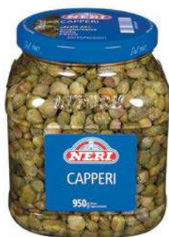
SOT150 CAPPERI ACETO 12/13 ML 1500