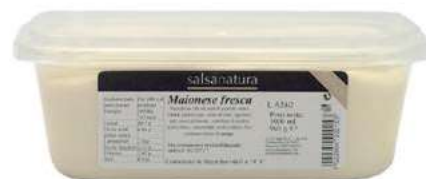
SLS100 MAIONESE FRESCA 5 KG 3G