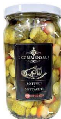
SOT340 SPIEDINI DI VERDURE ACETO ML 1850