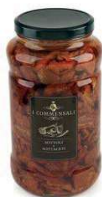
SOT400 POMODORI SECCHI ML 3100 COMMENSALI