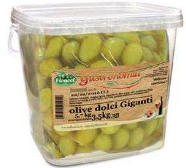
OLI100 OLIVE DOLCI GIGANTI X 3.5 SECCHIO