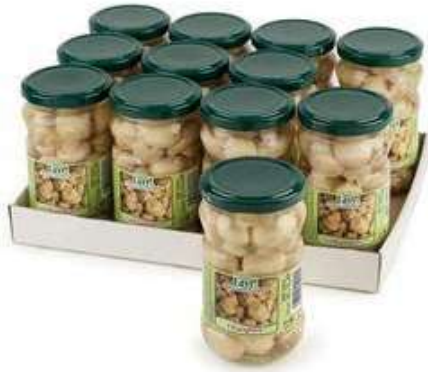
SOT950 FUNGHI CHAMPIGNON INTERI 314 ML