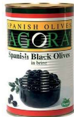
OLI500 OLIVE NERE INT. LATTA KG 4