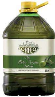
EVO200 OLIO E.V.O. LT 5 ORFEO UE PET