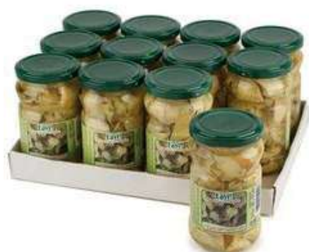
SOT930 CARCIOFI TAGLIATI 314 ML