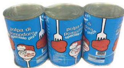
POM200 POLPA LATTA 3 X 4.05