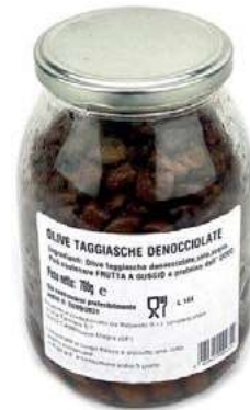
OLI300 OLIVE TAGGIASCHE DENOCC. GR 700 SGOC.