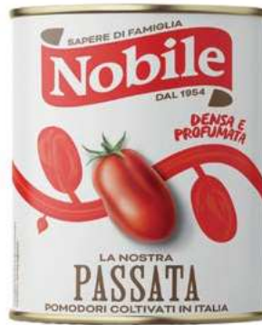
POM410 POMODORI PASSATA 6 X 3 O.I.