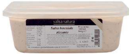
SLS370 SALSALSA BOSCAIOLA PICCANTE 3G KG 1