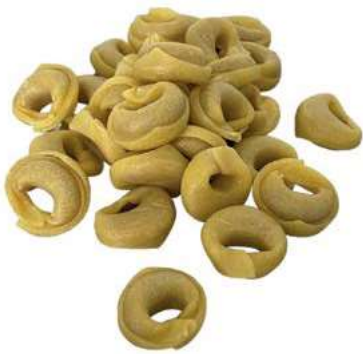
PAS600 TORTELLINI ATM GR 500