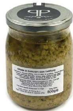
TAR520 CREMA CARCIOFI E TARTUFO GR 500 5%