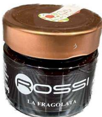
COM230 LA FRAGOLATA GR.110 X 6