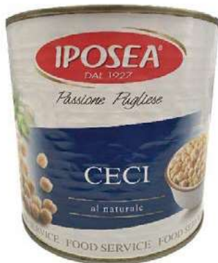
LEG200 CECI 6 X 3