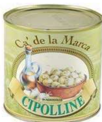
SOT220 CIPOLLE BORRET. LATTI 3/1