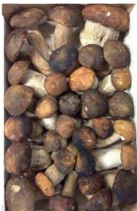
POR700 PORCINI FRESCHI EXTRA