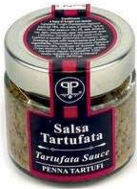
TAR360 SALSА TARTUFO GR 90 5%