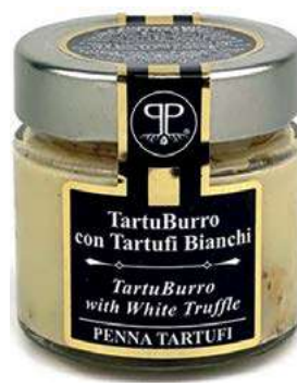
TAR610 BURRO TARTUFO BIANCO GR 90