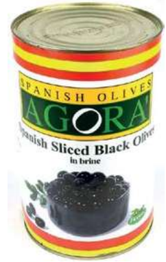
OLI530 OLIVE NERE RONDELLE LATTA