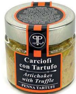
TAR530 CREMA CARCIOFI E TARTUFO GR 90 5%