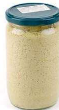
CRE410 CREMA DI ASPARAGI GR 580