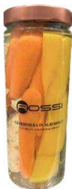
GIA110 GIARDINIERA IN AGRODOLCE GR. 1000 X 6