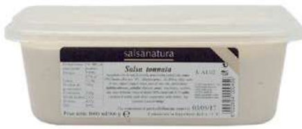
SLS360 SALSALSA TONNATA 3G KG 1