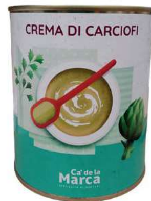
CRE300 CREMA DI CARCIOFI LATTA 4/4