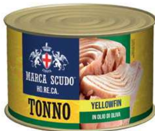
TON700 TONNO O.S. GR 1730