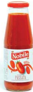
POM800 POMODORI PASSATA 12X680 GR. O.I.