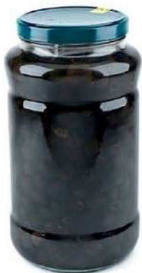
OLI400 OLIVE NERE DENOCC. ML 3100 COMMENSALI