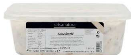
SLS320 SALSA AI FUNGHI 3G KG 1