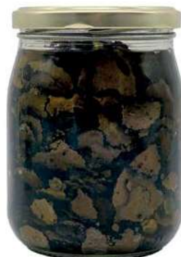
TAR220 CARPACCIO TARTUFO ESTIVO GR. 500