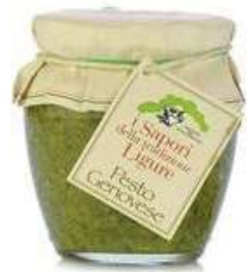
PST300 PESTO ALLA GENOVESE GR 130