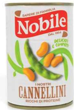
LEG111 CANNELLINI 12 X 0.4