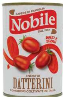
POM511 POMODORI DATTERINO 12X 400 GR