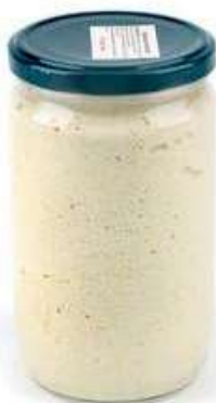
CRE310 CREMA DI CARCIOFI GR 580