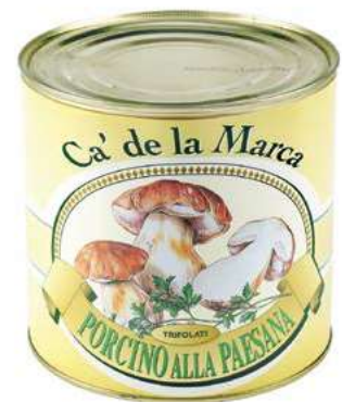
FUG200 FUNGHI ALLA PAESANA 3/1