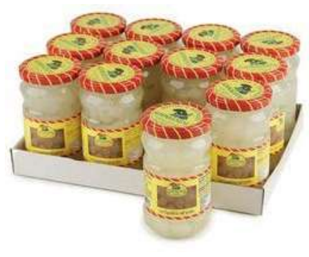
SOT970 CIPOLLINE BIANCHE 314 ML