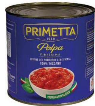
POM450 POLPA POMODORO PRIMETTA LATTA 2650