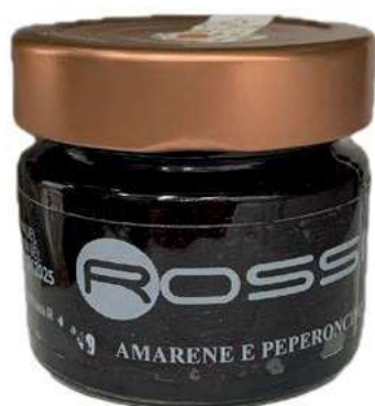
COM265 CONFETTURA DI AMARENE E PEPERONC.GR350