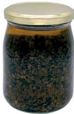
TAR410 PATE' TARTUFO NERO ESTIVO GR.500