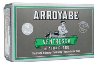
TON750 VENTRESCA YELLOWFIN GR 120 LATTA