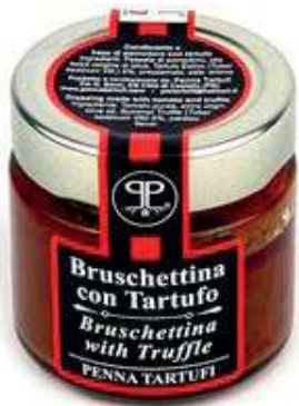
TAR510 SALSА POMODORO E TARTUFO GR 90 5%