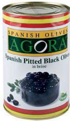
OLI510 OLIVE NERE DEN. LATTA X 4