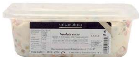
SLS300 INSALATA RUSSA 3G KG 1