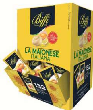
MND300 MAIONESE GR 10 X 132