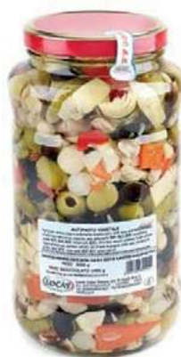
SOT300 ANTIPASTO VEGETALE LOCAS ML 3100