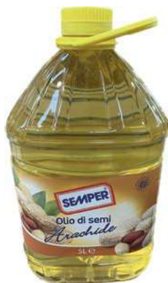
EVO700 OLIO ARACHIDE PET X 5