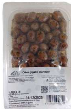
OLI220 OLIVE VERDI MAR. VASCA 2 KG