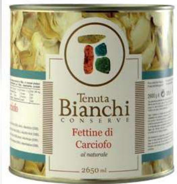
CAR320 CARCIOFI FETTE NATUR. X 2.5