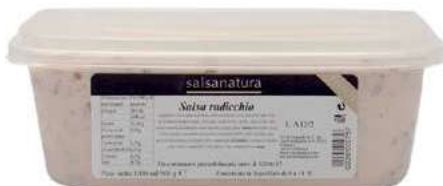
SLS340 SALSA RADICCHIO 3G KG 1