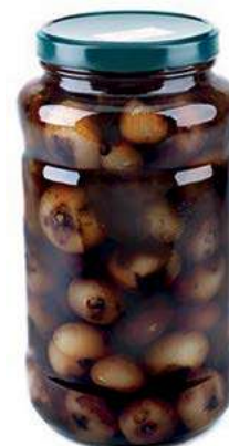
SOT200 CIPOLLE ACETO BALSAMICO ML 3100 COMMENSALI