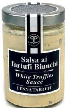
TAR300 SALSA TARTUFO BIANCO 5% GR 500