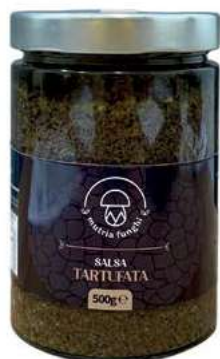
TAR240 TAPENADE AL TARTUFO GR 500