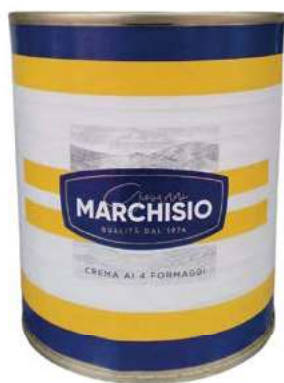
CRE200 CREMA AI 4 FORMAGGI LATTA 4/4