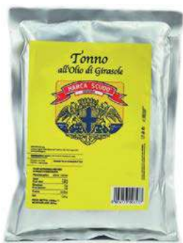
TON720 TONNO BUSTA KG 1