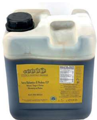
ACE100 ACETO BALSAMICO 5 LT