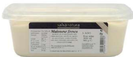
SLS200 MAIONESE CLASSICA ML 1000