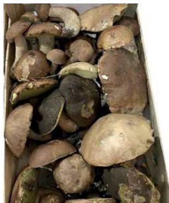
POR710 PORCINI FRESCHI COMMERCIALI