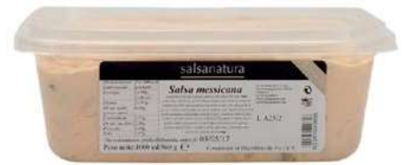
SLS380 SALSALSA MESSICANA 3G KG 1