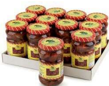
SOT920 POMODORI SECCHI 314 ML