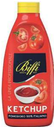
SLS510 KETCHUP 950 TW