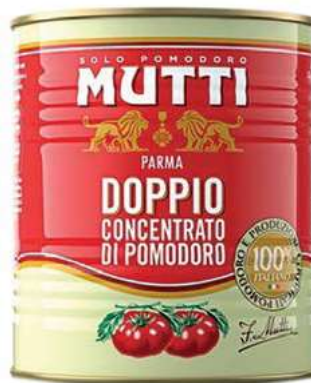
POM910 DOPPIO CONCENTRATO MUTTI X 1 O.I.