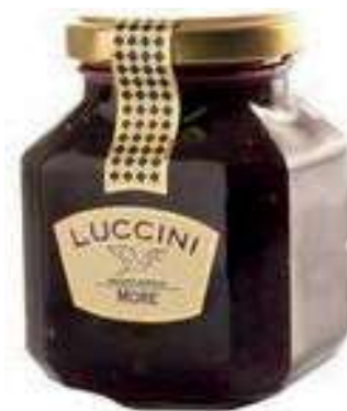
COM130 MOSTARDA MORE GR 440