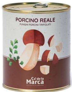
FUG100 FUNGHI PORCINI REALE TRIF. 4/4