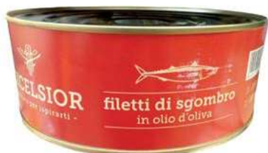
TON800 FIL. SGOMBRO OLIO OLIVA KG 2.450