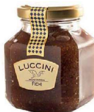
COM100 MOSTARDA FICHI GR 440