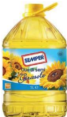
EVO600 OLIO SEMI GIRASOLE LT 5 PET