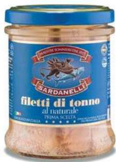
TON420 TONNO VETRO NATURALE GR 200 SARDANELLI