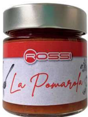
RAG295 POMAROLA ROSSI GR 210