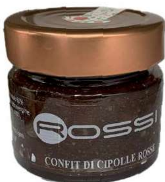
COM205 CONFIT DI CIPOLLE ROSSE GR. 350