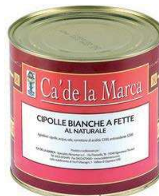
SOT230 CIPOLLE FETTE NAT. 3/1