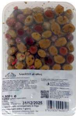
OLI600 OLIVE MISTE MARINATE KG 1,5