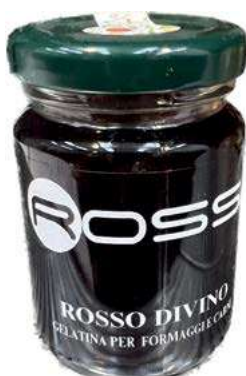
COM220 ROSSO DIVINO GR. 100 X 6