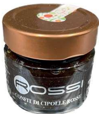
COM200 CONFIT DI CIPOLLE ROSSE GR. 110 X 6