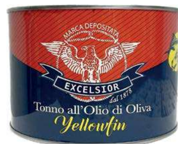
TON710 TONNO GR 1350 OLIO OLIVA