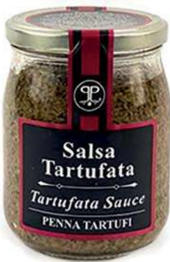
TAR350 SALSA TARTUFO GR 500 5%