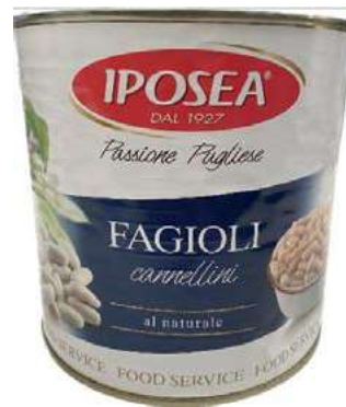
LEG100 FAGIOLI CANNELLINI 6 X 3