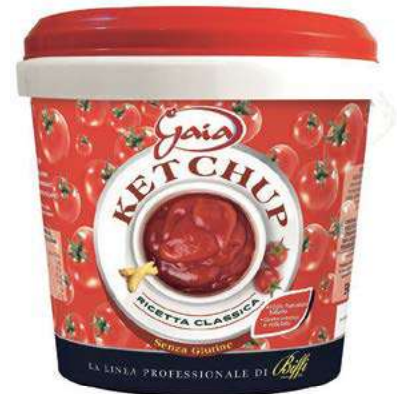
SLS500 KETCHUP GAIA KG 5