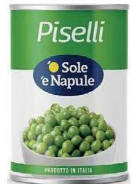
LEG300 PISELLI 24 X 0.4