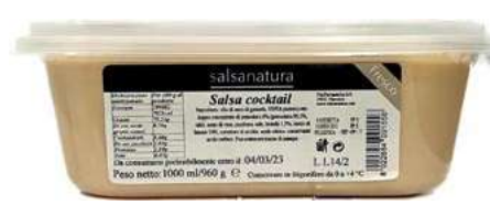
SLS350 SALSA COCKTAIL 3G KG 1