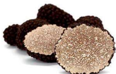
TAR130 TARTUFO NERO PREG. Tubermelan.(Pr.Umbria)