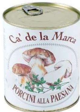
FUG210 FUNGHI ALLA PAESANA 4/4