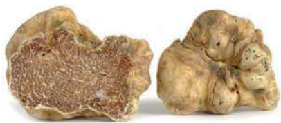
TAR095 TARTUFO BIANCO CUCINA