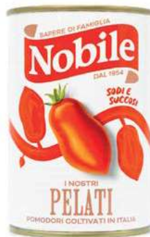
POM521 POMODORI PELATI 12 X 400 GR