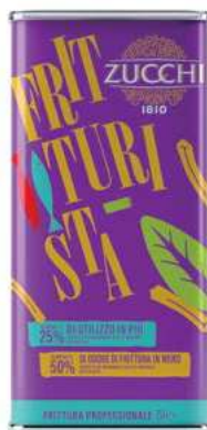
EVO800 OLIO FRITTURISTA LATTA X 5