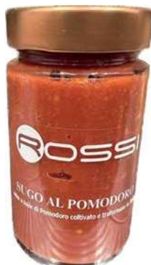
GIA400 SUGO AL POMODORO BOTTIGLIA GR.260 X 6