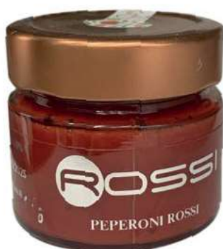
COM245 COMPOSTA DI PEPERONI ROSSI GR. 310