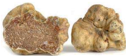
TAR100 TARTUFO BIANCHETTO "Tuber Borchii" (Pr. UE)