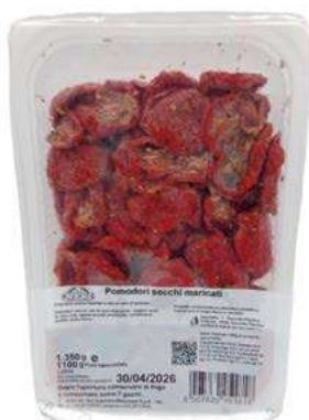
SOT830 POMODORI SECCHI CONDITI VASCA X 1 KG.