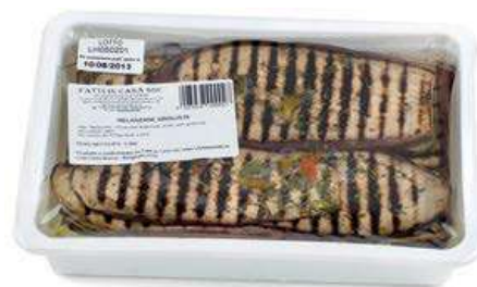
SOT810 MELANZANE ARROSTITE KG 1.350