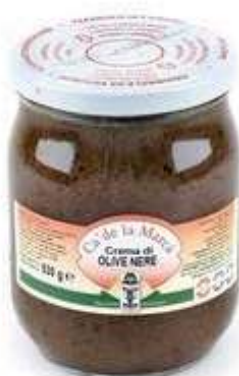
CRE500 CREMA OLIVE NERE VASO GR 530