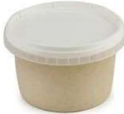
SLS410 SALSALSA DI NOCI X 1.5 KG