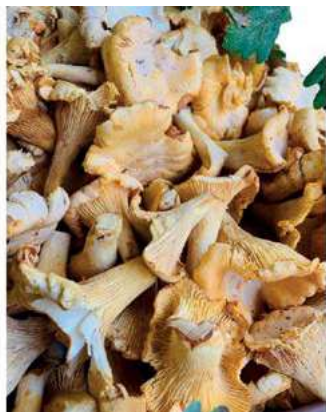
POR900 GALLETTI FRESCHI