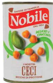
LEG211 CECI 12 X 0.4