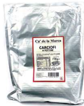
CAR310 CARCIOFI FETTE S/ACETO BUSTA 1700 GR