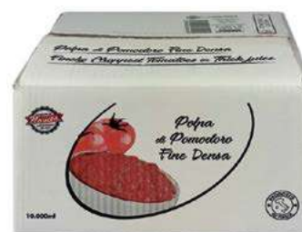
POM300 POMODORI POLPA FINE BAG IN BOX 2 X 5