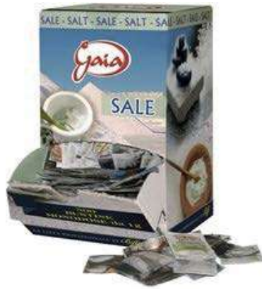
MND600 SALE MONODOSE GAIA 1 GR X 500