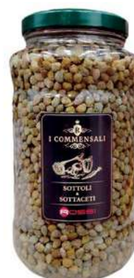
SOT110 CAPPERI LACRIMELLA ML 3100 COMMENSALI