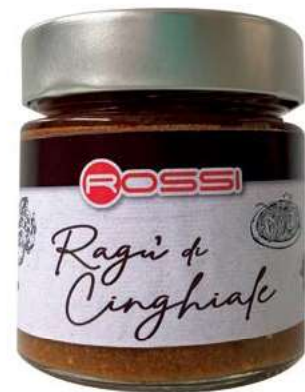
RAG215 RAGU DI CINGHIALE ROSSI GR 210