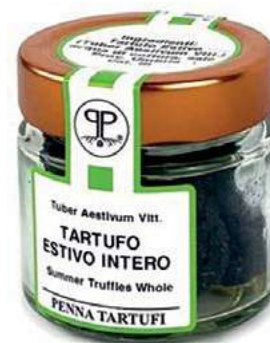
TAR200 TARTUFO ESTIVO GR. 40/50