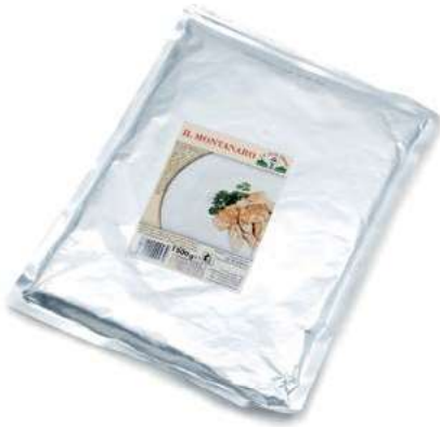
FUG320 FUNGHI IL MONTANARO BUSTA GR 1500