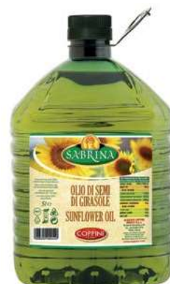
EVO650 OLIO SEMI GIRASOLE PET X 5 COPPINI