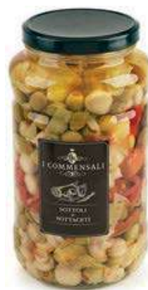
SOT310 TRE GUSTI ML 3100