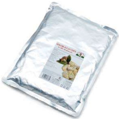
CAR300 CARCIOFI SPICCHI BUSTA GR 1700