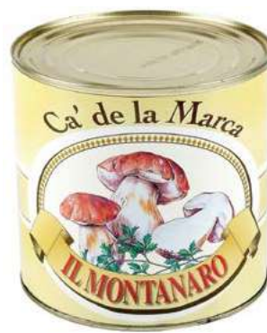
FUG300 FUNGHI MONTANARO TRIF. 3/1