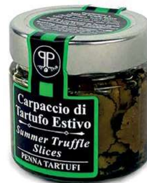
TAR230 CARPACCIO TARTUFO ESTIVO GR. 90