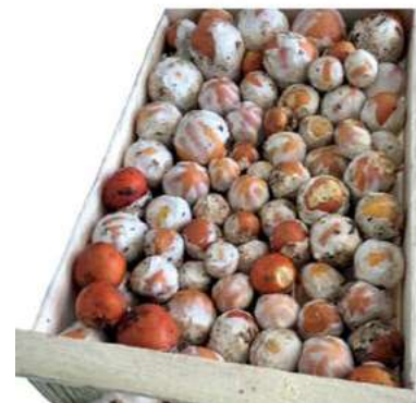
POR800 OVOLI FRESCHI