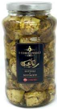
CAR205 CARCIOFI ALLA BRACE INTERI PUGLIA ML3100