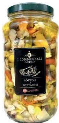
SOT290 ANTIPASTO NONNO GUALTIERO ML 3100 LIGHT