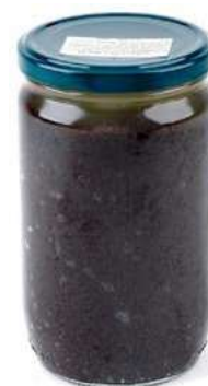
SAT200 SALSA AL TARTUFO GR 580