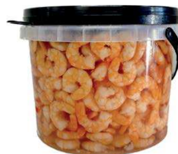
MAR500 MAZZANCOLLE SECCHI X 1,5 KG SGOCC.