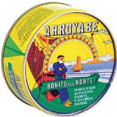
TON220 TONNO BONITO DEL NORTE O.O. GR 260 LATTA