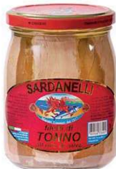
TON400 TONNO O.O. GR 540 SARDANELLI VETRO