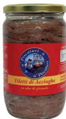
ACC210 FILETTI ACCIUGA O/S GR 700