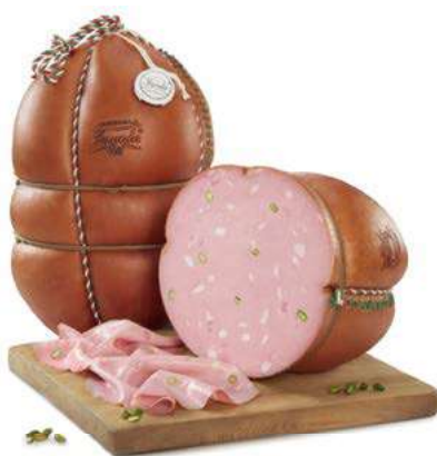
FAV200 MORTADELLA FAVOLA GRAN RISER. PIST. SV O.I