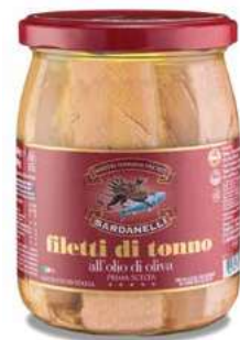
TON210 TONNO O.O. GR 620 SARDANELLI