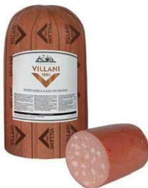
MOP200 MORTADELLA S. PETRONIO X 6 1/2 2PZ