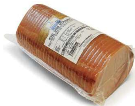
SLM300 PESCE SPADA 120