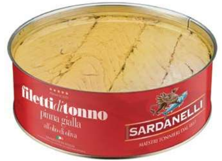
TON100 TONNO O.O. GR 2400 SARDANELLI