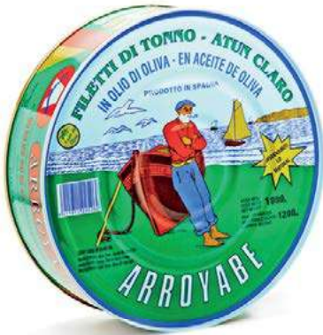
TON110 TONNO FILETTO PINNA GIALLA GR 1800