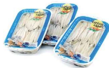
MAR630 FIL. ALICI MARINATE VASCA 200 GR.