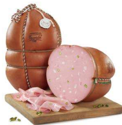
FAV210 MORTADELLA FAVOLA GRAN RISER. PIST. 1/2 SV