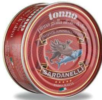
TON230 TONNO O.O. GR 160 SARDANELLI