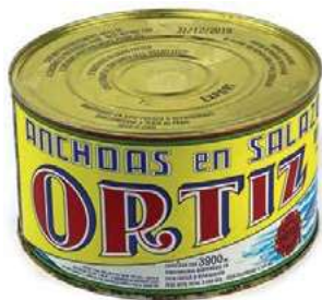
ACC730 ACC. SPAGNA KG 5 ORTIZ (14 P)