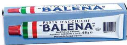
ACC800 PASTA ACCIUGHE BALENA