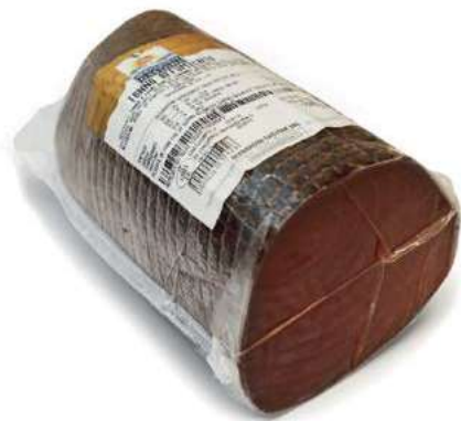
SLM100 TONNO 120