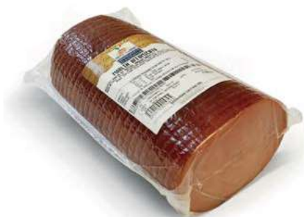
SLM200 MARLIN 120