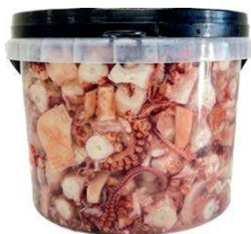
MAR400 POLPO IN SALAMOIA SEC. X 1,50 KG SGOCC.