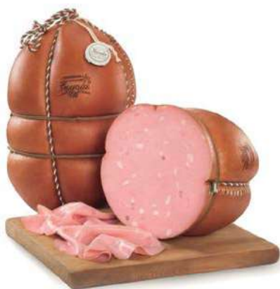
FAV110 MORTADELLA FAVOLA GRAN RISERVA 1/2 SV