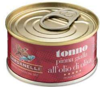
TON240 TONNO O.O. GR 80 SARDANELLI