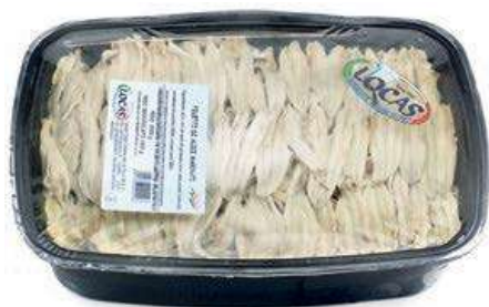
MAR610 LOCAS ALICI MARINATE X 2