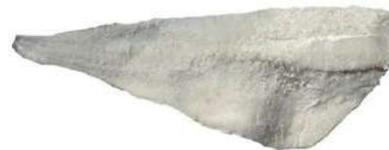
BAC200 FIL. BACCALÀ COD GADUS MORHUA 4/7 KG 5