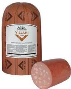
MOP110 MORTADELLA S. PETRONIO X 30 1/2 PIST