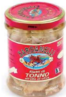
TON410 TONNO VETRO O.O. S.F. GR 190 SARDANELLI