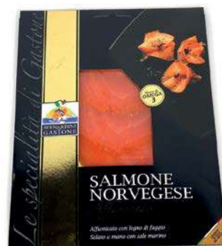
SLM540 SALMONE FETTE GR 100