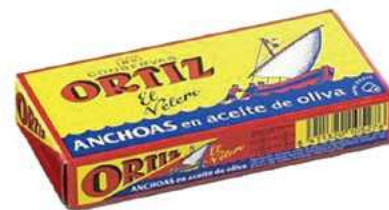
ACC140 FILETTI ACCIUGA SPAGNA O.O. GR 47,5