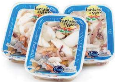
MAR300 ANTIP. MARE SENZA VERDURE VASCA 200 GR.