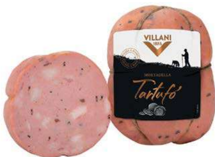
MOT100 MORTADELLA AL TARTUFO VESC. SV X 0.600