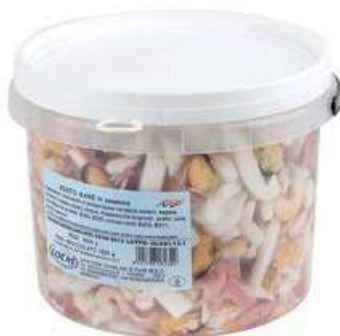
MAR120 LOCAS MISTO MARE SALAM. X 1.5 KG SGOCC.