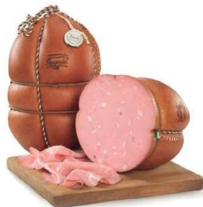
FAV100 MORTADELLA FAVOLA GRAN RISERVA O.I. SV