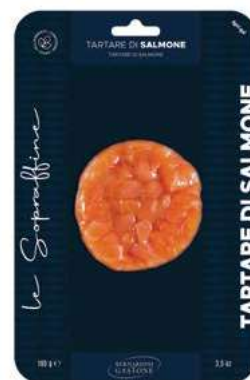
TRT840 TARTARE DI SALMONE GR 100