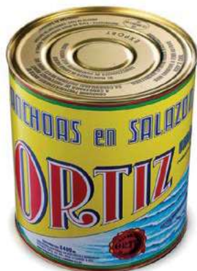
ACC605 ACC. SPAGNA KG 10 ORTIZ (10/11 P)