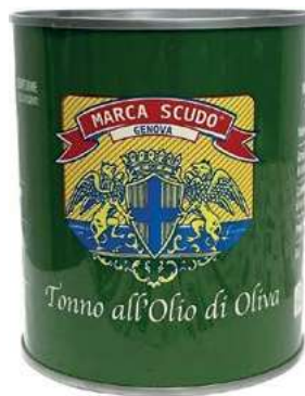
TON200 TONNO GR 800 LATTA