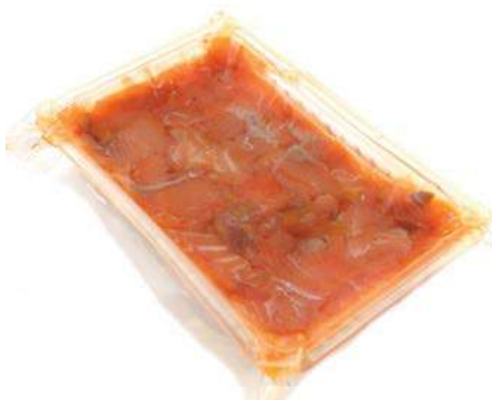
SLM520 SALMONE RITAGLI GOURMET GR 500