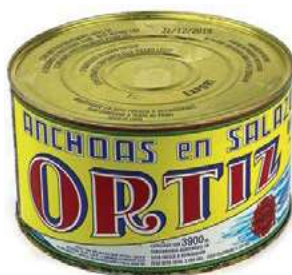
ACC715 ACC. SPAGNA KG 5 ORTIZ (9 P)