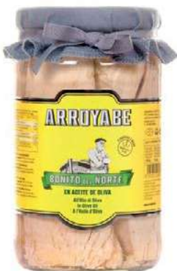
TON300 TONNO BONITO DEL NORTE O.O. KG 2 VETRO