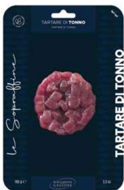
TRT820 TARTARE DI TONNO GR 100