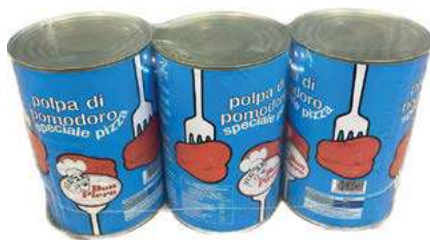
POM200 POLPA LATTA 3 X 4.05