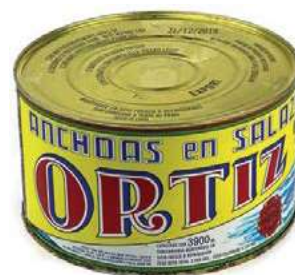
ACC720 ACC. SPAGNA KG 5 ORTIZ (11 P)