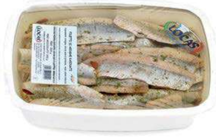
MAR900 LOCAS FIL. ARINGA MARINATA X 2