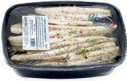
MAR800 LOCAS FIL. SGOMBO MARINATO X 2 KG.