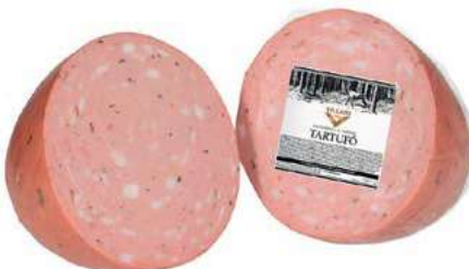
MOT200 MORTADELLA AL TARTUFO 1/2