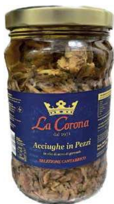
ACC150 FILETTI ACCIUGA PEZZI ML 1700