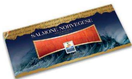
SLM500 SALMONE PREF. NORV. KG 1