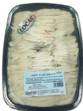
MAR620 FIL. ALICI MARINATE VASCA X 1 KG.