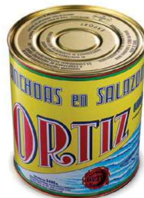
ACC600 ACC. SPAGNA KG 10 ORTIZ (9 P)