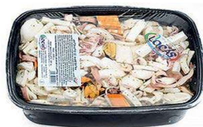
MAR200 LOCAS ANTIP.MARE VASCA X 2 KG EX