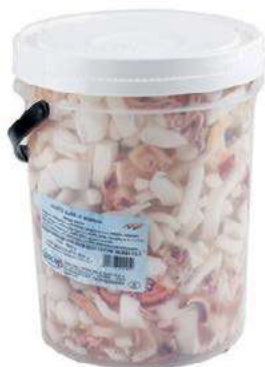
MAR110 LOCAS MISTO MARE S.C. NAT. X 3 KG SGOCC.