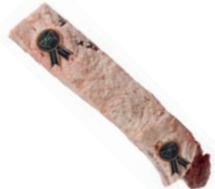
VIT281 LOMBATA SCOTTONA "LA NOBILE" APPESSA 18/22 KG