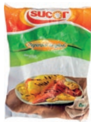
VER310 PEPERONI GRIGLIATI CONG.