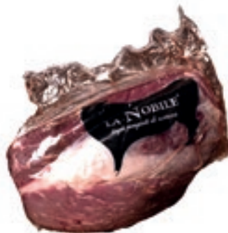
VIT460 FILETTO TESTA SCOTTONA "LA NOBILE"