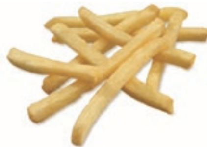
PAT100 PATATE STEALTH FRIES 9 X 9 KG 2.5