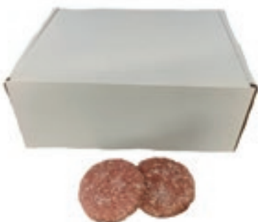
HAM620 HAMBURGER RISTOR. B.A. GELO 100 GR 12 PZ