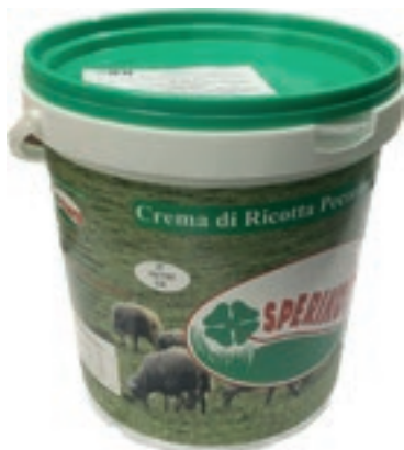
RIC500 CREMA DI RICOTTA ZUCCHERATA CONG.DA KG 6