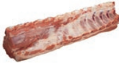
VIT260 LOMBATA ALTERNATIVA OLANDESE