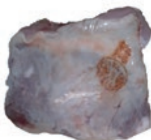
VIT815 SOTTOFESA DI VITELLA DA LATTE OLANDA