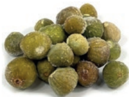
FRU200 FICHI BIANCHI CONG.