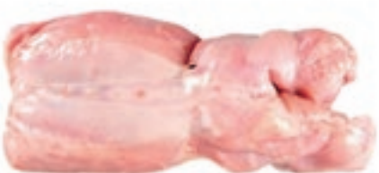
CON200 CONIGLIO DISSOSSATO CONG.