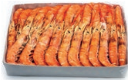
CPE220 GAMBERI ARGENT. L2 C/B KG 2 20/30