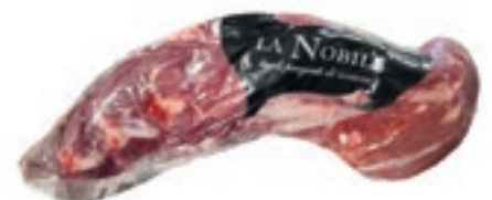
VIT465 FILETTO B.A. SCOTTONA LA NOBILE INTERO SV