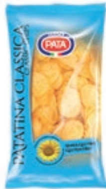
FRS685 PATATINA CLASSICA GR 300