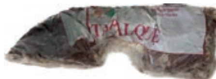
LEP100 LEPRE ARGENT. S/PELLE CONG.