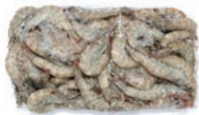
CPE235 MAZZANCOLLA INT. 40/50 GR 900