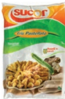
VER960 TRIS PASTELLATO