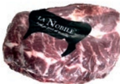
VIT730 CHUCK ROLL B.A. SCOTTONA LA NOBILE