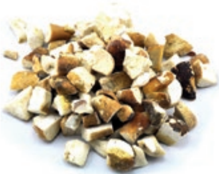
POR410 PORCINO CUBO B CONG. CT