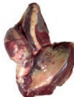
VIT785 BRIONE DI SPALLA