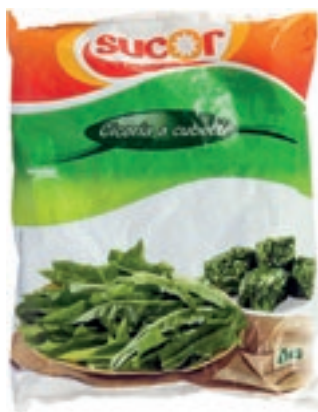
VER730 CICORIA CONG.