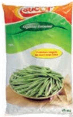
VER610 FAGIOLINI FINISSIMI CONG.