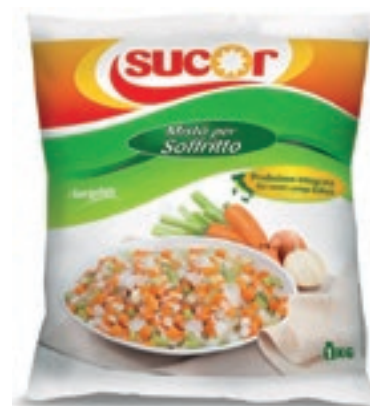
VER990 MISTO SOFFRITTO