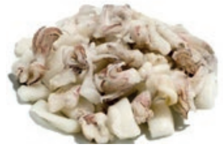
CPE300 ANELLI E CIUFFI CALAM. GR 850