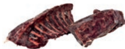
CEC115 LOMBATA C/O CERVO CONG. KG5 CON FILETTO