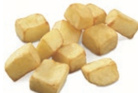
PAT200 PATATE CHEF TRAD.CUBES-CUBETTI KG 2.5