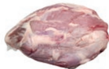
VIT870 CAMPANELLO DI VITELLA DA LATTE OLANDA