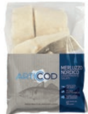
CPE150 MERLUZZO NORDICO 180/220 KG 1 CONG