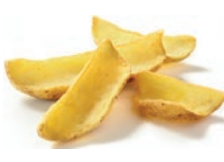
PAT400 PATATE DIPPERS - SKIN-ON KG 2.5