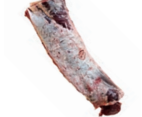
VIT210 LOMBATA VITELLONE 8 COSTE FR