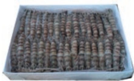
CPE237 MAZZANCOLLA INT. 40/50 GR 800