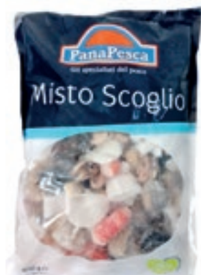
CPE710 MISTO SCOGLIO DEL PESCATORE GR 800