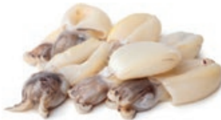
CPE475 SEPIA IND 8/12 IQF GR 750