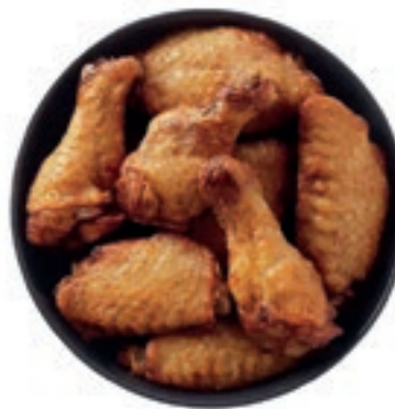
PIU125 POLLO ALETTE BBQ KG1 MC