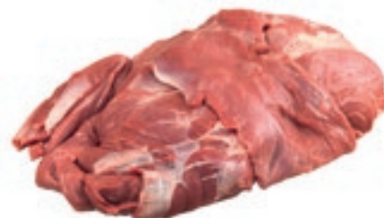
CIC300 CINGHIALE POLPA EXTRA CONG.