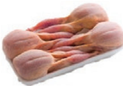
PIU600 QUAGLIE BUSTO CONG.