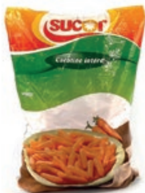
VER100 CAROTINE BABY CONG.