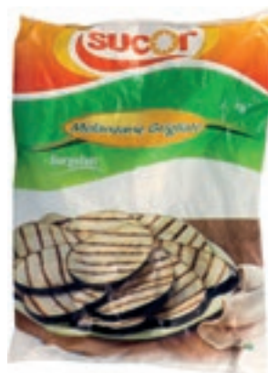
VER300 MELANZANE GRIGLIATE CONG.