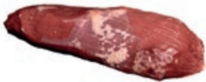
VIT470 MAGATELLO SCOTTONA "LA NOBILE"