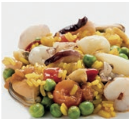
CPE705 PAELLA KG 1