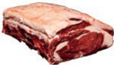
VIT420 ENTRECOTE B.A. SCOTTONA LA NOBILE CON OSSO (4COSTE) SV