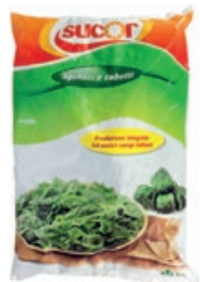
VER710 SPINACI CUBO CONG.