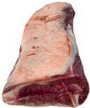
VIT270 STRIPLOIN DANIMARCA