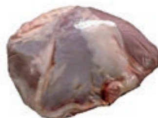
VIT820 SCAMONE DI VITELLA DA LATTE OLANDA