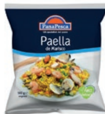
CPE706 PAELLA 6X900