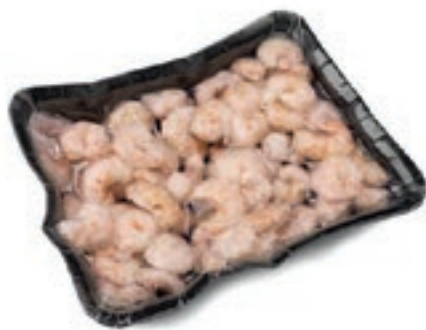
CPE205 GAMBERO SGUSCIATO 50/70 GR 750