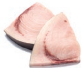
CPE660 PESCE SPADA TRANCI KG 6 MEZZA LUNA 250/400