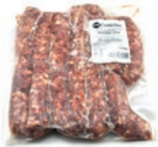
CIC600 CINGHIALE SALSICCIA CONG. KG 1 C.A