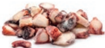
CPE375 TENTACOLI TOTANO COTTI GR 800