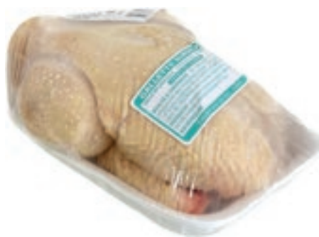
PIU510 GALLETTO GR 350/400 CONG.