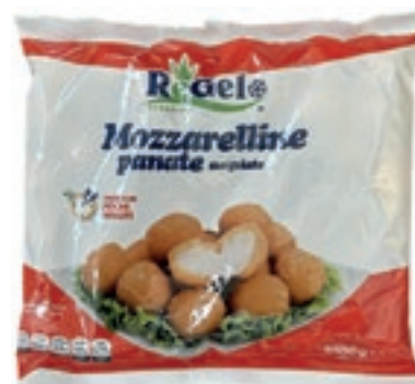
VER000 MOZZARELLE PANATE CONG.