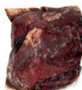
CEC205 POLPA EXTRA CERVO CONG. KG 2,5