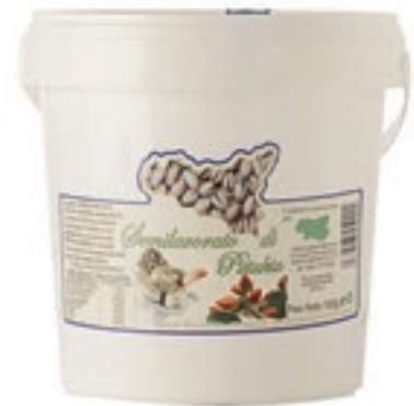
PIS100 PASTA PURA PISTACCHIO KG 1