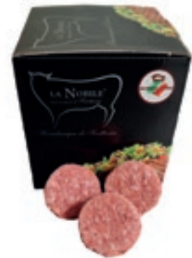
HAM610 MINIBURGER CONG.SCOTT."LA NOBILE" 20PZ