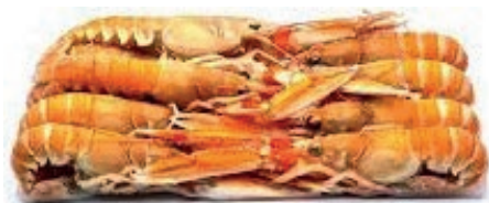
CPE260 SCAMPI 8/12 6X700