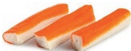
CPE750 BASTONCINI SURIN. GRANCHIO 500 GR