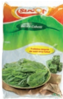
VER720 BIETOLA CUBO CONG.