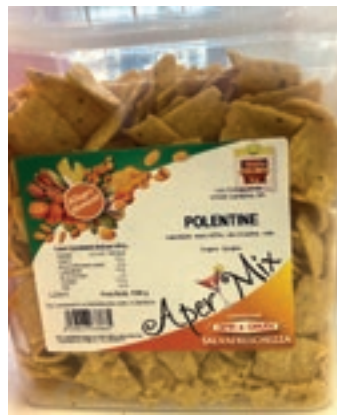
FRS660 POLENTINE CHIPS KG 1