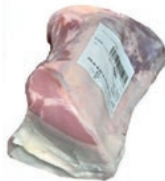
VIT805 CARRE DI VITELLA DA LATTE OLANDA 8 COST