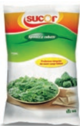
VER715 SPINACI FOGLIA CONG.