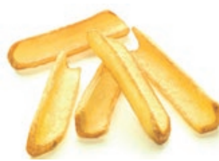
PAT500 PATATE RUSTIC FRIES SKIN-ON KG 2.5