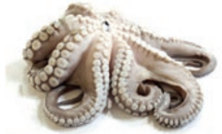
CPE410 POLPO M. 1000/2000 VASCH. (KG 14 CA) PP