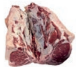
VIT410 T-BONE SCOTTONA "LA NOBILE" S/V MAREZZATO