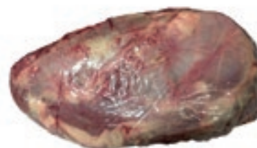
VIT770 SODO DI SPALLA