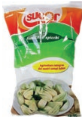
VER550 FINOCCHI CONG.