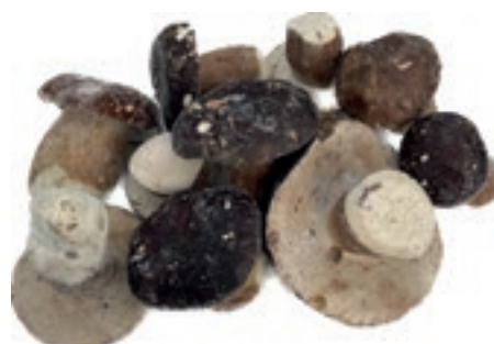
POR100 PORCINO INT. CT G. ROSSI CONG.