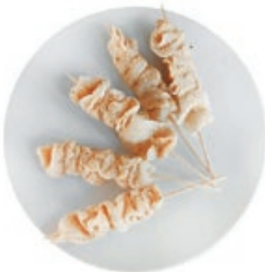
CPE340 SPIEDINO CALAMARI/GAMBERI SGUSC. KG6