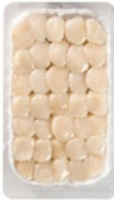
CPE031 CAPPESANTE ATLANTICHE SGUSC8/12UK10X600P