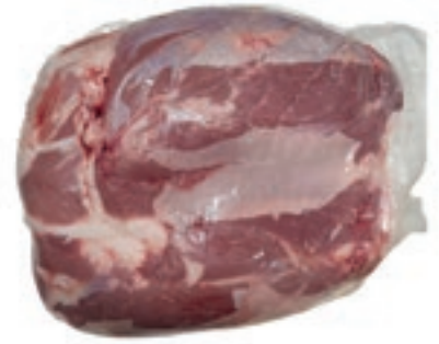
VIT130 NOCE A PALLA SV SCOTTONA