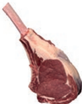
VIT450 TOMAHAWK SCOTTONA "LA NOBILE" SV