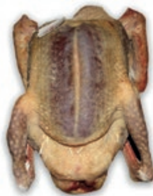
PIU500 PICCIONE INTERO CONG.