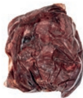
CAC102 POLPA EXTRA CAPRIOLO CONG. KG.2,5