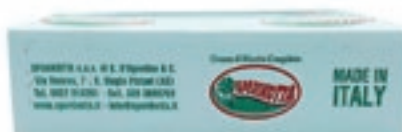
RIC500 CREMA DI RICOTTA ZUCCHERATA CONG.DA KG 6