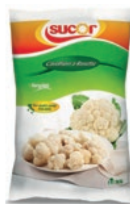
VER810 CAVOLFIORE CONG.