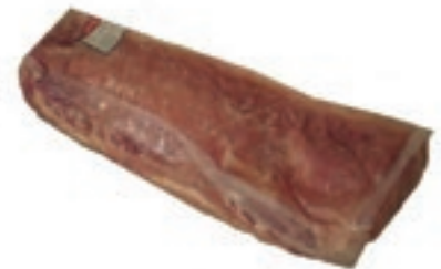
MAI400 SUINO LONZA SPAGNA CONG.