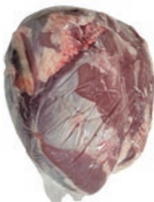
VIT910 NOCE A PALLA SV VITELLONE