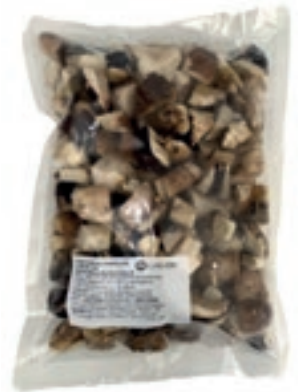
POR407 PORCINO CUBO MK KG 1 ROSSI CONG.