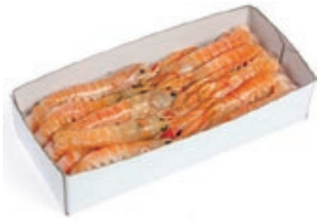
CPE280 SCAMPI 17/20 DANIMARCA GR 750