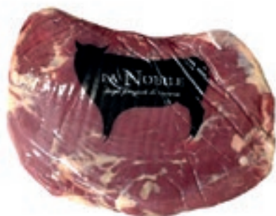
VIT700 BAVETTA B.A. SCOTTONA LA NOBILE