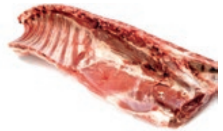
AGN110 AGNELLO CARRE NZ CONG.