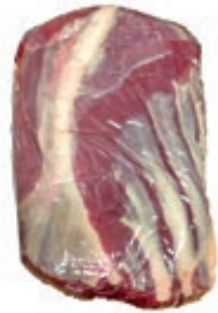
VIT265 CUBEROLL B.A. S/V