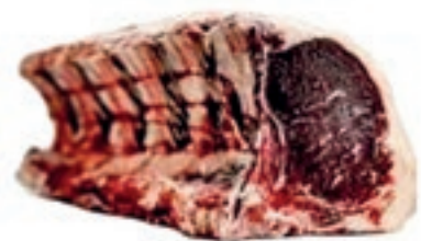
VIT288 LOMBATA SCOTTONA AUSTRIA FEMMINA 20/24 KG