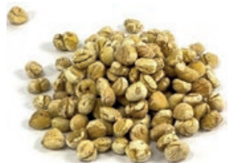
FRU100 CASTAGNE DEPIL. CONG.