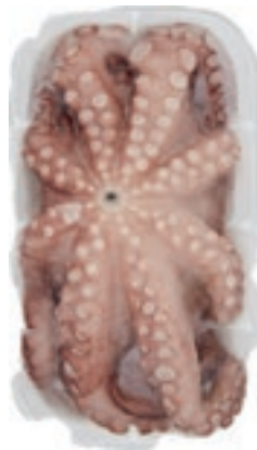
CPE420 POLPI M. 1 KG VASCH. (KG 8) PP