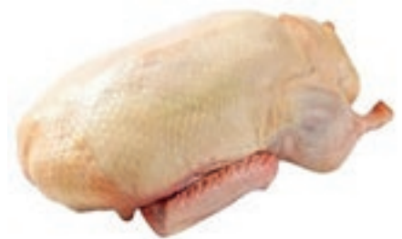
PIU200 ANATRA BUSTO KG 2 CONG.