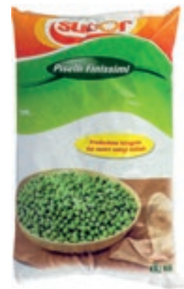
VER600 PISELLI FINISSIMI CONG.