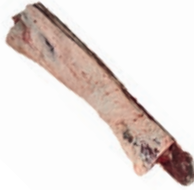
VIT272 LOMBATA SCOTTONA SLAVA FEMMINA 17/18 KG