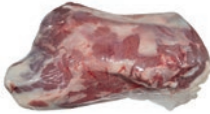
VIT120 SOTTOFESA SQUADRATA SV SCOTTONA