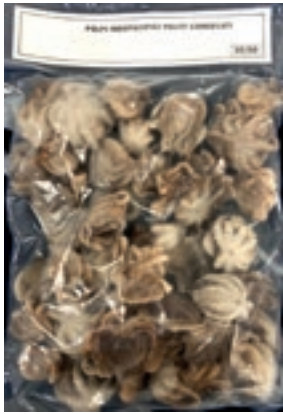
CPE407 POLIPETTI 30/60 IQF GR 800