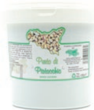
PIS120 PESTO DI PISTACCHIO KG 1