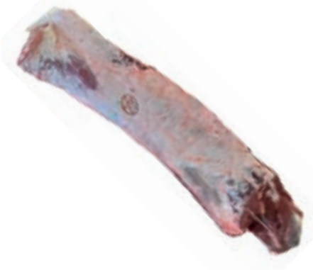
VIT203 LOMBATA SPAGNA ARRIVO 25/30 KG