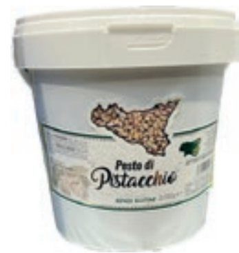
PIS130 PESTO DI PISTACCHIO GR 90