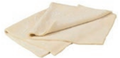
PAS997 PASTA SFOGLIA STESA KG 1 CONG.