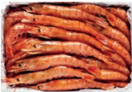
CPE210 GAMBERI ARGENT. L1 C/B KG 2 10/20