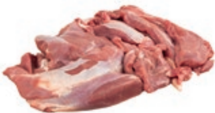
CAC100 CAPRIOLO POLPA 5 KG CONG.