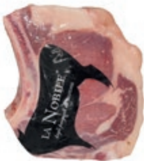
VIT310 COSTATE B.A. SCOTTONA LA NOBILE SV