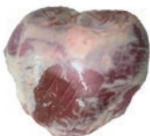
VIT810 FESA DI VITELLA DA LATTE OLANDA