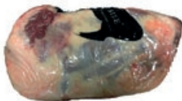
VIT765 PALETTA DI SPALLA B.A. SCOTTONA LA NOBILE