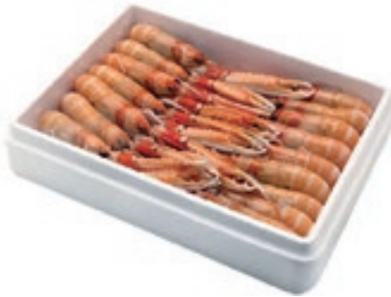
CPE285 SCAMPI 31/40 DANIMARCA GR 750