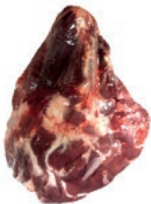
VIT790 MUSCOLO DI SPALLA