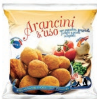
PAT990 ARANCINI 10X500 GR ALPE