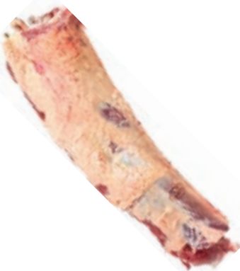
VIT282 LOMBATA SCOTTONA SLOVENIA FEMMINA 18/22 KG