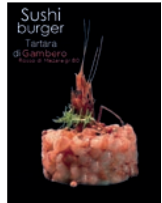
TRT700 TARTARA DI GAMBERO ROSSO DI MAZARA 80GR