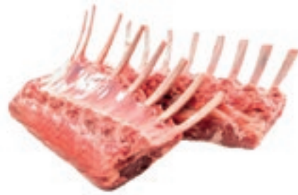
AGN100 AGNELLO CARRE SCALZATO CONG.