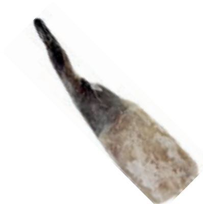
CPE640 CODA RANA PESC 300/500 KG 8