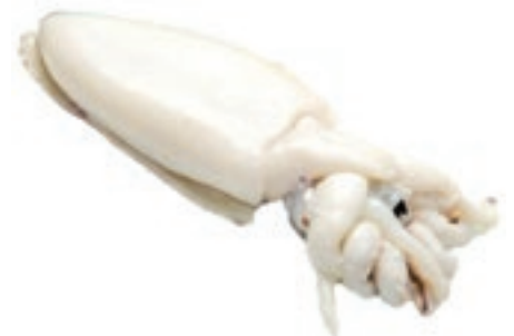
CPE465 SEPIA INDIA U/1 IFQ 20% KG 8