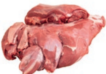
CEC200 CERVO POLPA SCELTA CONG.