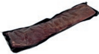
CEC110 LOMBO DI CERVO S/O CONG