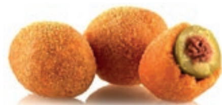
VER010 OLIVA ASCOLANA CONG.