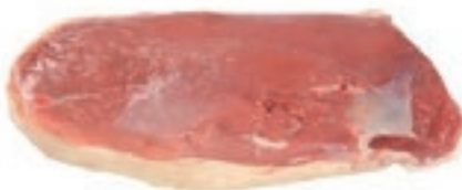
PIU420 OCA FILETTO S/O S/PELLE CONG.