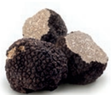
FUN100 TARTUFO ESTIVO CONG.Tuber Aestivum (Pr. UE)