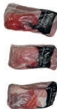
VIT740 RIBS B.A. SCOTTONA LA NOBILE