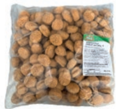
PIU135 PREP.POLLO CROCCHETTE/ NUGGETS FILENI KG3