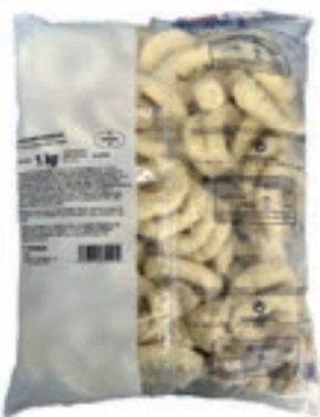
VER977 FRITTO MARE PASTELLATO PANA 6X1 KG BUSTA