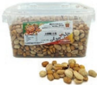
FRS650 MISTO TOSTATO SALATO