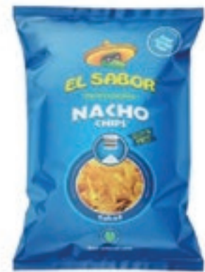
FRS670 NACHOS NATURALI GR 425