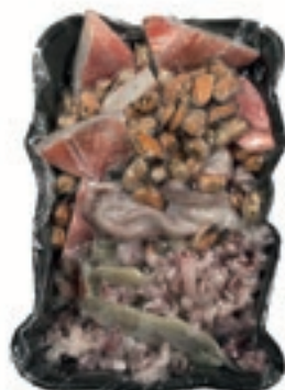
CPE715 ZUPPA DI PESCE PANA 9X800GR VASSOIO SV