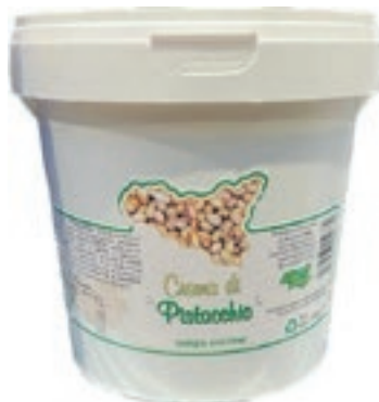
PIS110 CREMA DI PISTACCHIO KG 1