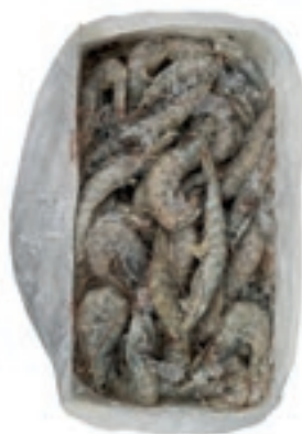
CPE236 MAZZANCOLLA ECUAD. 40/50 KG 1.8