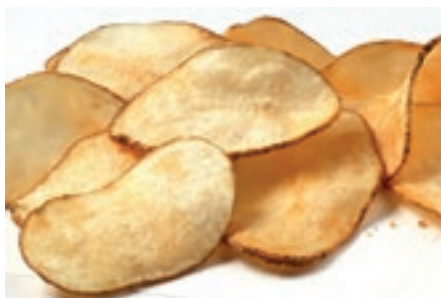
PAT600 SFOGLIE DI PATATE KG 2