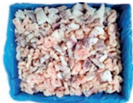
CPE735 FRITTO MISTO PESCE KG 5 AL NATURALE