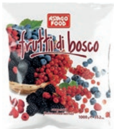
FRU300 FRUTTI BOSCO CONG. KG 1