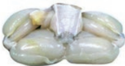
CPE900 RANE COSCE 46/60 KG 1 CONG.