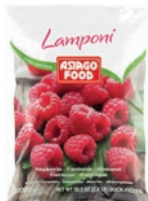
FRU600 LAMPONI CONG. KG.1