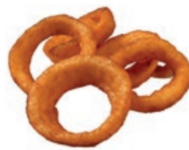
PAT900 CRISPY ONION RINGS KG 1