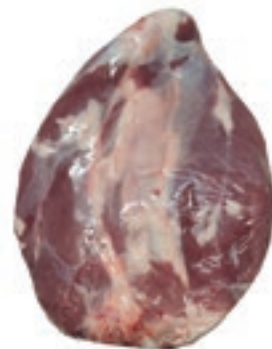
VIT950 CAMPANELLO S/V VITELLONE