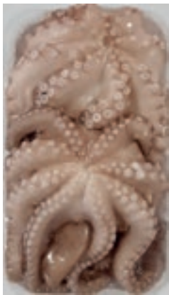
CPE415 POLPI M.500/1000 VASCH.(14 KG CA) PVN