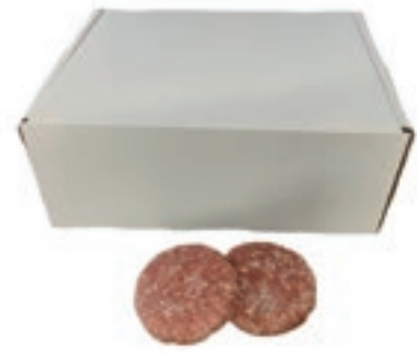
HAM640 HAMBURGER CATERING B.A. GELO 110GR-10