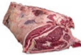
VIT297 LOMBATA VACCA DK GRASSO 3/4+MAREZZATA