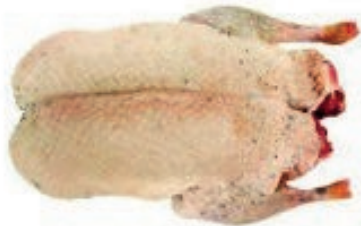
PIU800 GERMANO SPIUMATO 700/800 CONG.