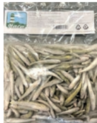
CPE745 LATTERINI IQF 10 X 1000