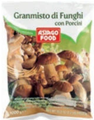
FUN200 FUNGHI GRANMISTO CONG. KG 1