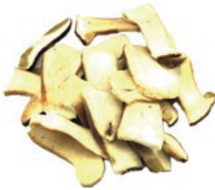
POR310 PORCINO LAMINA 2° CONG. CT