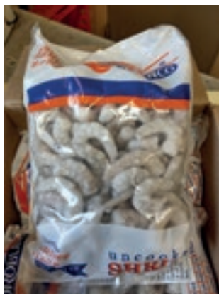
CPE246 MAZZANCOLLE TROPICALI SGUSC. 41/50 GR 1000