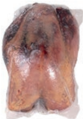
PIU710 FAGIANO PETTO CONG.