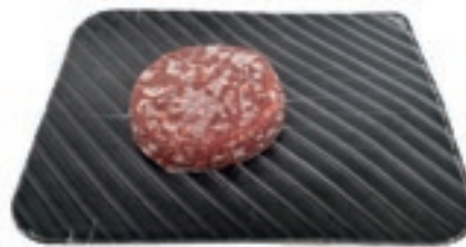
TRT300 TARTARE SCOTTONA POLACCA GR160X10PZ CONG