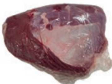
VIT970 PUNTE DI SOTTOFESE SV VITELLONE