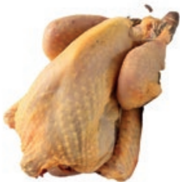
PIU300 FARAONA BUSTO CONG.