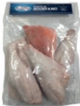
CPE040 SCORFANO ATLANTICO FILETTI C/P C80/250