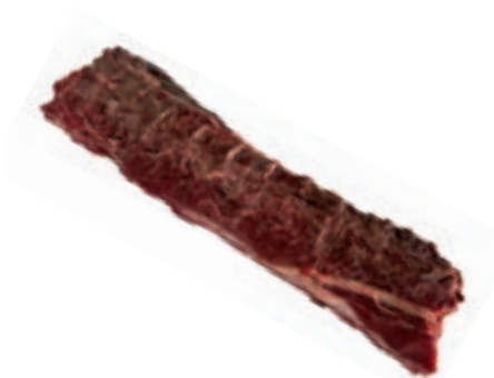
CIC410 LOMBATA C/O CINGHIALE CONG. KG 3