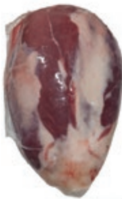
VIT150 CAMPANELLO S/V SCOTTONA