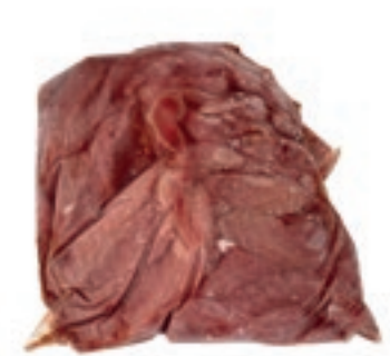
PIU220 ANATRA CARNETTA (FILETTINI PETTO) CONG.