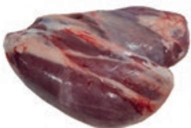
VIT960 MUSCOLO S/O VITELLONE