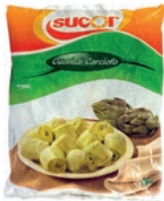
VER510 CARCIOFI A SPICCHI CONG.