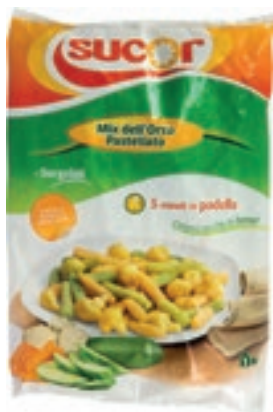
VER950 MIX PASTELLATO