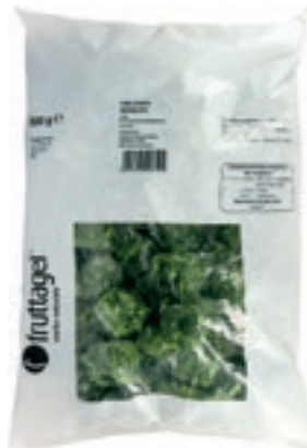
VER700 CIME DI RAPA CUBI CONG.