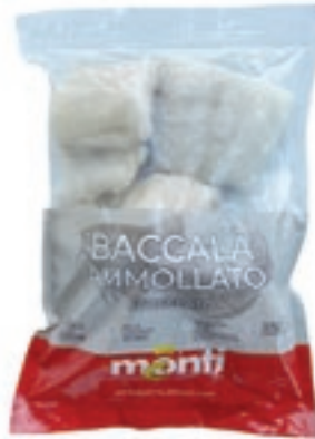
CPE110 BACCALA PORZ.180/220 KG 1 CONG.