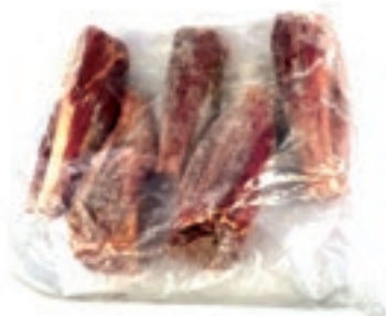
CEC400 CERVO STINCO C/OSSO CONG.