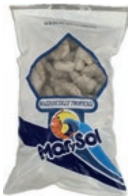
CPE245 MAZZANCOLLE TROPICALI SGUSC. 41/50 GR 750