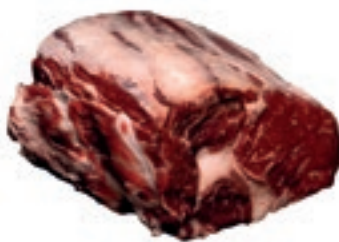
VIT510 CUBE ROLL SCOTTONA "LA NOBILE"