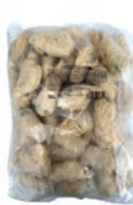
VER970 FIORI DI ZUCCA ALLE ALICI PAST 2X2,5 KG