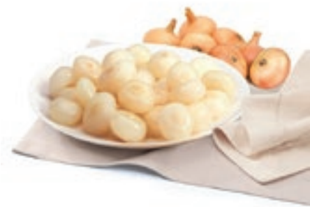
VER320 CIPOLLE BORRETTANE CONG.