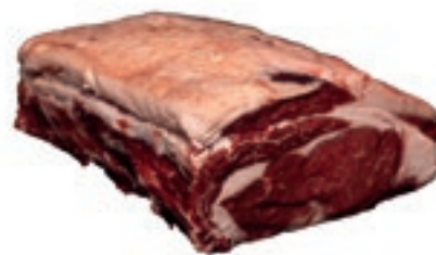
VIT520 ENTRECOTE SCOTTONA "LA NOBILE"