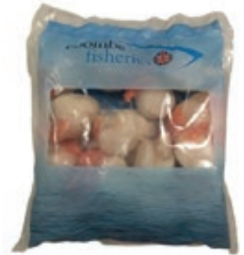
CPE030 CAPPESANTE ATLANTIC. SGUSC 8/12UK10X600PP