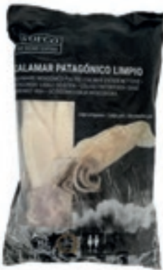
CPE310 CALAMARO PATAG. PUL. GR 900