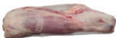
VIT850 MUSCOLO VITELLA DA LATTE OLANDA INTEGRAL