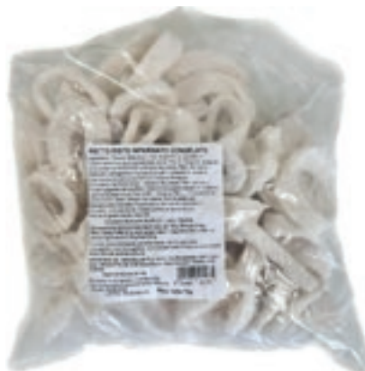
CPE740 FRITTO MISTO INFAR. KG 1