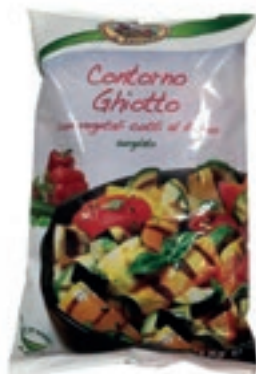
VER985 CONTORNO GHIOTTO SURVEL 6X1