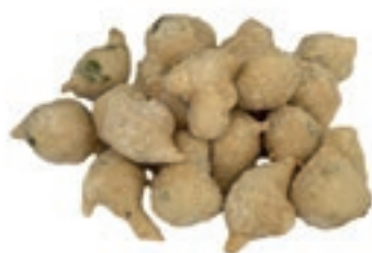
VER980 SALATI FRITTELLE/ALGHE KG.5