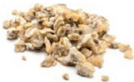
CPE810 VONGOLA PAC. VIET. S/G 700/1000 GR 800