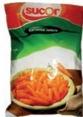
VER110 CAROTE DISCO CONG.