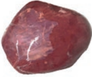
VIT115 FESA SENZA COPERTINA SV SCOTTONA