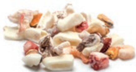
CPE700 INSALATA DI MARE SENZA SURIMI 12X800