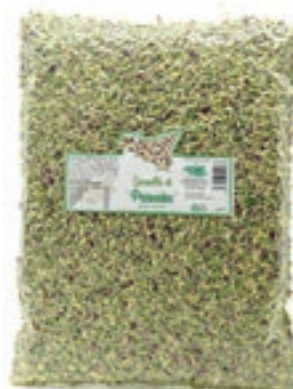
PIS210 GRANELLA DI PISTACCHIO KG 1