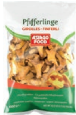
FUN300 FUNGHI GALLETTI/FINFERLI CONG.