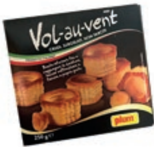
PIZ500 VOL AU VENT 250G 10X250GR PLUM