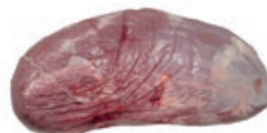
VIT920 MAGATELLO (GIRELLO) PAD SV VITELLONE