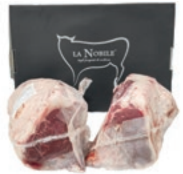
VIT300 LOMBATA SCOTTONA "LA NOBILE" A META S/V