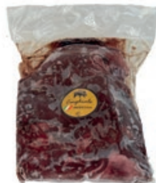
CIC505 POLPA SCELTA CINGHIALE CONG. KG 2,5