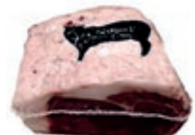
VIT440 RIB EYE SCOTTONA "LA NOBILE" SV