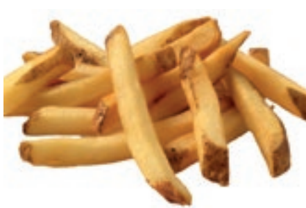
PAT115 PATATE PRIVATE R. 9 X 9 BUCCIA KG 2.5