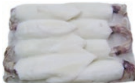
CPE320 CALAMARO PAC THAIL PUL U/5 KG 1.4