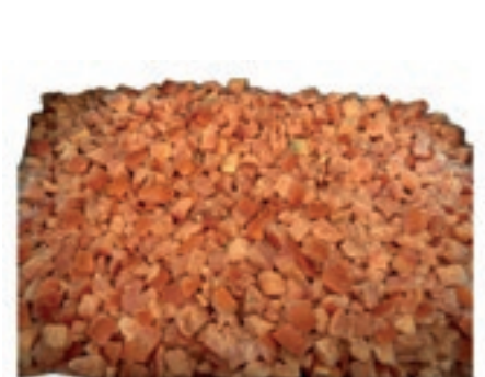
VER725 POMODORI A CUBETTI SURG1X10 KG FRUTTAGEL