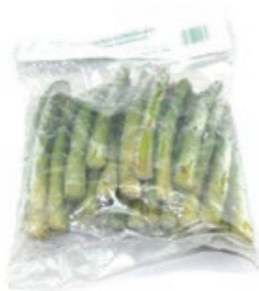
VER400 ASPARAGI 17/22 KG 1 CONG.