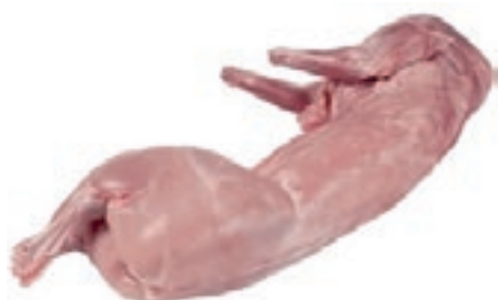
CON100 CONIGLIO INTERO CONG.