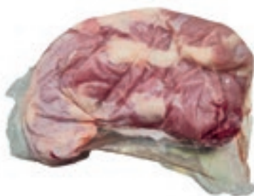
VIT860 SPINACINO DI VITELLA DA LATTE OLANDA