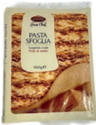
PAS995 PASTA SFOGLIA CONG.