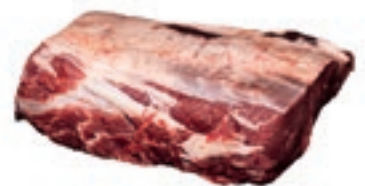
VIT240 CONTROFILETTO B.A.S/V