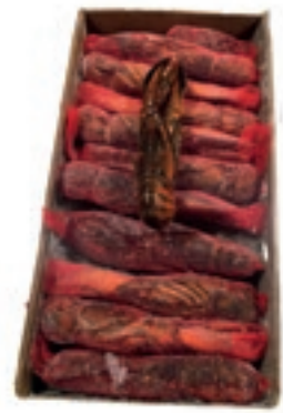
CPE050 ASTICE 350/400