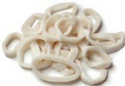
CPE365 ANELLI TOTANO ATL IQF GR 800 MAR FRIO