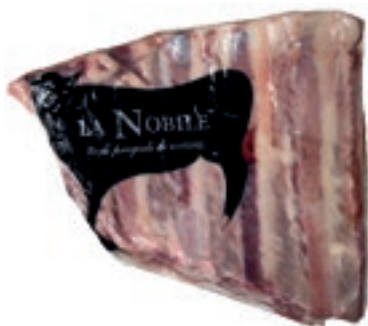
VIT750 ASADO B.A. SCOTTONA LA NOBILE