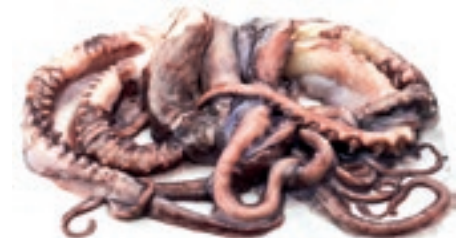
CPE370 TENTACOLI TOT. GIG. PAC. 35/40 IQF KG 5