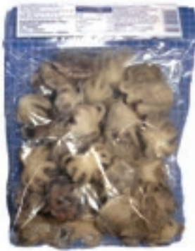
CPE408 POLIPETTI 40/60 GR 750