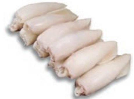
CPE335 CALAMARO U/10 GR 700