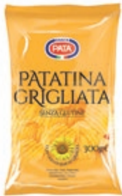
FRS680 PATATINA GRIGLIATA GR 300