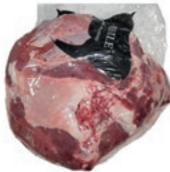
VIT430 MAGRO SCAMONE SCOTTONA "LA NOBILE"