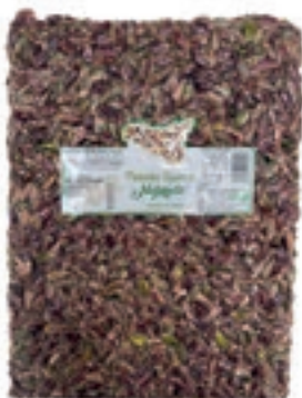
PIS200 PISTACCHI SGUSCIATI KG 1