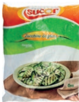
VER210 ZUCCHINE GRIGLIATE CONG.