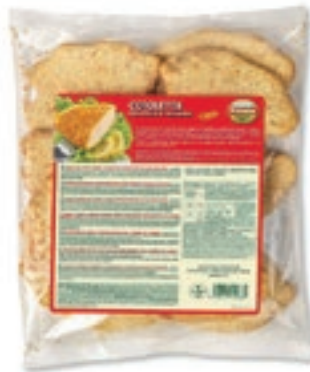
PIU130 PREP.POLLO COTOLAIA GR.100 4 X1 KG G.P.