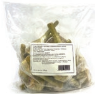
VER500 CARCIOFI INTERI C/G CONG.