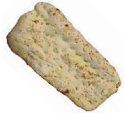
PIZ210 SCHIACCIATA TOSCANA GR.1000