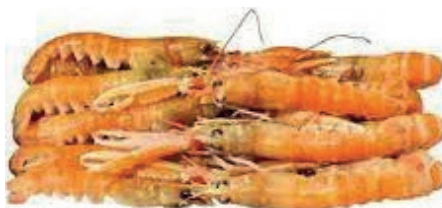
CPE270 SCAMPI 13/16 DANIMARCA GR 700