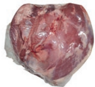
VIT110 FESA SV SCOTTONA