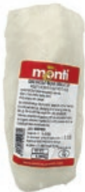
CPE100 BACCALA CUORE AMMOLL. 400/600 KG 2,5 CONG.