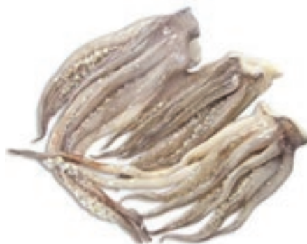
CPE380 CIUFFI TOTANO ATLANTICO IQF KG 4,250