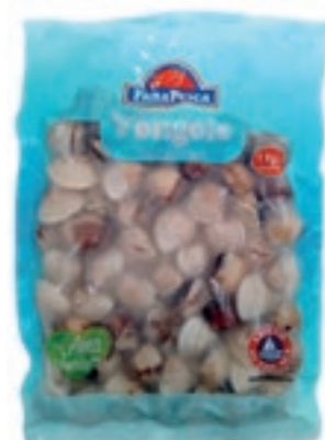
CPE800 VONGOLA PAC. VIET. C/G 60/80 KG 1