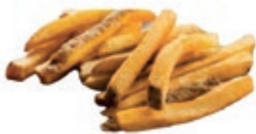
PAT090 PATATE 11X11 KG 2,5X4