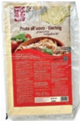
PAS985 PASTA SFOGLIA ALL'UOVO PER LASAGNE CONG.