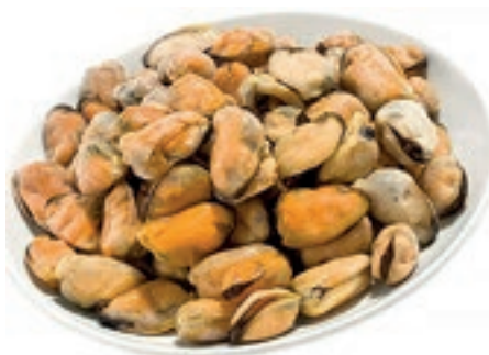
CPE870 COZZA SGUSCIATA CILE IQF KG 1