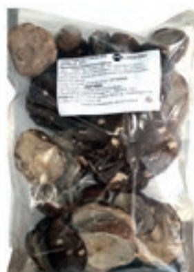
POR205 PORCINO CAPPE KG 1 ROSSI CONG.