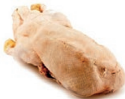
PIU400 OCA BUSTO KG. 4/5 CONG.