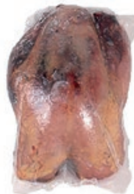
PIU700 FAGIANO BUSTO SPIUMATO CONG.