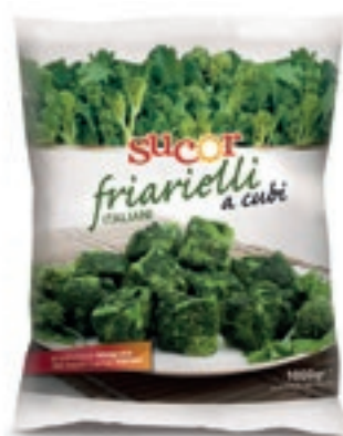
VER820 FRIARELLI CUBI CONG.