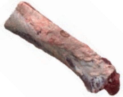
VIT274 LOMBATA SCOTTONA SPAGNA FEMMINA 18/21 KG