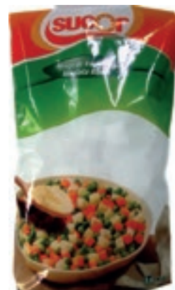
VER910 INSALATA RUSSA CONG.