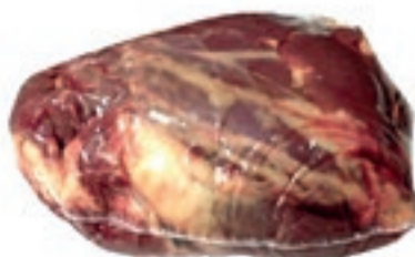
VIT780 ALETTE DI SPALLA