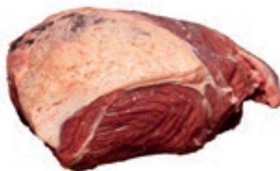
VIT230 LOMBATA SCOTTONA "LA NOBILE" 7/8COSTE SV