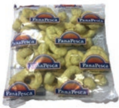
VER975 FRITTO MARE PAST. PANA10X500 GR *BUSTA