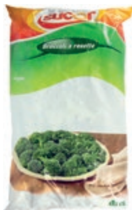
VER800 BROCCOLI CONG.