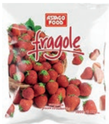
FRU700 FRAGOLE cong. KG.1