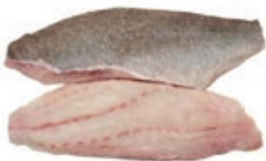
CPE620 CERNIA FILETTI 4/6 (110/170) 10X800