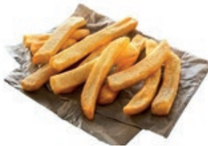
PAT095 PATATE 9X18 STEAKHOUSE KG 2,5X4