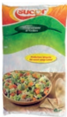
VER900 MINISTRONE 14 VERDURE CONG.