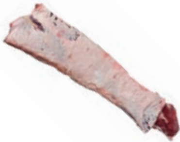
VIT250 LOMBATA DK