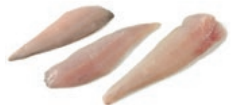
CPE610 GALLINELLA FILETTO 150/200 10x800