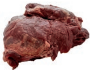
CIC305 POLPA EXTRA CINGHIALE CONG. KG 2,5