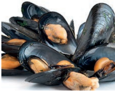
CPE860 COZZA CILENA C/G 40/60 KG 1