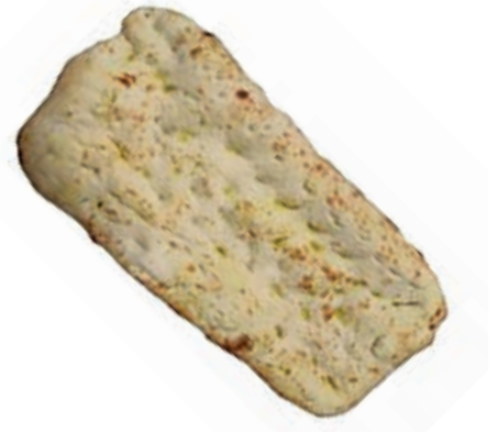
PIZ210 SCHIACCIATA TOSCANA GR.1000