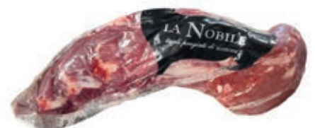
VIT465 FILETTO B.A. SCOTTONA LA NOBILE INTERO SV