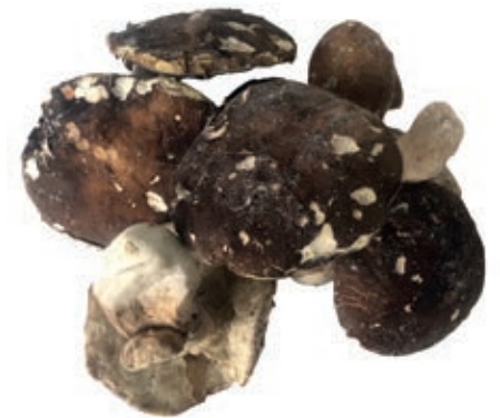
POR120 PORCINO INT. COMMERCIALE CONG. CT