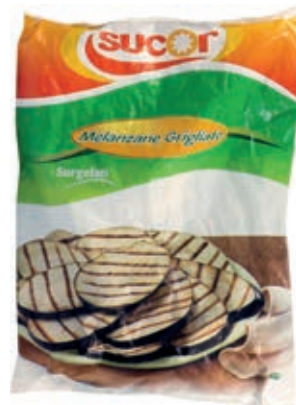
VER300 MELANZANE GRIGLIATE CONG.