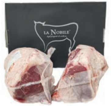
VIT300 LOMBATA SCOTTONA "LA NOBILE" A META S/V