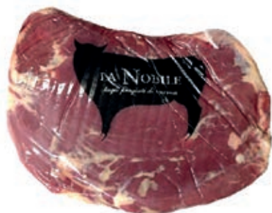
VIT700 BAVETTA B.A. SCOTTONA LA NOBILE