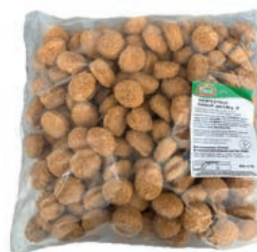
PIU135 PREP.POLLO CROCCHETTE/ NUGGETS FILENI KG3