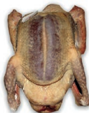
PIU500 PICCIONE INTERO CONG.