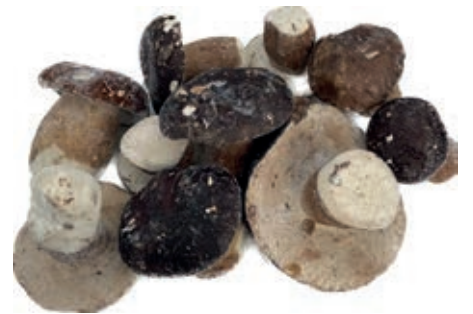
POR100 PORCINO INT. CT G. ROSSI CONG.