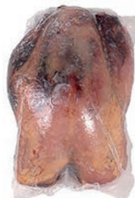
PIU700 FAGIANO BUSTO SPIUMATO CONG.