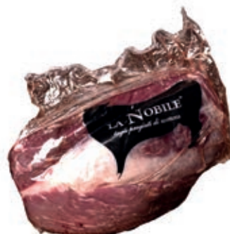
VIT460 FILETTO TESTA SCOTTONA "LA NOBILE"