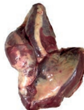
VIT785 BRIONE DI SPALLA