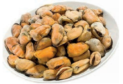
CPE870 COZZA SGUSCIATA CILE IQF KG 1