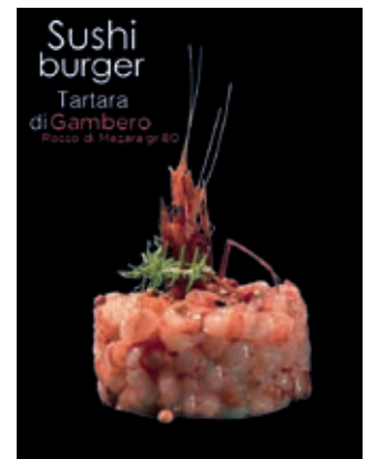
TRT700 TARTARA DI GAMBERO ROSSO DI MAZARA 80GR