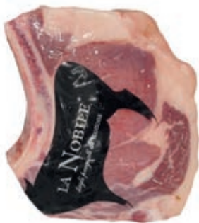
VIT310 COSTATE B.A. SCOTTONA LA NOBILE SV