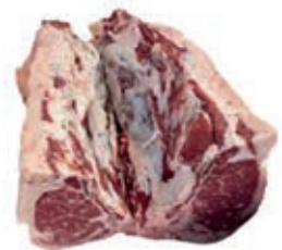
VIT410 T-BONE SCOTTONA "LA NOBILE" S/V MAREZZATO