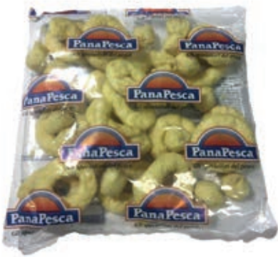
VER975 FRITTO MARE PAST. PANA10X500 GR *BUSTA