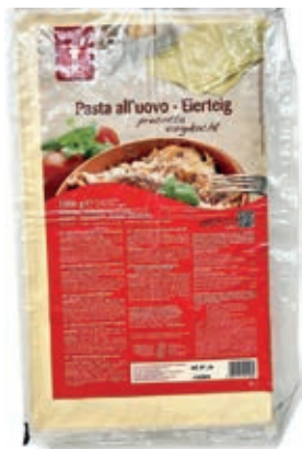
PAS985 PASTA SFOGLIA ALL'UOVO PER LASAGNE CONG.