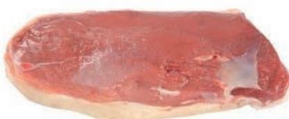
PIU420 OCA FILETTO S/O S/PELLE CONG.