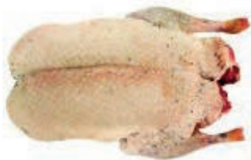
PIU800 GERMANO SPIUMATO 700/800 CONG.