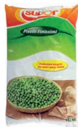
VER600 PISELLI FINISSIMI CONG.