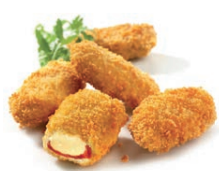
PAT940 RED HOT JALAPENOS KG 1