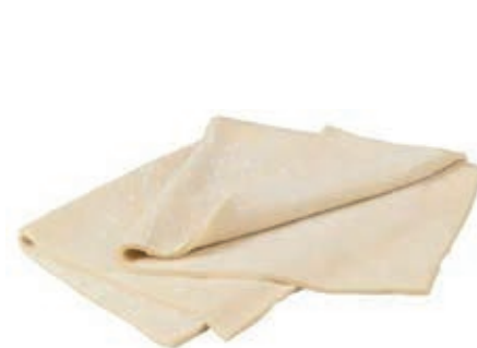
PAS997 PASTA SFOGLIA STESA KG 1 CONG.