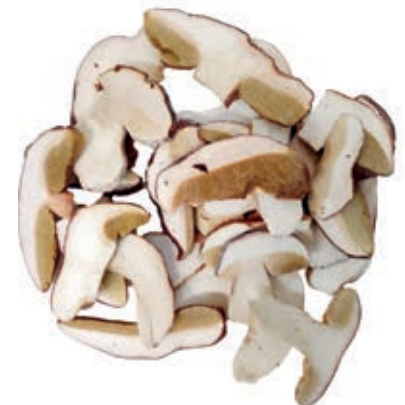
POR300 PORCINO LAMINA CT ROSSI CONG.