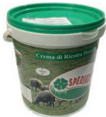
RIC500 CREMA DI RICOTTA ZUCCHERATA CONG.DA KG 6