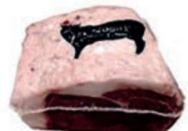
VIT440 RIB EYE SCOTTONA "LA NOBILE" SV