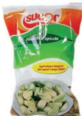
VER550 FINOCCHI CONG.