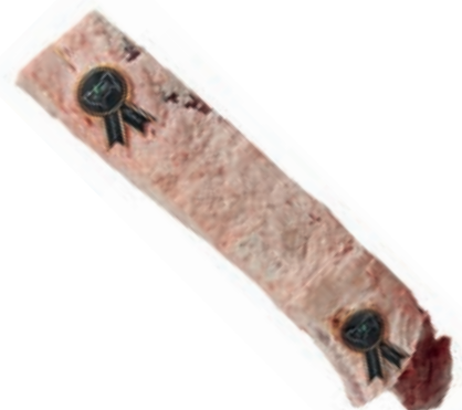
VIT281 LOMBATA SCOTTONA "LA NOBILE" APPESSA 18/22 KG