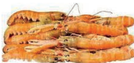
CPE270 SCAMPI 13/16 DANIMARCA GR 700