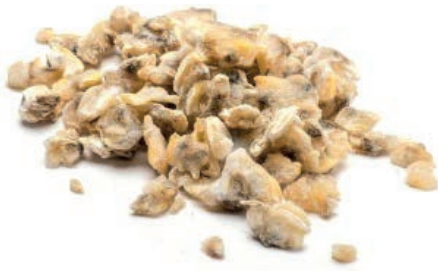
CPE810 VONGOLA PAC. VIET. S/G 700/1000 GR 800