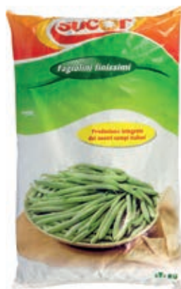
VER610 FAGIOLINI FINISSIMI CONG.