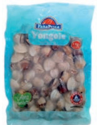
CPE800 VONGOLA PAC. VIET. C/G 60/80 KG 1